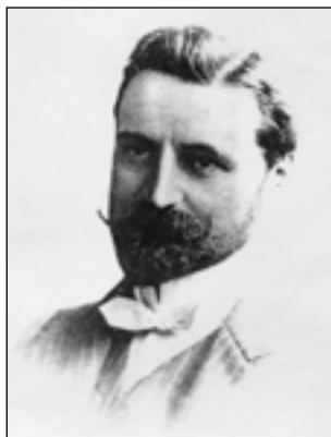
Князь С.М. Волконский

Но не только мировоззрением и широкой образованностью отличался Волконский от большинства представителей русской знати. Ему всегда хотелось делать что-то, на его взгляд, важное и полезное для