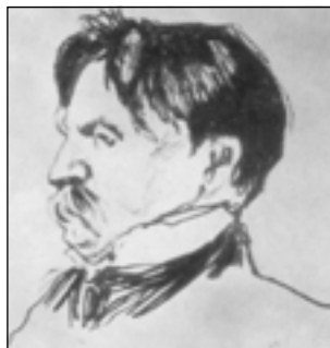
А. Бенуа. Иннокентий Анненский. 1909