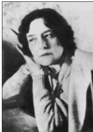
З.Н. Гиппиус. 1930-е годы

Почему же факт такой дальнейшей истории снова стал обсуждаться в конце 50-х? Эмигранты внимательно следили за происходящим в России, надеялись, что скоро «Никита откроет церкви». Какой будет эта новая русская церковь? Связи с прошлым возникали сами собой. В 1961 году в сборнике «Мосты» были опубликованы написанные тридцатью годами раньше воспоминания Гиппиус, в которых она утверждала, что «если бы вопросы, с такой остротой поставленные в собраниях, были в то