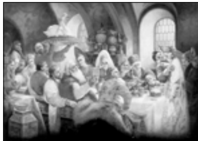
К.Е. Маковский. Боярский свадебный пир

работу вполне можно было бы принять «за какого-нибудь Будена», и высказал сожаление, что отец не пошел именно по этому пути. Но так или иначе, именно отец научил сына ценить и понимать разное искусство, не отвергать новизну, и в дальнейшем это умение замечать новое, поощрять нарождающиеся тенденции, отстаивать право молодых художников на собственное видение мира выдвинуло Сергея Маковского в число ведущих художественных критиков буквально с первых статей.