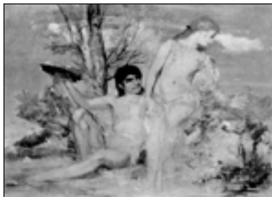
А. Беклин. Юноша и девушка среди цветов. 1866

Книга начинается очерком о немецком романтике Беклине, и этот выбор не случаен. Интерес к творчеству этого художника связывал