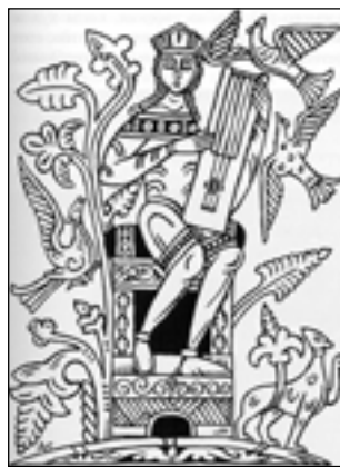
Д. Стеллецкий. Гуслир. Иллюстрация для «Аполлона». 1911