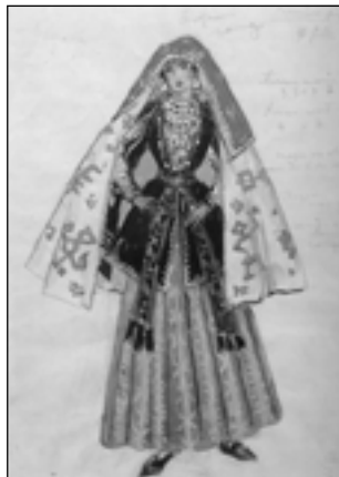
М. Добужинский. Эскиз костюма к балету «Кавказский пленник». 1951

Четвертью века раньше этой статьи Ф.Ф. Нотгафт выпустил уже в советской России книгу «Графика Добужинского». Это был наиболее полный вариант всего написанного Маковским на эту тему в журналах, монографиях и сборниках статей. Маковский очень любил именно графические работы художника и в очерке для «Парнаса» захотел еще раз рассказать о нем как о графике. Точно так же, как в той давней книге, Маковский начинает очерк с Петербурга своего детства и почти слившегося в памяти с Петербургом творчества Добужинского: