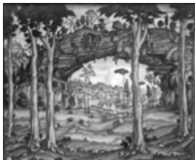
К.Ф. Богаевский. Итальянский пейзаж. 1911

От этого «преобладания манеры над непосредственным наблюдением» Маковский и призывает художника избавиться. В обзоре одной из вы-