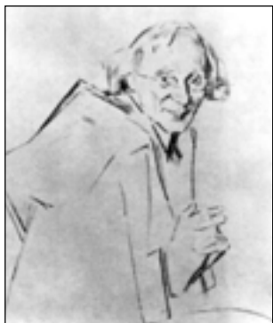
Н. Ульянов. Вячеслав Иванов. 1918