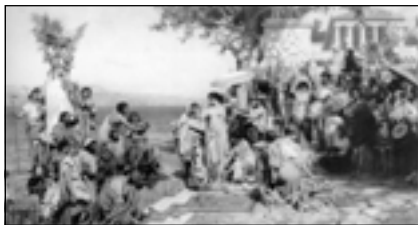
Г. Семирадский. Фрина на празднике Посейдона в Элевсине.

Но люди, ждавшие от искусства не только возможности сострадать несчастному, бедному, униженному, но просто Красоты, искали возможность заказать портрет у хорошего художника, увидеть картины, выполненные на заказ. Маковский, как сын художника, помнил такие моменты с детства, например, ему врезались в память обращенные к матери слова отца, которого