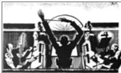
В. Милашевский. Заставка к книге Н. Евреинова «Что такое театр». 1921

Параллельно с этими новациями возрастает интерес и к театральной архаике — «к сценическим и бытовым формам лицедейства в прошлые века» 1 . Так начался театр барона Н.В. Дризена, давно мечтавшего о своем «театральном театре». Незадолго до этого камергер Дризен был назначен директором «Ежегодника императорских театров». Вокруг него сгруппировались испытанные ценители театра, молодые писатели, живописцы. На одном из та-