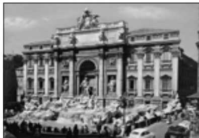
Рим. Фонтан Треви