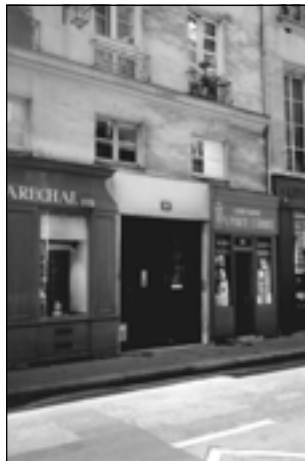
Дом в Париже, где Гумилев и Ахматова провели медовый месяц

вызывали в душе Маковского если не жажду тотчас же отправиться в путь, то, по крайней мере, воспоминания о прежних путешествиях, которыми он охотно делился с Гумилевым. Они рядом жили, в один год женились, Маковский навещал молодых Гумилевых в Париже на Бонпарте, 16, в июне все вместе вернулись в Петербург. В Царском Селе Гумилев часто заходил к Маковским и в октябре 1911 года посвятил Сергею Константиновичу знаменитое стихотворение, ставшее романсом сначала в исполнении А. Вертинского, а потом — Б. Гребенщикова.