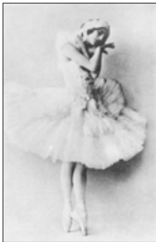
Анна Павлова в концертном номере «Лебедь» на музыку К. Сен-Санса. Костюм по эскизу Л. Бакста