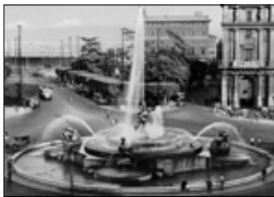
Рим. Фонтан наяд

Высоко оценил сборник «На пути земном» критик «Русской мысли» А. Шик. Он отметил, что «стихи Маковского всегда красивы, полны словесного очарования; язык его цветист, образен; рифмы и размеры разнообразны, богаты, напевны. Поэтому весело и радостно, когда «белеют ландышами травы», когда «закудрявился лес весенний», когда «осенняя лазурь спит глаза». Перечитывая стихи