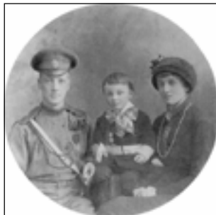
Анна Ахматова и Николай Гумилев с сыном Львом. 1915

В июне 1965 года Ахматова впервые вырвалась из-за «железного занавеса» на Запад, в Оксфорд, для участия в торжественной церемонии присуждения ей звания доктора honoris causa . Кто-то из русских эмигрантов пересказал ей статьи Маковского о Гумилеве, пересказал, очевидно, неточно и со смещением акцентов. Это огорчило Ахматову. «Ее ранило, что ее жизнь, как и жизнь Гумилева, была описана неверно и дурно, и она чувствовала, что это делает бессмыслицей их творчество . Для нее было особенно странным обнаружить в Америке людей, многие из которых не были в России