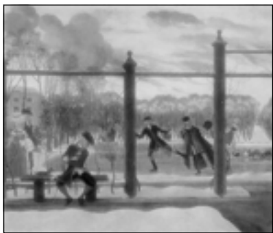
К. Сомов. Зима. Каток. 1915