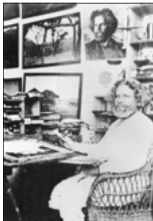
М.А. Волошин в своем кабинете в Коктебеле

Жизнь поэта после 1917 года интересовала многих. До эмигрантов доходили его стихи «Китеж», «Святая Русь», и Маковский вспоминает: «Как раз эти стихи и другие, только что написанные тогда, я слышал от самого Волошина, летом 1918 года в Ялте, когда чуть не пешком из Коктебеля прибыл он навестить друзей. Прямо с дороги весь запыленный, потный, со всклокоченными рыжеватыми кудрями и давно не стриженной