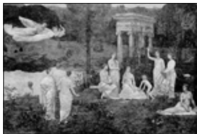
Пюви де Шаванн. Священная роща

вода южного моря у скалистых побережий. Картины Пювиса светят сказочно и смутно, как бледные, многоцветные опалы. Бен-Джон прозрачен и таинственно-нежен, как лунный камень. Творчество Бердслея — черный алмаз с тонко отшлифованными гранями, с острым холодным блеском, с загадочными мерцаниями преломленных лучей, — черный алмаз в филигранной оправе, восхищающий совершенством работы и, в то же время, наводящий жуткий трепет, словно талисман волшебника» 1 .