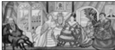
С.Ю. Судейкин. Смотряны

не признающего никакой преемственности» 1 . Об этом говорил и создатель графической модели журнала Лев Бакст, предсказавший кубизм задолго до его рождения.