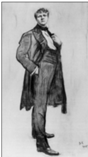
В. Серов. Портрет Ф. Шаляпина. 1905

в одном русско-французском семействе... с благотворительной целью» 1 .