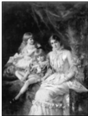
К.Е. Маковский. Семейный портрет

Раешники с шутками зазывали прохожих и, объясняя картинку, импровизировали свои смешные прибаутки. Конечно, гнусавил и Петрушка, выскакивая из-за пестрой ширмы, и я не мог оторвать глаз от его судорожных движений и ликовал, как и все кругом, когда он колотил своей дубинкой и полицейского, и черта, и всегда сам воскресал невредимым 1 .