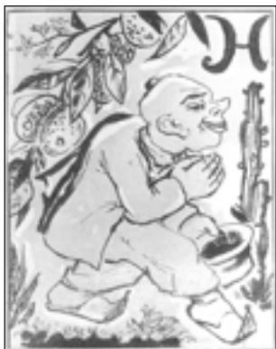
Н. Гончарова. Портрет-шарж А. Ремизова. 1940-е годы

Непосредственно на странице с «Сонетом» высказывает свое мнение и Игорь Чиннов: «Стихи 21 года, особенно если они появляются в 1953-м, были бы лучше без архаизирующих «длани», «вежды», «лону» и «уста». Тем более, что никакой иронии, никакого остранения — ничего. «Матернему лону» — все прочтут матерному, и это вызовет, предчувствую, некоторую веселость, вредную для книжки (и для «Рифмы»). «От ярых мечт» — читатель вообразит, что просто в слово «мачт» вкралась опечатка. На месте автора я бы не настаивал на этих штучках: по-моему, без них стихотворение было бы куда лучше» 1 . В следующем письме Маковскому Чиннов добавил: «Нарочито затейливо-кудрявые стихи теперь как-то некстати, как бы они ни были талантливо» 2 . Как видим, почти все «критики» отнеслись к заданию ответственно и серьезно. Все «анкеты» вернулись в «Рифму» с замечаниями. Но такой великий юморист, как А.М. Ремизов, не мог не пустить в ход свой талант пересмешника: «О матернем лоне. Я уверен, что автор-иностранец ни о какой непристойности не думал. Что автор — иностранец, еще не успевший усвоить чужой язык, я не сомневаюсь: для русского полногласия «мечт» язык царапает... И загадка: как перевести на русский язык «нежности гуляний». И верно не молодой этот англичанин: какие глубокие афоризмы о нищете, о немощи. Посоветуйте продолжать учиться русскому языку» 3 .