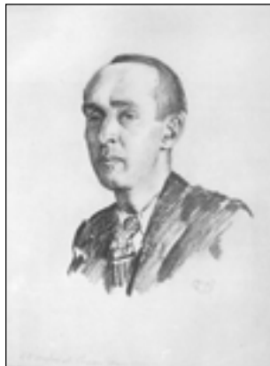
М. Добужинский. Портрет В. Набокова. 1937

Главной задачей «Рифмы» Маковский считал открытие новых поэтических имен. Одним из них было имя живущего в Мюнхене молодого