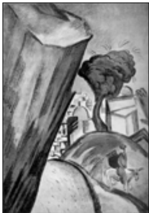
П. Кузнецов. Скала у реки. Лист из альбома «Горная Бухара». 1923

Судейкин любит и знает Россию. Его творчество — лишнее доказательство того, как разнообразны лики России. В своем понимании России он сродни Бенуа и Добужинскому, отчасти Кустодиеву. У него, как и у первых двух, Россия пропущена сквозь призму европеизма . Это Россия городская, мещанская, купеческая... Какой контраст с землистой, нутряной, мужицкой Россией Григорьева 1 .