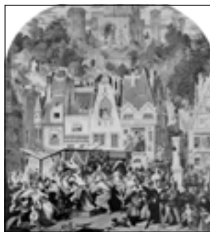
Мориц фон Швинд. Рыцарь Курт. 1835-1840. Не сохранилась

Маковский с удивлением отмечал, что его друг действительно не видел границы между общедоступной явью и окружающими человека мирами тайны. Чудесные, сказочные существа были для него реальностью. В заметке, посвященной Швинду 3 и озаглавленной «Олицетворение сил», он говорил совершенно серьезно: «Вполне допустимо существование дриад, русалок, нереид, водяных, леших, домовых, гномов, как то признавал германский живописец-романтик Швинд. Гуляя с приятелем в горных теснинах близ Эйзенаха, ему пришлось