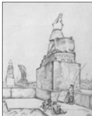
М. Добужинский. Петербург. Сфинкс на набережной. 1920

Такой Петербург рисовали Лансере и Остроумова-Лебедева; сравнивая работы Добужинского с их графикой, он снова четко определяет черты сходства и различия. Сходство — в творческой манере: тонко стилизующий обводящий контур и «старогравиурность». Отличие — в том, что «рядом с зодчеством для него никогда не утрачивает занимательности человек» 5 .