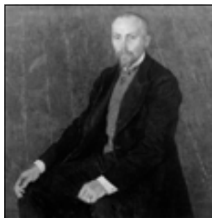
А. Головин. Портрет художника Н.К. Рериха. 1907

Но больше всего Маковского интересует проявление национального именно в искусстве: «Главное в творчестве Штука — он сам, Франц Штук, самонадеянный и жизнерадостный баварец, сын мельника из Теттенвейса, баловень мюнхенского «Сецессиона», не признающий никаких авторитетов, кроме своего неукротимого темперамента» 2 . «Рябушкин рисует древнерусский быт с непосредственностью, которая кажется наивной. В такой наивности — мудрость» 3 . «Человек Рериха — не русский, не славянин и не варяг. Он древний человек, первобытный варвар Земли» 4 .