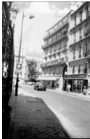
Париж. Дом на rue Tilsitt, где Маковский жил в конце 40-х — начале 50-х годов