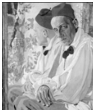
А. Головин. Портрет В.Э. Мейерхольда. 1917

Мастерская Головина под крышей Мариинского театра была своеобразным художественным центром Петербурга: «Здесь собирались друзья художника — поэты, артисты, музыканты, те, кому он доверял присутствовать в его «святой святых», наблюдать его за работой» 3 . Здесь выясняли отношения накануне дуэли из-за Черубины де Габриака Гумилев и Волошин, здесь развивал свои мысли о воспитании актеров для театра будущего князь С.М. Волконский, нередко именно здесь вынашивал и отшлифовывал в спорах идеи новых постановок Вс. Мейерхольд. В переписке Головина с Маковским есть факты, свидетельствующие об их совместных проектах: «Собираемся к Вам приехать с Мейерхольдом, — пишет Головин. — Он сейчас пять