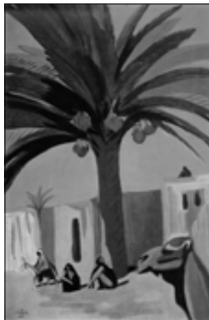
М. Сарьян. Финиковая пальма. 1911