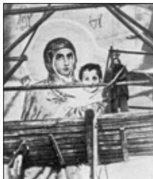
В.М. Васнецов на лесах Владимирского собора в Киеве

В летние каникулы он продолжал путешествовать по Европе и на 1898 год запланировал поездку по южной Германии, тем более, что неразлучная сестра Лена, не удовлетворенная занятиями в мастерской И.Е. Репина, перебралась в Мюнхен, в знаменитую школу Ашбе. В Баварии Маковский увлекся творчеством Арнольда Беклина и, вернувшись в Петербург, написал о нем. В это же время он знакомится с Сергеем Дягилевым и Дмитрием Философовым, которые недавно завершили высшее образование, но уже слыли будущими законодателями русского искусства. В мире искусства много говорили об их прозападнических вкусах, об организованной Дягилевым выставке