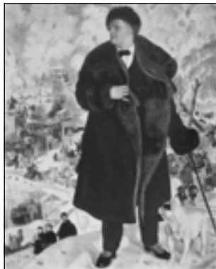
Б. Кустодиев. Портрет Ф.И. Шаляпина. 1922

вторым актом: Маковский вспоминает, что из-за каких-то неполадок не доставили вовремя костюмы и декорации. Многие сомневались, сможет ли Шаляпин перевоплотиться и без атрибутов царственной роли. «Но чудо свершилось. С первого своего появления среди толпы хористов, под колокольный звон, и до последней сцены смерти в четвертом действии Шаляпин держал зрителей в состоянии, близком к гипнозу. Слушая его, следя глазами за вдохновенной его мимикой, зрители забыли и об отсутствии бутафорских кремлевских палат, и о ничтожестве современных одежд. Шаляпин превзошел себя. Голос убеждал интонациями и покоряла величественная пластика игры... пластика скупого «царского» жеста и нарастающего драматизма. Сцена с призраком убиенного царевича повергла скептических парижан в состояние какого-то суеверного восторга... Шаляпин потряс, растрогал, испугал, убедил, увлек за собой, пересоздал по-своему, вознес, преобразил...» 1