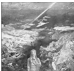
Л. Бакст. Terror Antiquus (древний ужас). Панно. 1911

В 1910 году группа петербуржцев при участии некоторых московских художников создала под старым названием «Мир искусства» новую выставочную организацию, которая действовала в иных исторических условиях и существенно отличалась от прежней. Она пропагандировала и творчество современных западноевропейских художников, и русское художественное наследие 18-го — первой половины 19-го века, коренным образом изменив существовавшие ранее взгляды на их эстетическую ценность. Деятельность «Мира искусства» оказала большое влияние на развитие станковой графики, книжной иллюстрации, театрально-декоративной живописи. Одухотворенность, психологизм, по мнению сотрудников «Аполлона» — качества, такие же необходимые и желанные для искусства, как Красота. Отбиваясь от оголтелой критики, упрекавшей уже упоминавшуюся замечательную аполлоновскую