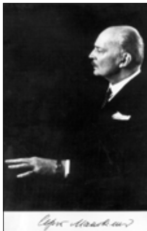
С. Маковский. Requiem. Обложка 9-й, последней книги стихов

Только выйдешь из деревни — скит в бору: изба с избой, да у врат, за городьбой под шатром колодец древний. Над колодцем наклониться страшно, люди говорят: бесы душу залуют, отуманит водяница. Да — брехня! На глуби тесной Ключевая спит вода, незакатная звезда — там, в дали ее небесной.