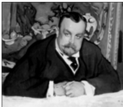
В. Серов. Портрет И.А. Морозова. 1910

Российским зрителям тоже посчастливилось увидеть разрозненные шедевры вместе и даже ознакомиться с образцами развески, которая в начале века тоже отмечалась критиками как свидетельство хоро-