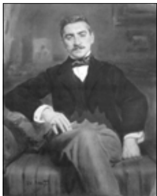
Л. Бакст. Портрет В.Ф. Нувеля. 1895

за новое искусство, как раз и ставила целью восполнить пробел в понимании художественных задач истинного искусства. Служению этой цели был призван и замышлявшийся журнал.