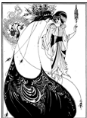
Обри Бердслей. Павлинье платье

Вообще стиль книги Маковского (не будем забывать, что это — первая книга 28-летнего критика) очень ярок, иногда патетичен, наполнен анафорами, восклицаниями, вопросами, казалось бы, риторическими, но на которые хочется ответить или хотя бы задуматься: «Отчего? Отчего большинство современных картин так быстро стареют, перенесенные из мастерской художника в торжественные залы музеев, точно они рассчитаны на жизнь кратковременную, эфемерную? Отчего современная живопись, несмотря на долгий опыт столетий и всяческие познания, которыми мы привыкли гордиться... так недолговечна и материально, и духовно? Отчего холсты