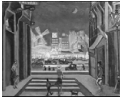
Н. Исаев. Париж. Мулен-Руж ночью. 1925

Описывая выставку русского художника Н. Исаева, Маковский, как и во многих других рецензи-ях, поднимает вопрос о судьбах русского искусства за рубежом. Как сохранить русское националь-