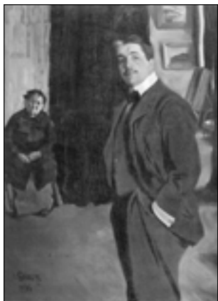
Л. Бакст. Портрет С.П. Дягилева с няней. 1906

Познакомившись с деятельностью русских властей в Финляндии, Маковский отказался от должности чиновника по особым поручениям. К тому же его все более увлекала деятельность группы «Мир искусства», ни одного из заседаний которой он старался не пропускать. Взгляды на искусство его и Дягилева, Filosofova, Бенуа были близки: новаторское западничество сочеталось с мечтой о возрождении российского национального искусства, уходящего корнями в отечественный фольклор. Эти мысли разделяли и многие другие люди, близкие к искусству, в частности известный меценат искусства Савва Иванович Мамонтов, создательница всемирно известного в то время центра русской культуры Талашкино княгиня Мария Клавдиевна Тенишева. К ним-то и обратился С.П. Дягилев с просьбой о финансовой поддержке журнала.