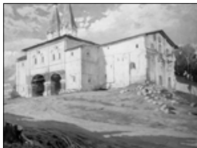
А. Маковский. Ферапонтов монастырь. 1911. Из серии работ «По старым русским городам»

А. Мясникяна была составлена программа работ в этом направлении. Они должны были начаться осенью 1914 года 1 .