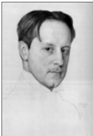
К. Сомов. Портрет М. Добужинского

любоваться им. Что декорации его выразительны, полны смысла и проникнуты настроением — становится ясно с первого взгляда. Я люблюсь и ими. Но есть в них и что-то еще, чего я не могу разгадать. Я перевожу взгляд с декораций на самого Добужинского, с Добужинского на декорации, и мне начинает казаться, что как бы нити тянутся от режиссерского столика к сцене. Есть что-то похожее в лице Добужинского и в его декорациях на сцене. Но что же это? Временами то один, то другой из сидящих за столиком что-то чертит на бумаге под лампочкой и потом снова — два неподвижные профиля. Когда чертит Станиславский, он весь пригибается к столу и медленно, с нажимом водит карандашом по бумаге. Не так Добужинский. Почти не отделяясь от спинки кресла, он скорее пролетает над бумагой своим карандашиком, что-то бросая на нее откуда-то сбоку и сверху. Тронув поверхность бумаги, рука легко отлетает и падает мягко на стол. И вдруг я понял! Декорации в их композиции, в деталях и в целом, в формах, в красках, пропорциях — страшно красивы! Вот разгадка! Так же красивы, как он сам! Отсюда и сходство, и нити! И он и они — красивы и внешне и внутренне. И тут я влюбился! С тех пор я часто следил за ним из темноты, любовался походкой, фигурой, движениями и, как всегда, его профилем. Но я никогда не говорил с ним, не подходил к нему — мой роман развивался в одиночестве, в полутемном зрительном зале» 1 .