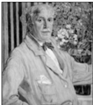
А. Головин. Автопортрет

«Аполлон» постоянно рецензирует его работы, публикует эскизы декораций, костюмов, портреты актеров. В 1913 году Головину посвящается целая книжка «Аполлона», открывавшаяся одним из лучших его автопортретов. С.К. Маковский посвящает творчеству художника большой очерк. Он пишет о Головине как о блистательном театральном декораторе, но тут же оговаривается, что судить о таланте Головина только по декорациям было бы «несправедливо»: «Во-первых, декорация — результат сотрудничества многих лиц и взаимодействия многих условий, и потому — то, что мы видим на сцене, при свете рампы, далеко не всегда соответствует точно замыслу художника. Во-вторых, Головин не только декоратор, он еще автор отличных пейзажей, natures mortes , «испанок» и портретов, и эти работы, кстати сказать, публике очень плохо известные, для оценки его дарования не менее важны, чем декоративные. Самое главное в Головине — вовсе не его постановки, как бы ослепительны ни были некоторые из них,