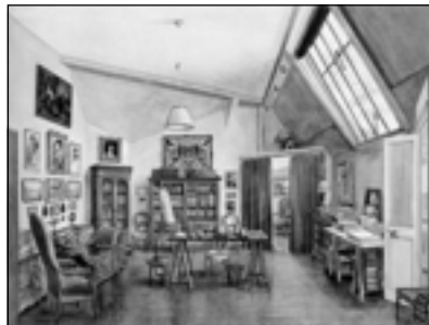
А. Серебряков. Кабинет Александра Бенуа. 1944

Маковский уверен, что «европейство» Бенуа не поза, не предвзятая идея, не вывод рассудка, не только обычное российское западничество, а нечто более глубокое: «За всю нашу европейскую историю не было деятеля, более одержимого эстетическим латинством: Александр Бенуа (и живописец, и искусствовед) действительно открыл нам очарование нашей до жути романтической послепетровской иностранщины. И вокруг него возникла целая плеяда художников, тоже стилистов и рисовальщиков по преимуществу» 2 .