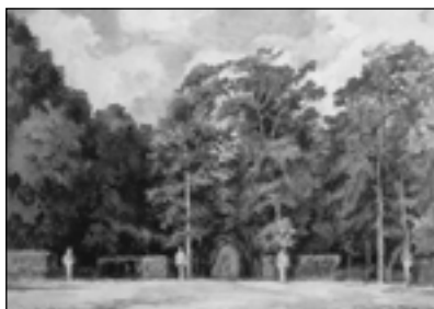
А. Бенуа. Версаль. Перекресток философов. 1905

терных для «Страниц художественной критики», и даже коротких, не грешащих излишней красотью, как в «Аполлоне»: «Холсты, созданные из расплывающихся туманов» 1 . В «Силуэтах» метафоры кратки и их сравнительно немного: «пожар начался с Васнецова» (о новом искусстве), «праздник искусства» (о серебряном веке), «вспрыснуться «живой водой» современного французского гения» (о традициях импрессионизма) и т.д. Но все-таки часто автор не может устоять перед использованием стилистических фигур, среди которых особенно любимой критиком является, пожалуй, анафора: