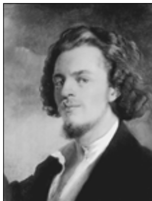
К.Е. Маковский. Автопортрет. 1860

Весной 1875 года супруги поехали в Париж. Константин снял мастерскую на бульваре Клиши и квартиру на Брюссельской, наискось от четы Виардо. И.С. Тургенев, портрет которого Маковский написал ранее, был их частым гостем. В доме Виардо собирались артисты — русские