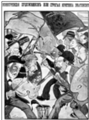
Плакат начала века из журнала «Нива»

В поисках школы и просто единомышленников молодые русские художники устремлялись на Запад — во Францию, Германию, Италию. Знакомство с единомышленниками и вечными творениями мастеров прошлого позволяло им не только перекинуть мосты между прошлым и будущим, но и понять суть собственных творческих поисков. В архиве К.С. Петрова-Водкина находим следующее признание: «Установить причины, приведшие живопись к развенчанию, это дело историков, но мы не можем не видеть начал новой жизни живописи, ее возрождения, и мне лично это возрождение представляется не восстановле-