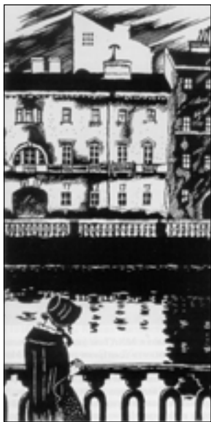
М. Добужинский. Иллюстрация к повести Ф.М. Достоевского «Белые ночи». 1922

Татаринов отмечает, что в книге Маковского много личного — к моменту ее написания Петербург уже шесть лет был для него странной воспоминаний. «Текст «Графики Добужинского» написан человеком, который весь в великом и широком фарватере русского искусства и как-то особенно близок тому художнику, о ком он говорит. Достоевский — Петербург —