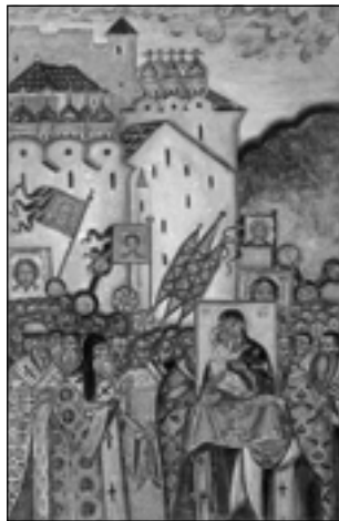
Д. Стеллецкий. Крестный ход в Новгороде. 1930-е годы

Это выступление в газете было первой публикацией Маковского о Стеллецком. Работа над новой книгой мемуаров шла уже третий год. Без Стеллецкого картина культурной жизни эмигрантской общины была бы неполной. И ничто не мешало переработать еще раз тот