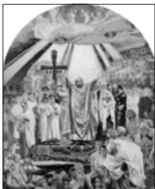
В. Васнецов. Крещение Руси. Эскиз росписи Владимирского собора

Он объясняет во вступлении ко второму тому, что за последние десять лет взгляд на живопись изменился в корне, люди стали лучше понимать искусство, отличать плохое от хорошего. Но общение с искусством даже у столичной интеллигенции еще не стало потребностью: «Немногие тысячи петербуржцев считают своей обязанностью посетить выставки. Именно — обязанностью. Многие ли ходят на выставки не потому, что это стало привычкой, что «так принято», а по влечению сердца, с чувством художественного голода, волнующего ожидания? Многих ли искренно, по-настоящему интересуют новые работы наших признанных и непризнанных мастеров, вопросы художественного преподавания, успехи «начинающих» — словом, то, от чего зависит судьба русского искусства?» 2