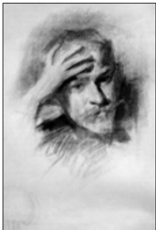
В. Борисов-Мусатов. Автопортрет. 1904-1905

Маковский пользуется им лишь как пунктиром, соединяющим одну веху в развитии искусства с другой. Самое главное для него все-таки его «силуэты» — хорошо знакомые ему и по большей части любимые им художники его времени, и сами рассказы о художниках совершенно не хронологичны, их построение ассоциативно, поскольку именно ассоциативный принцип позволяет наиболее емко и многомерно воспроизвести и осмыслить те или иные явления. Рядом с рассуждениями о творчестве французских импрессионистов — Левитан, и тут же краткое замечание: «В левитановский импрессионизм влилась безусловно русская струя: лирическое переживание родного деревенского затишья» 1 .