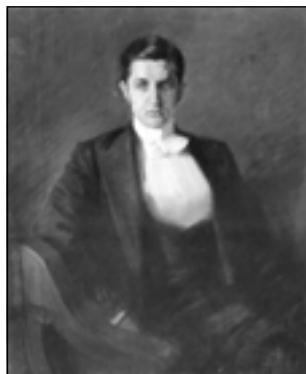
Л. Бакст. Портрет Д.В. Философова. 1898

английских и немецких акварелистов, о начавшем выходить журнале «Мир искусства». Оказалось, что Дягилев читал статью Сергея о Васнецове. Похвалив ее, он пригласил начинающего художественного критика сотрудничать с «Миром искусства». Маковский счел предложение лестным и тотчас же отправил в редакцию статью о Беклине. Через две недели к нему заехал Философов и, подтвердив предложение о сотрудничестве, вернул статью как «не подходящую по тону», объяснив, что можно было бы опубликовать фрагмент статьи о разраставшемся влиянии «мифологического» Беклина на молодых немецких художников.