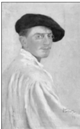
Л. Бакст. Автопортрет. 1893

отсутствовать в тексте эссе, но по точно выписанным деталям, по множеству мелких подробностей читатель догадывается, что критик судит о произведениях искусства, о процессах, происходящих в нем, не с чужих слов: «Театр сразу оказался к услугам стилизма. В обеих столицах театральное новаторство заключило тесный союз с ретроспективной ученостью и красочным своеволием передовых художников. Здесь разноязычный историзм и всякая фантастика пришлись ко двору. Толпа не понимала картин, но рукоплескала декорациям и костюмам. И художники сделались страстными театрами, двинулись штурмом на храм Мельпомены, превратились в слуг ее ревностных, в буталфоров, гримеров и постановщиков» 1 .