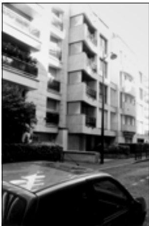
Париж. Rue de la Source. Последняя квартира Маковского

Об этом он постоянно говорит со своими взрослыми детьми и почти по-детски радуется любому проявлению созвучия мыслей, понимания, даже если это обычная открытка с видом каталонских гор и долин — от сорокапятилетнего Сергея: «Дорогой папа, как я понимаю твою любовь к Испании. Эта страна сказочной красоты! В каждом городе переживаешь глубокие впечатления» 1 .