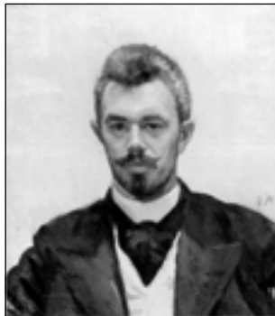
Ф. Малявин. Автопортрет. 1900-е годы

Этот жизненный парадокс, очевидно, окончательно убедил художника в том, что надо идти собственным путем, что он и сделал. «Усвоив с завидной легкостью все, чему могла научить казенная школа и в особенности сам Репин, рисовальщик и живописец совершенно