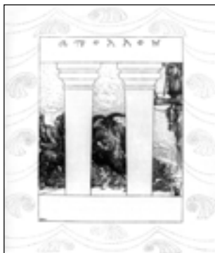
Л. Бакст. Титульный лист первого номера журнала «Аполлон». 1909

с «Аполлоном», а «Весы» — спокойной передачей «эстафеты» журналу, приобретаемому известность в столичных литературно-художественных кругах еще до выхода своего первого номера 1 . В последнем номере (1909, № 10-11) «Весы» попрощались с читателями парадом своих лучших поэтических сил, опубликовав стихи Ю. Балтрушайтиса, К. Бальмонта, А. Блока, В. Брюсова, М. Волошина, Э. Гиппиус, В. Иванова, М. Кузмина, Д. Мережковского, С. Соловьева, Ф. Сологуба. Вскоре эти поэты составили костяк аполлоновского поэтического салона, собравшего вокруг себя и маститых литераторов, и талантливую молодежь.