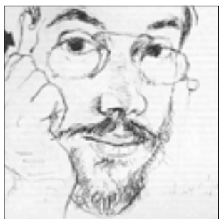
А.Н. Бенуа. Автопортрет

поколений: «Он всегда очаровывает мастерством штриха и проникновенностью фантазии, особенно в тех картинах и рисунках, где оживает душа старых архитектур, где дворцы, статуи и фонтаны нашептывают повести о парадной пышности минувших столетий. Я уверен, что Бенуа, несмотря на все сделанное им в области живописи, не дал развернуться другому своему призванию, призванию зодчего, в нем угадывается вдохновенный архитектор из семьи тех русских иностранцев, как Растрелли, Кваренги, де-ла-Мот, которые создали в России великолепие Елисаветинского, Екатерининского и Александровского стилей. Кто знает? — при благоприятных обстоятельствах Александр Бенуа, может быть, осуществил бы грандиозные строительные замыслы, вместо того, чтобы рассказывать красивыми акварелями о своем любовании красотой версальских парков и дворцов» 1 .