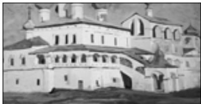
Н. Рерих. Воскресенский монастырь в Угличе

Молодые люди, причастные к искусству, действительно стали близко к сердцу принимать проблемы, касающиеся народного творчества, древнего искусства — живописи, ваяния, зодчества. Училище княгини Тенишевой стало одним из наиболее привлекательных учебных заведений, куда стали поступать молодые люди даже из высшего света. Молодые художники устремились из Петербурга и Москвы на поиски древностей в родные места. Вот свидетельство одного из них — художника кружка «Голубая роза» М.С. Сарьяна: «Обеспокоенный плачевным состоянием большинства древних памятников архитектуры, я начал вести пропаганду их реставрации среди армянского населения России. Нашлись люди, которые обещали оказать материальную помощь. Зимой 1913—1914 годов в Москве при непосредственном участии