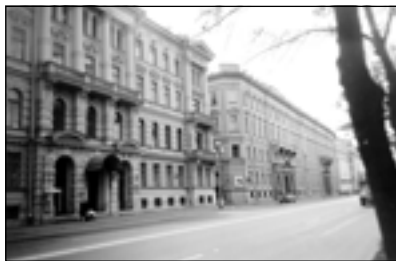
Дом на Адмиралтейской набережной, где прошло детство С. Маковского