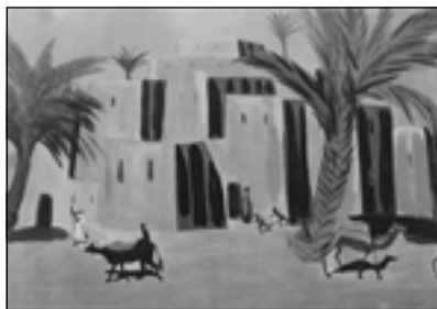
М. Сарьян. Феллахская деревня. 1911

Сравнивая двух других своих современников — Рериха и Врубеля — Маковский тоже учитывает их национальность, отчасти объясняя ею и особенности ха-