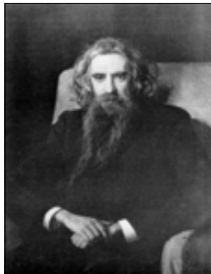
Н. Ярошенко. Портрет В. Соловьева. 1895

Поездка в Египет воспринималась с тою же естественностью, как если бы он ехал к реальному другу. Соловьев в египетской пустыне, ожидающий условленной встречи с небесным видением, был близок нашему восприятию; он был тем, каким являлся в минуты своего вдохновляющего молчаливого созерцания» 3 .