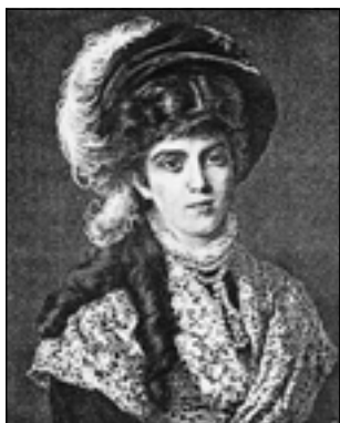
К.Е. Маковский. Портрет жены