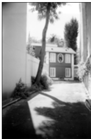
Париж. Вход в Сергиево Подворье

В том, раннем очерке, написанном еще при жизни Стеллецкого, Маковский хотел порадовать своего героя, воздав ему должную славу. Но Стеллецкий умер, не дождавшись публикации. Автор, однако, не выбрасывает не поспевший ко времени абзац, а добавляет только слово «памяти»: «Апофеозом в радостных, светлых тонах кончается «Слово о полку Игореве» Стеллецкого: «Слава Игорю Святославичу, Буй-Туру Всеволоду, Владимиру Игоревичу... Слава князьям и дружине!» Вспоминая об этом большом и прекрасном труде Стеллецкого, скажем ему, художнику с душою древней, так глубоко по-своему любившему все старинно-русское, скажем его памяти — Слава» 2 . Очерк о Стеллецком завершил галерею русских художников, создававшуюся Маковским в течение всей его жизни.