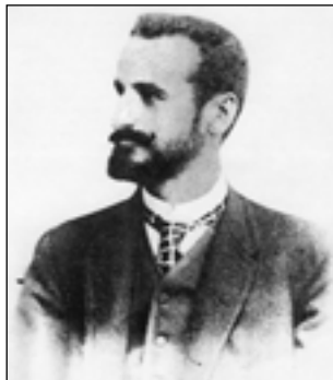
Князь С.М. Волконский

наиярчайшей личности художественного мира рубежа веков, директора Императорских театров России князя С.М. Волконского: «Через Врангеля я сошелся с Маковским, редактором художественного журнала «Аполлон». Он открыл мне страницы своего журнала, и в течение четырех лет я был его сотрудником... несмотря на некоторую неопределенность направления журнала, сохраняю об «Аполлоне» самое нежное воспоминание как о воплощении того, что было самого прекрасного и самого нарядного в русской художественной жизни» 1 .