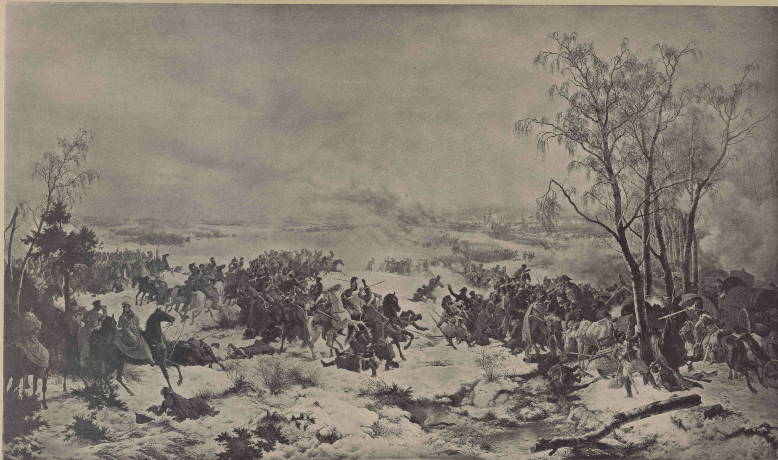
Съ Карл. П. Гессъ, Фот. П. Гоффертъ.