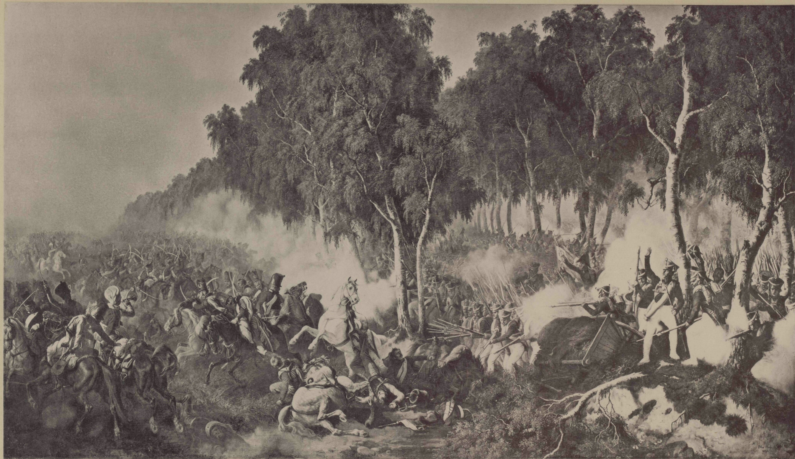
Съ Карл П. Гессъ, Фот. I. Пофферъ.