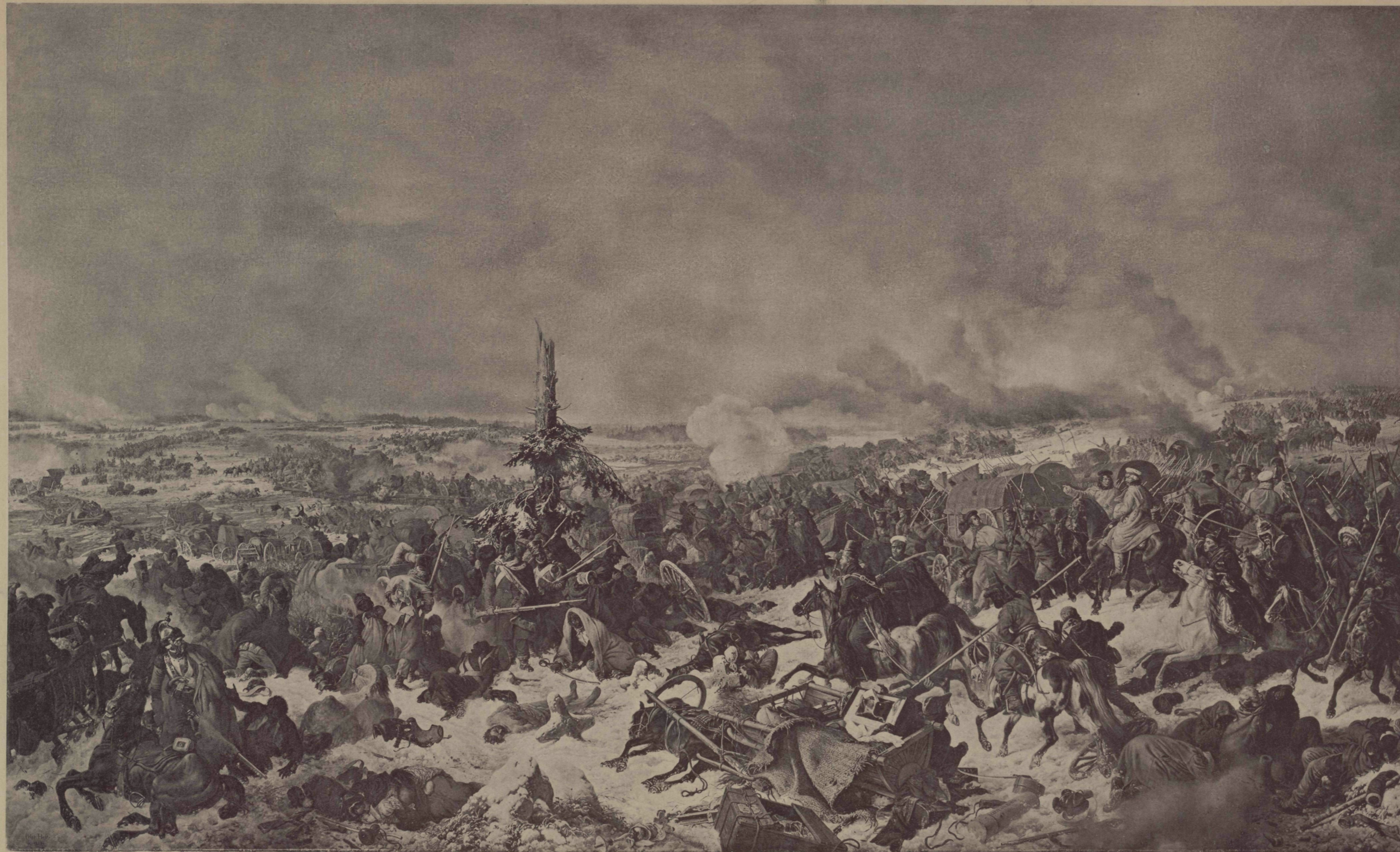
Съ Карл П. Гессъ