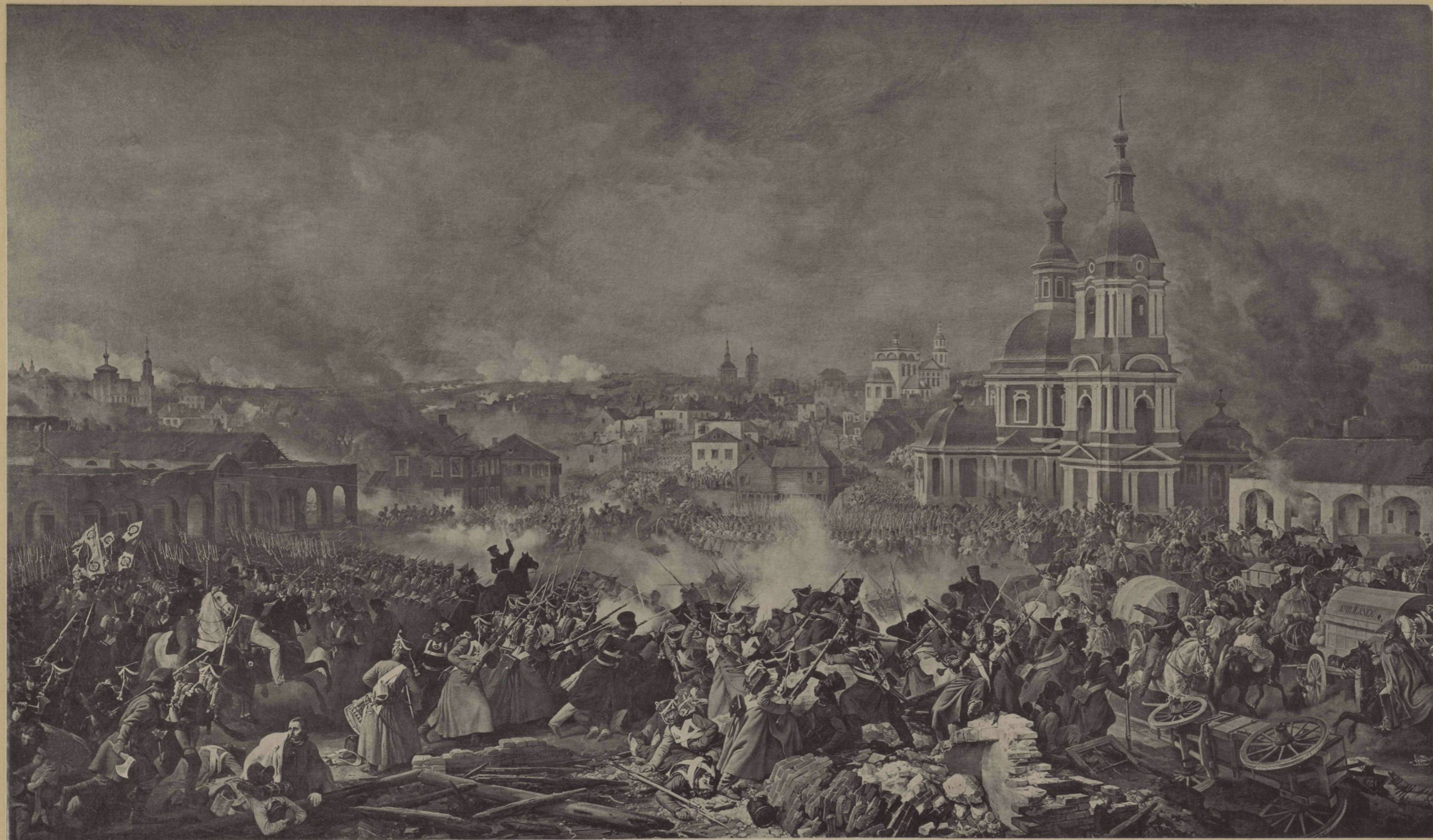
Съ Карл П. Гессъ, Фот. П. Гофферъ.