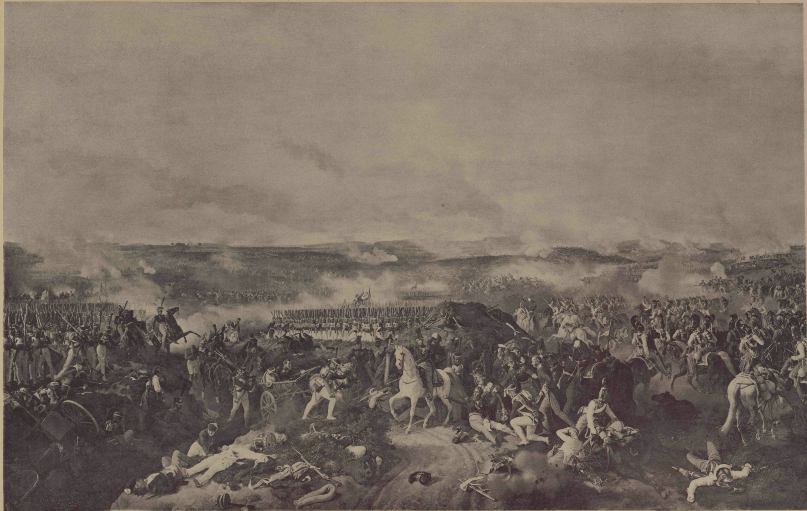
Съ Карт. П. Гессъ, Фот. I. Поффертъ.