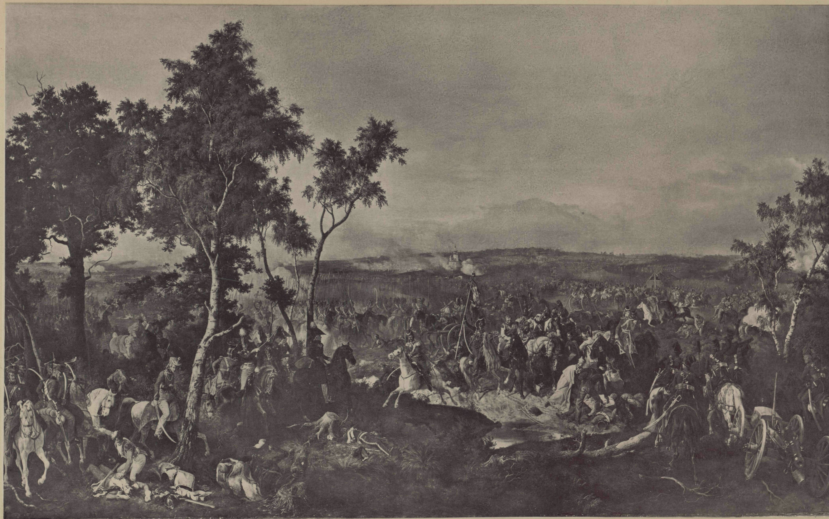
Съ Карл II Гессъ, Фол. I Поффергъ.