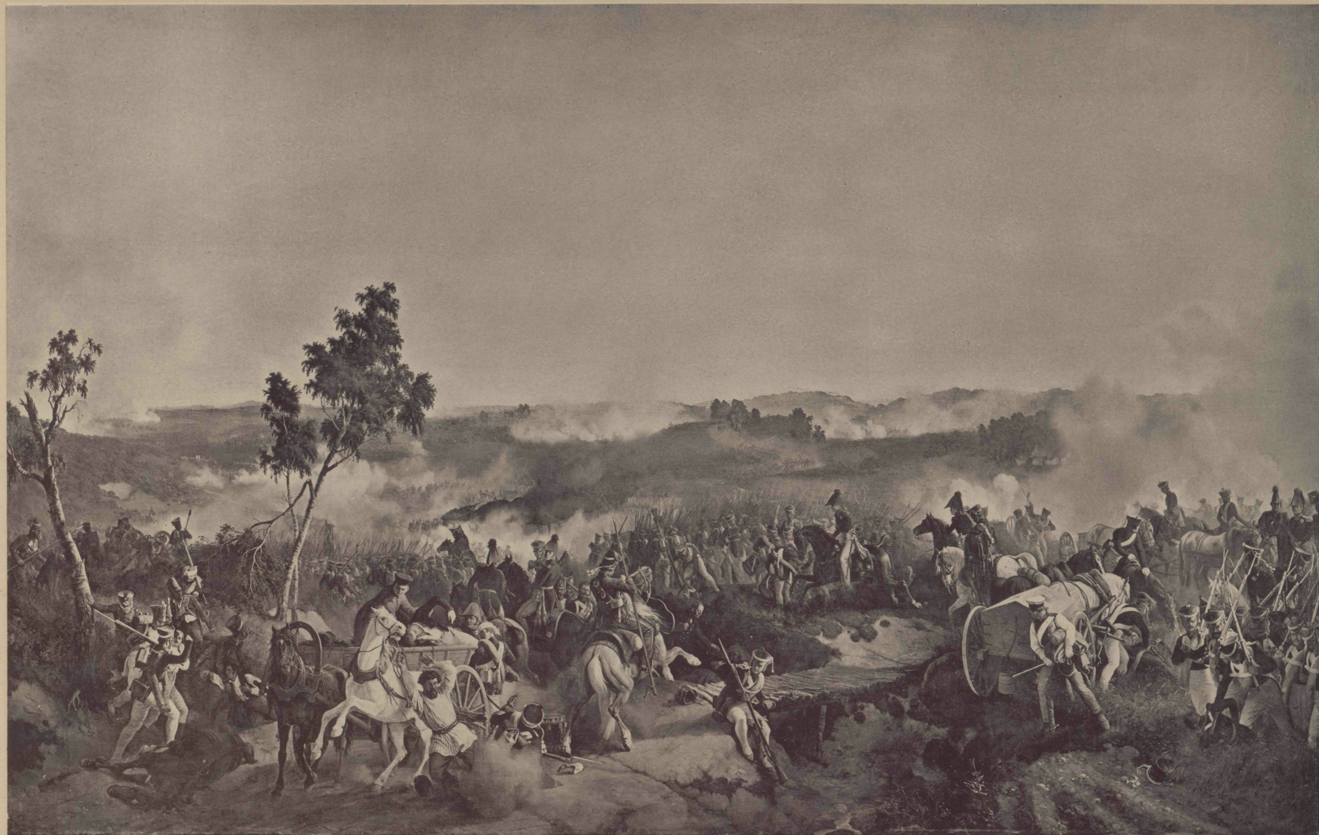
Съ Карл П. Гессъ, Фот. I. Гофферъ.