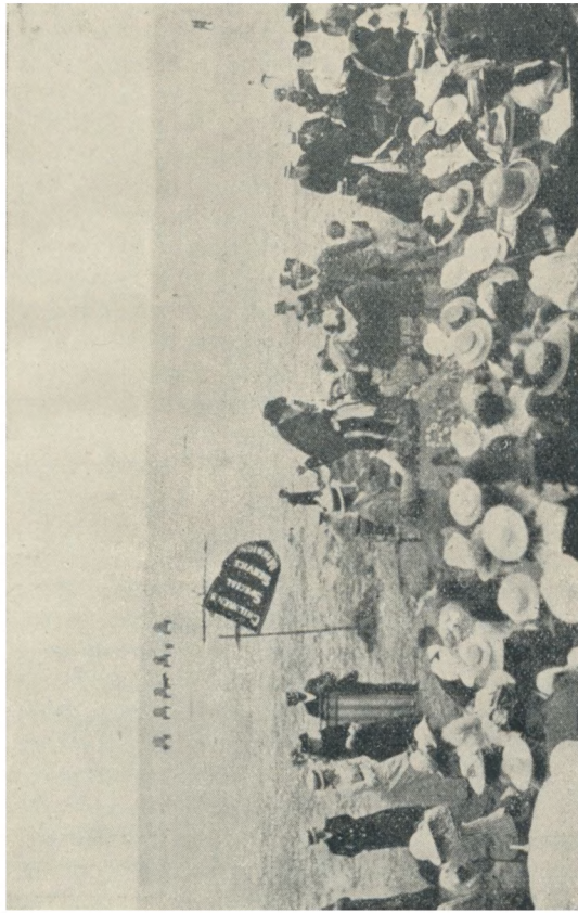
Вильямс, 80 летним стариком, беседует с детьми на берегу моря.