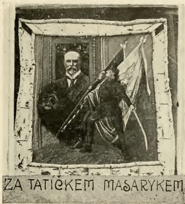
Портретъ Президента Ч.С.Р., Т. Г. Масарика, на одной изъ легіонерскихъ теплушекъ.