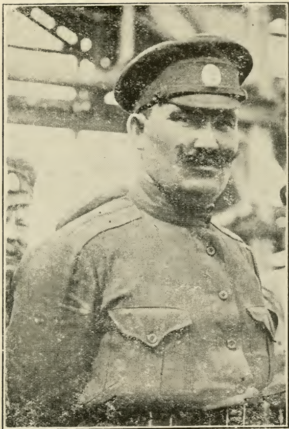
Атаманъ Г. М. Семеновъ, въ началѣ поднятаго имъ противобольшевистскаго возстанія. на Дальнемъ Востокѣ.