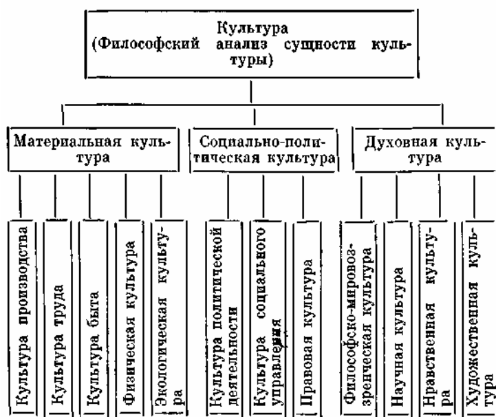
Схема 2. Культура как объект научных исследований.

Но культура, будучи характеристикой деятельности человека, представляет собой «сквозной срез» социума, пронизывающий все стороны жизни общества. Поэтому на втором, более конкретном уровне членение культуры на основные области задано структурированием деятельности на ее основные виды. Основными видами деятельности выступают: материальная, социально-практическая и духовно-преобразующая, выделенные по объекту деятельности (природа, общество, человек). Трем основным видам деятельности соответствуют структурные элементы (основные области) самой культуры: материальная, социально-политическая и духовная 125 .