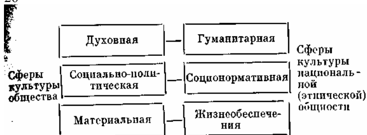
Схема 1. Соотношение структур культуры общества и культуры национальной (этнической) общности.

риальная, социально-политическая, духовная), но трансформирована применительно к социальному субъекту, т. е. с учетом этнической специфики. Так, можно провести параллели между культурой жизнеобеспечения и материальной, определенные параллели между соционормативной и социально-политической, гуманитарной и духовной. Но структурирование культуры национальной общности есть в этом случае и дальнейшая конкретизация выделенных ранее трех рядов отношений человека к миру: человек (общество) — природа, человек (личность) — общество, человек (индивид) — человек (как самоценное существо). На схеме 1 наглядно представлены эти взаимные соответствия.