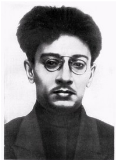
Я. М. Свердлов.