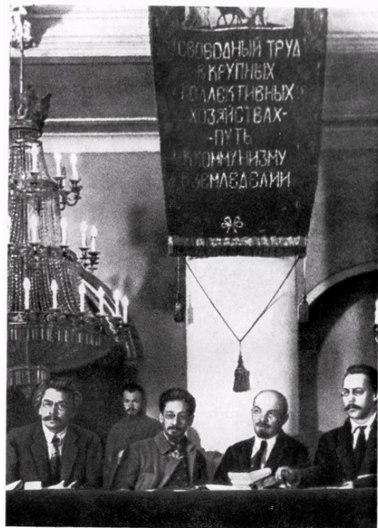
В. И. Ленин и Я. М. Свердлов в президиуме съезда сельскохозяйственных коммун и комбедов. Москва, декабрь 1918 г.