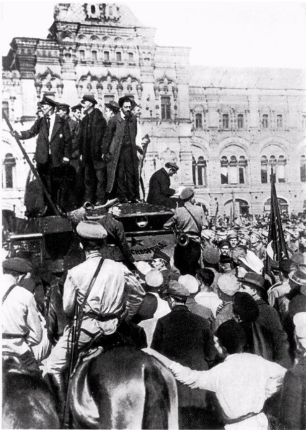
Выступление Я. М. Свердлова на митинге, посвященном проводам бойцов на фронт, на Красной площади. Москва, 1918 г.