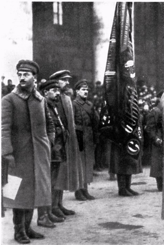
Э. М. Склянский, Я. М. Свердлов, Н. И. Подвойский.