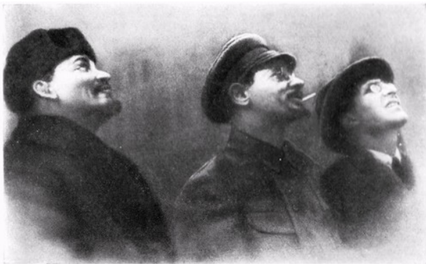
В. И. Ленин, Я. М. Свердлов, В. А. Аванесов на открытии временного памятника К. Марксу. Москва, 7 ноября 1918 г.