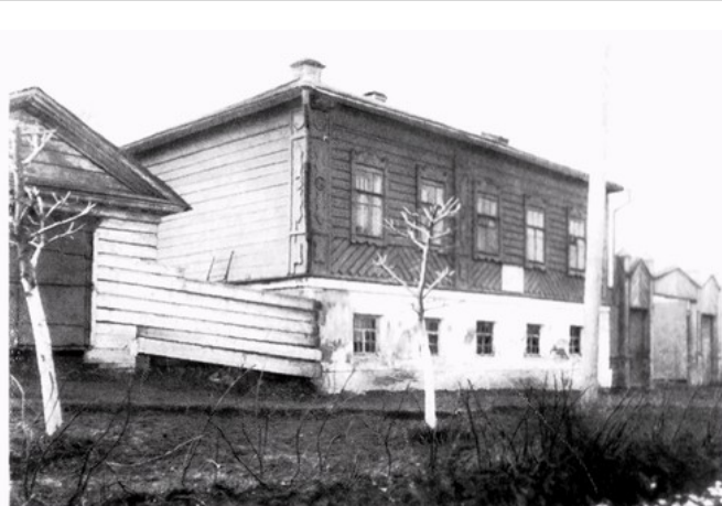
Штаб-квартира Екатеринбургского комитета РСДРП.