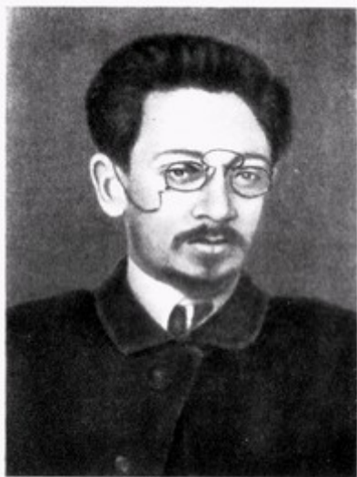
Я. М. Свердлов. 1918 г.