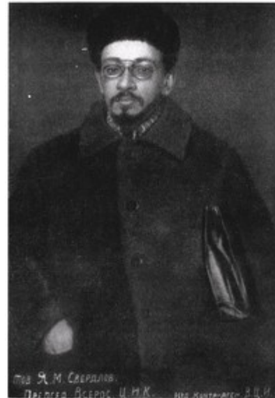
Я. М. Свердлов — Председатель Всероссийского Центрального Исполнительного Комитета. 1918 г.