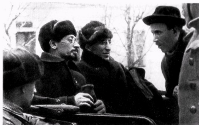
Я. М. Свердлов, В. А. Аванесов, Демьян Бедный. 1918 г.