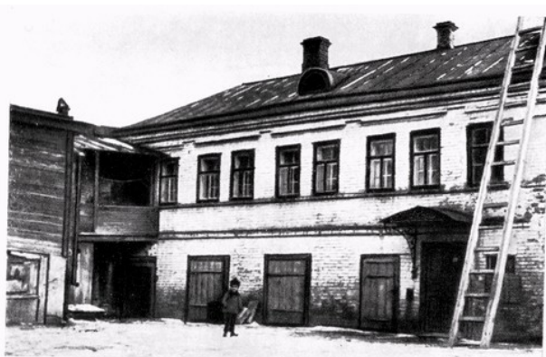
Дом в Нижнем Новгороде, где прошло детство Я. М. Свердлова.