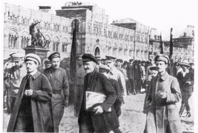
Я. М. Свердлов на параде Всевобуча. Москва, август 1918 г.