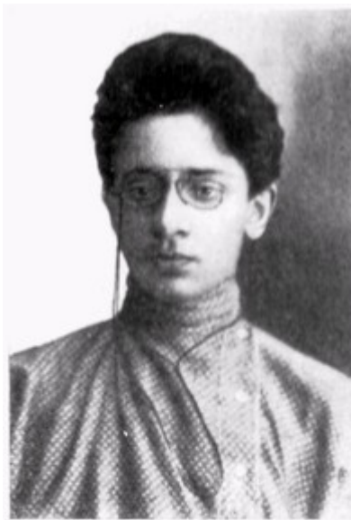
Я. М. Свердлов. 1904 г.