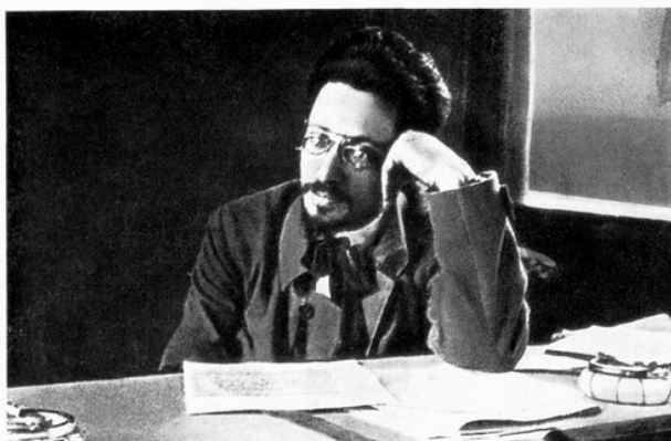
Я. М. Свердлов в вагоне поезда во время поездки на фронт. Осень 1918 г.