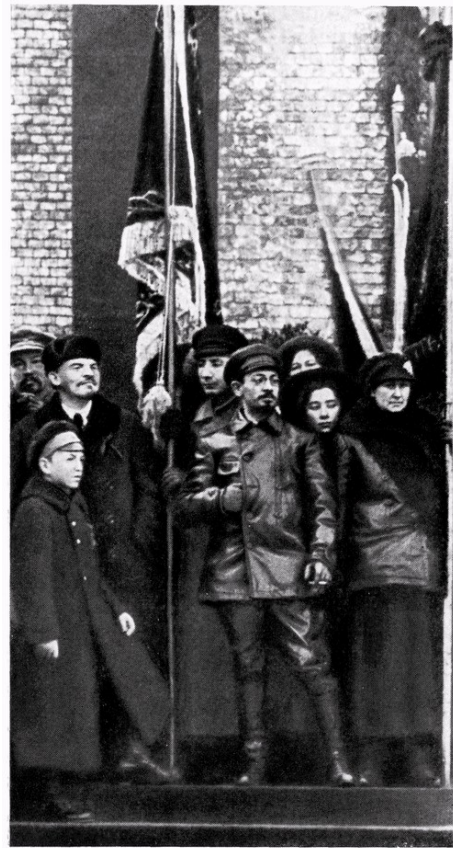
В. И. Ленин и Я. М. Свердлов среди участников митинга по случаю открытия мемориальной доски памяти жертв революции. 7 ноября 1918 г.