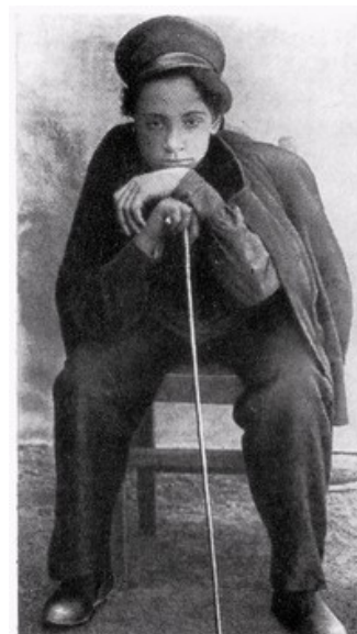
Я. М. Свердлов. 1900 г.