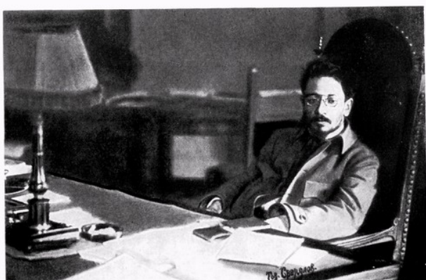
Я. М. Свердлов в своем кабинете в Кремле.