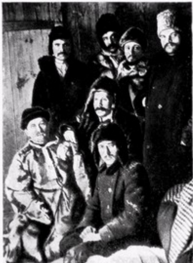
Я. М. Свердлов (стоит, второй справа), Ф. И. Голощекин (сидит, крайний слева) в группе товарищей, возвращающихся из ссылки. Март 1917 г.