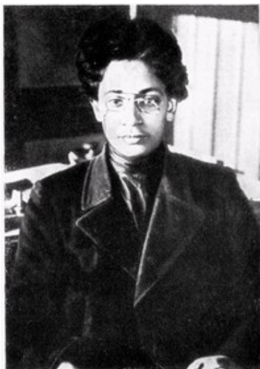
Я. М. Свердлов. Снимок охранного отделения. 1903 г.