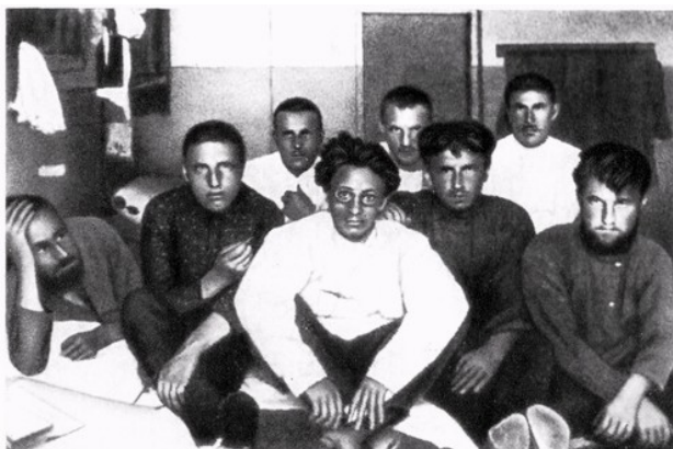
Я. М. Свердлов в группе заключенных в пермской тюрьме. 1906 г.