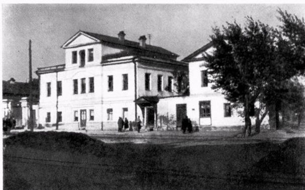
Дом, в котором находилась нелегальная партшкола Екатеринбургского комитета в 1905 году (ныне музей Я. М. Свердлова).