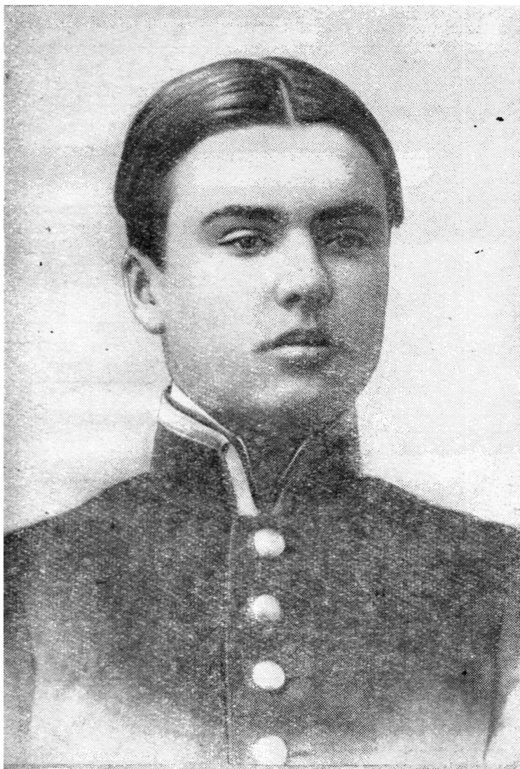
С. Г. Лазо после окончания гимназии. Июнь 1912 года