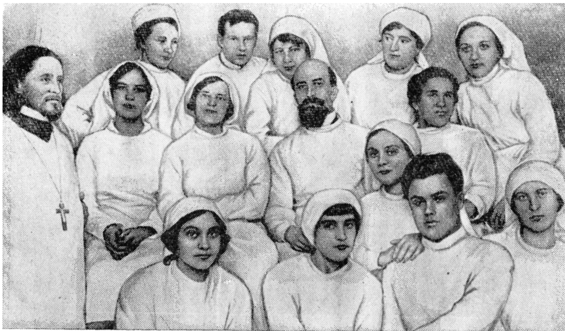
С. Лазо (первый ряд, второй справа) в лазарете медицинских работников в Москве, 1916 г.