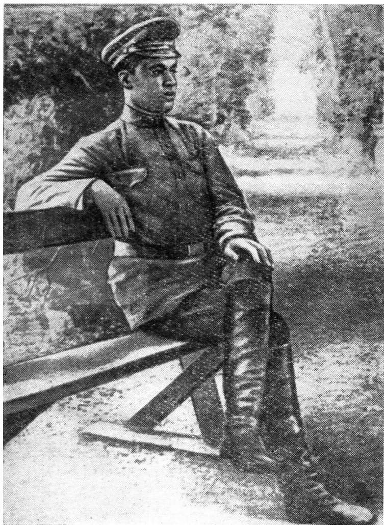
С. Г. Лазо летом 1917 года. Председатель военной секции Красноярского Совета рабочих и солдатских депутатов