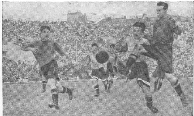
Напористо и дружно играют футболисты тбилисского «Динамо». Трудно приходится нашей защите!