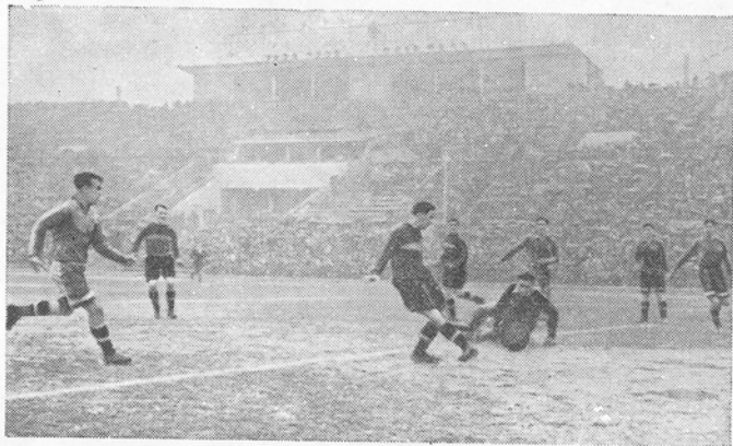
Поздняя осень, дождливый день. Но горяча спортивная борьба на поле старых соперников — «Спартака» и «Динамо».