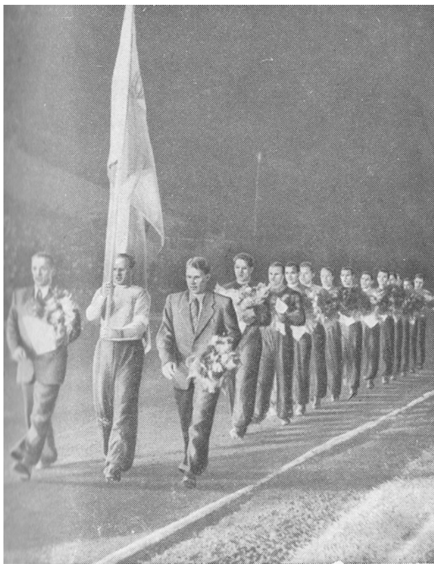
В пятый раз завоевала команда армейцев почетное знамя чемпиона страны по футболу.