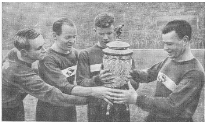
Боевой коллектив спартаковцев Москвы пять раз завоевывал «Кубок СССР».