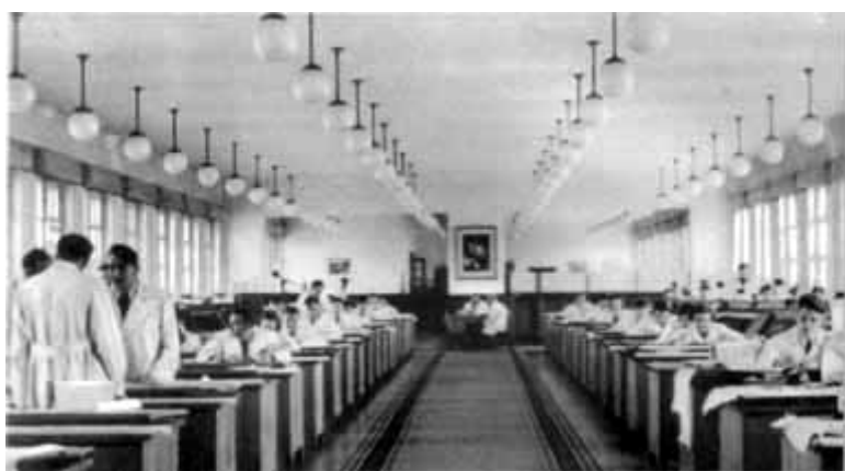
22 – Конструкторское бюро. 1940 год.