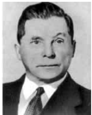
32 - Конструктор самолетов С. В. Ильюшин.