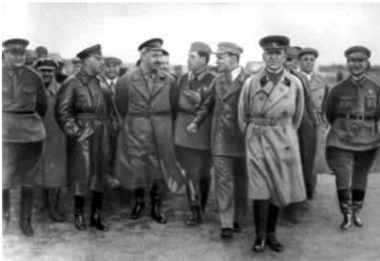
15 – Г. К. Орджоникидзе и К. Е. Ворошилов на московском аэродроме слушают объяснения конструктора Яковлева о самолете УТ-1. 1935 год.