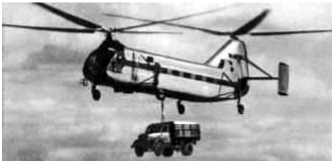
48 – Вертолет ЯК-24 за работой.