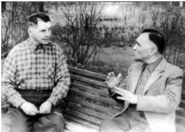
52 – С. В. Ильюшин и А. С. Яковлев.