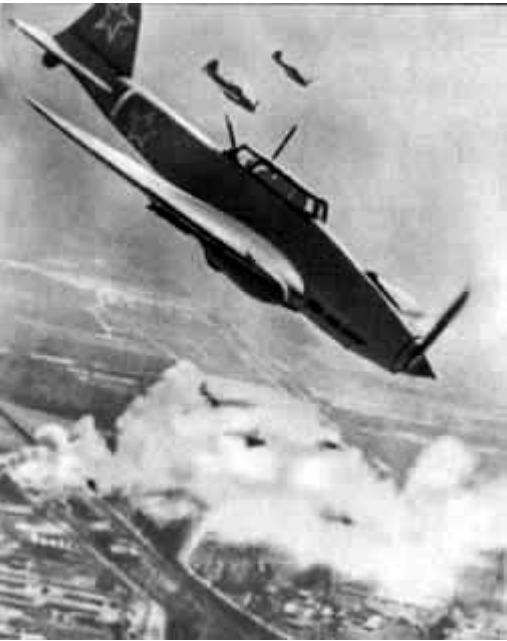
38 – ИЛы атакуют.