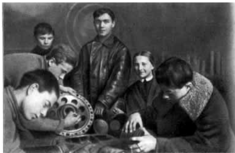
04 - Школьный кружок друзей воздушного флота. В центре - автор книги. 1923 год.