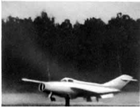
55 – Вертикально взлетающий реактивный самолет.