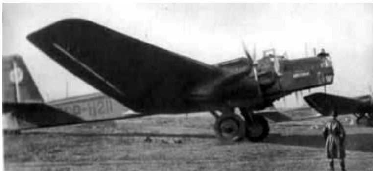
20 – Тяжелый бомбардировщик ТБ-3 конструкции А. Н. Туполева.

М. Климов! Сбылась на нашу Вероятную беседу, хо- тея до знать: 1) можете ли прислать на зндх 2 мотора М-105 и 2 пушечных мотора типа М-105 для кон- структора Климов? У себя можете, когда именно прислать? Пле Ольв сродил. И. Сталин