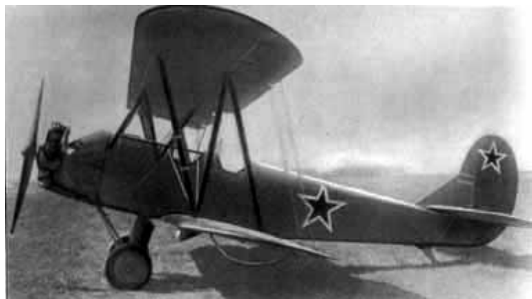
18 – Самолет ПО-2.