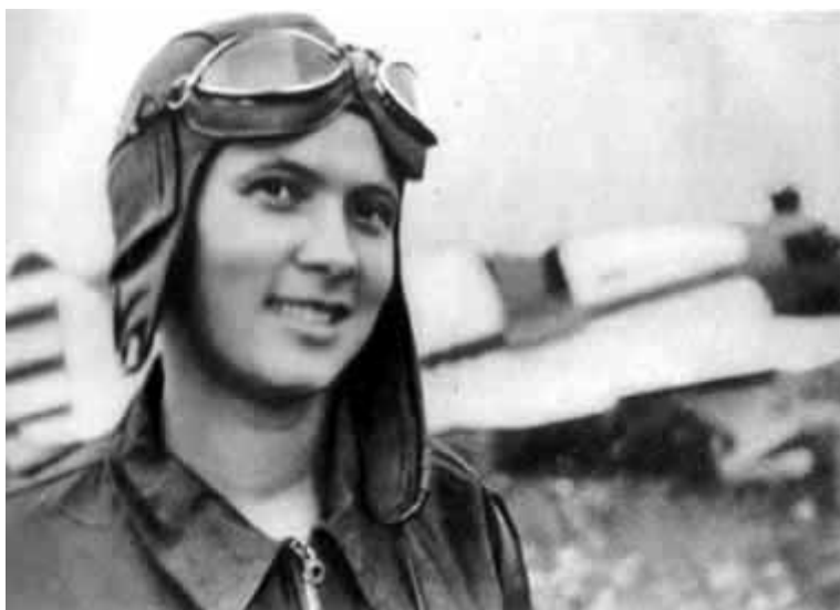
13 – Катя Медникова. 1938 год. Летчица, мировая рекордсменка. Такой автор впервые встретил свою жену.