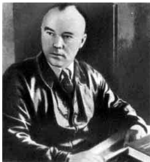
17 – Конструктор самолетов Н. Н. Поликарпов.