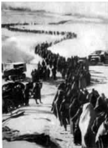
40 – Гитлеровские вояки после Сталинградской битвы. 1943 год.