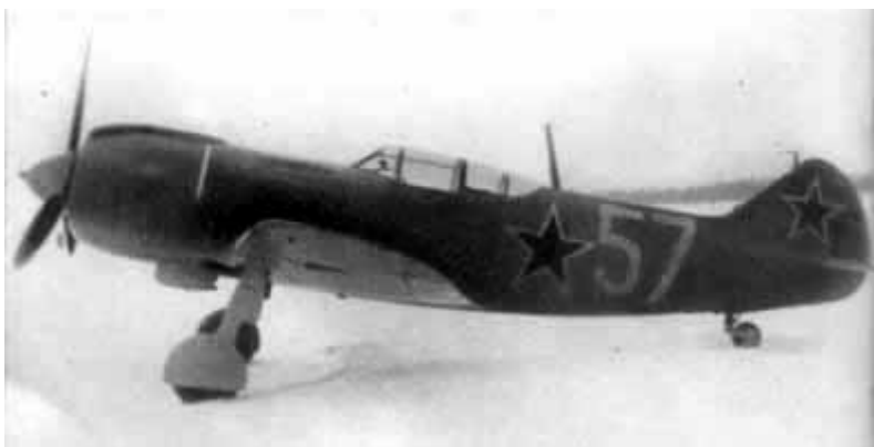
28 – Истребитель ЛА-5.