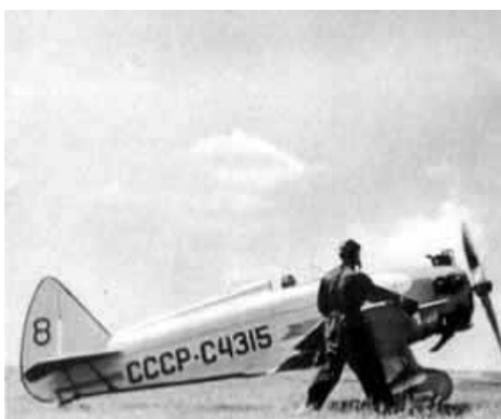
12 – УТ-1 перед взлетом.