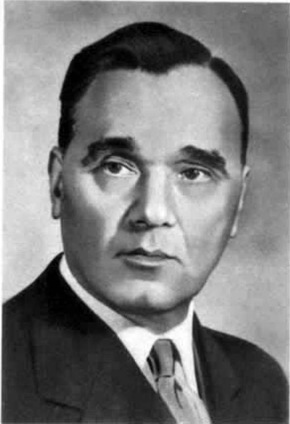
01 - Александр Сергеевич Яковлев