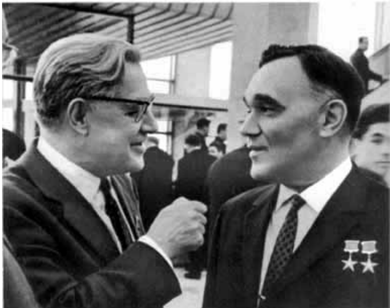
59 – А. А. Сурков и А.С. Яковлев на XXII съезде КПСС.