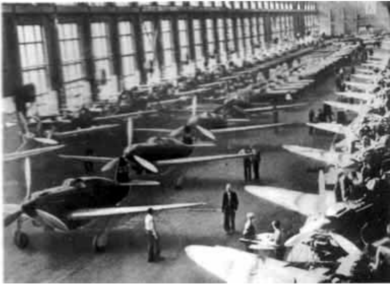
37 – Конвейер сборки ЯКов. 1943 год.