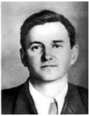
34 - Конструктор самолетов О. К. Антонов.