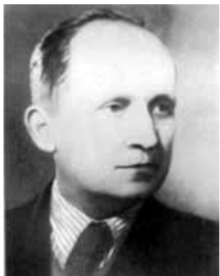
33 - Конструктор самолетов П. О. Сухой.