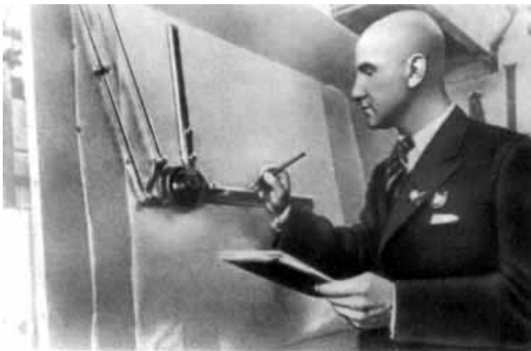
29 – А. А. Микулин – конструктор двигателей, устанавливавшихся на штурмовиках ИЛ-2.