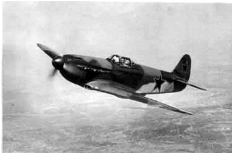
36 – ЯК-3 в полете.