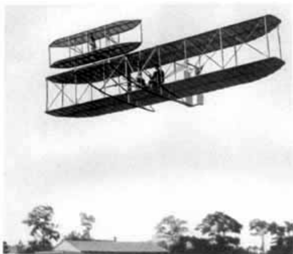
07 – Полет аэроплана братьев Райт.