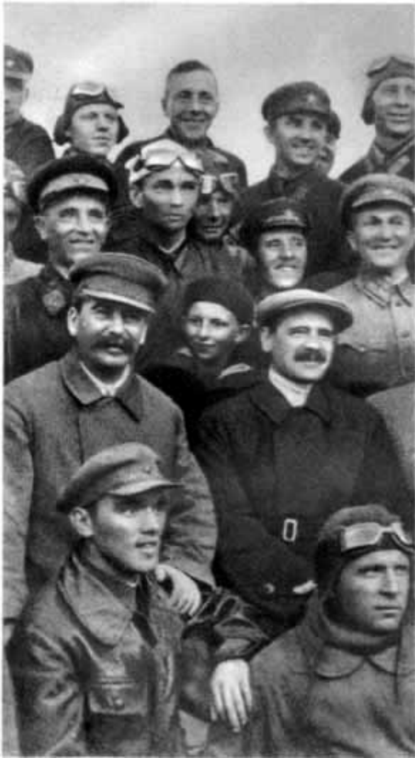
14 – Руководители партии среди авиаспортсменов на Тушинском аэродроме. 1935 год.