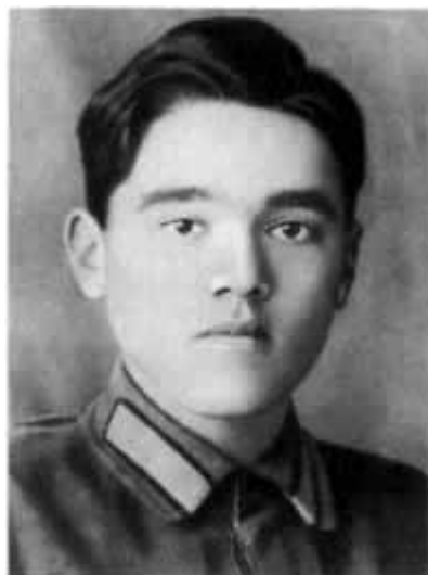
05 – В 1925 году А. С. Яковлев работал мотористом Центрального аэродрома