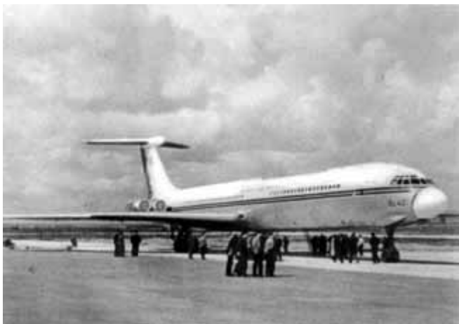
53 – Трансатлантический реактивный лайнер ИЛ-62.