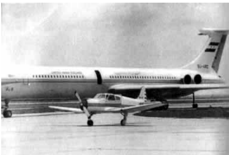
61 – Новый четырехместный самолет ЯК-18Т рядом со 180-местным ИЛ-62. 1971 год.