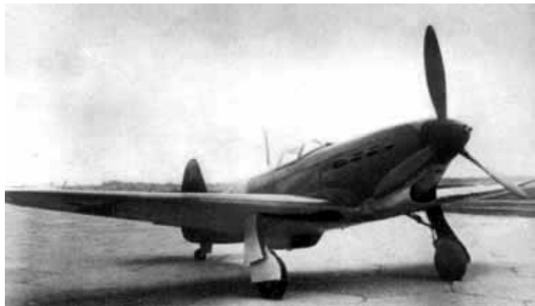
16 – Истребитель ЯК-1. 1950 год.