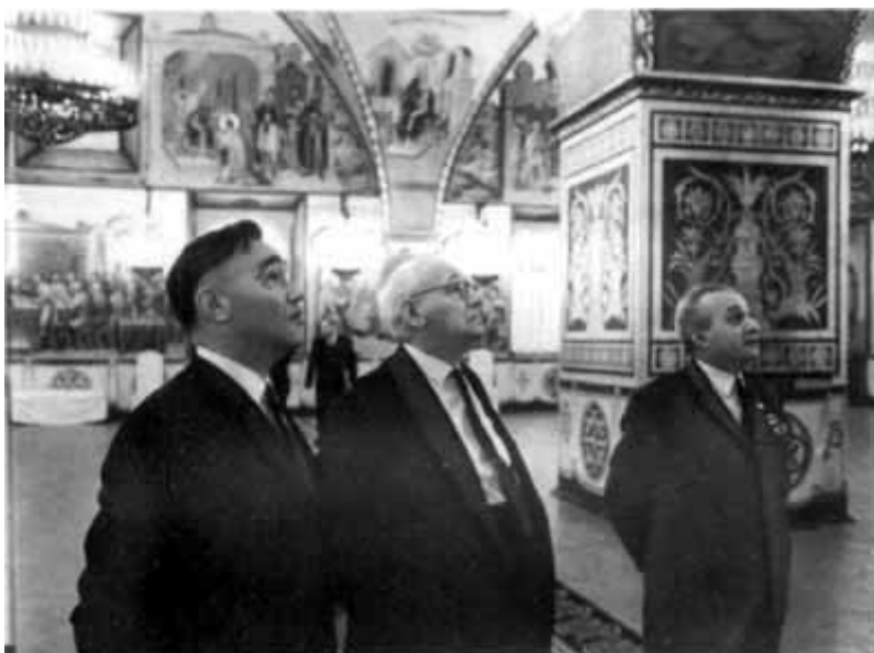
60 – Конструкторы А. И. Микоян, А. Н. Туполев, А. С. Яковлев в Грановитой палате Кремля.