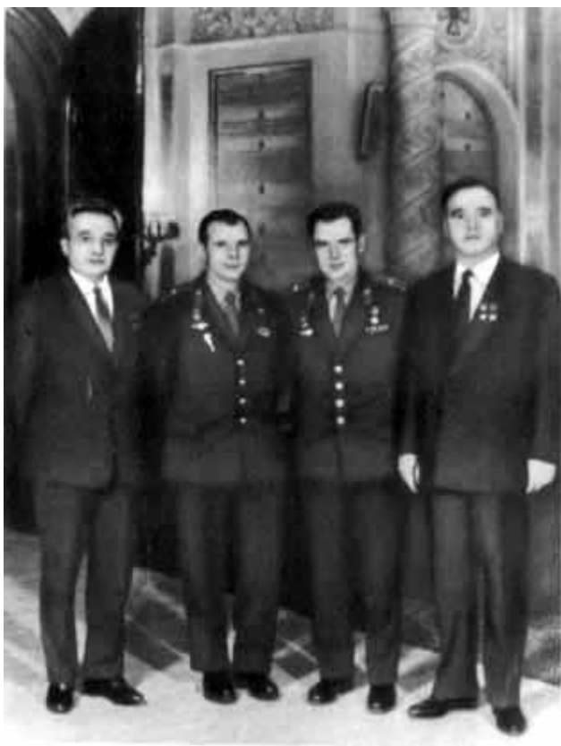
58 – В Георгиевском зале Кремля. Слева направо: А. И. Микоян, Ю. А. Гагарин, Г. С. Титов, А. С. Яковлев.