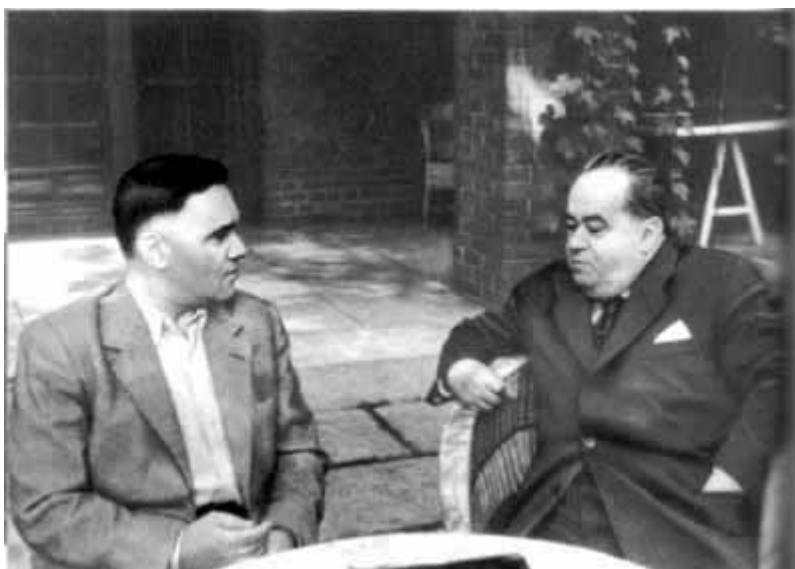
50 – Встреча с дирижером Большого театра народным артистом СССР Ю. Ф. Файером.