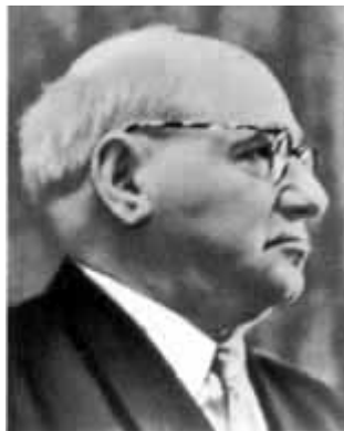
31 - Конструктор самолетов А. Н. Туполев.