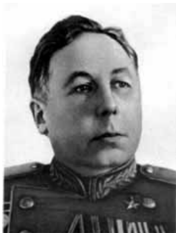
27 – Конструктор самолетов С. А. Лавочкин.