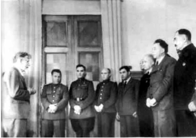
35 – М. И. Калинин в конце войны вручает награды авиационникам.