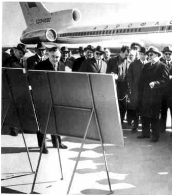
63 – Во время осмотра новых гражданских самолетов в аэропорту «Внуково». А. С. Яковлев докладывает руководителям партии и правительства. 1971 год.