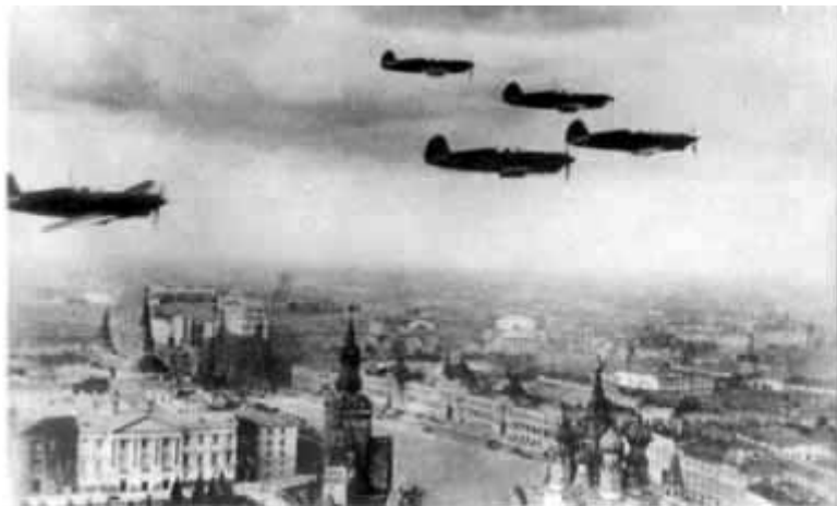
23 – Воздушный патруль ЯКов над Москвой во время войны.