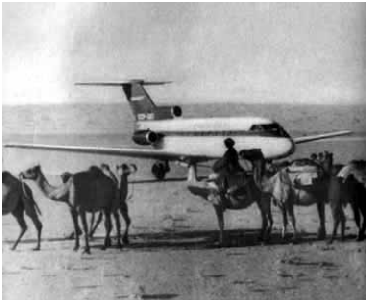
57 – ЯК-40 совершил посадку в песках Каракумов. 1970 год.