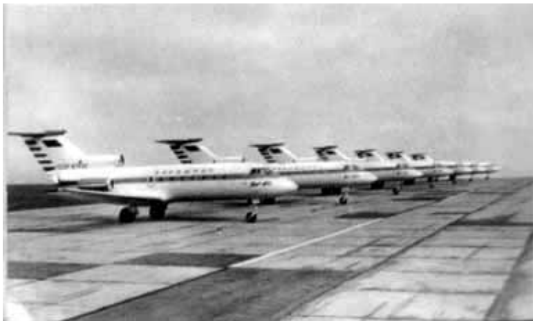
65 – Пассажирские реактивные самолеты Як-40 Саратовского авиационного завода пошли в большую серию.