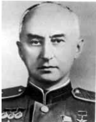
30 – В. Я. Климов - конструктор двигателей, устанавливавшихся на истребителях ЯК и бомбардировщиках Пе-2.