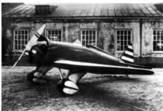
11 – УТ-1 – первый самолет, построенный на территории кроватной мастерской.