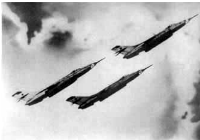
64 – Сверхзвуковые реактивные самолеты ЯК-28 в полете.