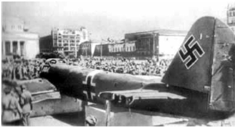
26 – Один из первых сбитых под Москвой фашистских бомбардировщиков выставлен для осмотра на площади Свердлова.