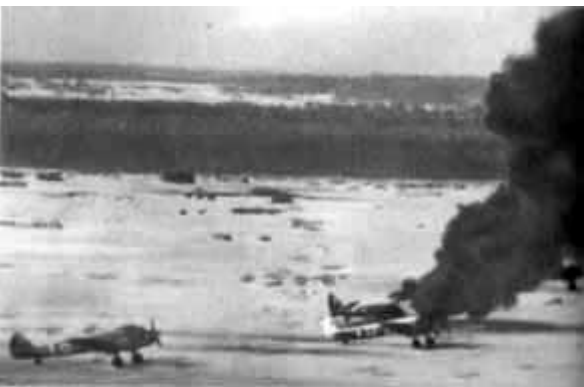
39 – После атаки ИЛов горят «Юнкерсы».