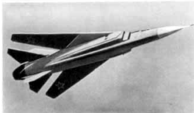
56 – Реактивный самолет с изменяемой в полете геометрией крыла.