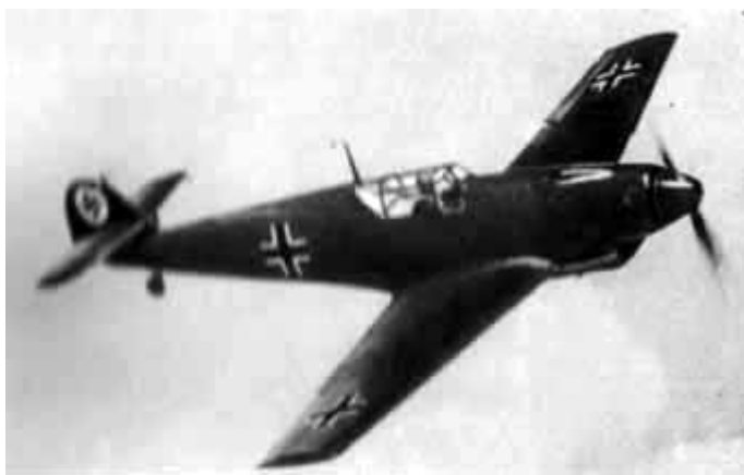
25 – Немецкий истребитель «Мессершмитт-109».