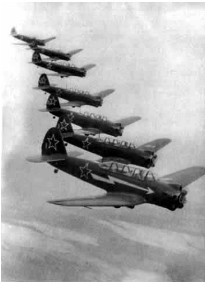
49 – Спортсмены Центрального аэроклуба на самолетах ЯК-18. Тренировка перед парадом.