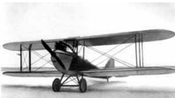
09 – Первый самолет А. С. Яковлева. 1927 год.