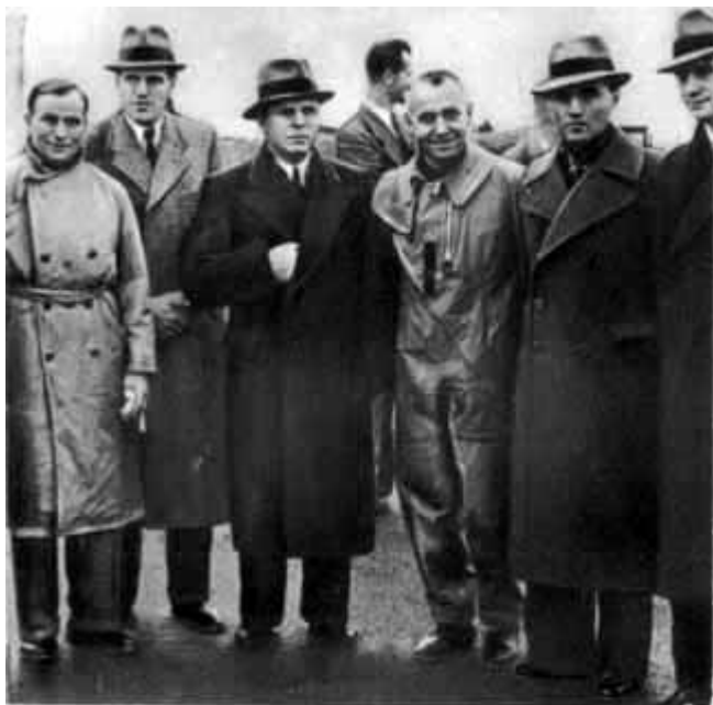
24 – Группа советских специалистов на встрече с немецким конструктором Мессершмиттом (второй слева). 1940 год.