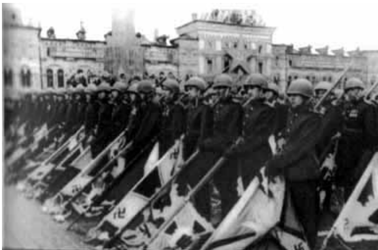
41 – На параде Победы. 1945 год.