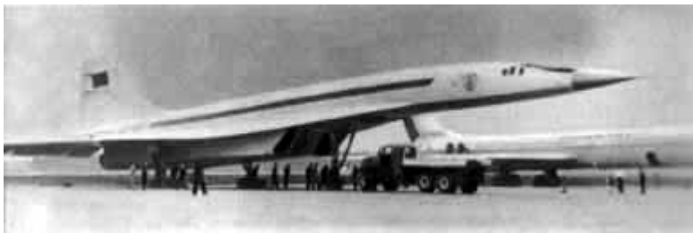
62 – Пассажирский лайнер со сверхзвуковой скоростью полета ТУ-144.