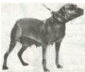
Хани Джина - дочь чемпиона Рэскела-мл.