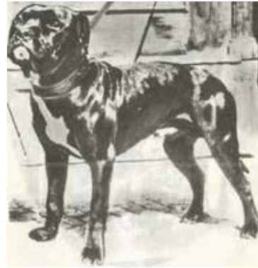
Первый пит-буль, ввезенный в Югославию (1984 г.) - Блэк Мэджик (Макс).