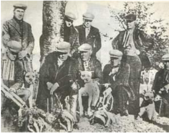
Охотники "вооружённые" пит-булями после успешной охоты на барсуков (Голландия, 1920 г.).