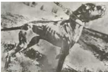
Чемпион Чайнемен, лауреат "Книги почёта".