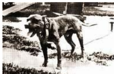
Дикон (Дьякон) - внук Трэмпя Ред Боя.