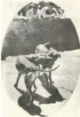
На ринге неприкосновенны. Профессиональный бой пит-булей (Техас, 1969 г.).