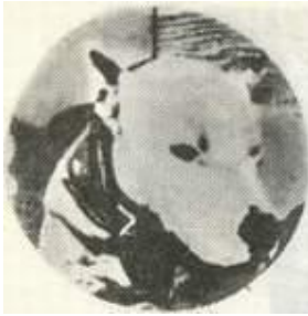
Полли. Лучшие собаки Говарда Хейнцля.