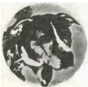
Гринго. Лучшие собаки Говарда Хейнцля.