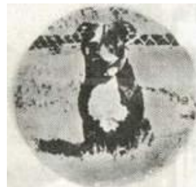
Питер. Лучшие собаки Говарда Хейнцля.