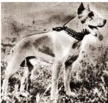
Джайдж Тюдора. 1900 г.