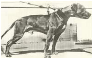
Гранд-чемпион Бак (С.Т.П.).