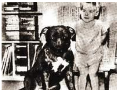
Великие бойцы и ещё большие баловни.