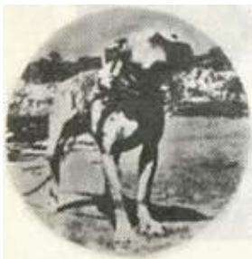
Клэнси. Лучшие собаки Говарда Хейнцля.