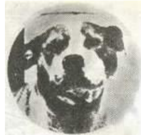
Марго. Лучшие собаки Говарда Хейнцля.