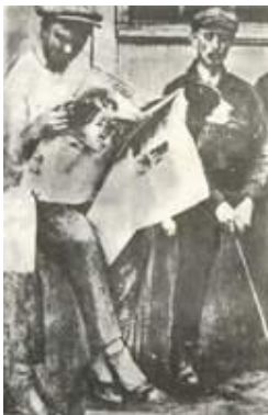
Чемпион мира в тяжелом весе Джек Демпси со своим спарринг-партнером и пит-булем.