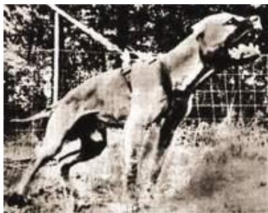
Рейзин Соррелса - чемпион на ринге и по экстерьеру.