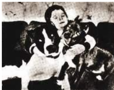
Пит-були в семейном кругу.