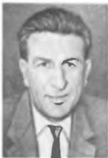
Е. Л. ФЕЙНБЕРГ