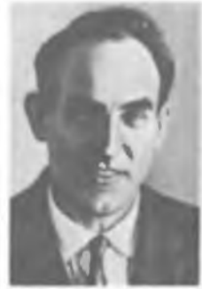
В. Л. ГИНЗБУРГ

Работы посвящены физике космических лучей, радиоактивности, атомной физике, оптике. В 1912 открыл космические лучи (Нобелевская премия, 1936), исследовал вариации их интенсивности. Определял тепловыделение радия и количество частиц, испускаемых 1 г радия в 1 с. Открыл «ионный ветер».