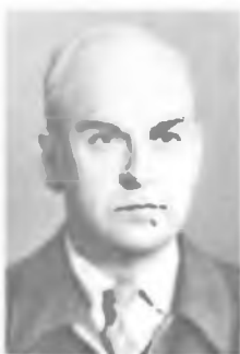
Б. Г. ЛАЗАРЕВ

Осуществил исследования магнитных свойств тел в широком диапазоне температур. Установил в 1895 независимость магнитной восприимчивости диамагнетиков от температуры и ее обратно пропорциональную зависимость от температуры для парамагнетиков (закон Кюри). Открыл для железа существование температуры, выше которой у него исчезают ферромагнитные свойства (точка Кюри) и скачкообразно изменяются некоторые другие свойства, например удельная электропроводность и теплоемкость (1895).