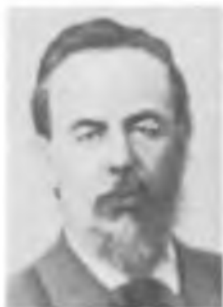
А. С. ПОПОВ