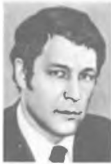
Ю. В. ГУЛЯЕВ

С 1926 — профессор Эрлангенского ун-та, с 1939 — директор Физического ин-та Пражского ун-та.