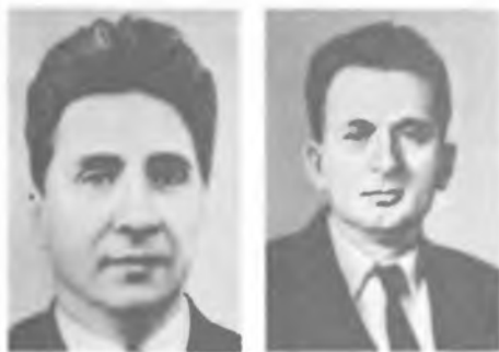
Ю. Д. ПРОКОШКИН А. М. ПРОХОРОВ

Золотая медаль И. В. Курчатова (1965) [392].