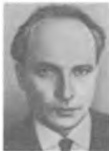
Ф. Л. ШАПИРО

Исследования посвящены нейтронной физике. Обнаружил и объяснил отклонение от закона Ферми, предложил новый метод поляризации нейтронов фильтрацией их через поляризованную протонную мишень и метод дифракции нейтронов для нейтронно-структурных исследований, основанный на измерении энергии нейтронов при заданном угле дифракции. Предложил и применил метод обратной геометрии для изучения неупругих взаимодействий медленных нейтронов. Впервые создал систему, сочетающую импульсный реактор с электронным инжектором. Выдвинул и осуществил идею измерения магнитных моментов нейтронных резонансов по их сдвигу в магнитном поле. В 1968 впервые получил пучок ультракоротких нейтронов и экспериментально подтвердил эффект их полного отражения при любых углах падения.