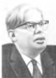
Н. Н. БОГОЛЮБОВ

Член Петербургской (1783) и Парижской АН (1789) [52, 557]. БЛЭКЕТТ Патрик Мейнард Стюарт (18.XI 1897—13.VII 1974) — английский физик, член Лондонского королевского об-ва (1933), президент (1965—70). Р. в Лондоне. Окончил Кембриджский ун-т (1919). В 1923—33 работал в Кавендишской лаборатории, в 1933—37 и 1953—65 — профессор Лондонского, в 1937—53 — Манчестерского ун-тов.