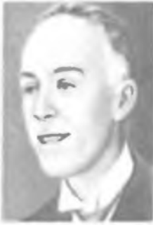
Л. де БРОЙЛЬ