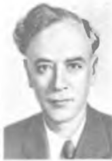
Л. Д. ЛАНДАУ