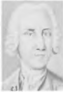
Г. В. РИХМАН