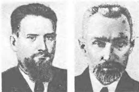
И. В. КУРЧАТОВ

С 1943 возглавлял исследования по овладению ядерной энергией, принимал участие в осуществлении экспериментов. Выполнил (1943) так называемые «экспоненциальные опыты», в результате которых были получены данные, необходимые для разработки ядерного реактора и создания методов расчета ядерных реакторов. Совместно с сотрудниками осуществил (декабрь 1946) запуск первого советского уран-графитового реактора. Непосредственно участвовал в разработке и запуске последующих более мощных ядерных реакторов, оставаясь научным руководителем работ по созданию в нашей стране атомной промышленности и техники. Под его руководством в СССР развивались исследования в различных областях ядерной физики, создавались атомная (1949) и водо-