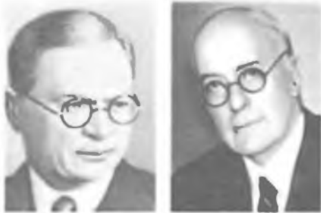
П. П. ЛАЗАРЕВ

После победы Великой Октябрьской социалистической революции Лазарев принимает активное участие в организации советской науки. В 1917–22 – директор физиче-