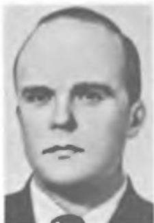
Е. П. ВЕЛИХОВ