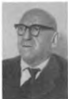
Э. В. ШПОЛЬСКИЙ