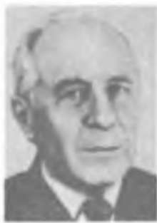
В. В. МИГУЛИН

технического ин-та, с 1969 — директор Ин-та земного магнетизма, ионосферы и распространения радиоволн АН СССР. С 1935 преподает в Московском ун-те (с 1948 — профессор, в 1957–69 — зав. кафедрой).