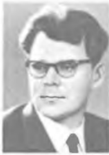
А. В. ГАПОНОВ-ГРЕХОВ