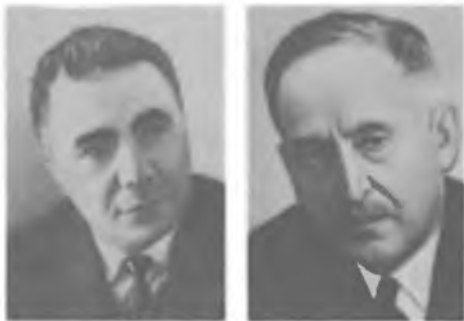
В. А. АМБАРЦУМЯН