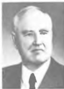
П. П. БРАЗДЖИОНАС

Работы посвящены математике, механике, оптике, астрономии, метеорологии. В трактате «Теория натуральной философии, приведенная к единому закону сил, существующих в природе» (1758) изложил основные положения своего учения о так называемом динамическом атомизме, впервые развил теорию строения вещества, основанную на представлении о непротяженных неделимых идентичных материальных точках