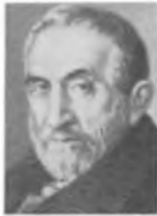
О. Д. ХВОЛЬСОН