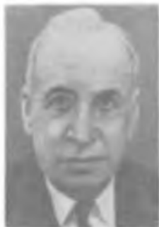
Дж. ВАН ФЛЕК