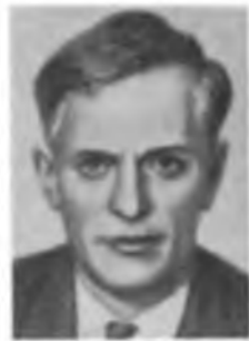
А. Е. ЧУДАКОВ

сеянии (модель Чу — Лоу) и формулы для сечений фоторождения мезонов.