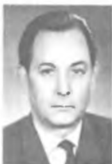
Х. П. КЕРЕС