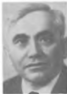
Б. М. ВУЛ

первых полупроводниковых диодов, транзисторов и солнечных элементов. Дальнейшие исследования в области фотоэлектрических явлений привели к созданию кремниевых фотоэлементов солнечных батарей. Создал диффузионный транзистор и предложил p-n -переходы в полупроводниках использовать в качестве нелинейных конденсаторов. При непосредственном участии Вула созданы (1963) первые в СССР полупроводниковые лазеры (Ленинская премия, 1964).