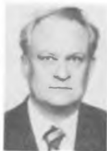
К. К. РЕБАНЕ

ческом ин-те АН СССР, в 1965—69 — зав. лабораторией Ин-та полупроводников АН СССР, в 1969—71 — в Ин-те ядерной физики Сибирского отделения АН СССР, в 1971—77 — зав. сектором Ин-та спектроскопии АН СССР. С 1977 — зам. директора Ин-та автوماتики и электрометрии Сибирского отделения АН СССР и профессор, зав. кафедрой Новосибирского ун-та.