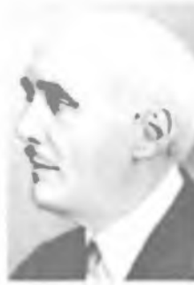
М. де БРОЙЛЬ