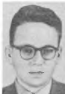
Д. В. ШИРКОВ

сти, магнетизма. Открыл эффект де Гааза — ван Альфена во многих металлах, построил (1939) его теорию и использовал для определения формы и размеров поверхности Ферми металлов. Благодаря Шёнбергу этот эффект превратился в мощное средство исследования поверхности Ферми. В частности, изучил энергетический спектр висмута и определил его поверхность Ферми. Выполнил пионерские исследования глубины проникновения магнитного поля в сверхпроводник. Внес вклад в изучение сверхпроводящего состояния.