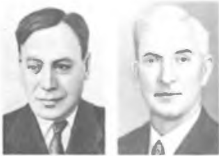
Л А. И. ЛЕЙПУНСКИЙ Дж. ЛЕНАРД-ДЖОНС

лософ. Р. в Лейпциге. Учился в Лейпцигском и Йенском ун-тах, затем совершенствовал свои знания в Париже. С 1676 состоял на службе у ганноверских герцогов.