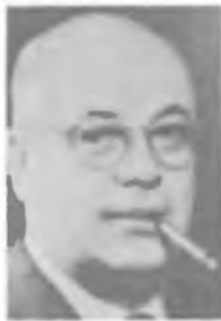
М Д. И. МЕНДЕЛЕЕВ К. МЕНДЕЛЬСОН