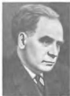
С. Н. ВЕРНОВ

С запуском первых советских ракет Вернов проводит измерения интенсивности космического излучения за пределами атмосферы. После создания в СССР первых искусственных спутников Земли появляются новые возможности для экспериментов. Вернов совместно с учениками и сотрудниками