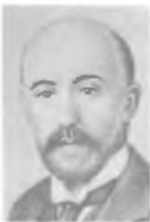
М. И. ДОЛИВО-ДОБРОВОЛЬСКИЙ