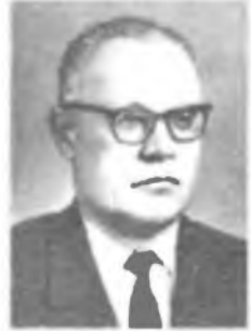
Ф. И. ФЕДОРОВ

Основные работы посвящены исследованию радиоактивности, изотопов и химической связи, физической химии. В 1911 впервые экспериментально доказал существование радиоактивных вилок, открыв существование радиоактивной вилки у радия-С. Независимо от Ф. Содди в 1913 сформулировал правило смещения при радиоактивном распаде (закон Содди — Фаянса) и разместил радиоэлементы трех радиоактивных рядов в периодической системе. Открыл ряд радиоактивных изотопов, в частности уран X_2 . В 1913 совместно с Ф. Панетом эмпирически установил правило соосаждения радиоактивных элементов в растворе (правило Фаянса — Панета).