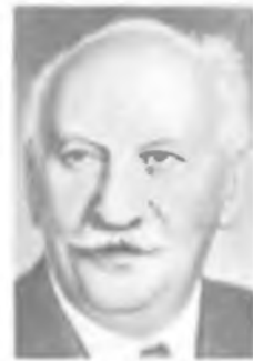
А. Ф. ИОФФЕ