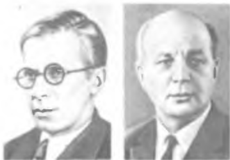
К С.Т. КОНОБЕЕВСКИЙ Б.П. КОНСТАНТИНОВ

рию старения. Построил ряд систем равновесные диаграммы состояния, предложил метод изучения равновесных состояний сплавов. Развил теорию восходящей диффузии, количественную теорию конденсации из молекулярного пучка. Один из первых начал изучение диаграмм состояния сплавов тяжелых металлов (уран, плутоний). Один из создателей радиационного материаловедения [236, 392].