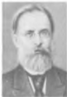
А. Г. СТОЛЕТОВ

методы измерения упругих констант кристаллов. Исследовал (с 1955) механические свойства многих металлов при температурах 4,2–1,6 К, открыл при этом ряд новых явлений. Внес вклад в изучение свойств нитевидных кристаллов. Разработал новый метод получения профилированных изделий и монокристаллов непосредственно из расплава (метод Степанова) [437].