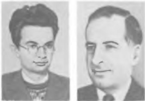
И. Я. ПОМЕРАНЧУК Б. М. ПОНТЕКОРВО

Государственные премии СССР (1950, 1952). Создал школу физиков-теоретиков [376, 392].