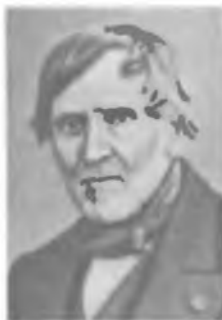
А. С. БЕККЕРЕЛЬ