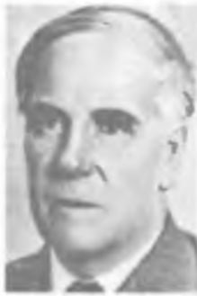
П. Л. КАПИЦА

Исследования относятся к геометрической и физической оптике, волоконной оптике и ее применениям, интерференционной микроскопии, фотоэлектронике, скоростной фотографии, лазерной технике, обработке информации. Первый получил неискаженное изображение при помощи жгута из регулярно уложенных стеклянных волокон, разработал технологию укладки волокон, предложил (1956) термин «волоконная оптика». Независимо от других разработал стеклянные волокна в оболочке из стекла, в которых исключались световые потери, технологию изготовления многожильных волокон. Исследовал передачу волноводных мод по волокнам малого диаметра, получил расширение спектральных характеристик волоконной оптики в инфракрасную область спектра, провел эксперименты с лазерными волокнами и волоконными усилителями, исследования характеристик передачи изображения волоконными жгутами.