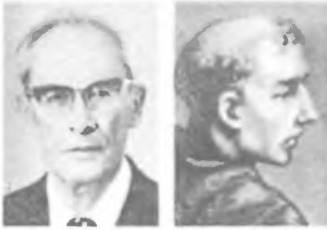
С. Л. МАНДЕЛЬШТАМ