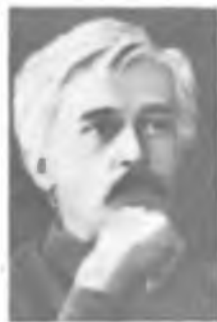
В. К. ЛЕБЕДИНСКИЙ

тического стекла и разработал кристаллическую теорию стеклообразного состояния, получившую подтверждение созданием ситаллов, провел широкие исследования по просветлению оптики, внедрению интерференционных методов в метрологию, атмосферной оптике, оптической локации. Под его руководством и при непосредственном участии создавались оптические установки для фотографирования быстропротекающих процессов (Государственная премия СССР, 1949), оптические квантовые генераторы и новые источники света.