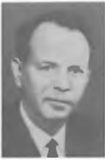
С. В. ВОНСОВСКИЙ