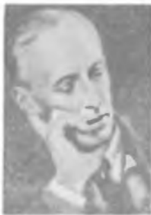
П. И. ЛУКИРСКИЙ

Основные работы посвящены физической электронике, физике рентгеновских лучей, ядерной физике. Автор ряда экспериментальных методов исследования, в частности метода сферического конденсатора, метода параллельного сдвига характеристик, ионизационного метода определения контактных потенциалов. Выполнил цикл работ по фотоэффекту, ставших классическими. Подтвердил уравнения Эйнштейна для фотоэффекта и получил точнейшее в то время значение постоянной Планка (1926). Подробно исследовал электронную эмиссию с поверхности тонких металлических пленок и их