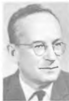
В. И. ВЕКСЛЕР