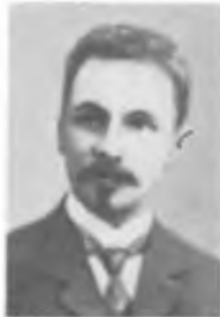
Б. Л. РОЗИНГ