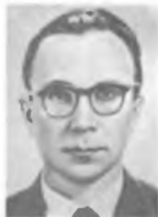
Ю. В. ШАРВИН

Государственная премия СССР (1971). Премия им. И. В. Курчатова (1977) [392, 518].