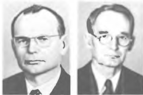
Л. М. БРЕХОВСКИХ

Создал школу физики акустики океана. С 1969 — академик-секретарь Отделения океа-