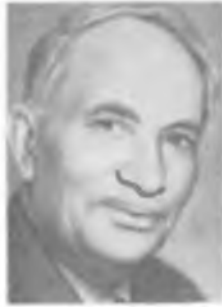
А. С. ПРЕДВОДИТЕЛЕВ

ПОРТА Джованни Баттиста (между 3—15.X 1535—4.II 1615) — итальянский ученый.