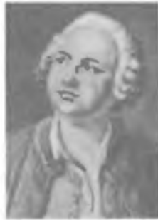
М. В. ЛОМОНОСОВ