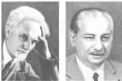
Н. Н. АНДРЕЕВ Э. Л. АНДРОНИКАШВИЛИ

Работы посвящены физике низких температур, физике космических лучей, радиационной физике твердого тела, ядерной технике, биофизике. Осуществленные Андроникашвили в Ин-те физических проблем АН СССР эксперименты по изучению сверхтекучести жидкого гелия положили начало исследованиям в области квантовой гидродинамики. Исследовал свойства жидкого гелия II, доказал (1946) экспериментально существование в гелии II двух компонент — нормальной и сверхтекучей (Государственная премия СССР, 1952). В 1961 создал первую в нашей стране низкотемпературную петлю оригинальной конструкции, что дает возможность облучать в ядерном реакторе различные вещества при температурах, близких к абсолютному нулю. Провел исследования по физическим основам мощных источников гамма-излучения радиационных контуров.