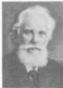
Н. А. УМОВ

УОЛТОН Эрнест Томас Сиптон (р. 6.X 1903) — ирландский физик, член Ирландской АН. Р. в Дангарване. Окончил Дублинский ун-т (1928). В 1930—34 работал в Кембриджском ун-те, в 1934—74 — в Дублинском ун-те (с 1946 — профессор), одновременно