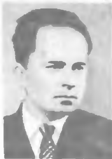
Б. Б. КАДОМЦЕВ

Работы относятся к физике плазмы и проблеме управляемого термоядерного синтеза, магнитной гидродинамике, в частности разработке теории механизмов неустойчивости плазмы в конкретных системах и теории турбулентной плазмы в магнитных ловушках. Независимо от других предсказал желобковую неустойчивость разреженной плазмы, разработал основы теории слабой турбулентности, учитывающей рассеяние волн на частицах и так называемые процессы распада волн. Теоретически объяснил ряд явлений неустойчивости в системах для удержания плазмы и предложил методы для подавления неустойчивости. За участие в исследовании неустойчивости высокотемпературной плазмы в магнитном поле и создания метода ее стабилизации «магнитной ямой» удостоен в 1970 Государственной премии СССР. В 1960 совместно с А. В. Недоспасовым показал, что неустойчивость