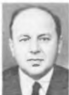
Ю. Н. ДЕНИСЮК