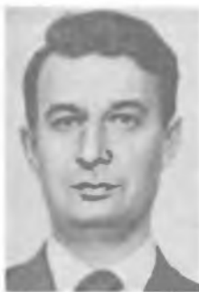
В. В. ЕРЕМЕНКО

ма ограничены, известно лишь, что его деятельность проходила в Александрии в начале III в. до н. э. Является автором первого дошедшего до нас трактата по математике («Начала»), в котором подведен итог предшествующему развитию древнегреческой математики, в частности изложены планиметрия, стереометрия и ряд вопросов теории чисел. Создатель геометрической системы (евклидовой геометрии), на которой основывается вся классическая физика.