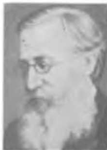
Ф. Ф. ПЕТРУШЕВСКИЙ

Работы относятся также к изучению физико-химических явлений, эффектов холодного свечения тел, метеорологии, гидротехнике. Активный сторонник кислородной теории горения. Первый из отечественных физиков выполнил пионерские исследования в области люминесценции, изучил явления хемилюминесценции, биолюминесценции и фотолюминесценции и установил различие между ними [368, 391].