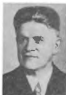
П. А. ЧЕРЕНКОВ

вице-президент (с 1963). Р. в Бухаресте. Окончил Бухарестский ун-т (1929), с 1937 — его профессор, одновременно с 1956 — заместитель директора Ин-та атомной физики. В 1962—63 — вице-директор Объединенного ин-та ядерных исследований (г. Дубна).