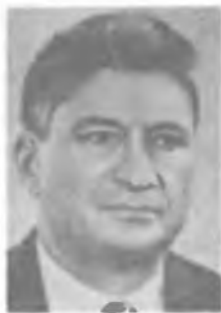
А. Б. МИГДАЛ

МИГУЛИН Владимир Васильевич (р. 10.VII 1911) — советский физик, чл.-кор. АН СССР (1970). Р. в Серее (ныне Фурманов Ивановской обл.). Окончил Ленинградский политехнический институт (1932). В 1932–34 работал в Ленинградском электрофизическом ин-те, в 1934–41 — в Физическом ин-те АН СССР, в 1946–51 — зав. сектором Теплотехнической лаборатории АН СССР, в 1951–54 — директор Сухумского физико-