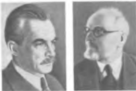
Д.А. РОЖАНСКИЙ Д.С. РОЖДЕСТВЕНСКИЙ

Работы посвящены физической и инструментальной оптике, атомной физике, в частности исследованию аномальной дисперсии, теории спектров, теории микроскопа. В 1909 разработал новый метод количественного изучения аномальной дисперсии света — метод скрещивающегося интерферометра