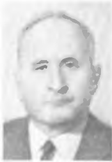
Д. А. ФРАНК-КАМЕНЕЦКИЙ