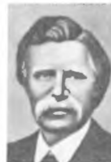
Д. Э. ЮЗ