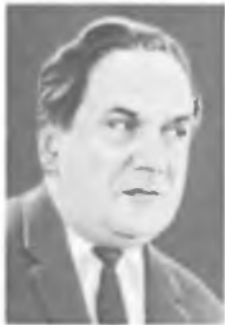
Б. И. ВЕРКИН

(1921). В 1926—28 — профессор Лейпцигского, 1928—48 — Цюрихского, 1948—69 — Чикагского ун-тов.