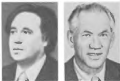
Л. П. ПИТАЕВСКИЙ

Работы посвящены физике плазмы, квантовой механике, макроскопической электродинамике, статистической физике, физике низких температур, теории сверхтекучести. Исследовал свойства жидкого гелия. Совместно с В. Л. Гинзбургом предложил (1958) полуфеноменологическую теорию сверхтекучести вблизи фазового перехода. В 1959 предска-