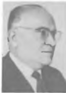
А. Л. МИНЦ

Работы посвящены радиотехнике (радиотелеграфия, радиотелефония, радиовещание, мощное радиостроение, радиоэлектроника, электроакустика) и ускорительной технике (создание ускорителей и радиоэлектронных схем к ним). Проектировал и строил радиостанции: 100-киловаттную им. ВЦСПС (1929); 500-киловаттную им. Коминтерна (1933); 150-киловаттную им. Косиора (1937); РВ-96 (1938); 1200-киловаттную (1943). Был научным руководителем разработки систем радиоэлектроники больших советских циклических и линейных ускорителей, в частности синхрофазотрона на энергию 10 млрд. эВ в г. Дубне (Ленинская премия, 1959), протонного синхротрона с сильной фокусировкой на энергию 7 млрд. эВ Ин-та теоретической и экспериментальной физики, Серпуховского протонного синхротрона на 70 млрд. эВ