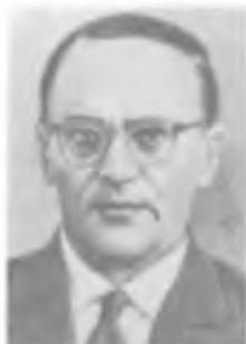
А. З. ПЕТРОВ

Обнаружил зависимость силы тока от площади поперечного сечения проводника. Исследовал электролитическое действие электрического тока и явление электролиза, электропроводность различных веществ, установил важность электроизоляции и использовал покрытие металлического проводника изоляционным слоем. Изучал электрический разряд в вакууме, нашел зависимость его от материала, формы и полярности электродов, расстояния между ними и степени разряженности. Всесторонне исследовал электризацию тел, показал возможность электризации металлов трением, предложил новые способы электризации тел. Разработал оригинальные конструкции электростатических машин и приборов. Свои исследования в этой области описал в трудах «Сообщение о гальвано-вольтовых исследованиях» (1803) и «Новые электрические опыты» (1804).