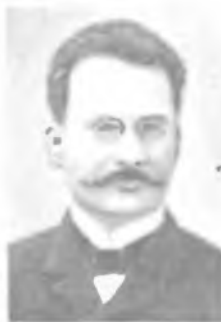
М Д. МИЛЛЕР Р. МИЛЛИКЕН М. Д. МИЛЛИОНЩИКОВ Г. МИНКОВСКИЙ

личество опытов по точному определению заряда электрона (в 1910 получил значение 4,891 \cdot 10^{-10} , в 1913— 4,774 \cdot 10^{-10} электростатических единиц). Тем самым экспериментально была доказана дискретность электрического заряда и впервые достаточно точно измерена его величина. Проверил уравнение Эйнштейна для фотоэффекта в области видимых и ультрафиолетовых лучей и определил постоянную Планка (1914). За работы в области элементарных зарядов и фотоэлектрического эффекта удостоен в 1923 Нобелевской премии.