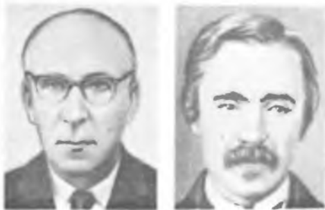
С. Э. ФРИШ

Исследования относятся к оптике, механике, электромагнетизму. Разработал в 1850 метод измерения скорости света при помощи вращающегося зеркала (метод Фуко) и измерил скорость света в воздухе и воде. Скорость света в воде по Фуко составила 3/4 от скорости света в воздухе, что окончательно