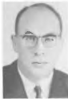
И. С. ШАПИРО

платины, серебра и меди и непосредственно измерил заряды ядер, чем окончательно подтвердил теорию атома Резерфорда и вывод о том, что заряд ядра равен порядковому номеру элемента. В 1932, исследуя излучения, возникающие при облучении бериллия альфа-частицами, показал, что оно является потоком электрически нейтральных частиц — нейтронов (Нобелевская премия, 1935).