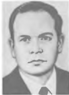
А. А. АБРИКОСОВ

идентичность термодинамической. Открыл ядерный антиферромагнетизм (1970) и ядерную прецессию нейтронов (1973).