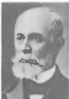
А. А. БЕККЕРЕЛЬ