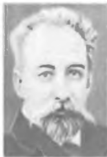
П. Н. ЛЕБЕДЕВ