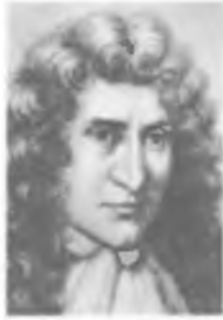
Н. Д. ПАПАЛЕКСИ