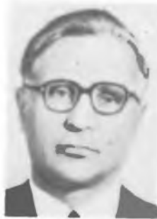
С. Г. РАУТИАН

РАУТИАН Сергей Глебович (р. 18.XII 1928) — советский физик, чл.-кор. АН СССР (1979). Р. в Ленинграде. Окончил Московский ун-т (1952). В 1953—65 работал в Физи-