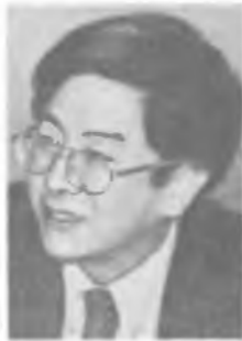
М. А. ЛЕОНТОВИЧ