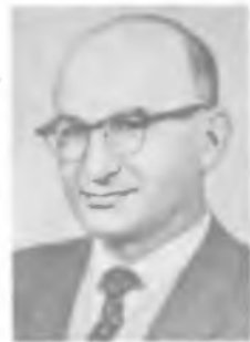
Е. М. ЛИФШИЦ