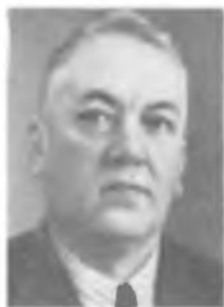
С. Я. СОКОЛОВ

ного рельефа, механического сканирования. с помощью электронно-акустической трубки-преобразователя) и создал аппаратуру звуковидения, названную им ультразвуковым микроскопом. В 1951 за изобретение (1948) ультразвукового микроскопа, усовершенствование и промышленное освоение методов ультразвуковой дефектоскопии удостоен Государственной премии СССР. Заложил основы акустической голографии.