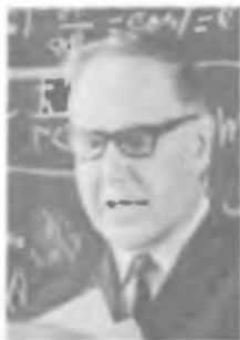
М. А. МАРКОВ

Один из первых советских теоретиков начал разрабатывать программы экспериментов для решения принципиальных проблем физики элементарных частиц на ускорителях. Ряд прогнозов, предложенных Марковым, со временем подтвердились, в частности относительно поисков нестабильных, короткоживущих элементарных частиц (резонансов). Исследования посвящены также моделям и классификации элементарных частиц. В по-