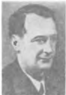
Б. С. ДЖЕЛЕПОВ