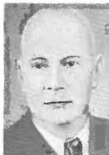
А. П. АЛЕКСАНДРОВ

молекулярную теорию вязко-упругих свойств жидкостей, в 1975–80 — теорию ангармонических колебаний в кристаллах с вакансиями [8].