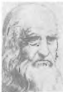
Э. Х. ЛЕНЦ