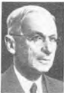
Ю. Б. ХАРИТОН