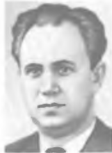
В. Г. БАРЬЯХТАР

за Барлоу). Сконструировал (1820) раннюю модель электрического мотора (колесо Барлоу). Экспериментально подтвердил постоянство силы тока во всей цепи. Подготовил так называемые математические «таблицы Барлоу».