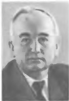
Л. Ф. ВЕРЕЩАГИН