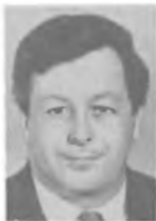
И. И. ГУРЕВИЧ

Исследования посвящены электромагнетизму, молекулярной физике, точному приборостроению, экспериментальному подтверждению релятивистской динамики, статистической термодинамике. Изобрел ряд прецизионных инструментов, развил методику измерения отклонения частиц в электро-