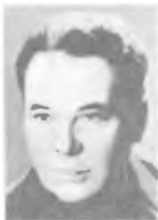
Д. Д. ИВАНЕНКО