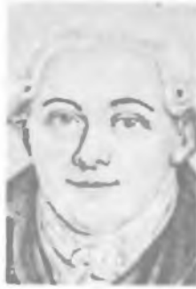
И. М. ЛИФШИЦ