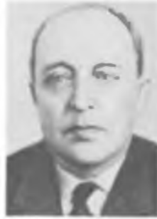
С. М. РЫТОВ

Работы посвящены теории колебаний, одним из основоположников которой он