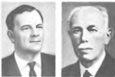
Л. А. АРЦИМОВИЧ

С 1957 – академик-секретарь Отделения общей физики и астрономии АН СССР. Герой Социалистического Труда (1969) [32]. АСТОН Фрэнсис Уильям (I. IX 1877 – 20. XI 1945) – английский физик и химик, член Лондонского королевского об-ва (1921). Р. в Харборне. Окончил Бирмингемский ун-т (1898), где работал в 1903–09, в