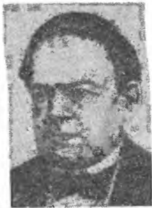
Б. С. ЯКОБИ