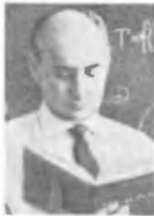
Г. Н. ФЛÉРОВ

Работы относятся к квантовой механике, квантовой электродинамике, квантовой теории поля, теории многоэлектронных систем, статистической физике, теории относительности, теории гравитации, радиофизике, математической физике, философским вопросам физики. Уже в первых работах по квантовой механике получил ряд результатов, способствовавших ее развитию (обобщение уравнения Шредингера на случай магнитного поля и релятивистский случай движения заряженной частицы в электромагнит-