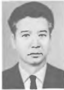
М. И. АВЕНАРИУС