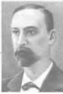
Я. Б. ЗЕЛЬДОВИЧ