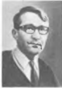
Р. З. САГДЕЕВ