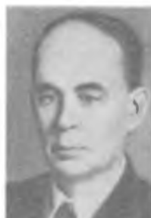
И. М. ФРАНК

Огромное теоретическое и практическое значение имеют труды Фока по теории дифракции, в частности он разработал строгую теорию распространения радиоволн над земной поверхностью без учета атмосферы (Государственная премия СССР, 1946).