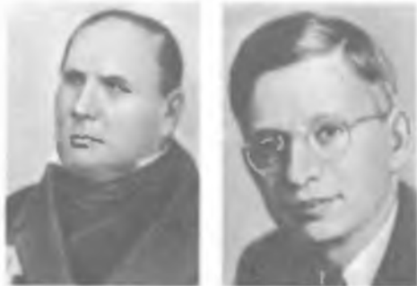
М. В. ОСТРОГРАДСКИЙ Р. ПАЙЕРЛС

Основные работы в области математического анализа, математической физики, теоретической механики. Решил ряд важных задач гидродинамики, теории теплоты, упругости, баллистики, электростатики, в частности задачу распространения волны на поверхности жидкости (1826). Получил дифференциальное уравнение распространения тепла в твердых телах и жидкостях. Доказал в 1828 теорему о преобразовании интегралов. Известен теоремой Гаусса – Остроградского в электростатике. Развил принцип возможных перемещений, вариационные принципы механики, в частности сформулировал (1850) общий вариационный принцип для неконсервативных систем. Работы Остроградского посвящены также теории чисел, алгебре и теории вероятностей.