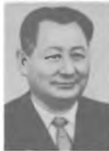
У. А. АРИФОВ

(1931). В 1935—41 — ассистент Среднеазиатского (ныне Ташкентского) ун-та, в 1945—56 и 1963—67 — директор Физико-технического ин-та АН Узб. ССР, в 1956—62 — Ин-та ядерной физики АН Узб. ССР и в 1966—76 — Ин-та электроники АН Узб. ССР (с 1963 — также зав. кафедрой Ташкентского политехнического ин-та).