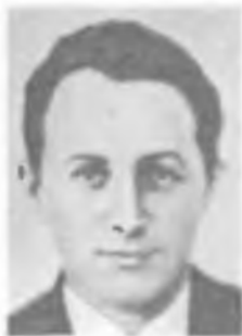
Ю. А. ОСИПЬЯН

ОСИПЬЯН Юрий Андреевич (р. 15.II 1931) — советский физик, академик (1981, чл.-кор. 1972). Р. в Москве. Окончил Московский ин-т стали и сплавов (1955). В 1955—62 работал в Ин-те металлургии и физики металлов Центрального научно-исследовательского ин-та черной металлургии. С 1963 — в Ин-те физики твердого тела АН СССР (с 1973 — директор), также профессор Московского, физико-технического ин-та (с 1970).