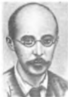
А. А. ФРИДМАН