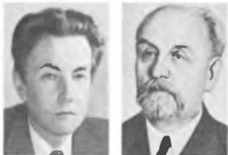
В. И. ТРЕФИЛОВ