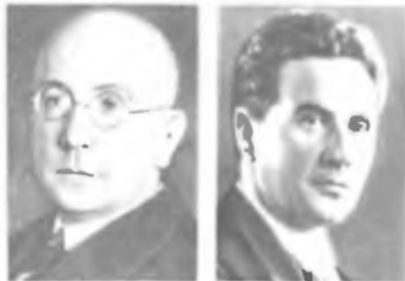
В. КОССЕЛЬ Д. КОСТЕР

ин-т (1926). В 1929—34 работал в Сибирском физико-техническом ин-те, в 1939—52 — в Харьковском физико-техническом ин-те, в 1952—62 — профессор Харьковского политехнического ин-та. С 1962 — в Ин-те ядерной физики АН Казахской ССР.