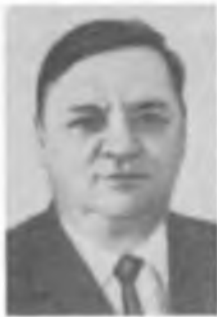
К. И. ЩЁЛКИН