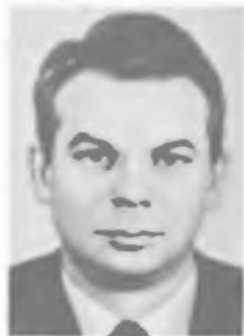
Ж. И. АЛФЕВОВ

сивную генерацию протонов быстрыми нейтронами, открыл ливни нового типа — так называемые узкие ливни, получил первые указания на существование частиц с массами, промежуточными между массой мюона и протона, выдвинул идею о существовании в составе космического излучения большого количества нестабильных частиц и т. п.