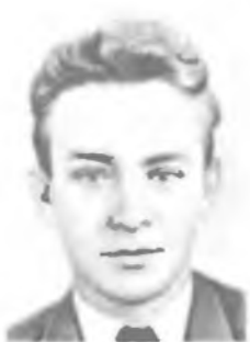
Л. В. КЕЛДЫШ