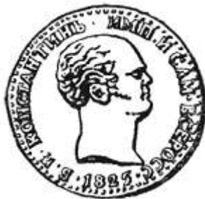
Рубль Константина Павловича.

Может быть, никто из посторонних так и не узнал бы про злополучный «секретный рубль», если б среди людей, занимавшихся его изготовлением, не оказалось любителей-нумизматов.