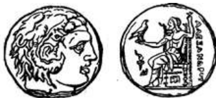
Серебряная монета Александра Македонского.