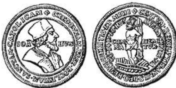
Монета, выпущенная по случаю казни Яна Гуса.

Вот одна из таких монет. Она выпущена по случаю казни великого чеха – Яна Гуса. Он боролся за свободу своего народа, против власти пап и постыдных злодеяний церкви. И церковь отомстила ему: в 1415 году его сожгли живьем как еретика.