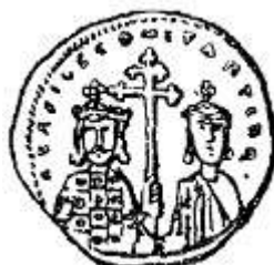
Византийский золотой солид (976 – 1025 годы)

На территории СССР часто находят клады таких монет. Иногда попадаются монеты, разрезанные на части. Их делили во время торговых сделок.