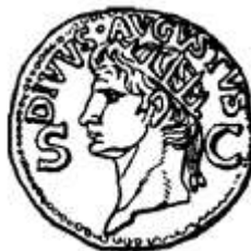
Монета с изображением Августа.

Глубокие морщины бороздят лбы; большие вздернутые носы, упрямые подбородки. Древние граверы без прикрас вырезали портреты царей Понта. Сохранили монеты и дорогие всему культурному человечеству черты лица знаменитых поэтов, писателей, философов. Сапфо, Геродот. Гиппократ, Гораций!..