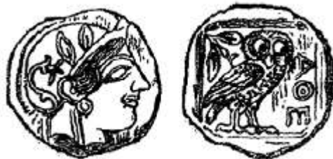
Греческая (афинская) тетрадрахма V века

В древней Греции были в обращении драхмы, оболы, халкосы и вошедшая в поговорку мелкая монета – лепта.