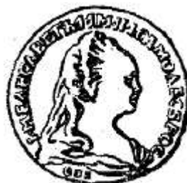
Империял Елизаветы Петровны

А расходы были огромные. Велись войны, шло преобразование России. И Петр все увеличивал выпуск монет. Они обесценивались. Рубль «худел». Сперва в нем было 8\frac{1}{3} золотника чистого серебра, потом 5\frac{5}{6} и, наконец, чуть больше 4 золотников.