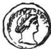
Монета с изображением Мессалины

Чаще всего цари изображали на монетах самих себя. Но иногда уступали место царицам, наследникам и другим членам царского дома. На некоторых римских монетах отчеканены изображения императриц. «Портретная галерея», составленная из таких монет, служит средством изучения... мод на женские прически. И делается это не из праздного любопытства.