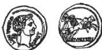
Динарий с изображением Юлия Цезаря.