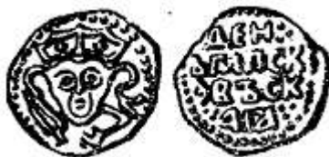
Денга Пскова времени самостоятельности

При Иване III Русь стала единым государством. Теперь уже каждый князь не мог самостоятельно чеканить свои монеты. Во главе государства стоял монарх, только он имел на это право. На выпущенной им денге стояла гордая надпись: «Государь всея Руси».