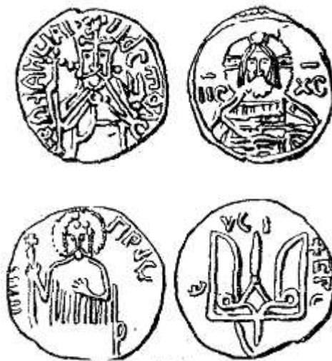
Сребреники Владимира I. XI век

Монеты русских князей делались из золота и серебра. На них ставились имена князей Владимира, Святополка и Ярослава и родовой знак Рюриковичей. Некоторые имели надписи, которые долго никто не мог прочитать. На златниках и сребрениках Владимира на оборотной стороне – его имя и изображение Иисуса Христа, на другой – портрет князя и родовой знак.