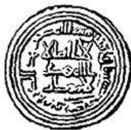
Куфический дирхем (706–707 годы)