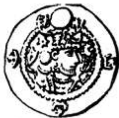
Драхма сасанидского Царя Ковада (489–531 гг. н. э.).

Как заманчиво увидеть портрет человека, который жил за тысячу лет до нашего времени! Такую возможность иногда дают нам «каменные книги» – рисунки и надписи, сделанные на камнях. Но камень легко разрушается, он открыт воде, ветру и вихрям все стирающего песка. Немало памятников рушилось во время ураганов, землетрясений, войн. А маленькие монетки, на которых в тысячах экземпляров выбит портрет знатного человека, донесли его до наших дней.