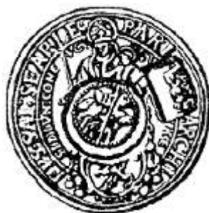
«Ефимок с признаком» Надчеканка на талере архиепископа Зальцбурга

Ставили на иоакимсталере и копеечный чекан (всадник с копьём). Такие монеты назывались «ефимок с признаком». Они равнялись 64 копейкам.