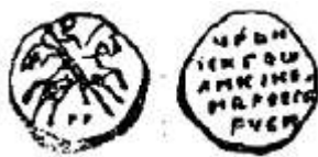
Копейка Ивана Грозного

В 1534 году в правление Елены Глинской, матери Ивана Грозного, была создана единая для всего государства денежная система. Были установлены строгие правила чеканки монет, созданы образцы. На денге мелкого веса, сделанной из серебра, изображался всадник с мечом. Эти монеты получили название мечевых. На денгах крупного веса, тоже серебряных, изображался всадник с копьем в руках. Они назывались копейными денгами.