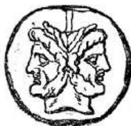
Асс, римская монета с изображением Януса

Среди множества богов древних римлян был такой, который ведал всеми начинаниями, изобретениями. Ему подчинялось время. Бога называли Янусом и изображали с двумя лицами, обращенными в разные стороны. В честь Януса первый месяц года – январь – назвали его именем. Начинал Рим войну, открывали двери храма Януса, кончалась война – закрывали. Римляне верили, что все важное на земле создано волей богов. Януса они считали творцом первой монеты.