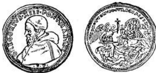
Монета в память Варфоломеевской ночи с изображением папы Григория XIII.

В ночь на 24 августа 1572 года католики Франции по наущению папы перерезали 2000 своих религиозных противников – гугенотов. Эта ночь получила название Варфоломеевской. И это «радостное» для нее событие церковь отметила выпуском монеты. На одной стороне ее – портрет вдохновителя резни, папы Григория XIII, на другой – ангел с мечом и крестом перед горой поверженных тел.