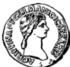
Монета с изображением Агриппины (старшей).