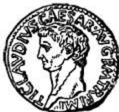
Монета изображением Клавдия.