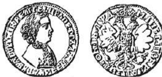
Серебряный рубль 1704 года

На одной стороне рубля был портрет Петра I и надпись: «Царь Петр Алексеевич», на другой стороне – двуглавый орел, год выпуска и надпись: «московский рубль».