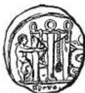
Греческая монета IV века до н. э. с изображением дельфийского треножника.