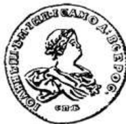
Рубль Ивана Антоновича 1741 года.

Шел к концу 1825 год. Вдалеке от столицы России, в городе Таганроге, умер император Александр I. Так как детей у него не было, престол переходил к брату покойного, Константину. Лишь мать-царица да три-четыре приближенных знали, что Константин еще в 1819 году отказался от своих прав на престол и что Александр I давно подписал манифест, которым наследником назначался другой брат – Николай.