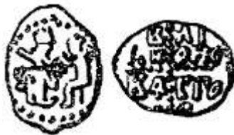
Денга Новгорода времени самостоятельности

Из рубля делали мелкие монеты – денги. (Денга стала к тому времени русской, а какой она была раньше, мы расскажем потом.) Для этого рублевую гривенку вытягивали в проволоку, рубили на мелкие куски, каждый из них расплющивали и чеканили монету. В Москве из рубля изготовляли 200 денег, в Новгороде – 216.