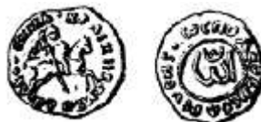
Денга Ивана III с арабской надписью

Но сильна еще была связь русских с Золотой Ордой, и монеты это отражали. Так, на монетах Дмитрия Донского на одной стороне написано: «Султан Тахтамыш Хан. Да упрочится царство его». На другой стороне знаки Дмитрия Донского – человек с секирой или петух. Надписи на двух языках: русском и арабском. Арабские надписи на русских монетах выбивались долго и после освобождения от ига. Так, на монетах Ивана III и Михаила Тверского по-арабски писалось и тут же переводилось по-русски: «Ибан – Иоанн, Михаила Тверча – Михаил Тверской, москов акчасы будыр – есть денга московская».