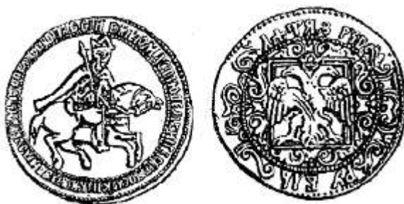
Серебряный рубль Алексея Михайловича (1655–1622 годы)

Постепенно рублевые слитки исчезли из обращения, перестали делать и рублевые ефимки. Деньги в России считали на рубли, но рубля как монеты не существовало, рубль оставался только условной счетной единицей.