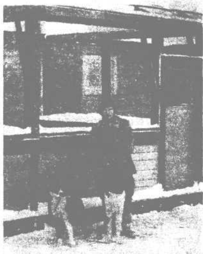
Русско-европейские лайки. Питомник «Завидово»

животных. Ранняя подкормка, плохо отражаясь на пищеварении питомцев, делает их нестойкими против чумы, рахита и других болезней. Поэтому лучше брать малыша из помета, в котором оставлено на выращивание четыре — шесть, то есть нормальное количество щенков.