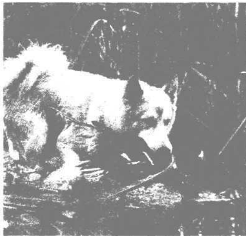
С лайкой утку не потеряешь

Всех этих недостатков можно избежать, если в процессе обучения еще до охоты условия тренировки сделать достаточно разнообразными.