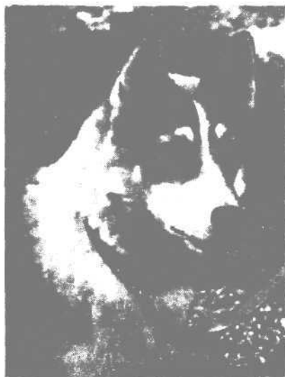
Голова западносибирской лайки

конкуренции как бельчатницы, другие предпочитают работу по зверькам из семейства кунных, третьи более склонны к охоте на крупного, опасного зверя.