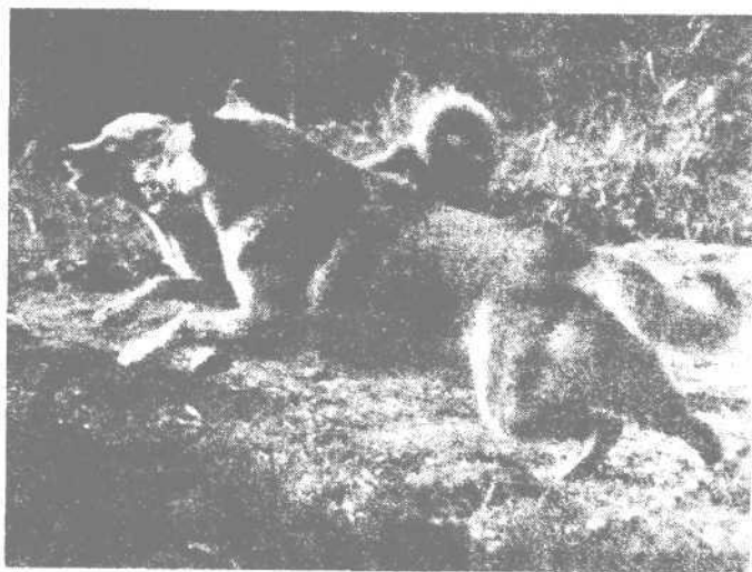
Лайки работают по кабану отважно и агрессивно

В этом нашим любимцам помогает своеобразная манера боя, унаследованная от волнообразных предков. Собаки других пород в драке с себе подобными или в схватке со зверем стараются вцепиться в противника, а там - хоть шкура долой! Настоящие лайки ни на секунду не забывают о собственной безопасности. Действуя мгновенными хватками, нападая и увертываясь, они работают в ближнем бою, подобно лучшим боксерам или фехтовальщикам. Все это возможно благодаря необыкновенной ловкости, высокоразвитому чувству дистанции, чрезвычайной подвижности нервных процессов при отличной уравновешенности, сбалансированности реакций возбуждения и торможения. Такие бойцовские качества вырабатывались в породах охотничьих лаек на протяжении сотен лет их практического использования на охоте за крупными, опасными животными.