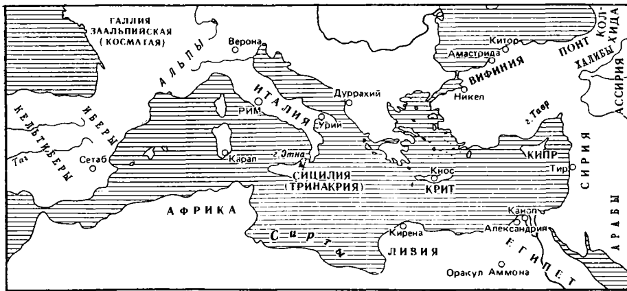
Средиземное море времен Катиллы