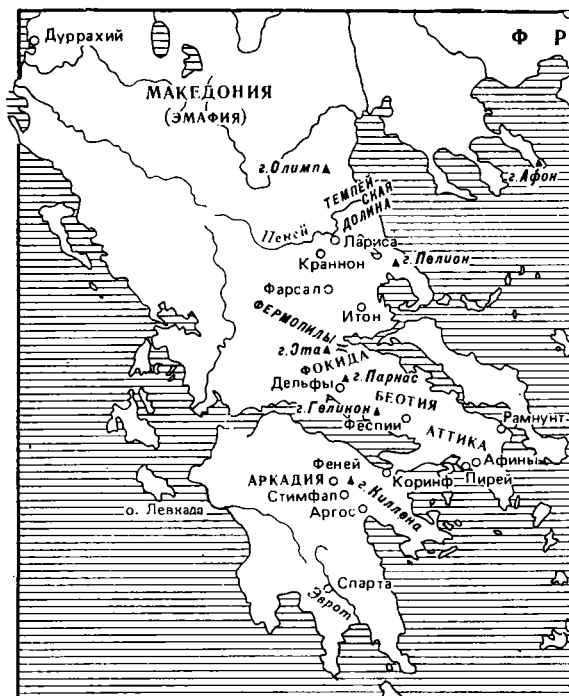
Мифологическая Греция Кагулла