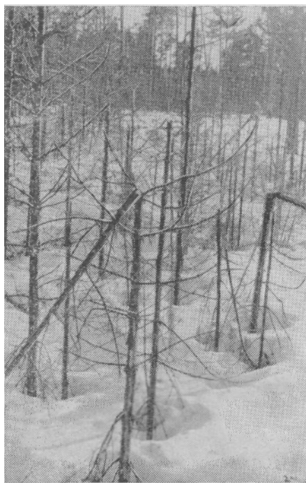
Уничтоженный лосями сосновый подрост

Таким образом, сильно возросшая численность лосей, с одной стороны, и весьма лимитированная емкость лосиных пастбищ, с другой, обязывают разработать и предложить практике разумную и эффективную систему искусственного регулирования численности лосей в полном соответствии с возможностями угодий и воспроизводственными способностями отдельных популяций лосей.