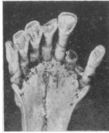
Состояние резцов у старых лосей

У лосей 4,5 — 5,5 л е т в задней доле 3-го моляра имеется стертость с обнажением дентина как на внутреннем, так и на внешнем гребнях. Обнаженный слой дентина имеет характерную для лосей старших возрастов треугольную форму. На 2-м премоляре полоска дентина соединяет внутренний и внешний гребни уже не только в задней доле и в передней части передней доли зуба.