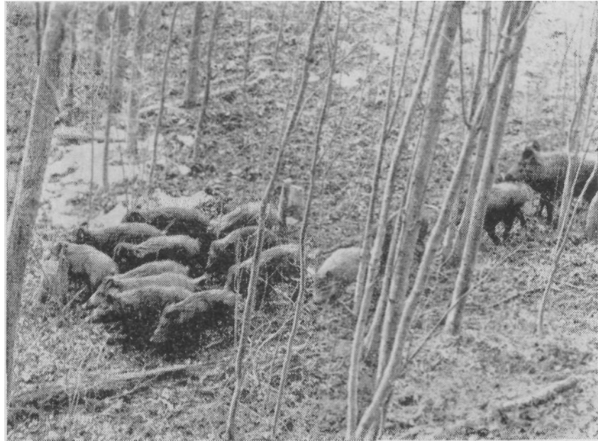
Весной кабаны держатся в лиственных лесах, кормясь подземными частями растений и почвенными беспозвоночными (фото из фондов журнала «Охота и охотничье хозяйство»)

В конце зимы — начале весны, когда почва становится мягкой, зверь питается подземными частями растений — корневищами ветреницы дубравной, горца, купены, калужницы, белокрыльника, гравилата, корнями одуванчика, подбирает прошлогодние желуди. В мае — июне с развитием травяного покрова кабан питается зеленью, скусывая преимущественно розетку листьев и верхнюю часть стебля (примерно 20 — 30% общей длины). Особенно охотно поедает осот болотный, крапиву жгучую и двудольную, калужницу, недотрогу, гравилат. Осоку ест только в мае, пока листья ее достаточно нежные. Наибольшее количество кормов добывает в грабово-дубовых лесах. В апреле — мае он выходит на луга и поляны, позднее перекочевывает в ольшаники — уголья, богатые не только растительными, но и животными кормами.