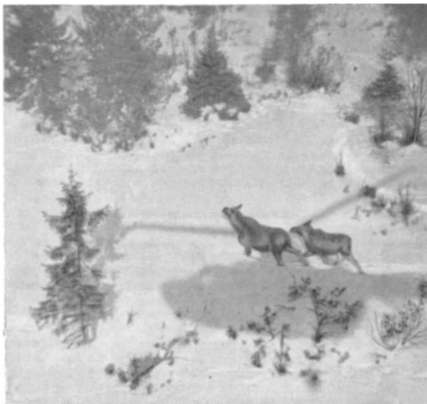
Лосиха с лосенком, потревоженные вертолетом

проведения авиаучета оказались ЯК-12А и АН-2, из вертолетов — МИ-1, МИ-2 и КА-26. Обычно полет проводится на высоте около 200 м со скоростью 150 км/ч. Ширина обследуемой полосы леса с одного борта не превышает 200 м и только в осветленных, хорошо просматриваемых насаждениях эта полоса может быть шире. Для того, чтобы учетчик выдерживал заданную полосу и учитывал зверей только в ее пределах, не нужны никакие угломеры и различные риски на стеклах и фюзеляже летательного аппарата, ибо они отвлекают учетчика, что ведет к пропускам, но несколько не повышает точность работы.