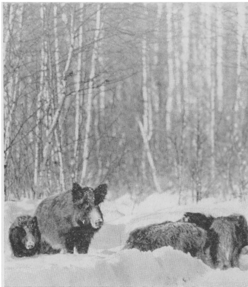
При глубоком снеге кабаны с трудом добывают пищу