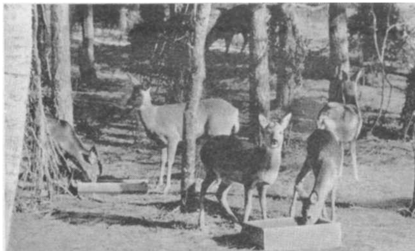
Косули на подкормочной площадке

выходят кормиться до середины дня, пока слой льда не станет более мягким под воздействием обычной в это время положительной температуры воздуха. Если косуль преследуют по насту, они ранят ноги об острую кромку льда и становятся легкой добычей хищников.