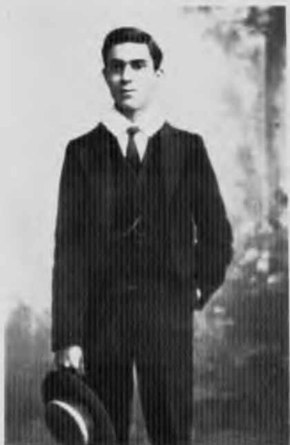
В Харроу, 1907 год.