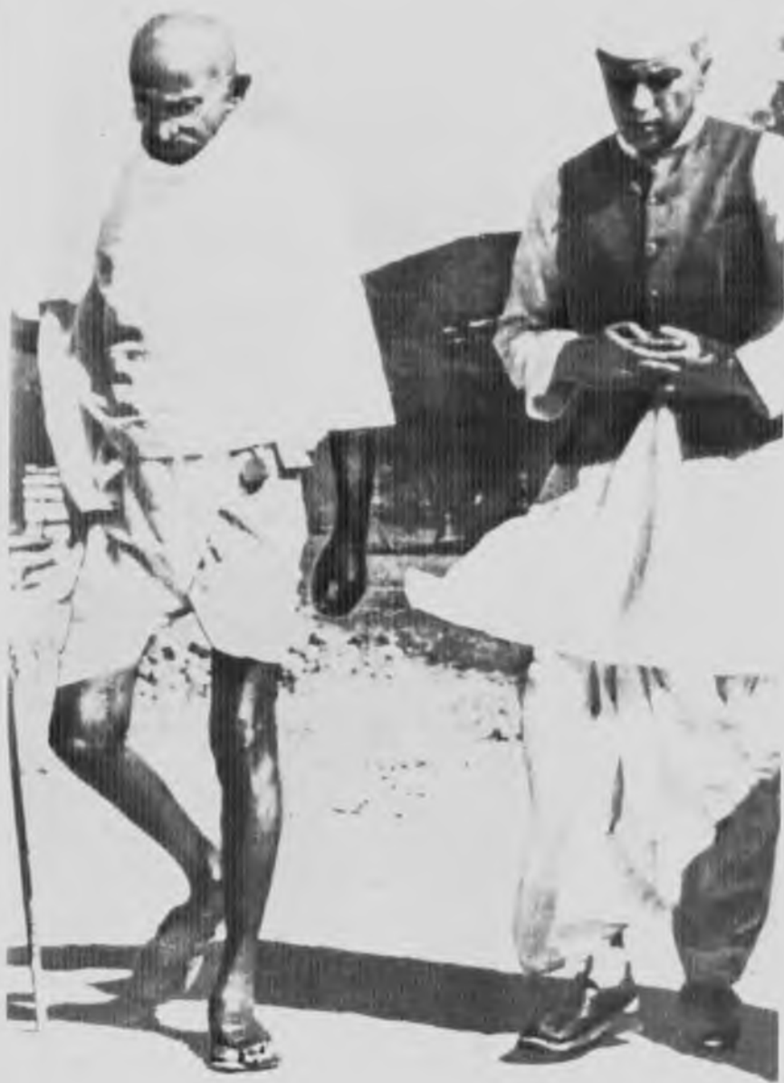
С Ганди, 1938 год.