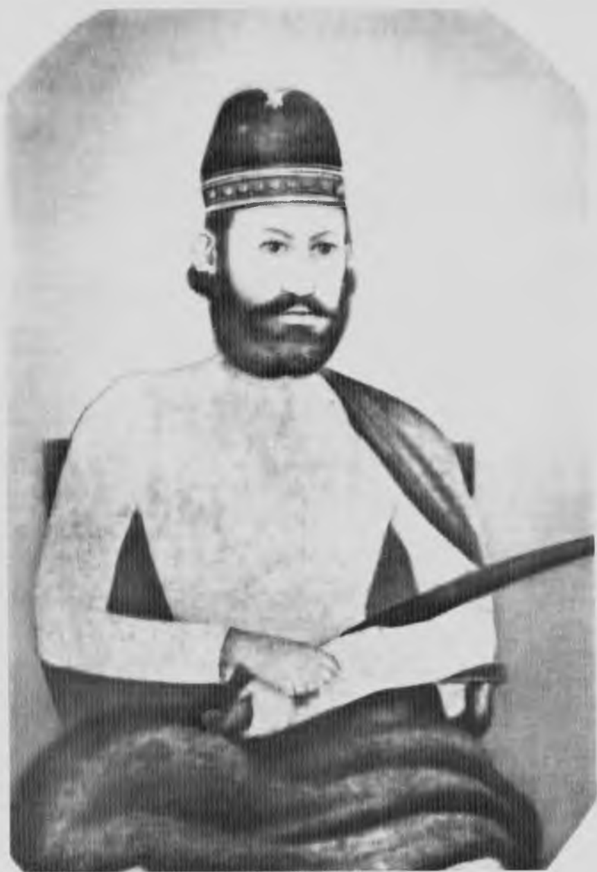
Ганга Дхар Неру — дел Джавахарлала.