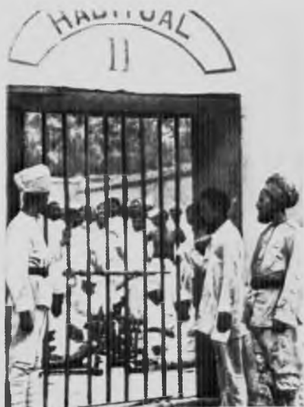
Последователи Ганди в Еравадской тюрьме около Пуны, 1930 год.