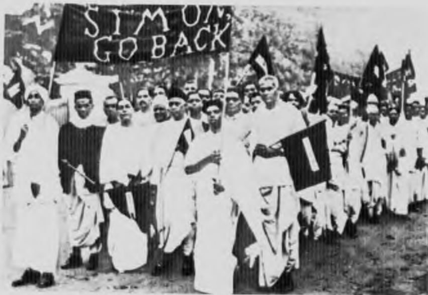
Демонстрация в Мадрасе в поддержку бойкота комиссии Саймона, 1928 год.