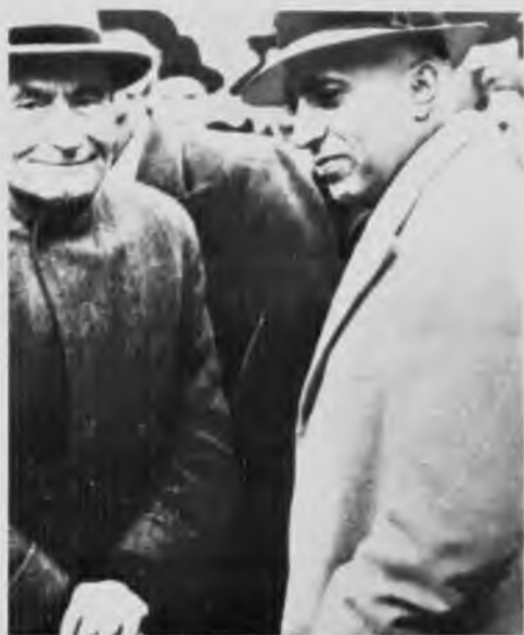
С лордом Петик-Лоуренсом, 1946 год.