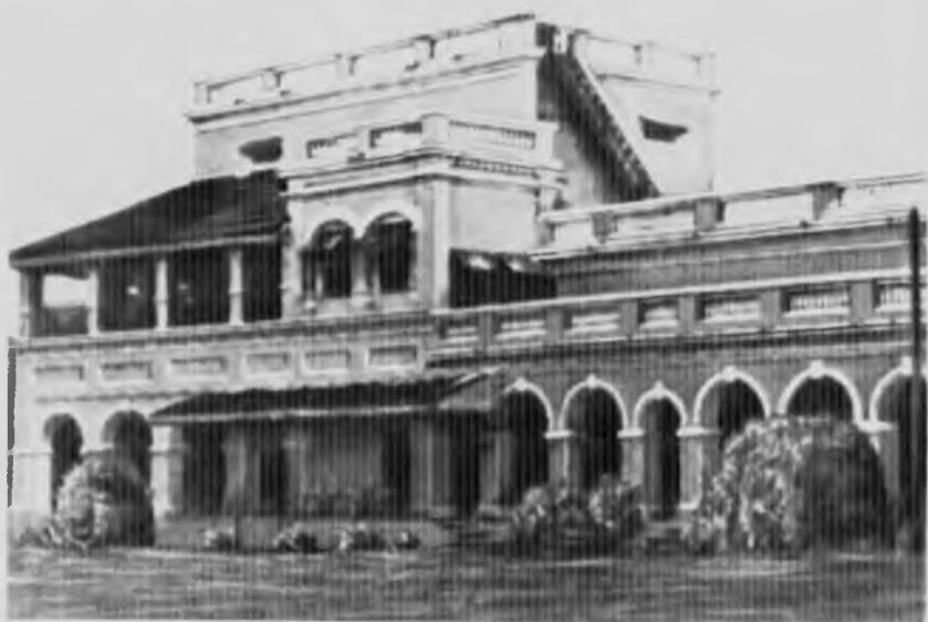
Свардж-бхаван — дом, где жила семья Неру до 1928 года.