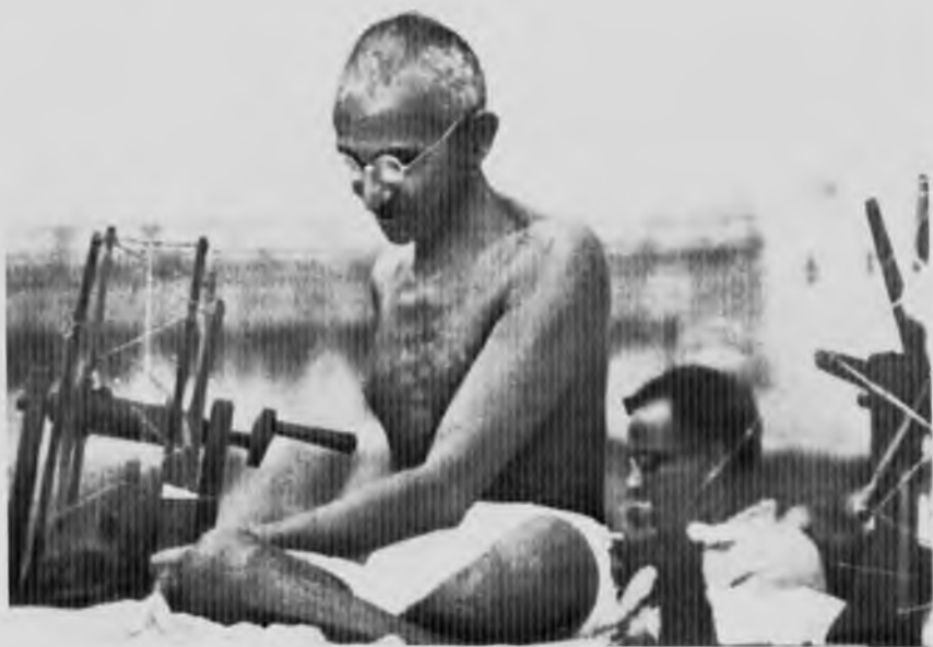
Показательное прядение Ганди в Калькутте, 1921 год.