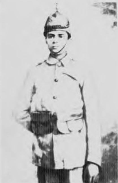
В форме члена школьного кадетского корпуса Харроу.