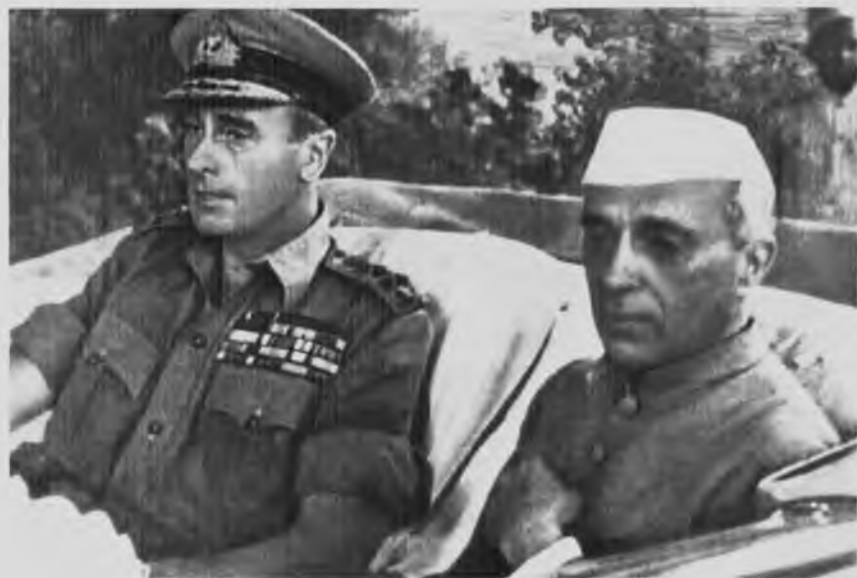
С лордом Маунтбэттенем в Сингапуре, 1946 год.