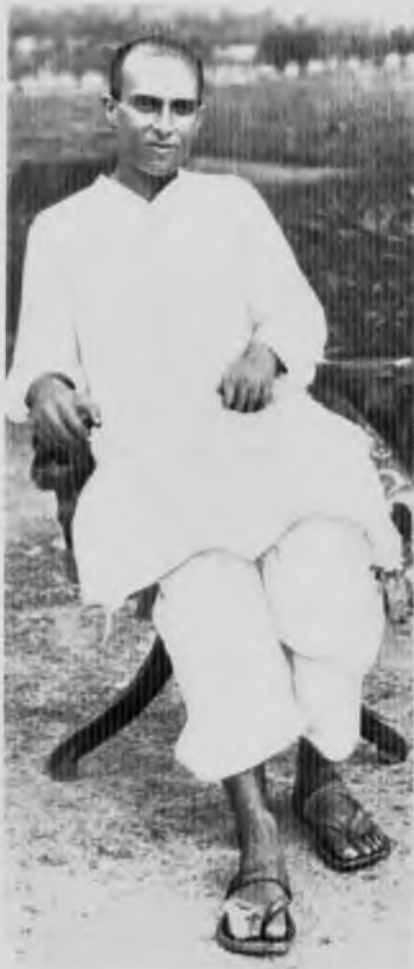
Джавахарлал в возрасте 32 лет, 1921 год.