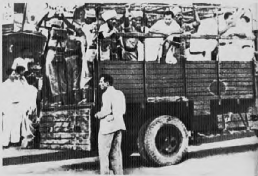
Восстание военных моряков, 1946 год.