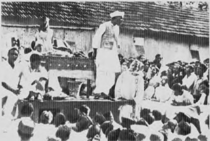
Выступление во время предвыборной кампании, 1936 год.