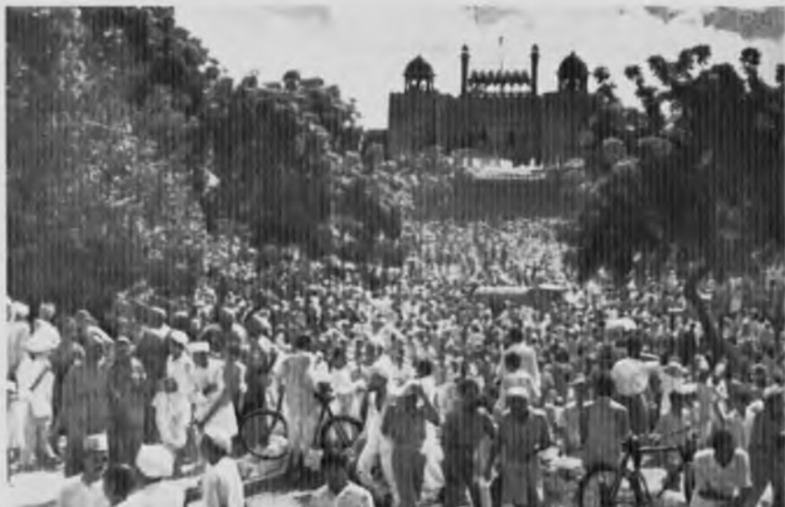
Празднование Дня независимости у Красного форта в Дели, 15 августа 1947 год.