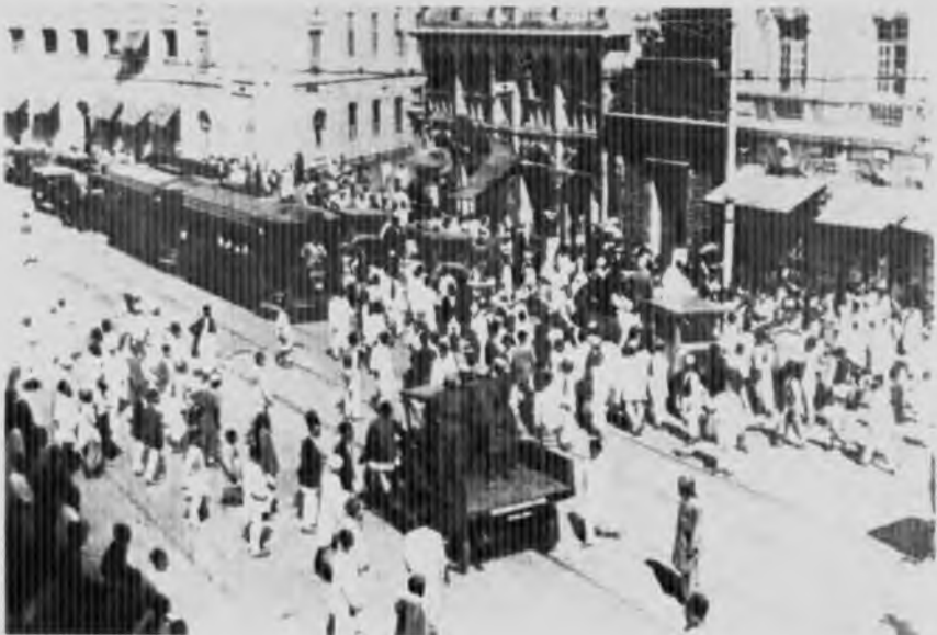
Волнения в Бомбее, 1929 год.