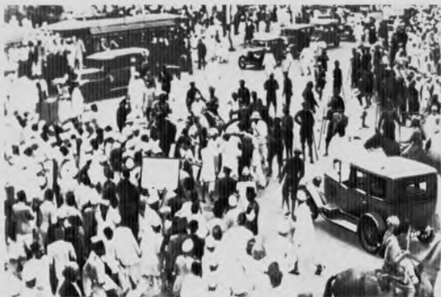
Выборы в Бомбее, 1930 год. Столкновение демонстрантов с полицией.