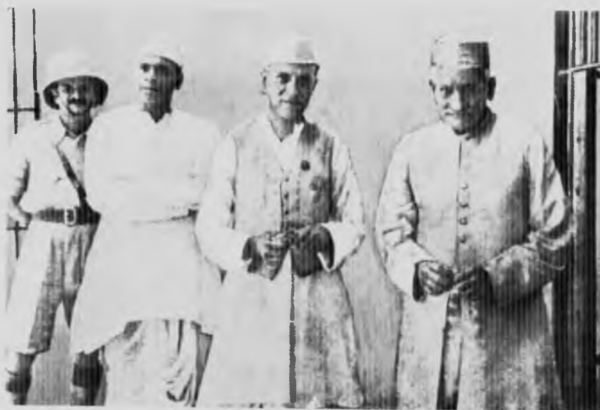
Джавахарлал с отцом после помещения в тюрьму Наини, 1930 год.