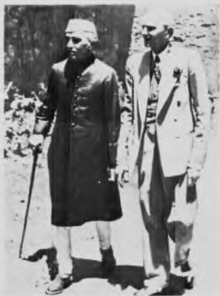
Джавахарлал и М. А. Джинна, 1946 год.