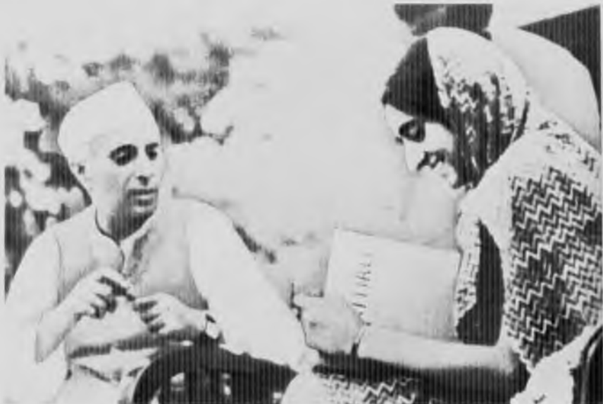
Джавахарлал вручает своей дочери Индире экземпляр «Автобиографии» с дарственной надписью.