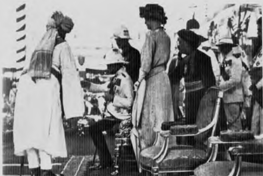
Английское правление в Индии: принц Уэльский получает подарки от махараджи Колханпура, 1921 год.