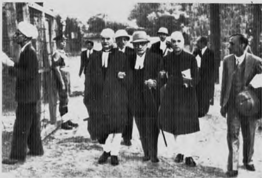
Джавахарлал — защитник руководителей Индийской национальной армии, 1946 год.