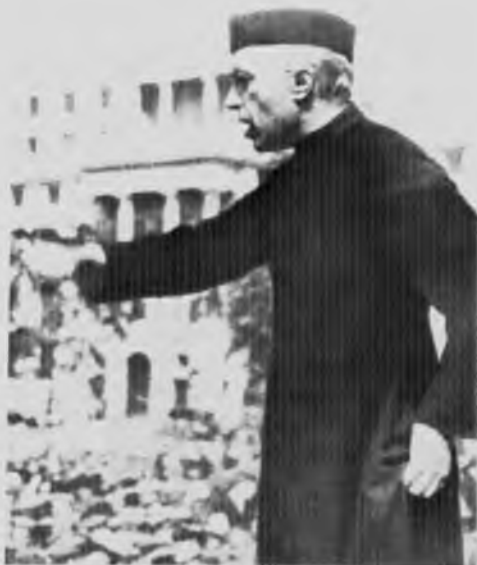
Выступление на Трафальгарской площади в поддержку кампании помощи Испании, 1938 год.