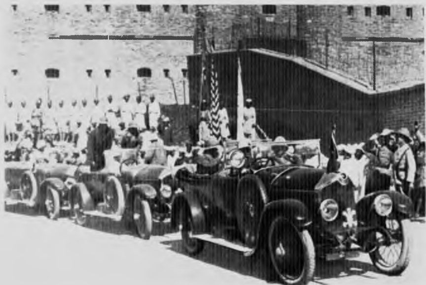
Принц Уэльский на Малакандском перевале, 1922 год.