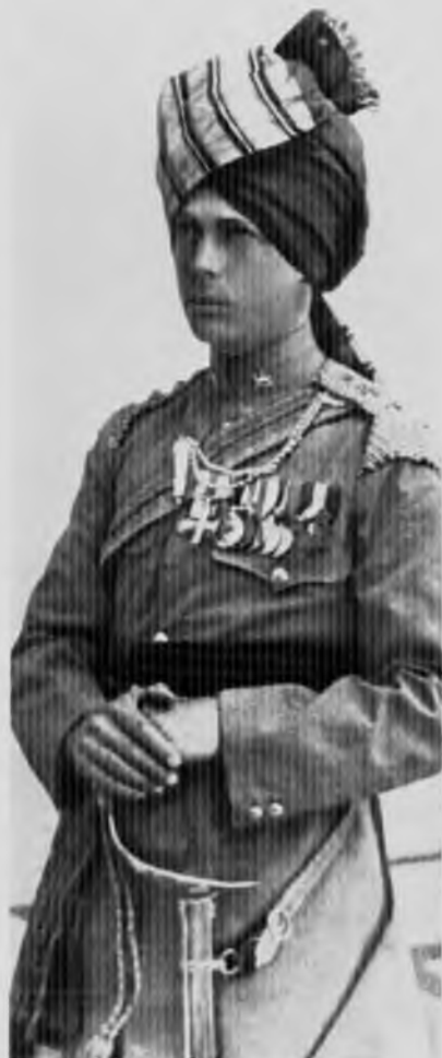
Принц Уэльский во время пребывания в Индии, 1922 год, когда ему было 28 лет.