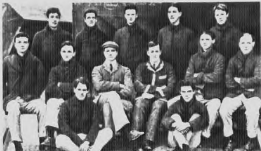
Среди членов лодочного клуба Тринити-колледжа в Кембридже (сидит на земле справа).