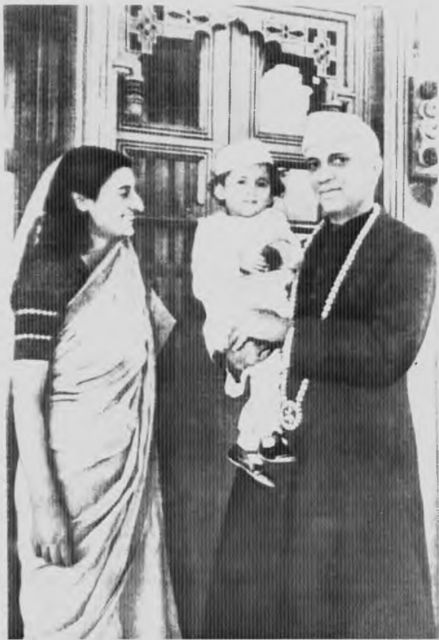
С дочерью и внуком, 1946 год.