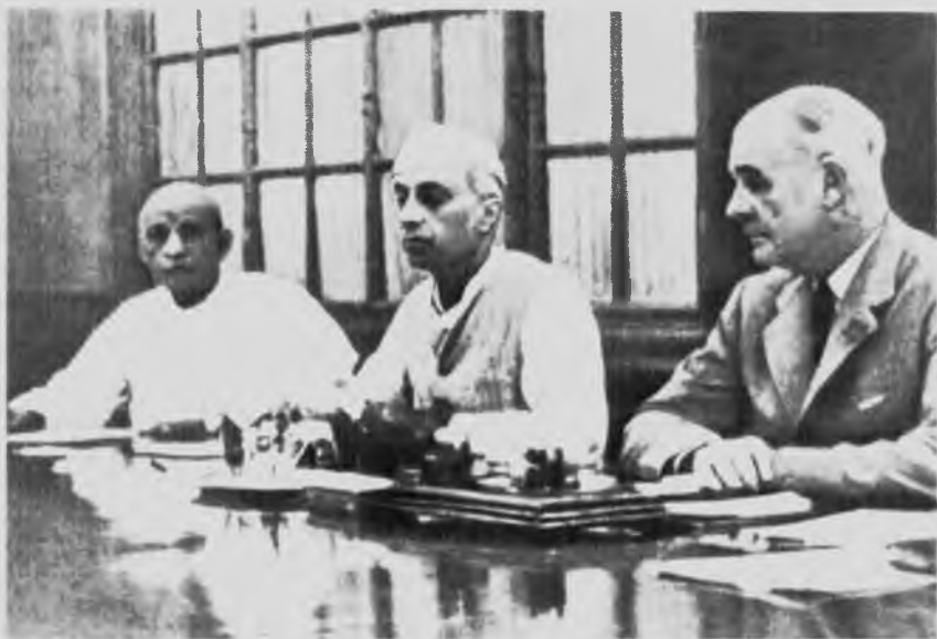
С лордом Уэйвеллом, 1946 год.