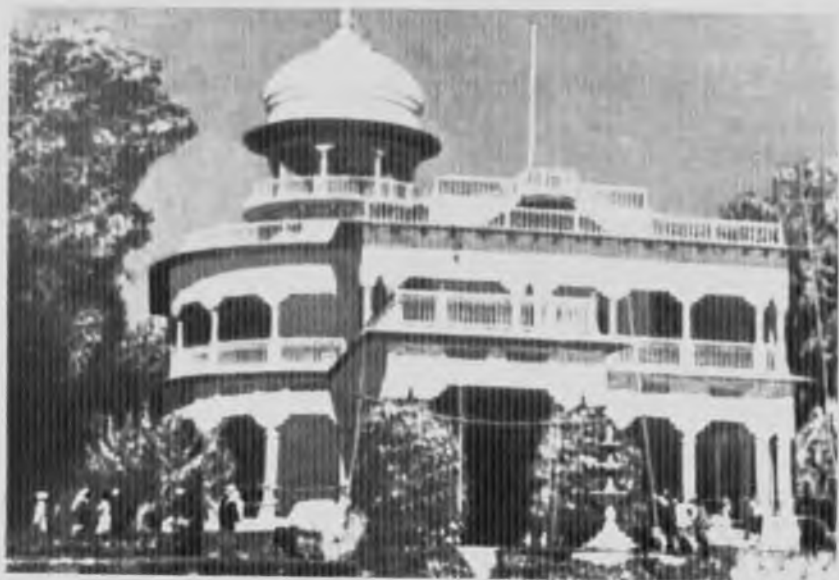
Ананл-бхаван - дом, построенный Мотилалом Неру в Аллахабаде.