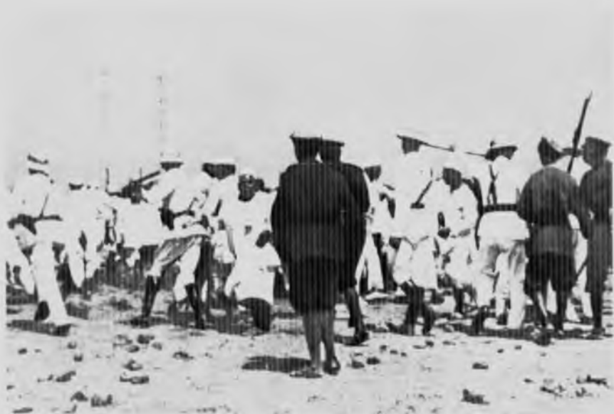
Полиция разгоняет толпу на соляных выработках в Вадале, 1930 год.