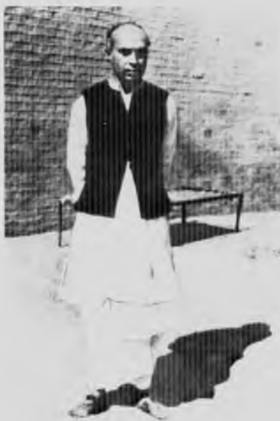
Джавахарлал в тюрьме, 1932 год.