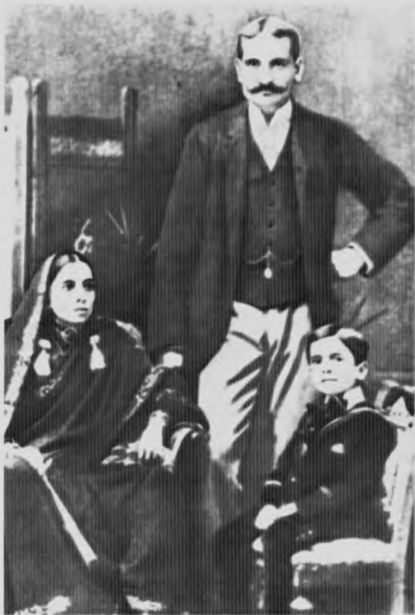
Джавахарлал в детстве с матерью и отцом.