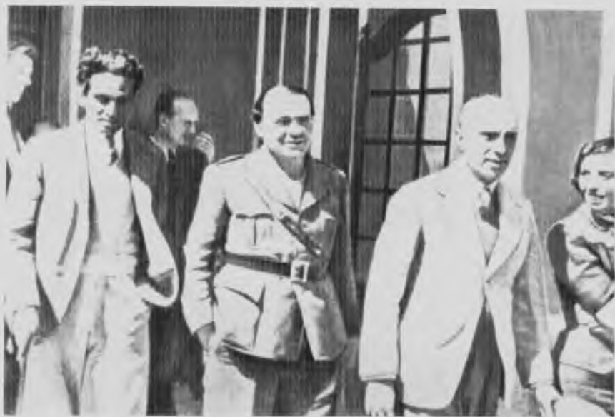
Джавахарал, Кришна Менон и генерал Листер в штабе Листера в Испании, 1938 год.