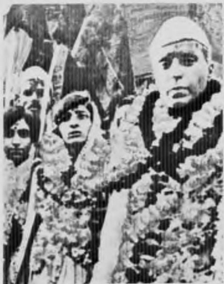
Джавахарлал и Камала во главе демонстрации против соляного налога в Аллахабаде, 1930 год.