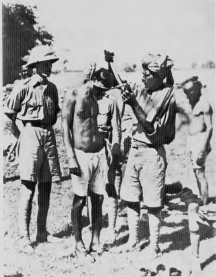
Аресты после бойни в Амритсаре, 1919 год.