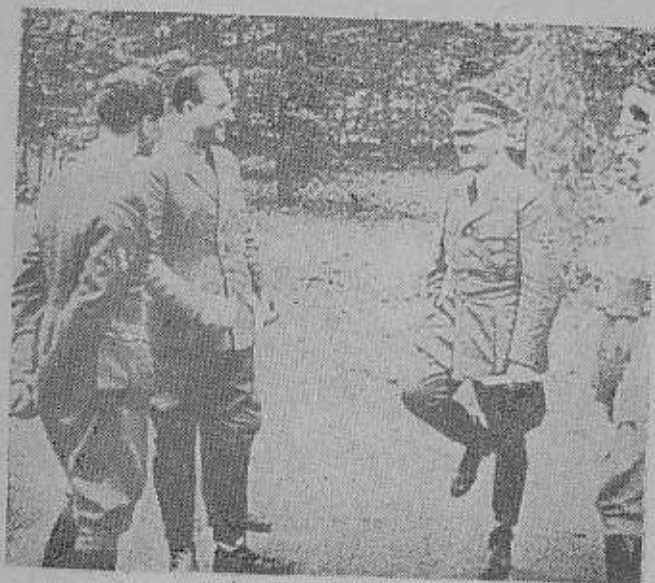
ورود بھاك فرانسہ برای انعقاد قرارداد

مارا توجیه و تأیید کند . در برابر خدا ... برای آنکه ما برای این باین دنیا آمده ایم که ثان روزانه خود را بقیمت نبرد دائم و پایان ناپذیر بدست آوریم ... آری ما مخلوقات هستیم که هیچ چیزی برای گان و بیز حمت به ما داده نشده است و سیادت خود را در روی زمین مرهون کوشش و هوش