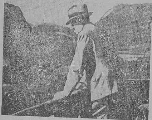
هیتلر بر فراز کاخ اختصاصی خود در «برچسگادن»

خواهد داد که با کمال فراغت وسایل کار خود را در محیط چنین اتحادی فراهم آورد و خود را آماده تسویه حساب با فرانسه سازد چه مهمترین چیزیکه در اینگونه اتحاد وجود دارد اینست که نه تنها آلمان ناگهان دچار حمله و هجوم دشمن نخواهد شد بلکه صف اتحاد دشمنان ما خود بخود درهم خواهد شکست و این «اتفاقی» که برای ما این اندازه شوم