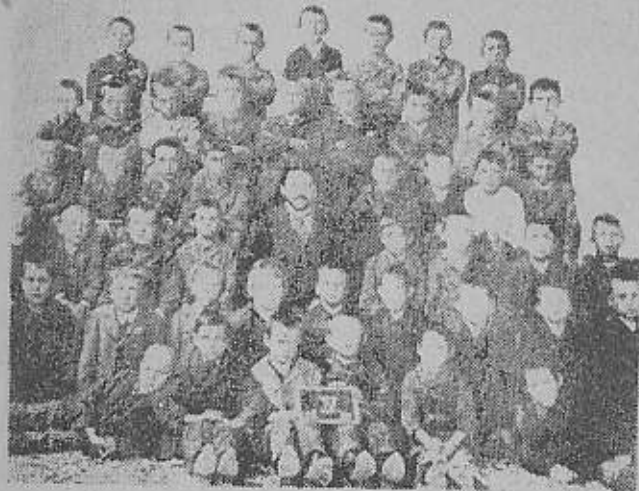
طفلی که با علامت (X) در ردیف بالانفر چهارم مشخص شده «هیتلر» دراوان کودکی در دبستان است

در راه یگانه اصل مهم که عبارت از تحصیل آزادی اراضی اصلی است، فدا گردیده آرزوهای ستم کشیدگان و اعتراضات ملیون قسمتهای تجزیه گشته يك ملت یا ایالات رایش را آزاد نمی کند بلکه چیزی که موجب این آزادی میشود اعمال قدرت و زور است و این کار باید بدست بقایای چیزی که در سابق وطن مشترک نام داشت و کمابیش استقلال دارد،