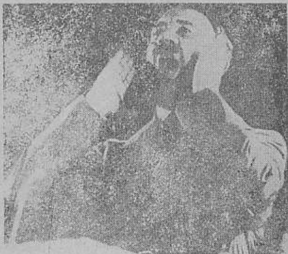
شکستهای غیرمنتظره پیشوایان کمالات سیاسی آورد

از نظر عملی و از روی حساب اجتناب کرده بودند و تنها از این نظر بآن ارزش قائل بودند. تاثیر میکردن بملک فتل انگلیس و نیز بر میآشفتم ... این قدرت تازه و غیر قابل قبولی که فرانسه در قاره اروپا مییافت ، نگرانی آشکاری بخصوص در محافل اقتصادی مافرای مانس پدید میآورد. زیرا که فرانسه در آن هنگام در اروپا از نظر قدرت نظامی و سیاسی