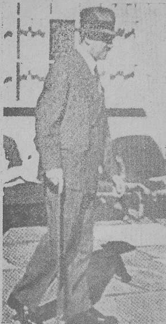
در سال ۱۹۴۴ سوء قصدی، معیتلر ته و مختصر آسیبی دید