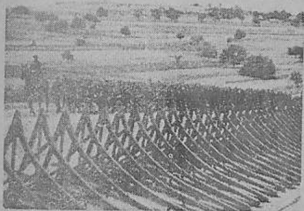
حقل از یکطرفه

است که اغتشاش و هرج و مرجی که بدست این عده بمیان میآید بتفع دشمنان ملت است و این جنایتکاران در سایه اینگونه کارها، اراده و حس دفاع از توقعات و آرزوهای حیاتی خود را از ملت سلب میکنند و این اراده را از میان میبرند و در این کار بدیگانه وسیله ای دست میزنند که با این مقصد و هدف سازش داشته باشد زیرا که هیچ ملتی در دنیا یک متر مربع زمین ندارد که از روی اراده و حق برتری بدست آمده