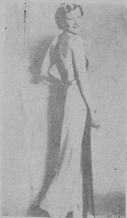
«او ایراون» که سروصدائی پس از شکست آلمان با اسم «ممشوقه» پتلی در جراند دنیا پنا کرد