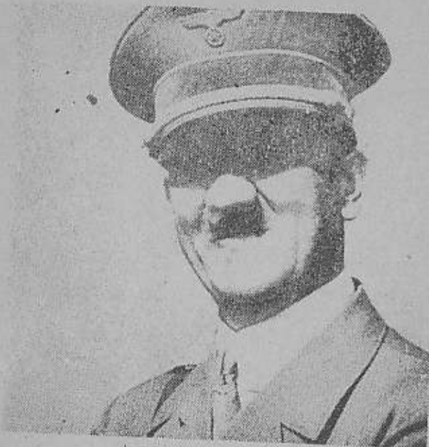
از آخرین عکسهای جالب هیتلر