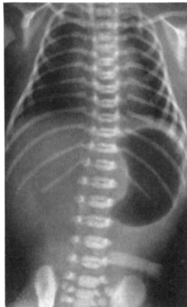
Abb. 2. Röntgenbild eines Totgeborenen nach Einblasen von Luft in Trachea und Oeso- phagus.