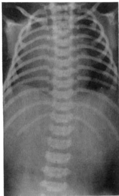
Abb. 3. Röntgenbild eines Lebendgeborenen. Lungen lufthaltig. Keine Luft in Magen und Darm.