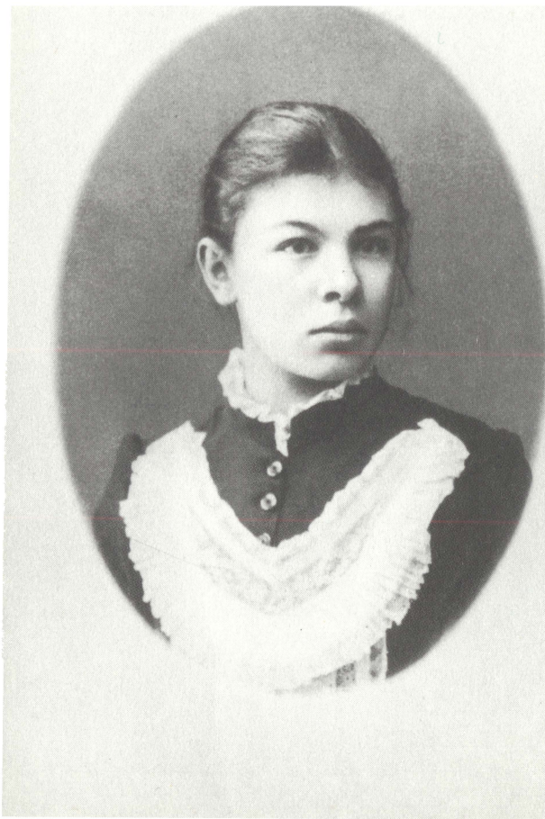
О. И. Ульянова. 1887 г.