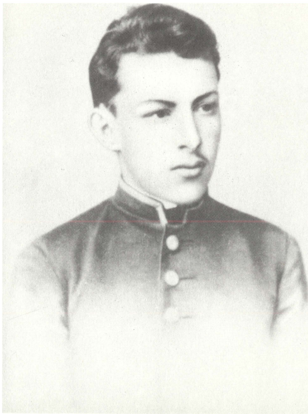
Д. И. Ульянов. 1893 г.