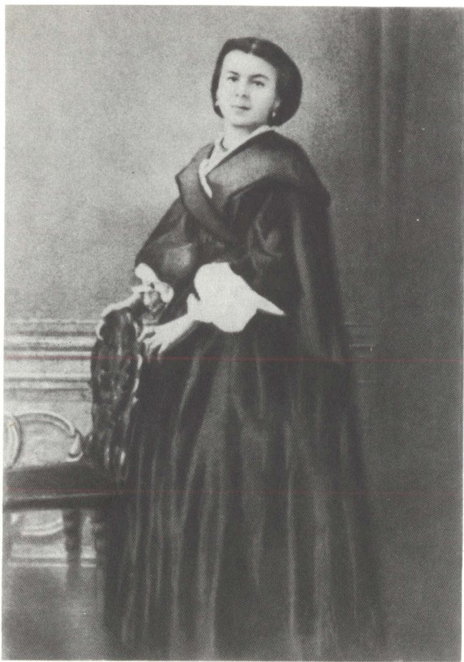
М. А. Бланк. 1863 г.