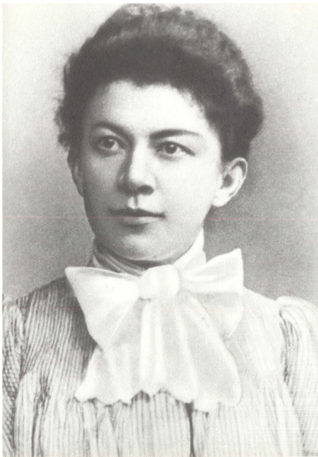
А. И. Ульянова-Елизарова. 1900—1902 гг.