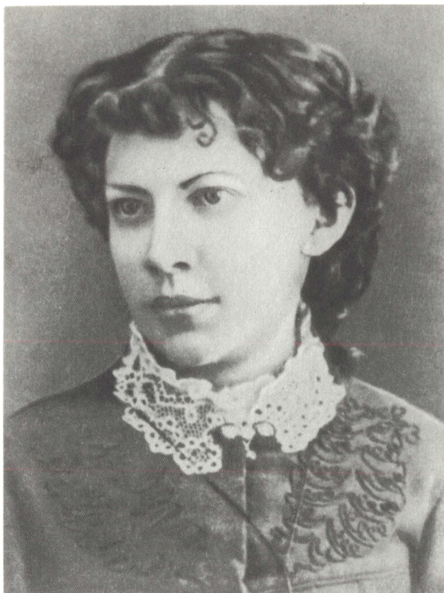
А. И. Ульянова. 1883—1887 гг.