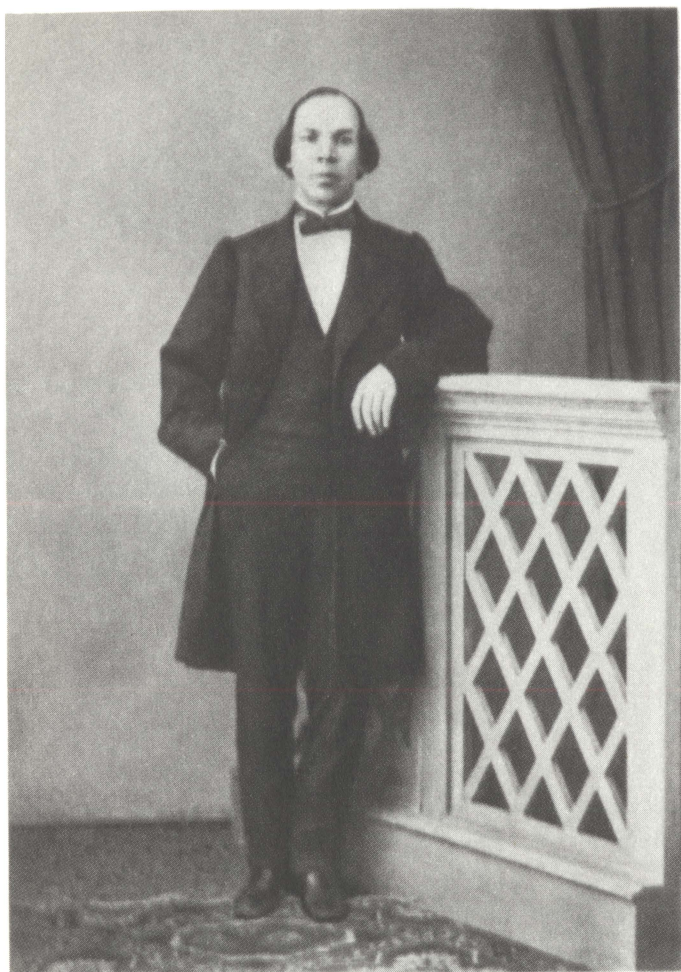
И. Н. Ульянов. 1863 г.