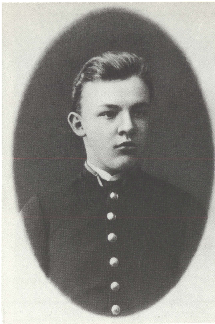
В. И. Ульянов. 1887 г.