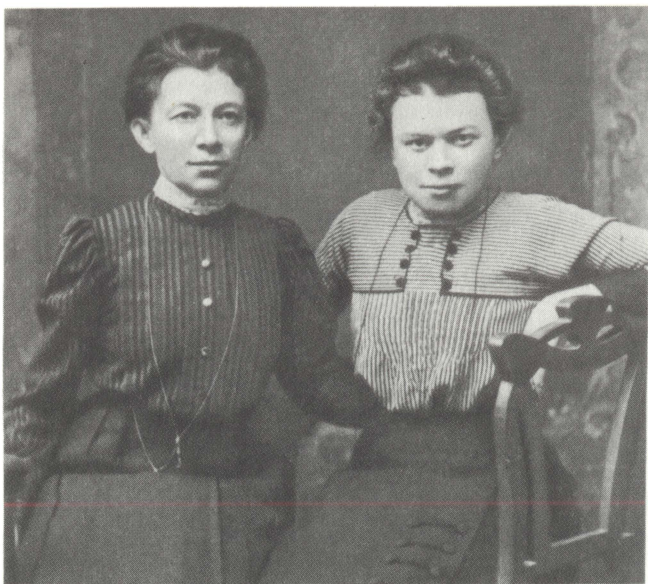
А. И. Ульянова-Елизарова и М. И. Ульянова. 1912 г.