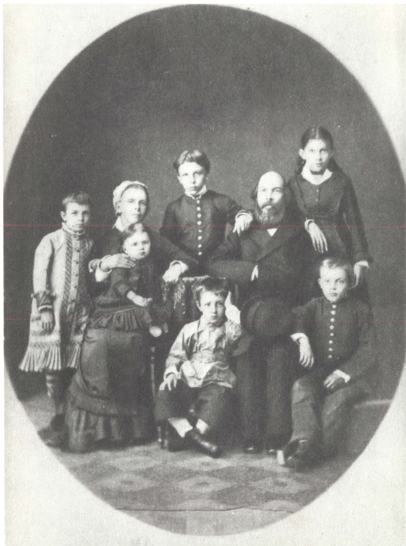
Семья Ульяновых: Мария Александровна, Илья Николаевич и их дети — Ольга, Мария, Александр, Дмитрий, Анна, Владимир. 1879 г.