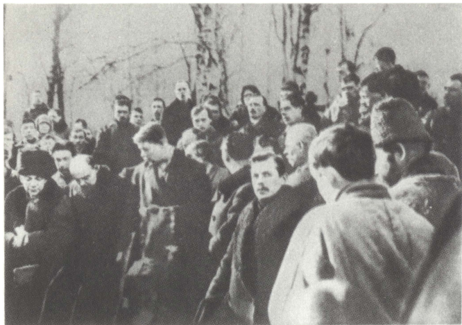
В. И. Ленин и А. И. Ульянова-Елизарова на похоронах М. Т. Елизарова. 1919 г.