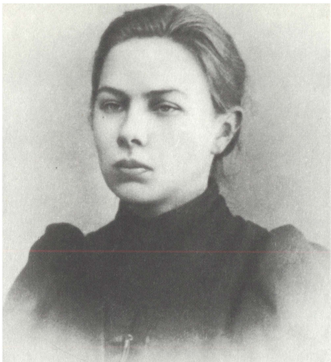
Н. К. Крупская. 1895 г.