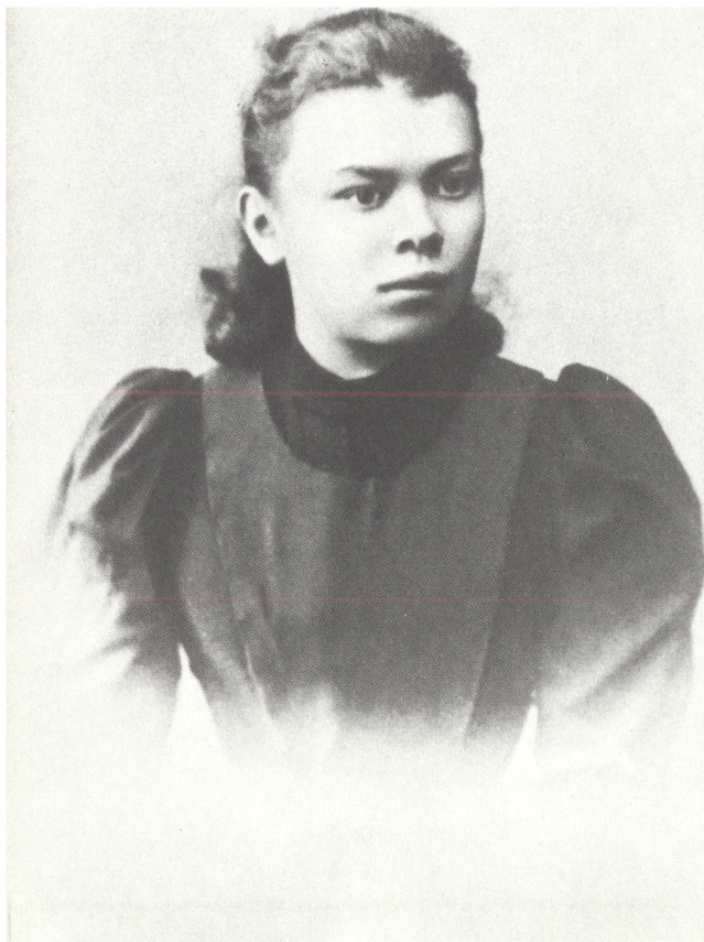
М. И. Ульянова. 1893 г.