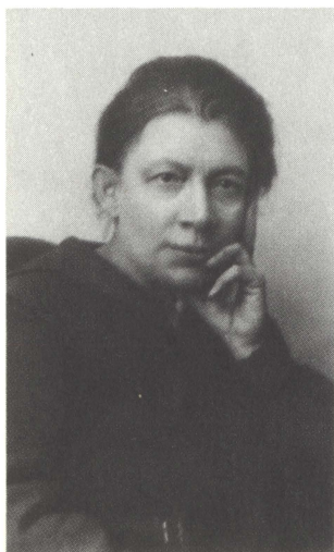
А. И. Ульянова-Елизарова. 1921 г.