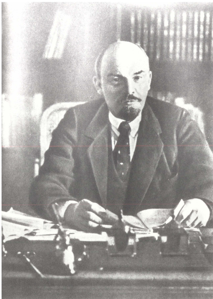
В. И. Ленин в своем рабочем кабинете в Кремле. 1918 г.