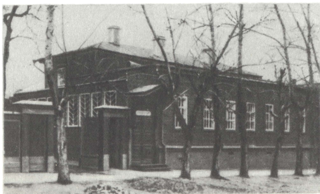
Симбирск. Дом на Московской улице. Здесь жила семья Ульяновых с 1878 по 1887 г.