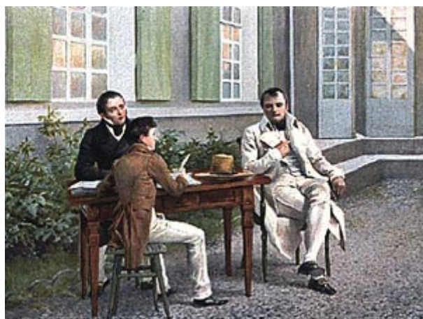
Лас-Каз и его сын записывают историю Наполеона под его диктовку

Маленький двор Наполеона, следовавший за ним на остров Св. Елены и поселившийся с ним в Лонгвуде, ссорился