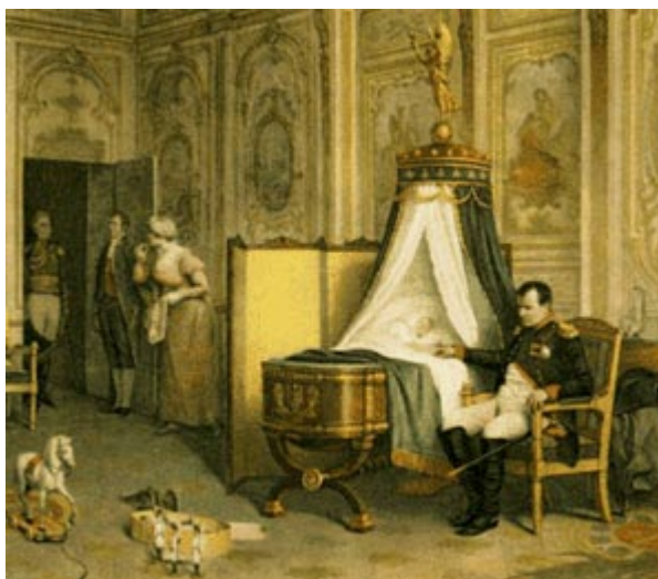
Последнее свидание с сыном

В ночь с 24 на 25 января 1814 г. Наполеон должен был выехать к армии. Регентшей империи он назначил свою жену, императрицу Марию-Луизу. В случае смерти Наполеона на императорский престол должен был немедленно вступить его трехлетний сын, римский король, при продолжающемся регентстве матери. Наполеон так любил это маленькое существо, как он в своей жизни никогда никого не любил. Знавшие Наполеона даже и не подозревали в нем вообще способности до такой степени к кому бы то ни было привязываться. Барон Меневаль, один из личных секретарей Наполеона, говорит, что был ли занят император у своего стола, писал ли, читал ли у камина,- ребенок не сходил с его колен, не хотел покидать его кабинета, требовал, чтобы отец играл с ним в солдатики. Он один во всем дворце нисколько не боялся императора и чувствовал себя в кабинете отца полным хозяином. 24 января Наполеон весь день провел у себя в кабинете за срочными делами, которые нужно было устроить перед отъездом на эту решающую войну, перед грозной боевой встречей со всей Европой, поднявшейся против него. Ребенок со своей деревянной лошадкой был, как всегда, около отца, и так как ему, по-видимому, надоело наблюдать