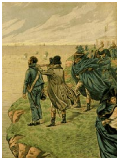
Наполеон рассматривает побережье Англии из Булонского лагеря

Вильям Питт решил пойти на что угодно, лишь бы предотвратить высадку Наполеона на берегах Англии.