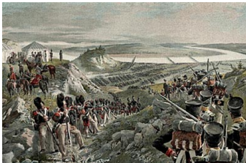
Великая армия переходит Неман. Война 1812 года началась.

границу, и несравненно больше, чем в Дрездене, понимать особенности и трудности затеянного дела. И это тотчас же отразилось на его политике: к великому разочарованию поляков, он не присоединил к Польше Литвы (под Литвой подразумевались тогда Литва и Белоруссия), а создал для Литвы особое временное управление. Это означало, что он не хочет предпринимать ничего, что могло бы в данный момент помешать миру с