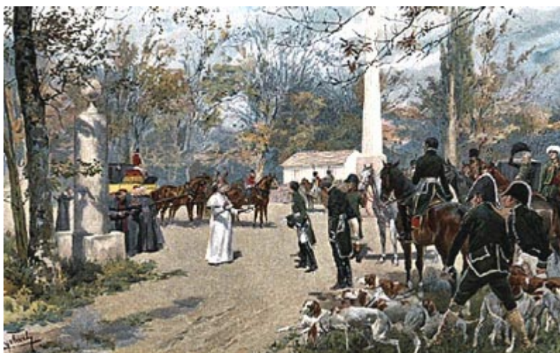
Наполеон встречает папу Пия VII

отхваченных в свое время Наполеоном папских владений на севере Церковной области в Италии. Но папе Пию VII, кардиналу Консальви и всему конклаву кардиналов было не под силу перехитрить первоклассного дипломата, каковым всегда был Наполеон. Папа много лукавил, горько жаловался, снова лукавил, снова жаловался,- ничего не выторговал и отправился в Париж в надежде, которую в нем охотно поддерживал Наполеон, что когда он приедет в Париж, то здесь, может быть, что-нибудь и получит. Он приехал в Париж - и ровно ничего не получил.