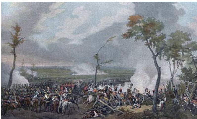
Битва при Гане

Наполеон еще не складывал оружия. Он думал о новой предстоявшей стадии борьбы, и когда заговаривал с маршалами, прерывая свое угрюмое молчание, то делал это затем, чтобы отдать новые распоряжения. Он решил теперь отпустить папу в Рим; он позволил испанскому королю Фердинанду VII, которого держал в плену пять лет, вернуться в Испанию. Понадобились 125 тысяч потерянных обеими сторонами людей на лейпцигском поле, и главное понадобилось отступление от Лейпцига, чтобы Наполеон наконец примирился с мыслью, что уже не поправить ему одним ударом всего, что случилось, не загладить Бородина, московского пожара, гибели великой армии в русских снегах, отпадения Пруссии, Австрии, Саксонии, Баварии, Вестфальского королевства, не ликвидировать Лейпцига, испанской народной войны, не сбросить Веллингтона с англичанами в море. Еще в июне, июле, августе этого страшного 1813 года он мог кричать на Меттерниха, топтать на него ногами, спрашивая, сколько он денег получил от англичан, оскорблять австрийского императора, провоцировать Австрию, срывать мирные переговоры, впадать в бешенство от одной мысли об уступке Иллирии на юге или ганзейских городов на севере, продолжать жечь английские конфискованные товары; расстреливать гамбургских сенаторов, - словом, вести себя так, будто он вернулся в 1812 г. из России победителем и будто речь идет теперь, в 1813 г., лишь о наказании