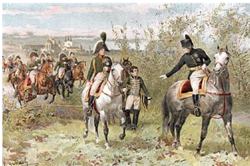
Конная прогулка Наполеона и Александра I. Эрфурт. 1806г.

Александр надеялся, поверив обещаниям Наполеона, что, приобретя благодаря франко-русскому