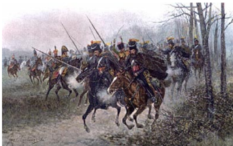
Нападение казаков на штаб Наполеона у села Городни

Итак, армия, исполняя повеление Наполеона, вдруг повернула со Старой Калужской дороги на Новую, и уже 23 октября большая часть ее прибыла в Боровск. Малоярославец был занят частями дивизии генерала Дельзона. Разгадав план Наполеона, Кутузов решил загородить Новую Калужскую дорогу. На рассвете 24 октября генерал Дохтуров и за ним Раевский атаковали Малоярославец, занятый накануне Дельзоном. В результате постепенного накопления сил с обеих сторон произошла кровопролитная битва, длившаяся весь день. Восемь раз Малоярославец переходил из рук в руки. В восьмой раз взятый французами Малоярославец к вечеру остался за ними, но потери с обеих сторон были тяжкие. Одними только убитыми французы потеряли около 5 тысяч человек. Город сгорел дотла, загоревшись еще во время боя, так что много сотен человек, русских и французов, погибло от огня на улицах, много раненых сгорело живьем.