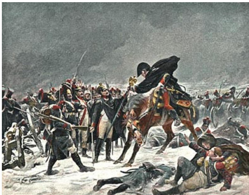
Фрагмент битвы при Прейсиш-Эйлау

Наполеон и окружавшие его видели, что только личное присутствие императора удерживает пехоту в этом ужасающем положении. Император остался неподвижно на месте, отдавая новые и новые приказания через тех редких адъютантов, которым удавалось уцелеть при приближении к тому страшному месту, где стоял окруженный несколькими ротами пехоты Наполеон. У его ног лежало несколько трупов офицеров и солдат. Пехотные роты, вначале окружавшие императора, постепенно истреблялись русским огнем и заменялись подходившими егерями, гренадерами гвардии и кирасирами. Наполеон отдавал приказания хладнокровно и дождался в конце концов удачной атаки всей французской кавалерии на главные силы русских. Эта атака спасла положение. Кладбище Эйлау осталось за французами, центр боя перенесся