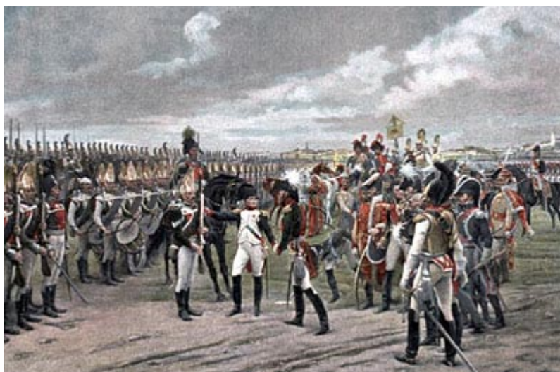
Наполеон обходит строй русской гвардии в Тильзите

двумя рядами своей старой гвардии. Гул восторженных приветствий и восклицаний гремел вокруг него и оглушал нас, стоявших на противном берегу; конвой и свита его состояли по крайней мере из четырехсот всадников... В эту минуту огромность зрелища восторжествовала над всеми чувствами... Все глаза обратились и устремились на противоположный берег реки, к барке, несущей этого чудесного человека, этого невиданного и неслыханного