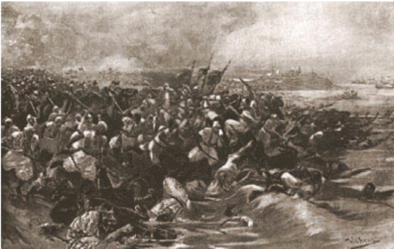
Блестящая победа под Абукиром. Мало кто уцелел из турецкого десанта.

Не успел Бонапарт отдохнуть в Каире, как пришла весть, что близ Абукира, там, где за год до того Нельсон уничтожил французские транспорты, высадилась турецкая армия, присланная освободить Египет от французского нашествия. Сейчас же он выступил с войсками из Каира и направился на север к дельте Нила. 25 июля он напал на турецкую армию и разгромил ее.