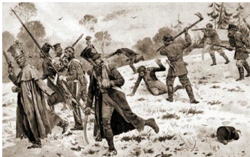
Партизаны и казаки атакуют отставших французских солдат

в начале похода. Пришлось бросить большую часть обоза, часть артиллерии, целые эскадроны должны были спешиться, так как конский падеж все усиливался.