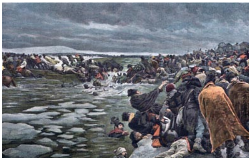
Переправа французских войск через реку Березину

Переправа происходила в порядке, и почти вся французская армия успела перейти благополучно, как вдруг к мостам бросилось около 14 тысяч отставших солдат, преследуемых казаками. Эта масса в панике кинулась, не слушая команды, на мосты, и последняя регулярная часть корпуса маршала Виктора, еще не успевшая перейти, оружием отбрасывала эту толпу. Уведомленный казаками о переправе у