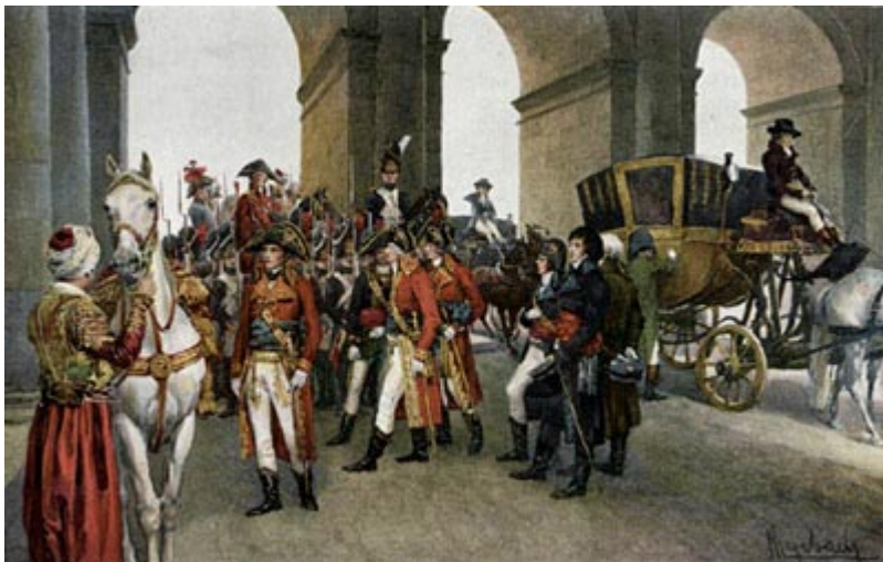
Наполеон Бонапарт в 1800 г.

настроение и склонность задобрить и расположить в пользу роялистов нового главу Французской республики. Бонапарту до поры до времени больше ничего и не требовалось: ему нужно было в эти первые месяцы, т. е. в ноябре и декабре 1799 г. и в первую половину 1800 г., проводить лишь самые необходимые меры и не забывать ни на минуту о предстоящей весной войне.