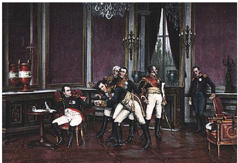
Наполеон оглашает маршалам текст своего отречения от власти

Он почти не ложился в эту ночь. Настало утро 6 апреля 1814 г. Он велел созвать маршалов и сказал им: «Господа, успокойтесь! Ни вам, ни армии не придется больше проливать кровь. Я согласен отречься. Я бы желал для вас, так же как для моей семьи, о б е с п е ч и т ь престолонаследие за моим сыном. Я думаю, что эта развязка была бы для вас еще выгоднее, чем для меня, потому что вы жили бы тогда под властью правительства, соответствующего вашему происхождению, вашим чувствам, вашим