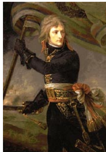
На Аркольском мосту

15 ноября 1796 г. начался, а вечером 17 ноября окончился упорный и кровопролитный бой при Арколе. Альвинци, наконец, столкнулся с Бонапартом. Австрийцев было больше, и сражались они с чрезвычайной стойкостью - тут были отборные полки Габсбургской монархии. Одним из самых важных пунктов был знаменитый Аркольский мост. Трижды французы бросались на штурм и брали мост и трижды с тяжкими потерями отбрасывались оттуда австрийцами. Главнокомандующий Бонапарт повторил в точности то, что он сделал за несколько месяцев до того при взятии моста в Лоди: он бросился лично вперед со знаменем в руках. Около него было перебито несколько солдат и адъютантов. Бой длился трое суток с небольшими перерывами. Альвинци был разбит и отброшен.