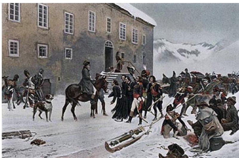
Генерал Бонапарт узнает у монахов Сент-Бернар путь через Альпы

что солдаты объясняли ее именно вниманием полководца к их личности, в то время как на самом деле он стремится только иметь в руках вполне исправный и боеспособный материал.