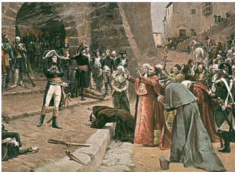
Расправа над непокорной Павией

в руках прежних государей, но с фактическим подчинением их Франции. Бонапарт организовал эту Цизальпинскую республику так, что при видимости существования совещательного собрания представителей из состоятельных слоев населения вся фактическая сила должна была находиться в руках французской оккупационной военной власти и присланного из Парижа комиссара. Ко всей традиционной фразеологии