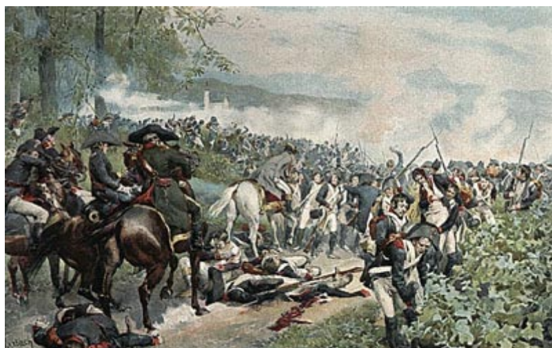
Битва при Маренго

больше; они воспользовались долгим спокойным отдыхом на стоянках в итальянских городах и деревнях, пока армия Наполеона совершала тяжелые переходы через Сен-Бернар. У Бонапарта было всего 20 тысяч человек и была лишь ничтожная часть из той артиллерии, с которой он перевалил в мае через большой Сен-Бернар, потому что главная масса артиллерии, задержанная осадой и взятием австрийского горного заслона, еще задержалась в пути. А у Меласа была армия в 30 тысяч солдат и обильная, хорошо снабженная снарядами артиллерия (около 100 пушек). Часть своей ничтожной артиллерии Бонапарт дал притом генералу Дезэ, так что у него против сотни австрийских пушек было лишь около полутора десятка орудий.