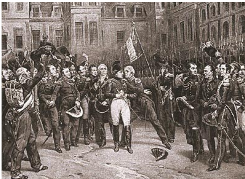
Император прощается с гвардией

Сборы постепенно заканчивались. По условиям с союзниками, император мог взять с собой на остров Эльбу один батальон своей гвардии.