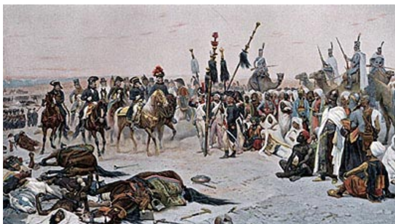
Победа при Эмбабе

20 июля 1798 г. в виду пирамид Бонапарт встретился наконец с главными силами мамелюков. "Солдаты! Сорок веков смотрят на вас сегодня с высоты этих пирамид!" - сказал Наполеон, обращаясь к своей армии перед началом сражения.