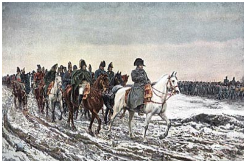
Наполеон в кампании 1814 года

Битва при Шато-Тьери 12 февраля кончилась новой большой победой Наполеона. Если бы не ошибочное движение и опоздание маршала Макдональда, дело кончилось бы полным истреблением сражавшихся у Шато-Тьери союзных сил. 13 февраля Блюхер разбил и отбросил маршала Мармона. Но 14 февраля