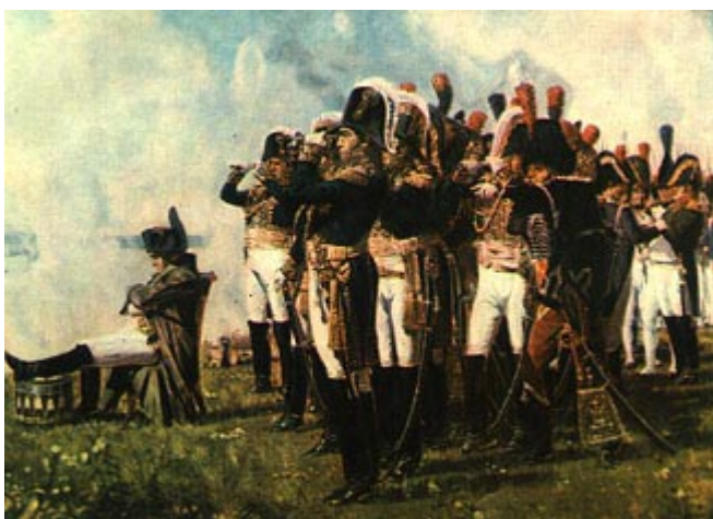
Наполеон на Бородинском поле

Маршалы, пережившие этот день, с восторгом говорили до конца своей жизни о поведении русских солдат у Семеновских флешей. Французы не уступали им. Именно тут раздался предсмертный крик Багратиона навстречу французским гренадерам, под градом картечи бежавшим в атаку со штыками наперевес, не отстреливаясь: «Браво! Браво!» Спустя несколько минут сам князь Багратион, по мнению Наполеона, лучший генерал русской армии, пал смертельно раненный и, под градом пуль, с трудом был унесен с Бородинского поля.