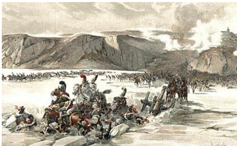
Аустерлиц. Поражение войск III коалиции.

Наполеон лично руководил сражением с начала до конца: почти все его маршалы были налицо. Поражение русских и австрийцев определилось уже в первые утренние часы, но все-таки не погибла бы русская армия так страшно, если бы русские генералы не попали в ту ловушку, которую измыслил и осуществил Наполеон: он угадал, что русские и австрийцы будут стараться отрезать его от дороги к Вене и от Дуная, чтобы окружить или загнать к северу, в горы, и именно поэтому он как бы оставил без