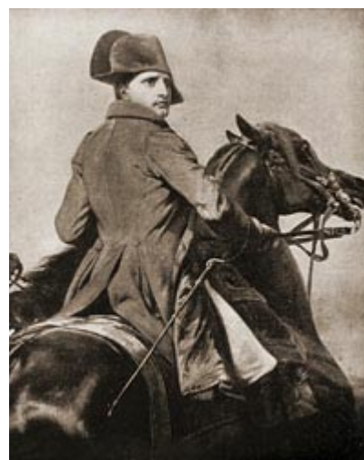
Наполеон въезжает в покоренную Иену

Наполеон предполагал, что главная масса прусской армии сосредоточивается в районе Веймара, чтобы продолжать отход к Берлину, и что генеральное сражение произойдет у Веймара 15 октября. Он послал маршала Даву к Наумбургу и далее на тылы прусской армии, Бернадотт получил приказ присоединиться к Даву, но выполнить его не мог. Наполеон с маршалами Сультом, Неем, Мюратором двинулся на Иену. К вечеру 13 октября Наполеон въехал в г. Иену и, смотря с высот окружающих гор, увидел крупные силы, отходившие по дороге в Веймар. Князь Гогенлоэ знал, что французы вошли в Иену, но он понятия не имел, что и сам Наполеон с несколькими корпусами находится тут же. В ночь с 13-го на 14-е Гогенлоэ остановился по дороге и неожиданно для Наполеона решил принять бой.