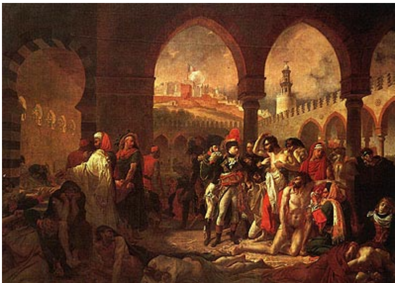
Наполеон в городе Яффа

Поход в Сирию был страшно тяжел, особенно вследствие недостатка воды. Город за городом, начиная от Эль-Ариша, сдавался Бонапарту. Перейдя через Суэцкий перешеек, он двинулся к Яффе и 4 марта 1799 г. осадил ее. Город не сдавался. Бонапарт приказал объявить населению Яффы, что если город будет взят приступом,