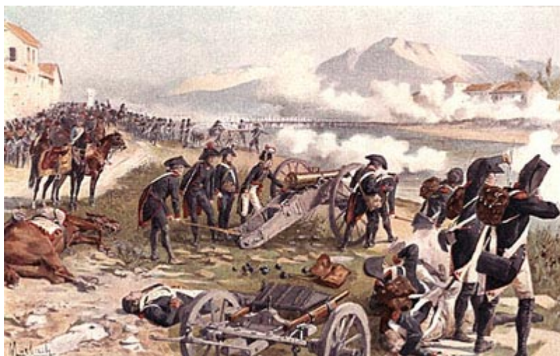
Битва при Лоди

Итак, первое дело было сделано. Оставались австрийцы. После новых побед Бонапарт отбросил их к реке По, заставил их отступить к востоку от По и, перейдя на другой берег По, продолжал преследование. Паника объяла все итальянские дворы. Герцог Пармский, который, собственно, вовсе и не воевал с французами, пострадал одним из первых. Бонапарт не внял его убеждениям, не признал его нейтралитета, наложил на Парму контрибуцию в 2 миллиона франков золотом и обязал доставить 1700 лошадей. Двинувшись дальше, он подошел к местечку Лоди, где ему нужно было перейти через реку Адду. Этот важный пункт защищал 10-тысячный австрийский отряд.