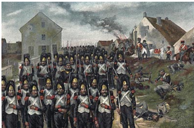
Старая гвардия на марше

Но пока нужно было делать вид, что на этот раз он, Наполеон, ничуть не противится мирным переговорам и если требует опять новобранцев, то вовсе не для войны, а для подкрепления своих мирных намерений. «Ничто с моей стороны не препятствует восстановлению мира,- выслушали сенаторы тронную речь 19 декабря 1813 г.- Я знаю и разделяю чувства французов, я говорю французов, потому