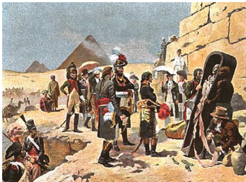
У Египетских пирамид

В исторической карьере Наполеона египетский поход - вторая большая война, которую он вел, - играет особую роль, и в истории французских колониальных завоеваний эта попытка тоже занимает совсем исключительное место.