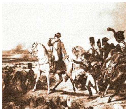
Наполеон в битве при Ваграме

Расправившись с папой, Наполеон приступил к последним военным приготовлениям. 2, 3 и 4 июля император перевел новые корпуса на остров Лобау и туда же велел перевезти больше 550 артиллерийских орудий. 5 июля Наполеон приказал начать переправу с острова Лобау на левый берег. Кроме прежней, пополненной армии, у него был теперь и еще подтянутый из Италии корпус Макдональда. Битва началась 5 июля 1809 г., и началась не так, как ждал эрцгерцог Карл, и не там, где можно было с большим вероятием ее ждать. У Наполеона было твердое правило: не делать