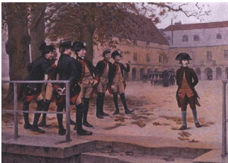
Наполеон в Бриенском военном училище

Обстановка этого уединенного от всего света острова, с его довольно диким населением в горах и лесных чащах, с нескончаемыми междуклановыми столкновениями, с родовой кровной мстью, с тщательно скрываемой, но упорной враждой к пришельцам-французам, сильно отразилась на юных впечатлениях маленького Наполеона.