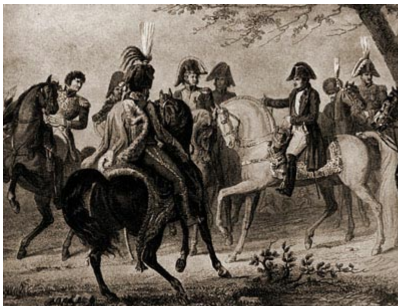
Наполеон дает указания своим генералам перед началом Аустерлицкого сражения

Франции, зная, что к нему едет с ультиматумом от Пруссии Гаугвиц, Наполеон жаждал скорейшего генерального сражения; он был вполне уверен в победе, которая разом кончит войну. Его дипломатический и актерский дар развернулся в эти дни в полном блеске: он угадал все, что творилось в русском штабе, сыграл на руку Александру против Кутузова, употреблявшего последние слабые усилия, чтобы поскорее уйти и спасти русскую армию. Наполеон артистически разыграл роль человека,