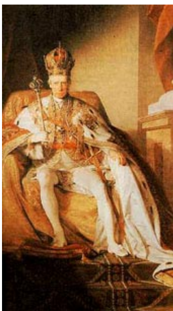
Император Австрии Франц I

Начались переговоры. На многое готов был павший духом император Франц, проклиная теперь тех, кто его толкал полтора года на эту страшную борьбу, которая по кровопролитию далеко превзошла все войны, какие вела Австрия за всю свою историю после Тридцатилетней войны в XVII в. Со страхом вспоминали, как Наполеон наказал папу еще до Ваграмского боя. Что же он сделает с Австрией после Ваграма?