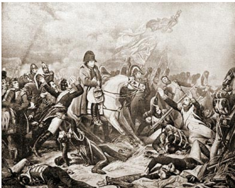
Ватерлоо. Наполеон до последней минуты надеется на приход корпуса Груши

Во время этой знаменитой атаки французская кавалерия попала под огонь английской пехоты и артиллерии. Но это не смутило остальных. Был момент, когда Веллингтон думал, что все пропало,- а это не только думали, но и говорили в его штабе. Английский полководец выдал свое настроение словами, которыми он ответил на доклад о невозможности английским войскам удержать известные пункты: «Пусть в таком случае они все умрут на месте! У меня уже нет подкреплений. Пусть умрут до последнего человека, но