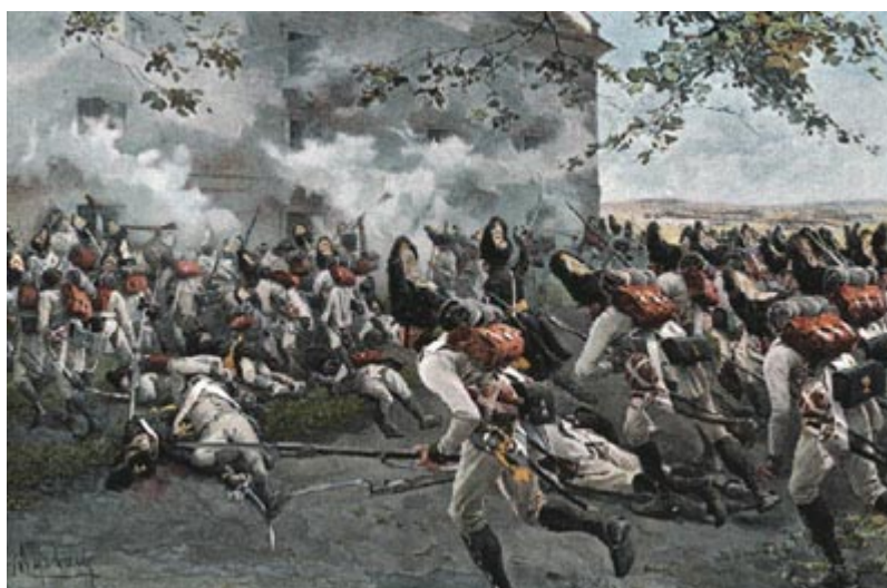
Эсслинг. Бой у зернохранилища

Перейдя через Дунай и продолжая преследовать отступавшего Карла, Наполеон нагнал его в Эберсберге и здесь снова разбил его и отбросил. Наполеон при этом сжег город, причем часть населения (австрийцы утверждали, что половина населения) сгорела живьем. «Мы шли по месиву из жареного человеческого мяса», - говорит о прохождении французской кавалерии через развалины Эберсберга генерал Савари, герцог Ровиго. В этой покрывавшей улицы каше даже вязли копыта лошадей. Это произошло 3 мая. 8 мая Наполеон уже снова, как в 1805 г., ночевал во дворце австрийского императора в Шенбрунне, а 13 мая бургомистр Вены поднес императору ключи от австрийской столицы. Кампания, казалось, идет к быстрому концу. Но Карл, спасая армию, успел перебросить ее через венские мосты на левый берег Дуная, после чего сейчас же сжег мосты. Наполеон решился на необычайно трудную операцию. Примерно в половине километра от венского (правого) берега на Дунае начинается отмель, ведущая к острову Лобау. Наполеон решил навести понтонный мост до этой отмели, переправить туда главные силы своей армии, поредевшей от битв и от оставления гарнизонов по пути, а затем уже без труда переправиться с этого острова