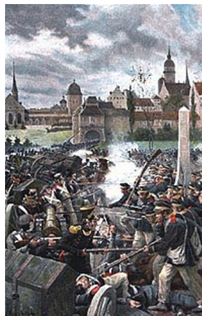
Французская армия покидает Лейпциг

Весь день 17 октября прошел в уборке раненых, в приготовлениях к продолжению битвы. Наполеон после долгих колебаний решил отойти к линии реки Заале. Но он не успел привести это намерение в исполнение, как разгорелось на рассвете 18 октября новое сражение. Соотношение сил еще более круто изменилось в пользу союзников. Потеряв 16 октября около 40 тысяч человек, они получили огромные подкрепления 17-го и в ночь на 18-е, и в битве 18 октября у них было почти в два раза больше войск, чем у Наполеона. Битва 18 октября была еще страшнее, чем та, которая происходила 16-го, и тут-то, в разгаре боя, вдруг вся саксонская армия (подневольно сражавшаяся в рядах Наполеона) внезапно перешла в лагерь союзников и, мгновенно повернув пушки, стала стрелять по французам, в рядах которых только что сражалась. Но Наполеон продолжал бой с удвоенной энергией, несмотря на отчаянное положение.