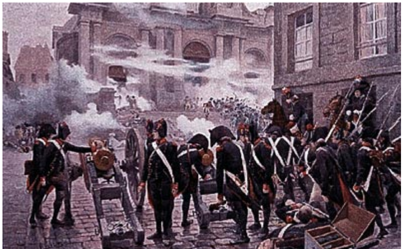
Пушки генерала Бонапарта против мятежников-роялистов

момент. Они отвечали ружейной пальбой. К середине дня все было кончено. Оставив несколько сот трупов и увлакивая за собой раненых, мятежники бежали в разных направлениях и скрылись по домам, а кто мог и успел, покинул немедленно Париж. Вечером Баррас горячо благодарил молодого генерала и настоял, чтобы Бонапарт был назначен командующим военными силами тыла (сам Баррас немедленно сложил с себя это звание, как только восстание было разгромлено).