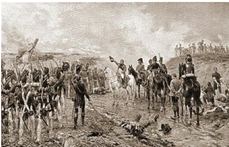
Наполеон и Старая гвардия перед последним сражением

на него не как на императора, защищающего свой престол от другого монархического претендента, но как на вождя войск послереволюционной Франции, который отправляется оборонять территорию от интервентов и от Бурбонов, идущих восстанавливать старый строй. Этот военный вождь был к тому же в глазах всего света, и друзей и врагов, неподражаемым мастером и художником в деле войны, гениальнейшим из всех когда-либо существовавших до того времени великих полководцев, виртуозом военной стратегии и тактики. Страна и стоявшая перед ней Европа замерли в ожидании.