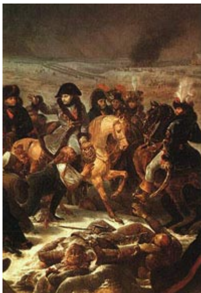
Наполеон в битве при Прейсиш-Эйлау

Она произошла 8 февраля 1807 г. при г. Эйлау (точнее Прейсиш-Эйлау) в восточной Пруссии. Наполеон лично командовал французской армией.