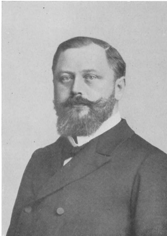
Abb. 9. Dr. Fritz Schaudinn.