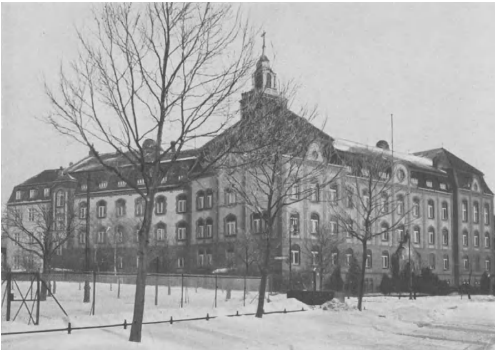
Abb. 5. Dienstgebäude der ehemaligen Biologischen Abteilung des Reichsgesundheitsamts, jetzigen Biologischen Reichsanstalt für Land- und Forstwirtschaft in Berlin-Dahlem, Königin=Luise=Strasse 17—19.

Amte im Jahre 1898 eine besondere Abteilung für biologische Studien auf dem Gebiete des allgemeinen Pflanzenschutzes angegliedert. Neben den erforderlichen botanischen, zoologischen, agrifkultur=chemischen und bakteriologischen Laboratorien erhielt diese sog. „Biologische Abteilung“ auch ein eigenes Versuchsfeld zugewiesen, wo sie die Forschungen durch das Experiment innerhalb des Laboratoriums in der freien Natur ergänzen und insbesondere auch vor der Übertragung der Ergebnisse wissenschaftlicher Laboratoriumsversuche in die große Praxis zunächst deren Verwendbarkeit in kleineren Verhältnissen erproben konnte. Es wurde ein großes Versuchsfeld auf dem Gebiete der preußischen Domäne Dahlem (Königin=Luise=Strasse 17—19) erworben und für die Bedürfnisse der Abteilung