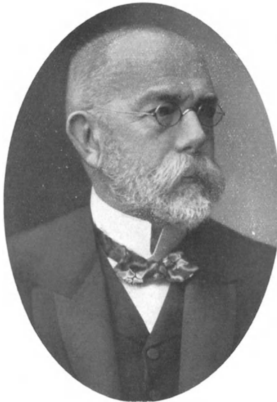
Abb. 8. Dr. Robert Koch.

An der Erforschung der Pocken, deren Ätiologie bis auf den heutigen Tag noch nicht einwandfrei geklärt ist, hat das Reichsgesundheitsamt eifrig mitgearbeitet. Robert Koch wies als