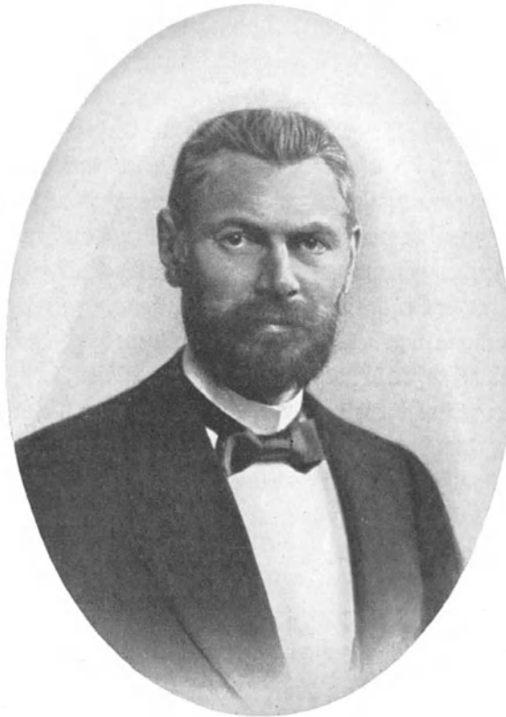
Abb. 4. Dr. med. h. c. Karl Köhler, Präsident des Reichsgesundheitsamts (1885—1905).

Sachverständigen der verschiedensten Zweige der Wissenschaft, namentlich aus Ärzten, Nahrungsmittelchemikern, Zoologen, Botanikern, Apothekern und Veterinären zusammen setzte, eine neutrale Spitze gegeben werden. Außerdem wurde berücksichtigt, daß dem Amte in immer steigendem Umfange die Aufgabe zufiel, die Ergebnisse der wissenschaftlichen Forschungen auf den verschiedenen Gebieten in die Form von Ge-