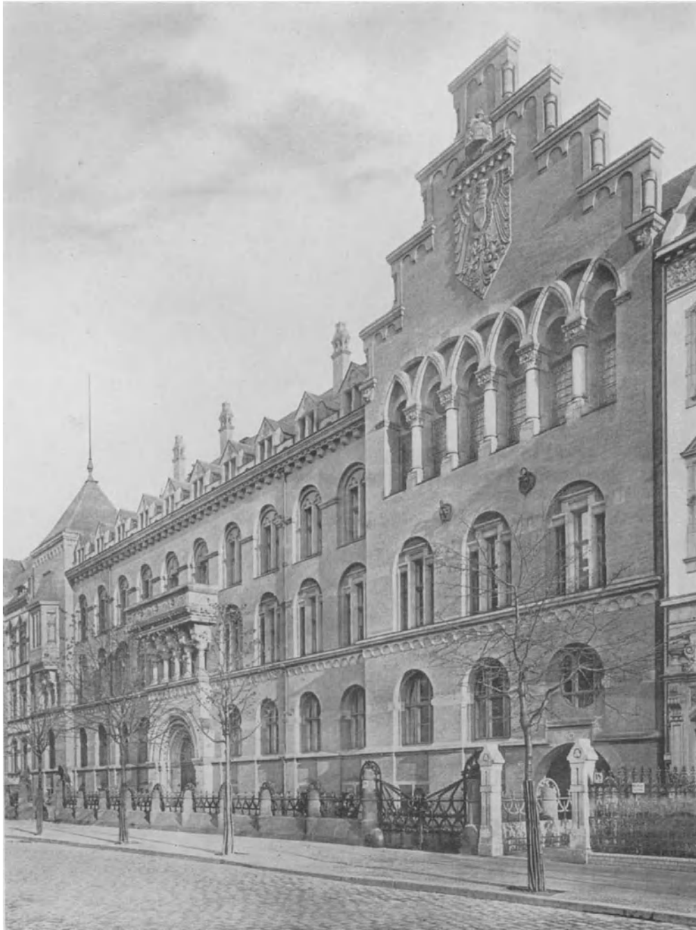
Abb. 1. Verwaltungsgebäude des Reichsgesundheitsamts in Berlin, Klopstockstr. 18.