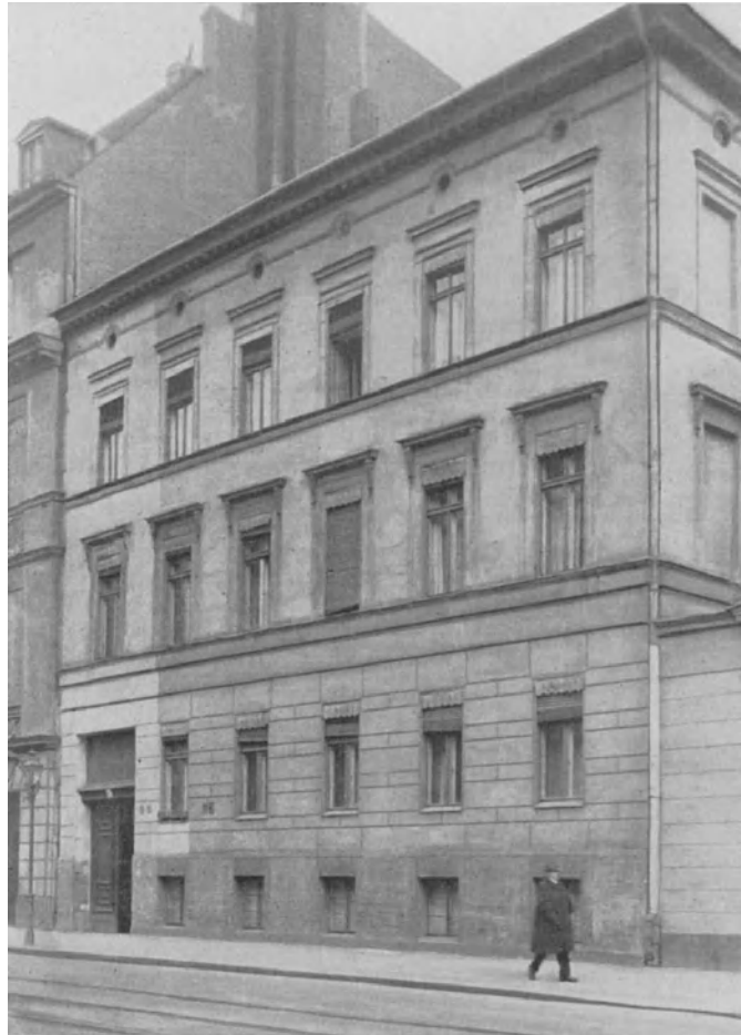
Abb. 3. Ehemaliges Dienstgebäude des Reichsgesundheitsamts in Berlin, Luisenstraße 57 (1879—1897).

hindern oder doch ihr Auftreten in den engsten Grenzen zu halten. Für die Wahl der zu treffenden Maßnahmen war es besonders wichtig, zunächst das Wesen der Krankheiten, d. h. ihre Ursachen und Entwicklungsbedingungen, zu kennen. Die Beobachtung auf diesem Gebiete erhielt eine neue Richtung dadurch, daß Dr. Koch in zielbewußter, zweck-