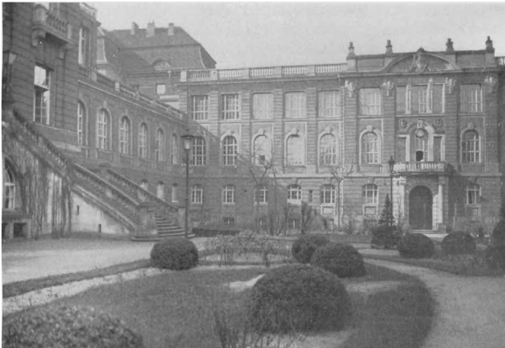
Abb. 10. Zweigstätte des Reichsgesundheitsamts in Berlin, Scharnhorststraße 35 (umfassend Teile der ehemaligen Kaiser-Wilhelms-Akademie für das militärärztliche Bildungswesen).

nichtbakteriellen Krankheitserregern, den einzelligen Lebewesen tierischer Herkunft und den sog. filtrierbaren Vira, ist entsprechend der praktischen Bedeutung dieser Krankheiten Gegenstand der Forschung gewesen. Genannt seien nur die wichtigen Arbeiten über die Immunität bei Schweinepest, Hühnerpocken, Vakzine, Herpes, Trypanosomenkrankheiten, Hühnerspirillose, Rückfallfieber und bei der Weilschen Krankheit. Schließlich ergab sich aus der Entdeckung der für die Serodiagnose der Syphilis so wertvollen Komplexbindungsreaktion durch v. Wassermann, der sog. Wassermannschen Reaktion, ein neues Arbeitsgebiet von praktischer Wichtigkeit, zumal es sich im Verlauf des Weltkrieges als notwendig herausstellte, die in den einzelnen öffentlichen Untersuchungsstellen stark von-