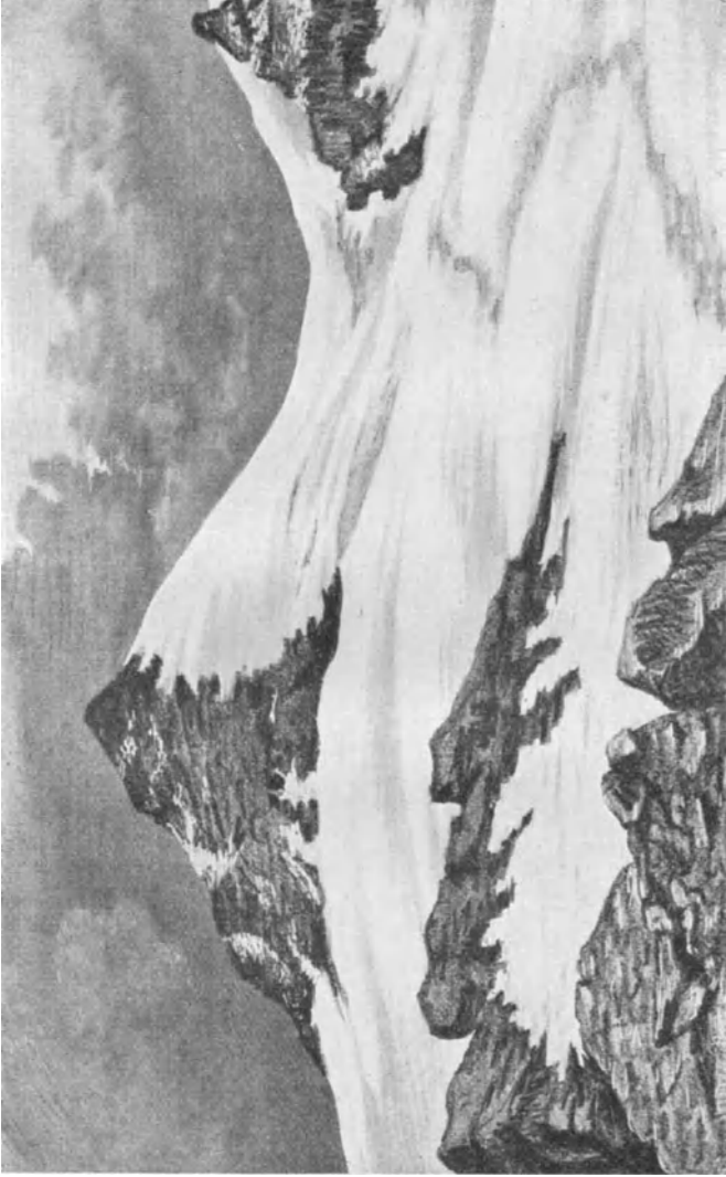
Theodulpass und Theodulhorn. Zeichnung 1886.