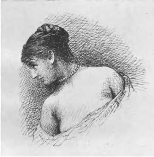
Studie. Federzeichnung 1888.