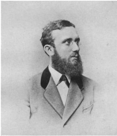
Mit 26 Jahren.