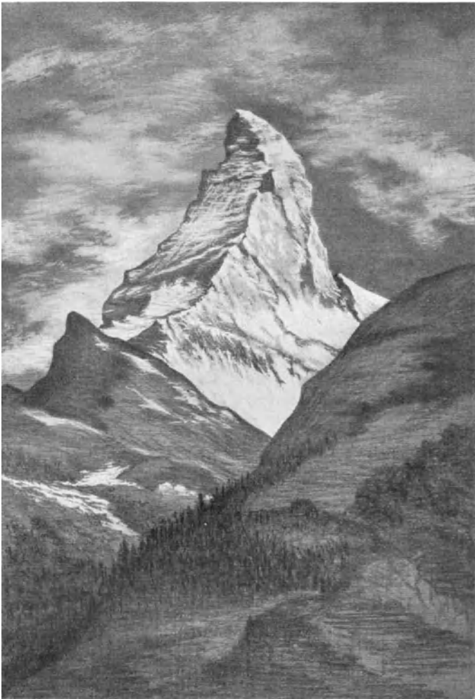
Matterhorn von Riffelalp aus. Zeichnung 1886.