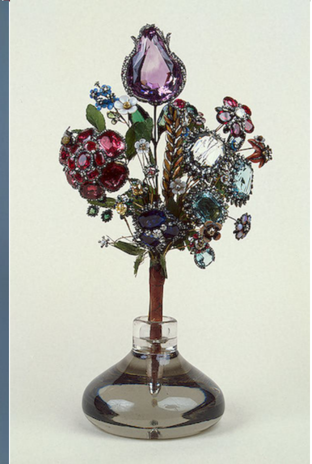
Букеты цветов из драгоценных и поделочных камней в золотых и серебряных оправках, 1740-е гг.

Золото, серебро, бриллианты, драгоценные и поделочные камни, стекло, ткань; полировка