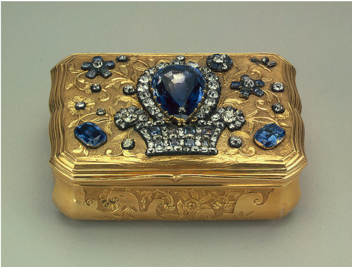
Табакерка прямоугольная с волнистыми стенками, 1740-е гг. 2.6x7.4x5.5 см; золото, серебро, бриллианты, сапфиры, кварц, чеканка, полировка, пунцирование