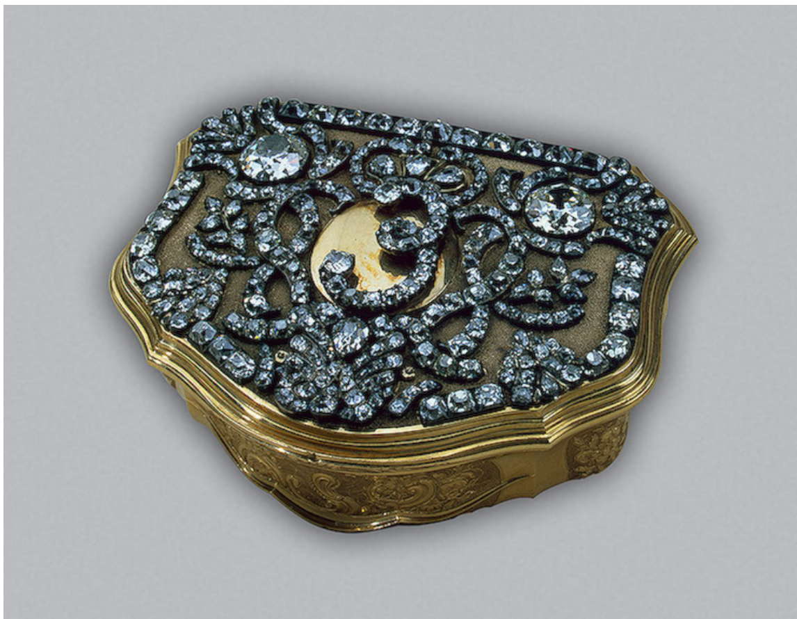
Табакерка с вензелем императрицы Елизаветы Петровны, ок. 1750 г. 2.1x7.1x5.7 см; золото, серебро, бриллианты; чеканка, полировка, пунцирование