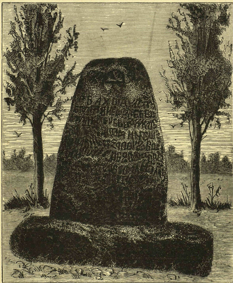
Могіла кошеваго атамана И. Д. Сирко.