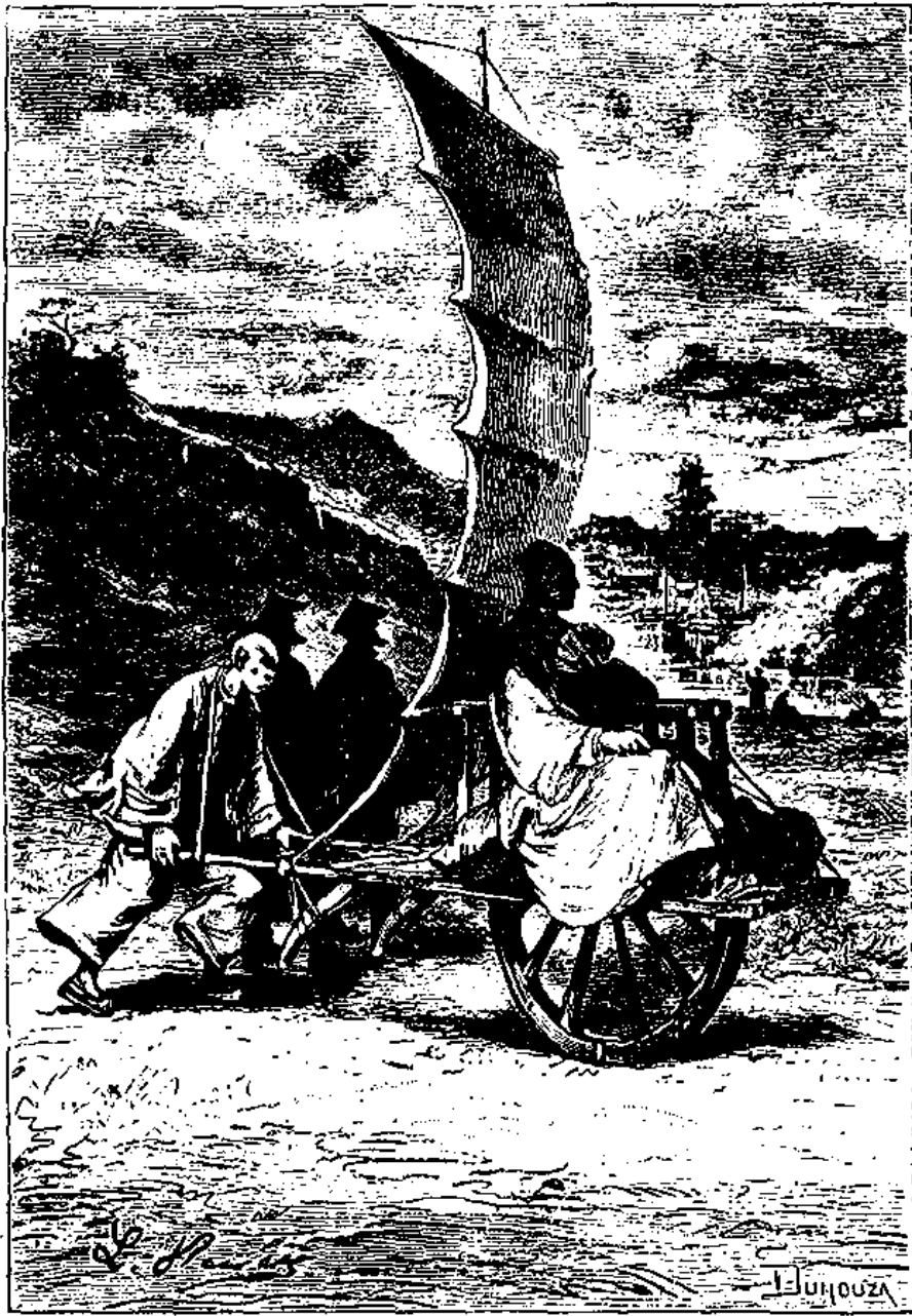
مسافرت با ارایه‌های بادبانی