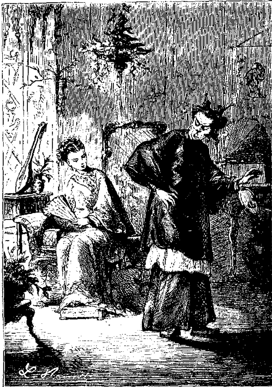
نامه ترسیده است