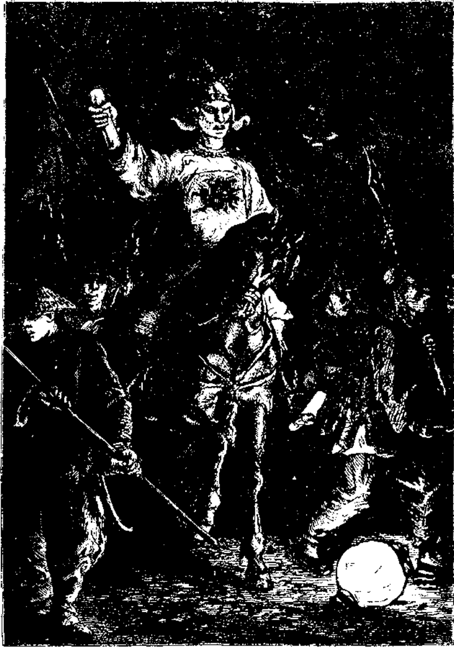
هر نوع جشن و شادی ممنوع است