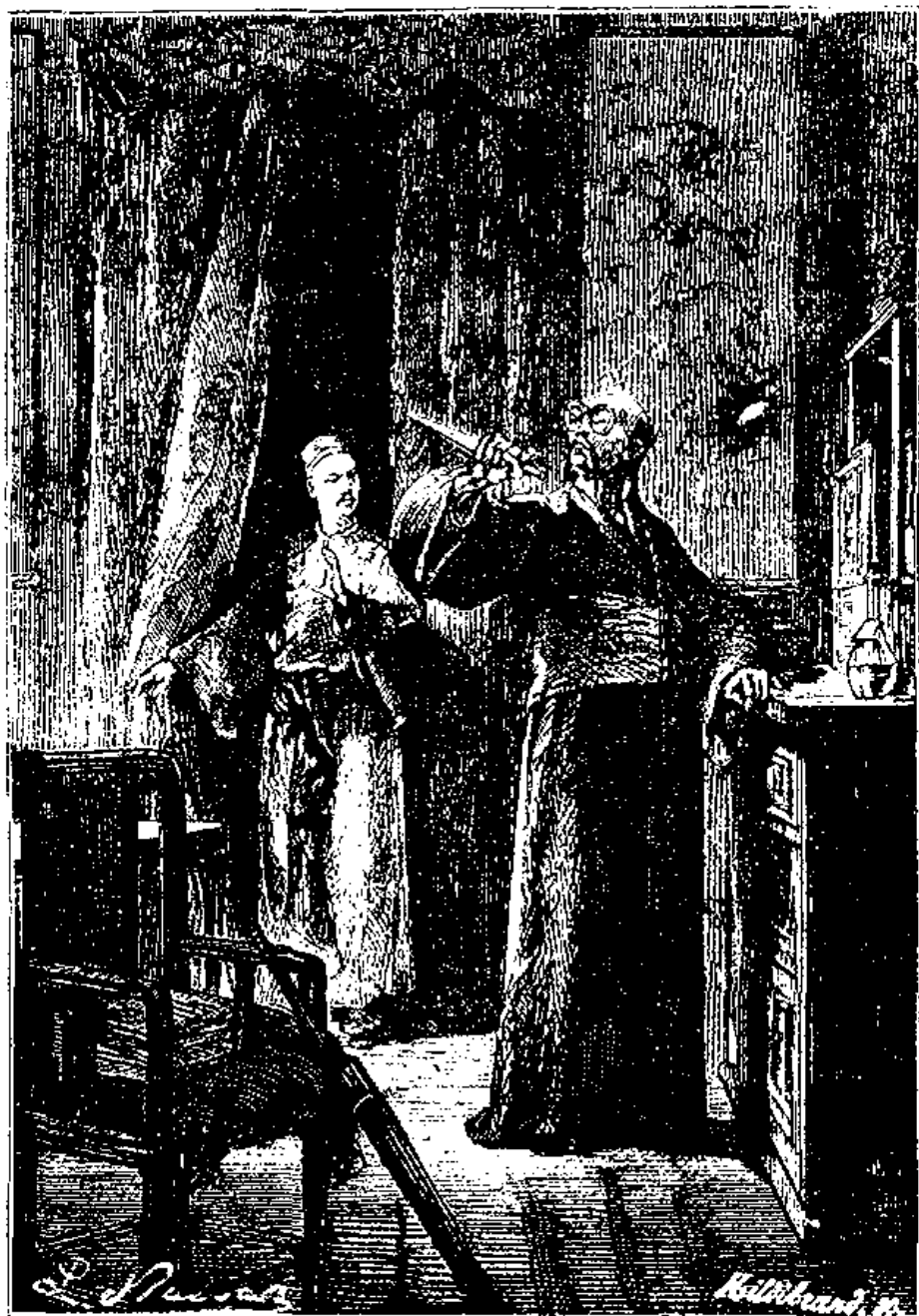
کین فو درانتظار مرگ