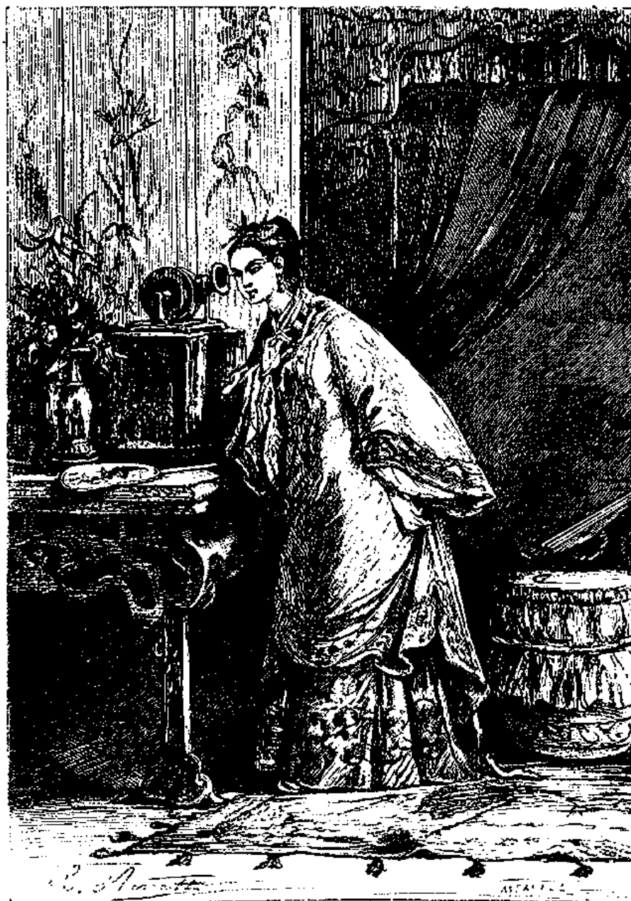
خانم لئو به ضبط صوت گوش میدهد