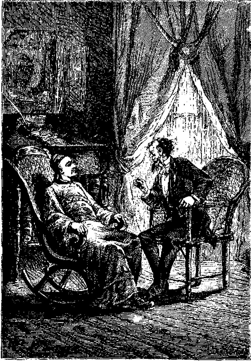
در بيمه عمر