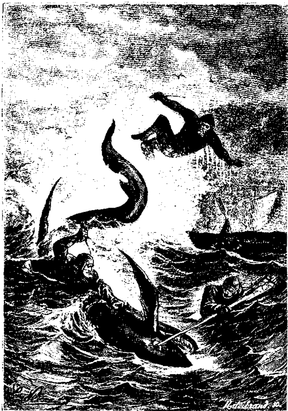
سون بدريا افتاد