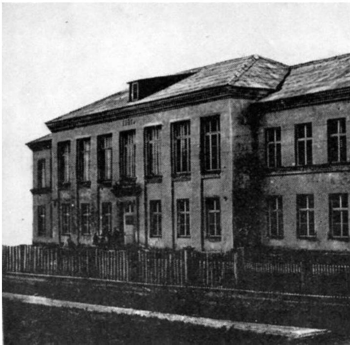
Средняя школа № 3.