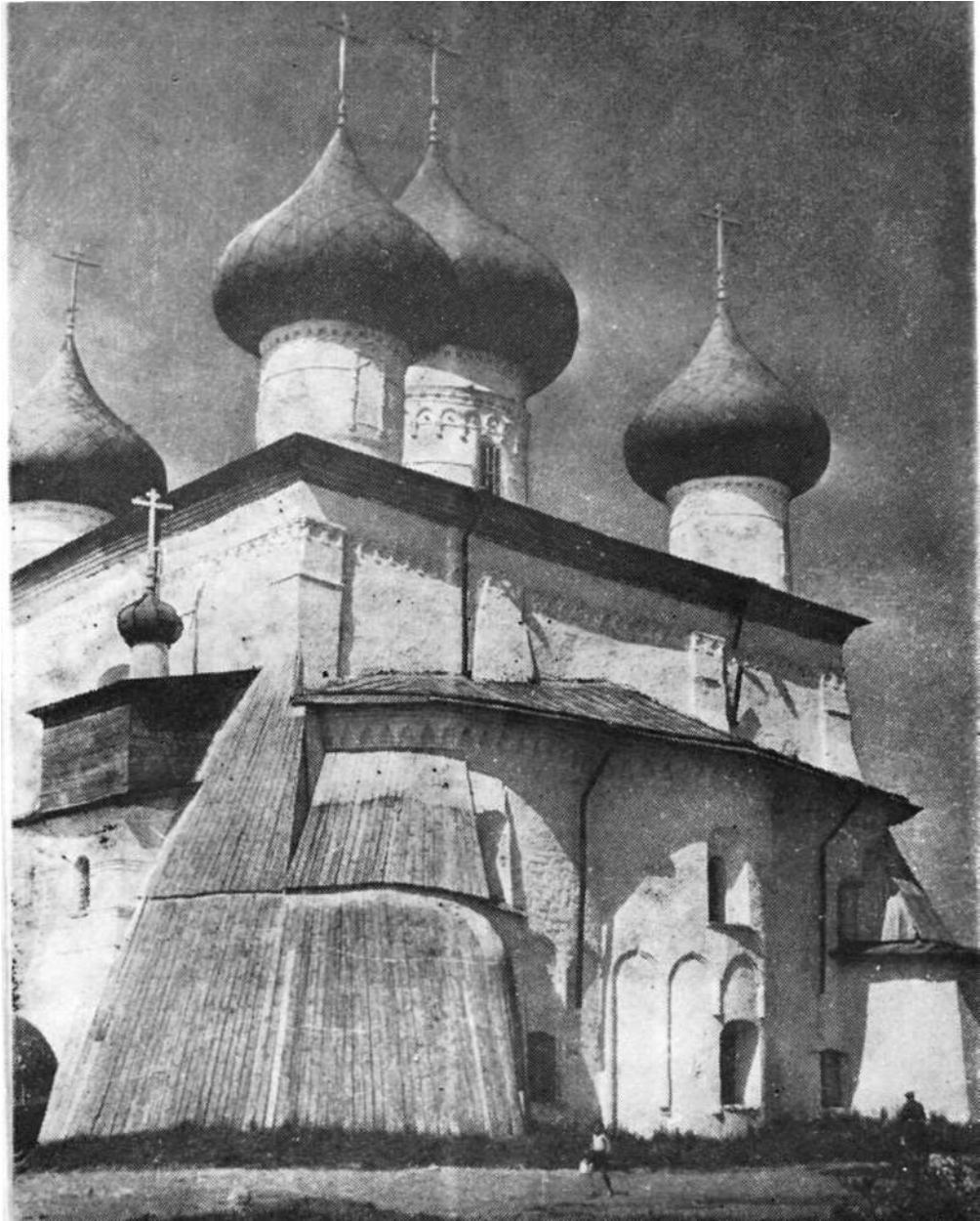
Христорождественский собор. XVI в.