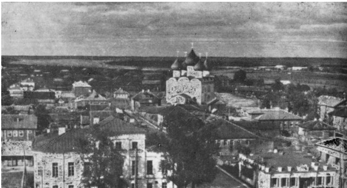
Общий вид г. Каргополя.