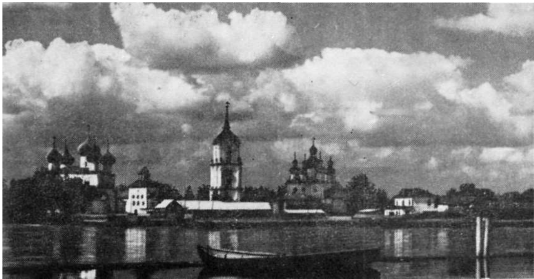
Ансамбль Советской площади. Вид с реки.