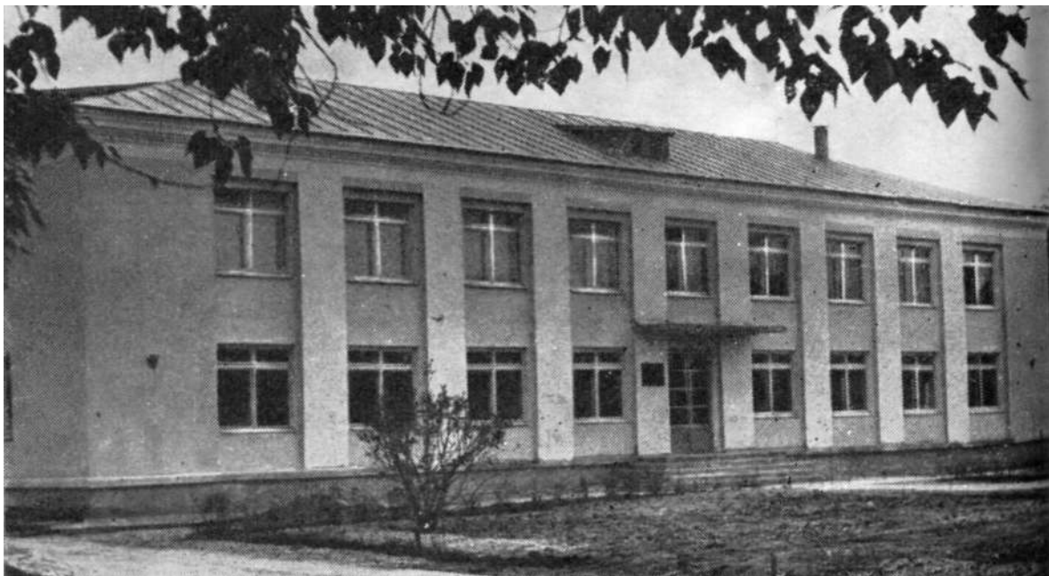
Новое административное здание.