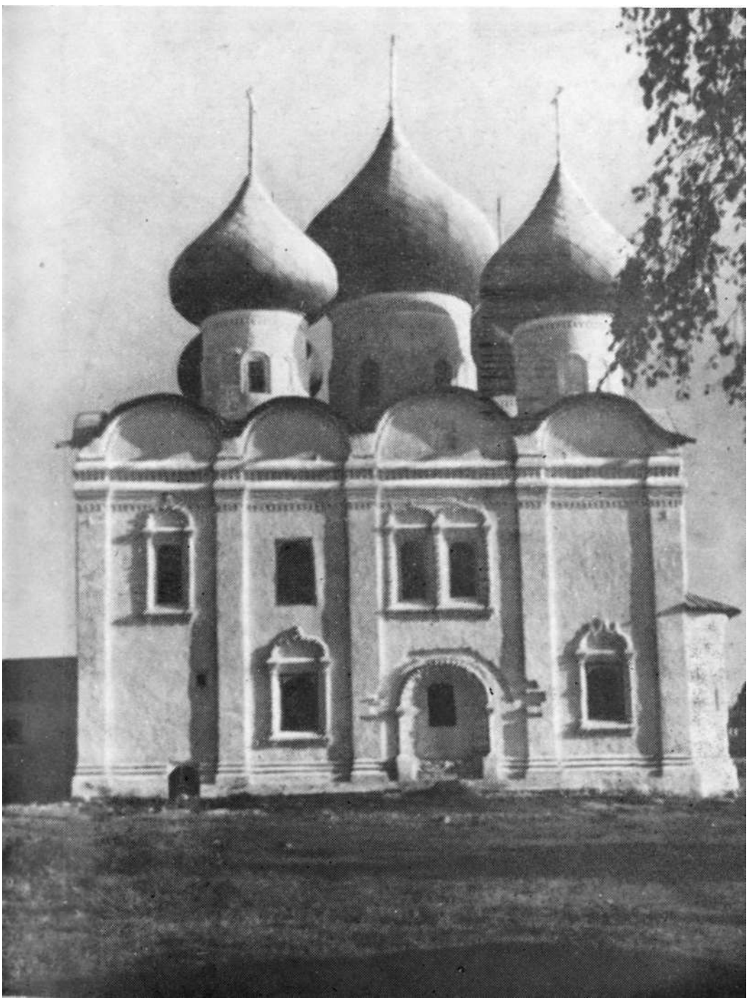
Воскресенский собор. Южный фасад. XVII в.