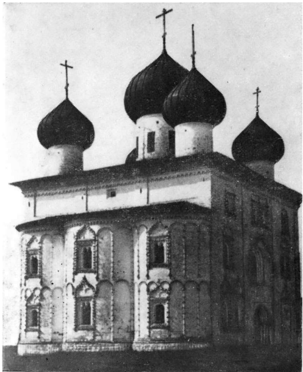
Благовещенская церковь. Западный фасад. XVIII в.