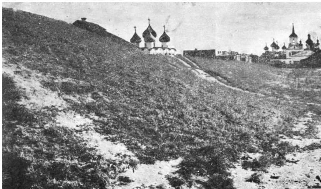
Остатки городского вала «Валушки».