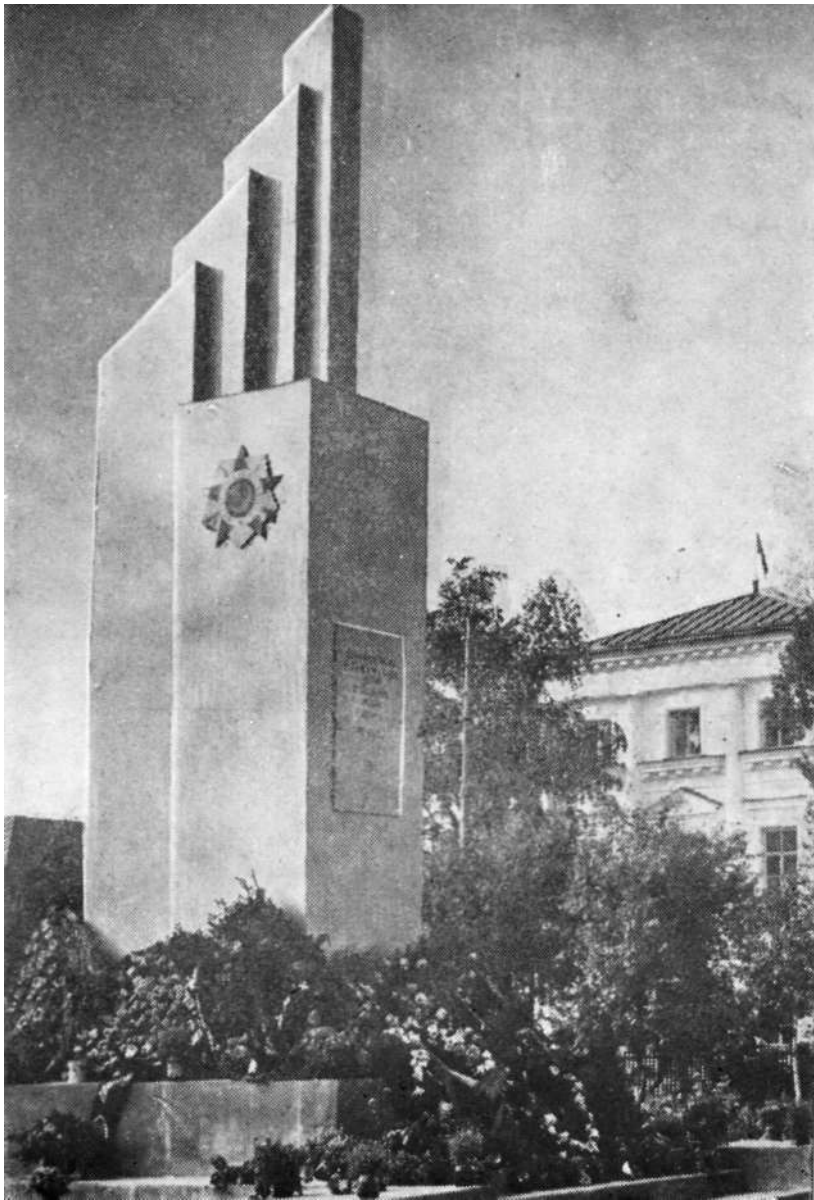
Памятник землякам, погибшим в боях за Советскую Родину. 1941—1945 гг-