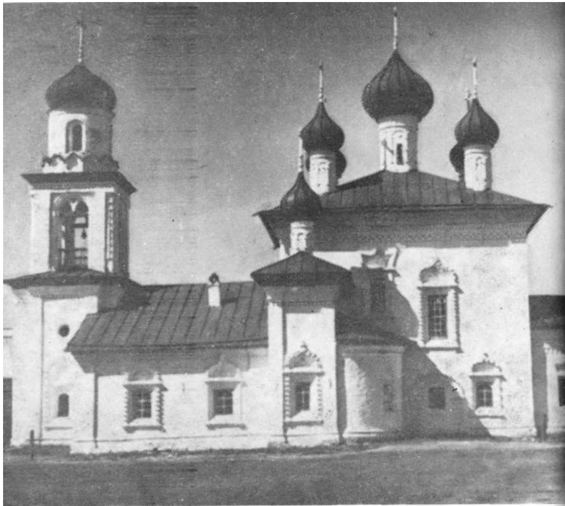
Рождественская церковь. Южный фасад. Начало XIX в.