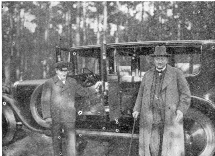
Г. В. Чичерин в Германии на лечении. 1928 г.

Однако г-н Чемберлен нашел возможным ответить на это лишь голым заявлением, что не имеет ничего добавить к своей предшествующей ноте. В настоящий момент британская рабочая партия предложила британскому кабинету со своей стороны назначить расследование по делу о так называемом «письме Коминтерна». Британский кабинет отверг ее предложение, потому что расследование, несомненно, доказало бы подложность этого документа.