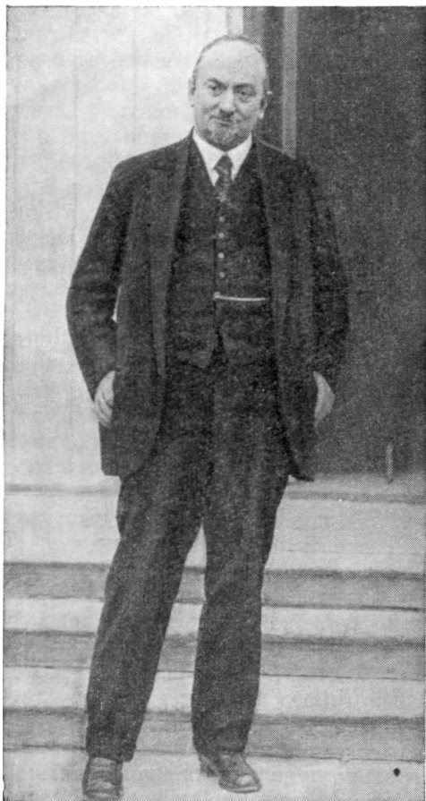
Г. В. Чичерин — 1925 г.

вопрос об этих проливах играет чрезвычайно большую роль. Швеция примыкает лишь к одному из трех балтийских проливов — к Зунду, Дания же господствует над всеми тремя проливами, отсюда ее особое значение в этой связи.