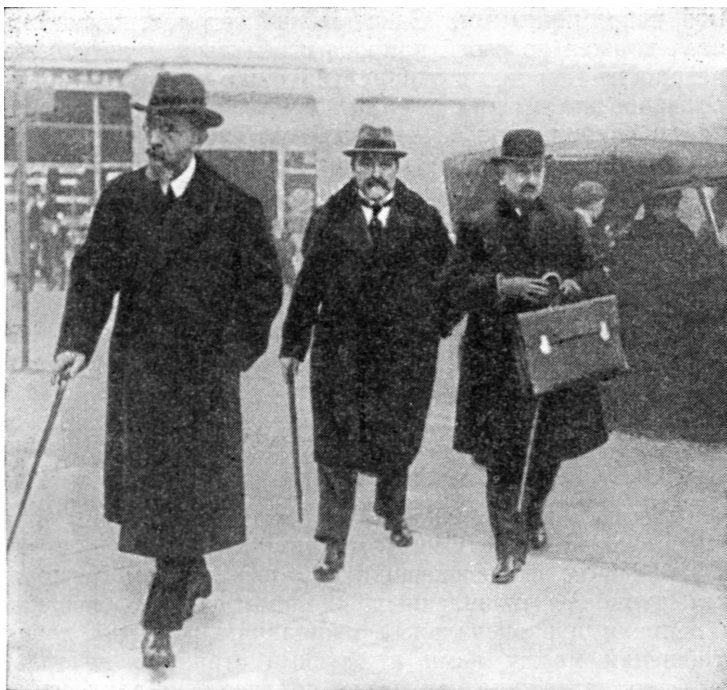
В. В. Боровский, Я. Х. Давтян и Г. В. Чичерин в Лозанне — 1922 г.

обмен, то есть насильственное изгнание всего греческого населения из Турции, за исключением Константинополя, отказ от всех привилегий для иностранцев и отказ даже на будущее время от права иностранцев братья за либеральные профессии в Турции, полная ликвидация капитуляций, приравнение иностранных обществ к турецким, предоставление иностранным юридическим советникам одних лишь совещательных функций без всяких судебных или других прав — все это является не только громадной дипломатической победой Турции, но и первым невиданным до сих пор примером отступления империалистических держав перед угнетенным народом Востока.