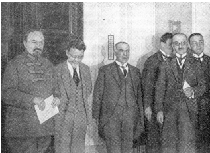
М. И. Калинин и Г. В. Чичерин после вручения верительных грамот греческим посланником. — 1924 г.

и руководимого английскими агентами. Только что английским агентам удалось на границе Советского Туркестана вооружить и поднять первобытное племя иомудов против политики центрального персидского правительства, планомерно стремящегося к превращению Персии в современное развитое государство, к европеизированию ее. В то же время поднимаются наипреданнейшие вассалы Англии — айсоры, остаток древнего народа ассирийцев, живущие в некоторых местностях Западной Персии и в некоторых восточных провинциях Турции. В главной цитадели английского влияния на Ближнем Востоке, среди курдов, феодальные вожди которых чуть ли не в большинстве своем получают подачки от Англии, одновременно началось движение за так называемую независимость, т. е. на самом деле борьба против модернизирующейся Турции и модернизирующейся Персии. Это движение чуть ли не минута в минуту совпало с внезапным и планомерным взрывом бандитского движения в Западной Грузии, в то время как эскадра адмирала Битти курсирует по Черному морю и готова вмешаться, где это понадобится Англии.