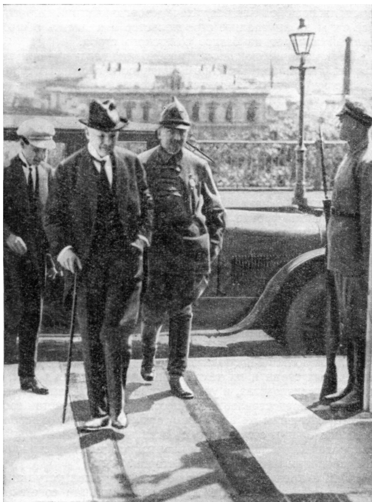
Г. В. Чичерин сопровождает иностранного представителя на прием в Кремле

возможно, без таких жертв, которые наносили бы ущерб жизненным интересам трудящихся масс.