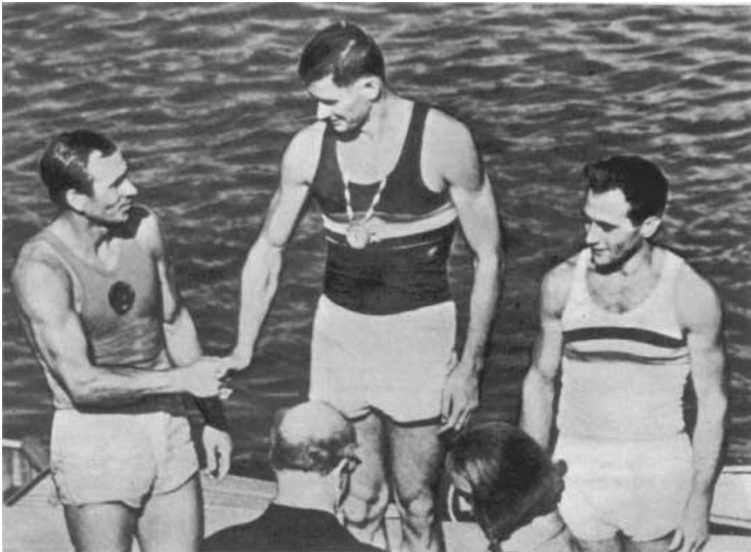
Александр СИЛАЕВ (слева) поздравляет венгра Яноша Парти после победы на римской Олимпиаде

В ту пору разгорались страсти между сторонниками двух школ гребли, каждая из которых опиралась на фундаментальные теоретические исследования, и доводы их подкреплялись победами лучших представителей. И одна самым решительным образом отвергала другую.