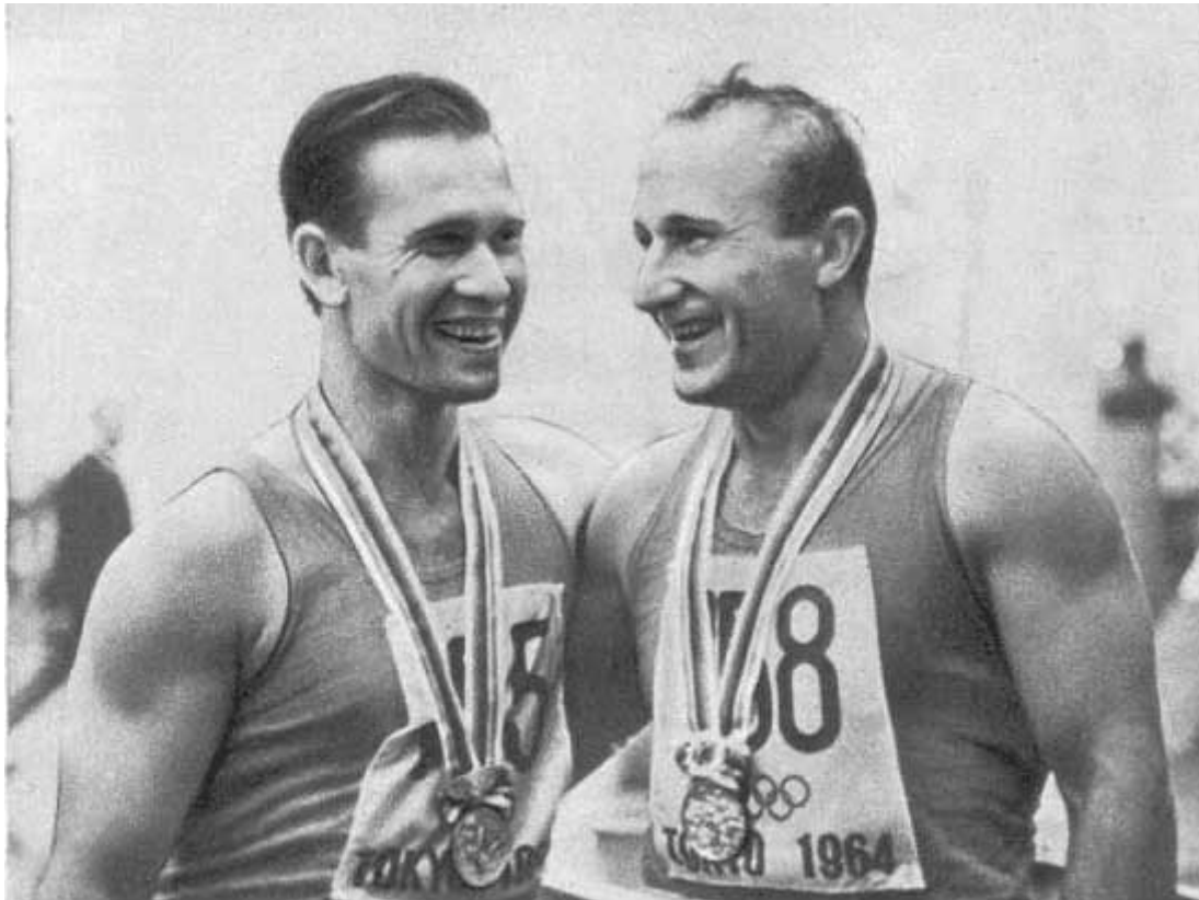
Андрей ХОМИЧ и Степан ОЩЕПКОВ чемпионы Олимпийских игр на каноэ двойке 1964 г. Токийская Олимпиада

Другое дело — наши достижения в каноэ-двойке. Советские гребцы выиграли в этом классе судов на пяти Олимпиадах. Начало было положено Павлом Хариным и Грацианом Ботевым. Они стали олимпийскими чемпионами в 1956 году. На Играх в Риме победили Леонид Гейштор и Сергей Макаренко, а в Токио — Андрей Химич и Степан Ощепков.