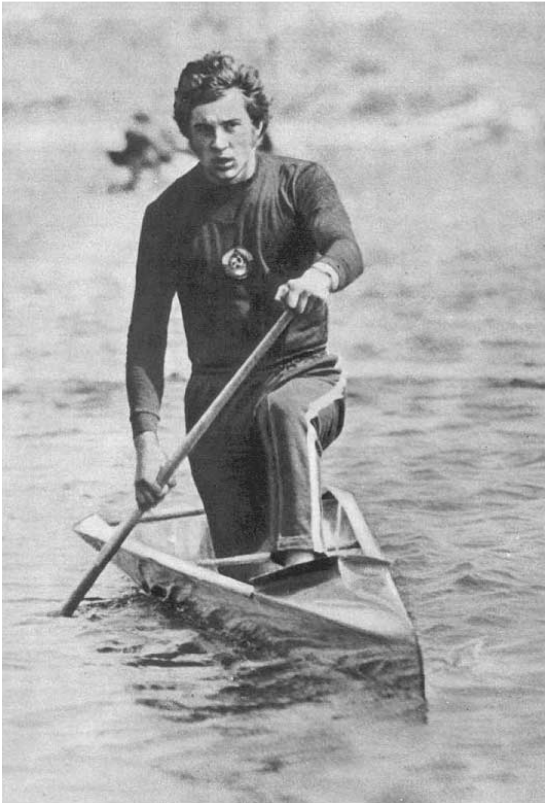
Первый Олимпийский чемпион на каноэ-одиночке Александр РОГОВ

Гонка на каноэ-одиночке вызвала огромный интерес у канадцев. В финале шел их соотечественник Джон Вуд, он имел превосходные шансы на золотую медаль, и в день решающей гонки толпы зрителей спешили на трибуны гребного канала, расположенного на островке Норд-Дам. Неслыханно упорным было состязание каноистов, всего какие-то сотые доли секунды разделили на финише Рогова и Вуда, но первым пересек створ наш каноист. Так было вознаграждено упорство тренеров, которые никак не желали смириться с печальной традицией в этом классе судов.