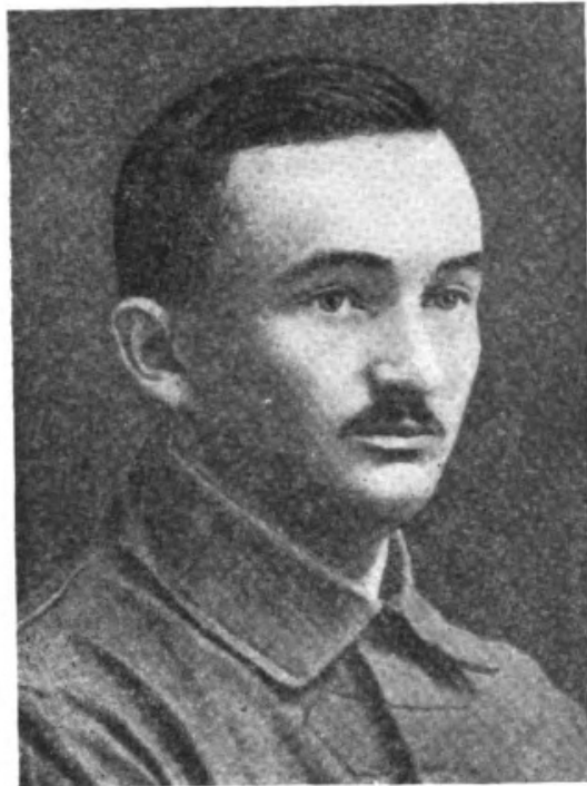
Шипек Адольф, командир 1-го Пензенского чехословацкого полка (1918 г.).