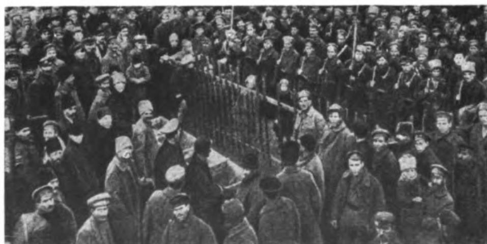
На фотографиях: вверху — командный состав китайского батальона 29-й стрелковой дивизии III армии Восточного фронта (1918 г.); в середине — польская революционная рота в Иркутске (1918 г.); внизу — румынский революционный батальон перед отправкой на фронт (Одесса, март 1918 г.)