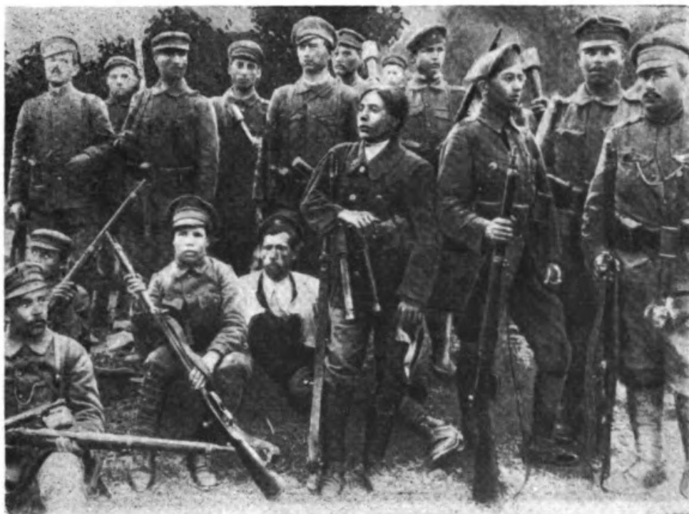
Взвод 1-го интернационального батальона Красной гвардии, сформированный из бывших военнопленных.