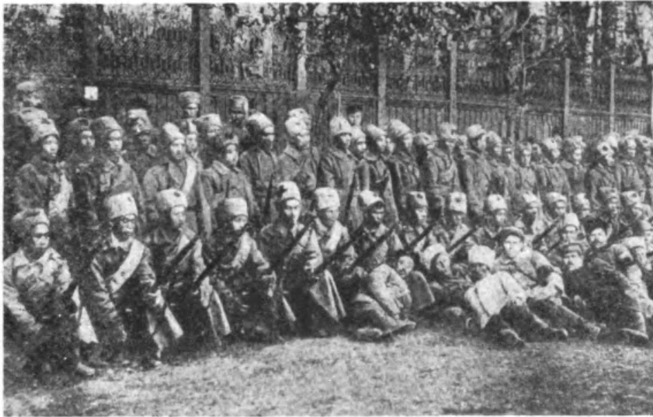
Бойцы китайского батальона (Восточный фронт, 1918 г.).