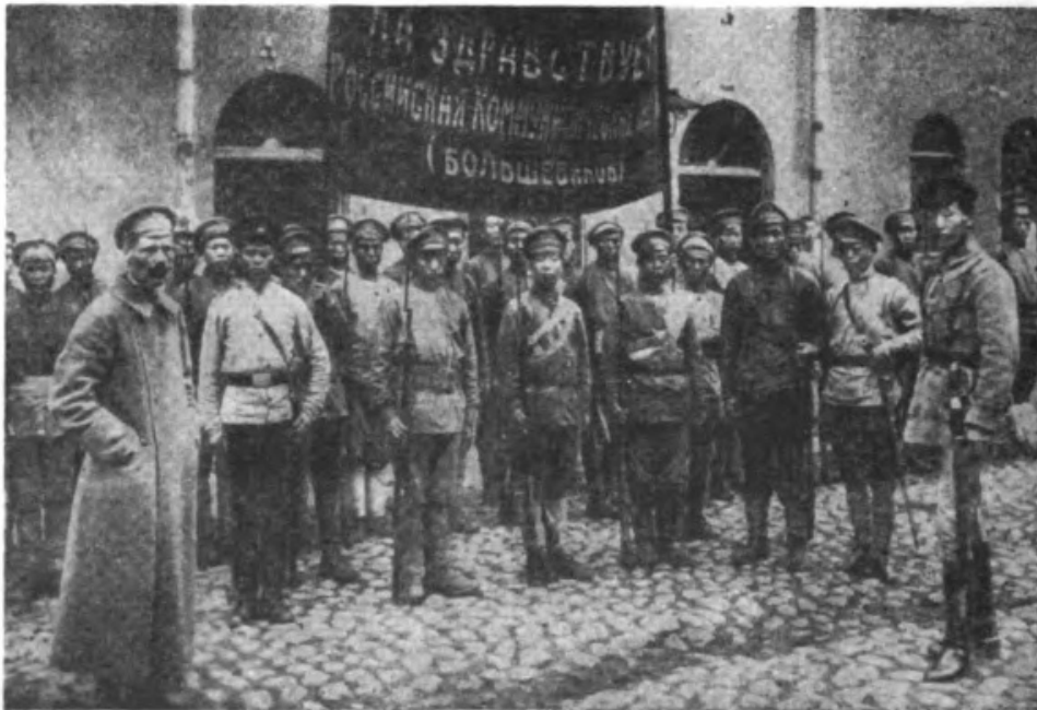
1-й интернациональный коммунистический китайский отряд перед отправкой на фронт (1918 г.)