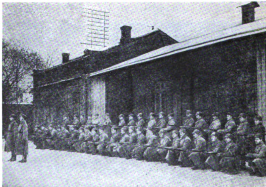
Группа бойцов отряда финских железнодорожников-коммунистов, защищавших Петроград в период первого похода Юденича (1919 г.).