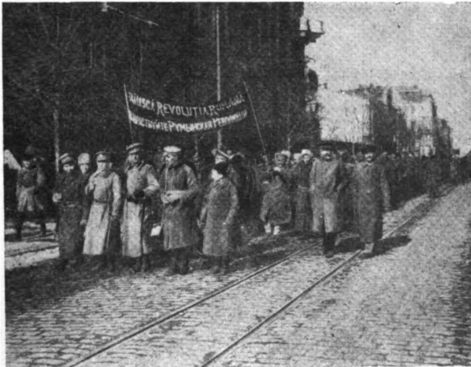
Румынский революционный батальон (Одесса, январь 1918 г.).