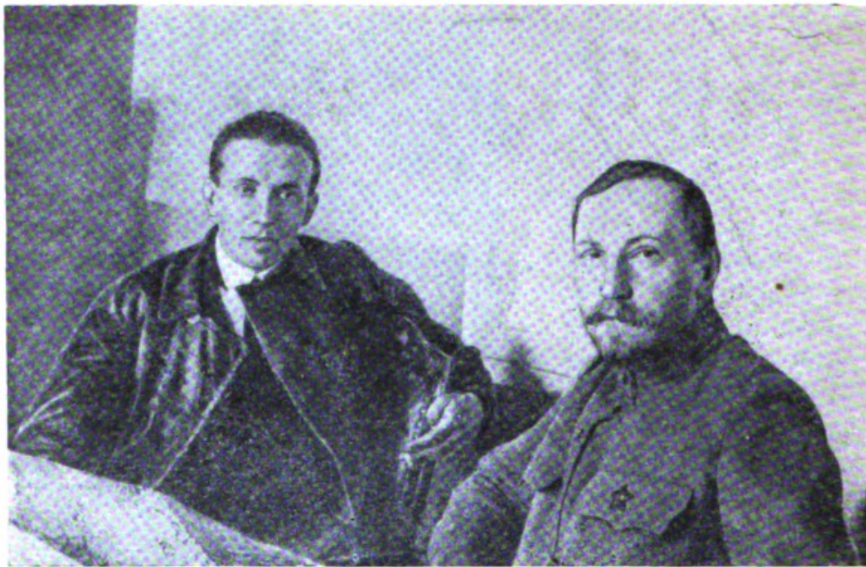
Видный деятель Венгерской советской республики Тибор Самуэли и Народный Комиссар по военным делам Украины Н. И. Подвойский (май 1919 г.).