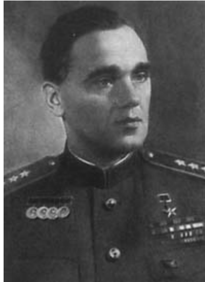
А. Н. Туполев, авиаконструктор.