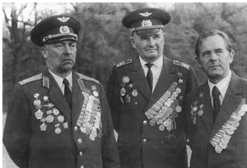
Дважды Герой Советского Союза майор Л. Беда 1945 г.