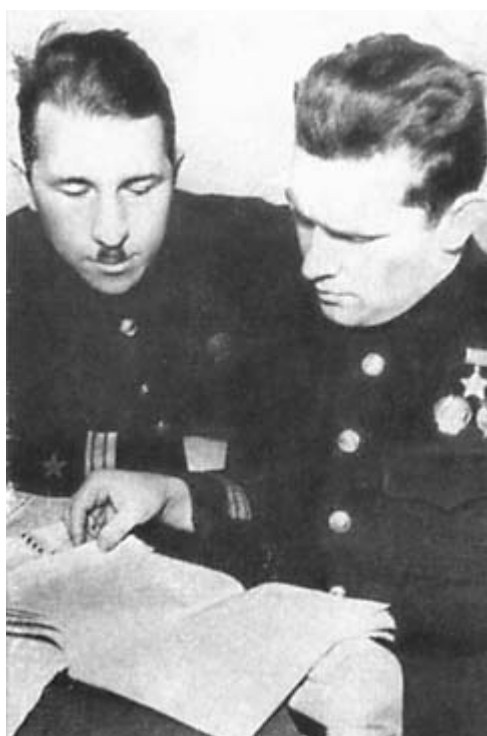
Командир 2-го гвардейского смешанного авиаполка Герой Советского Союза майор Б. Ф. Сафонов и военком Ф. П. Проняков принимают присягу у знамени гвардейского полка. 1 мая 1942 г.