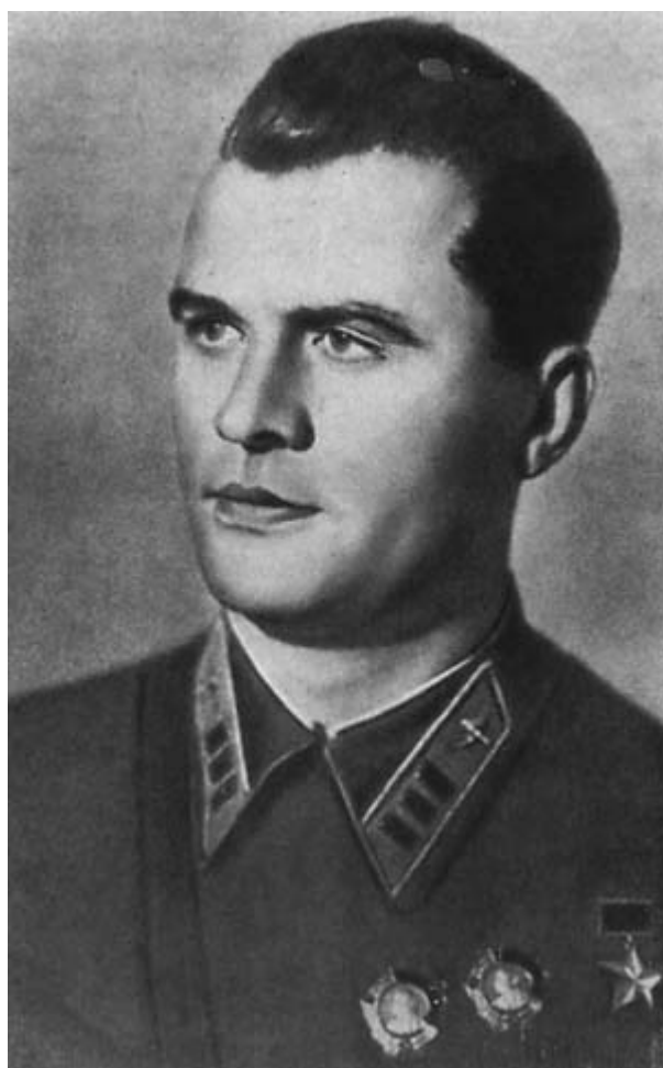
А. С. Яковлев, авиаконструктор.