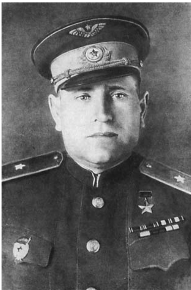
Памятник дважды Герою Советского Союза И. С. Полбину в селе Полбино (бывшее Ртищево-Каменка).