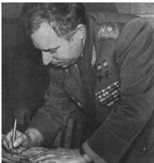
Генерал-лейтенант авиации Л. И. Беда и летчик-космонавт СССР П. И. Климук.