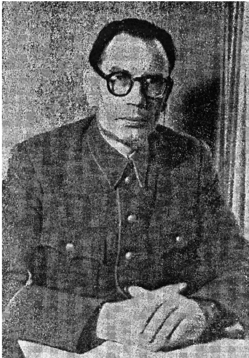
Генерал - лейтенант Андрей Андреевич Власов