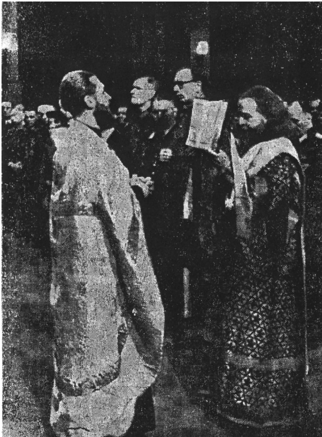
Богослужение в I Дивизии Р.О.А.