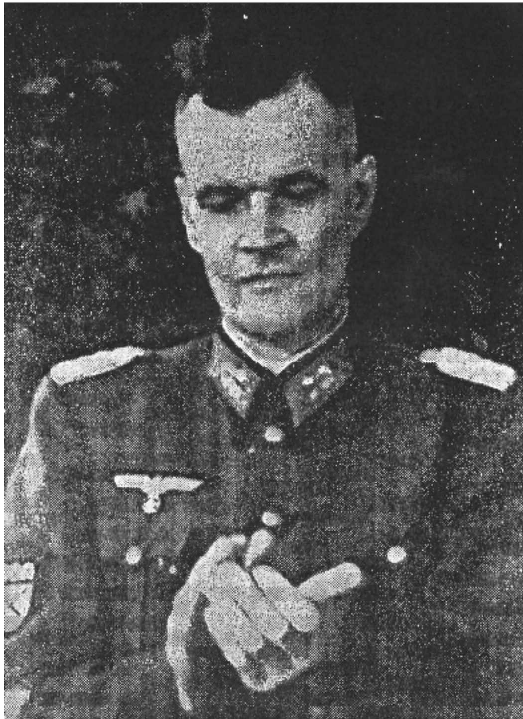
Начальник Штаба Вооружённых сил К.О.Н.Р. генерал-майор Ф.Трухин