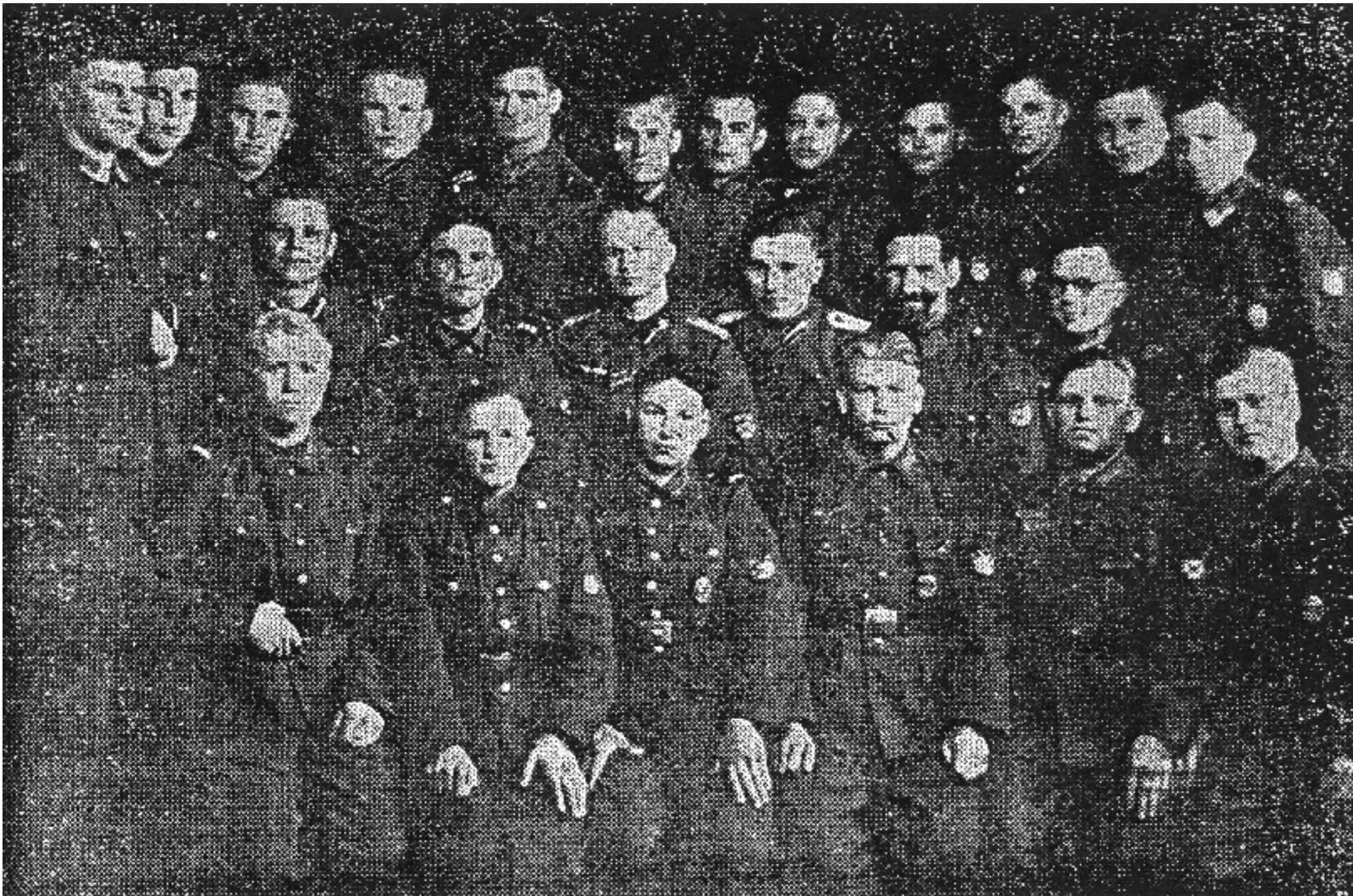
Одно из подразделений I Дивизии Р.О.А.