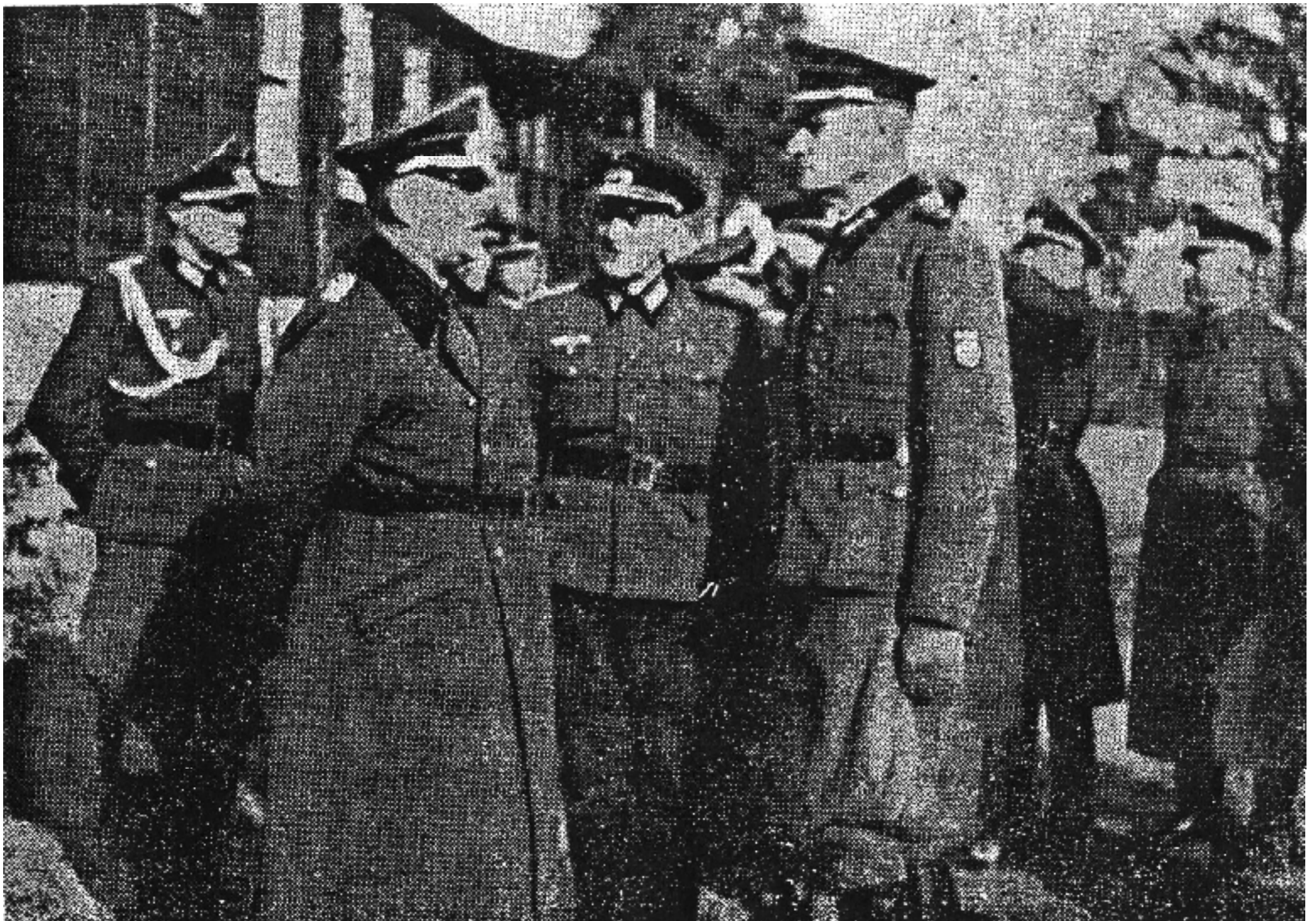
Дабендорф – генерал-майор Трухин.