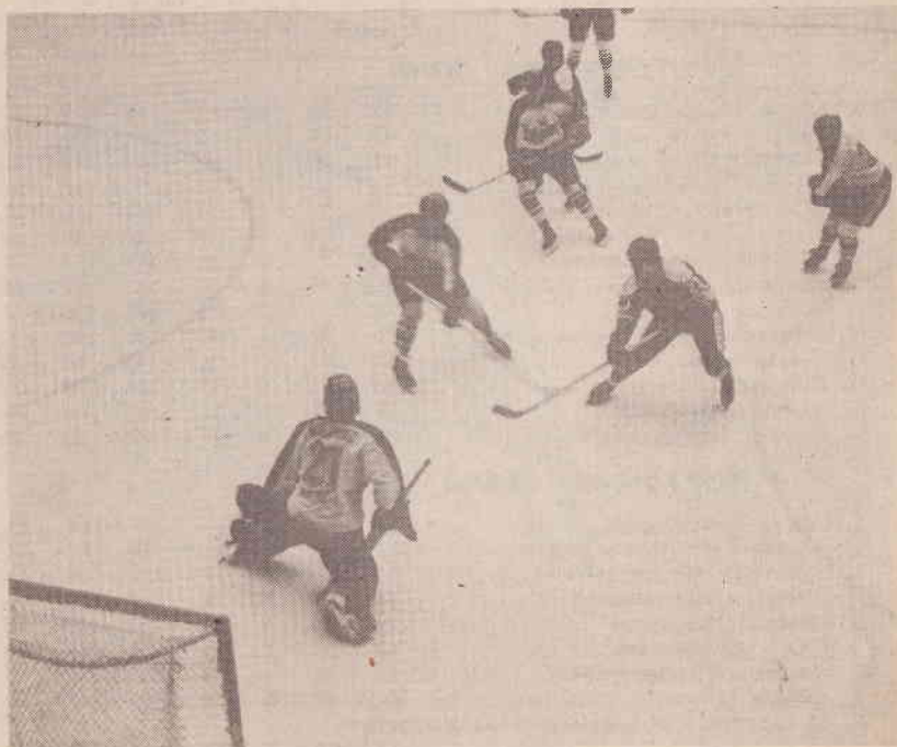
«Торпедо» (Усть-Каменогорск) — СК имени Салавата Юлаева — 8:5. Юлаевцы держат оборону.

Таким образом, в первую лигу вышли «Кристалл» (Электросталь), «Металлург» (Новокузнецк), «Звезда» (Оленегорск).