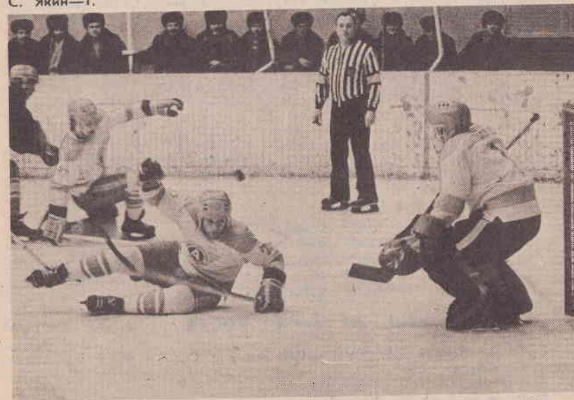
СК имени Салавата Юлаева — «Автомобилист» (Свердловск) — 6:2. Хозяева поля атакуют.