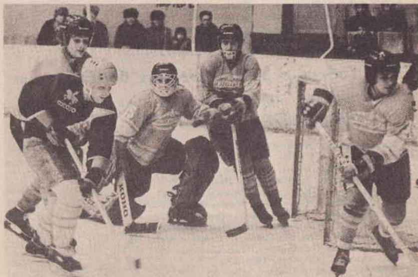
СК имени Салавата Юлаева — «Ижорец» (Ленинград) — 6:3. Ленинградцы обороняются.