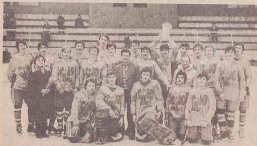
Победители двадцать второго финального турнира первенства СССР по хоккею среди юношей — хоккеисты СК имени Салавата Юлаева.