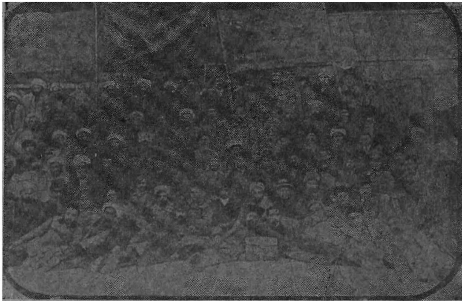
Кокандское автономное правительство.