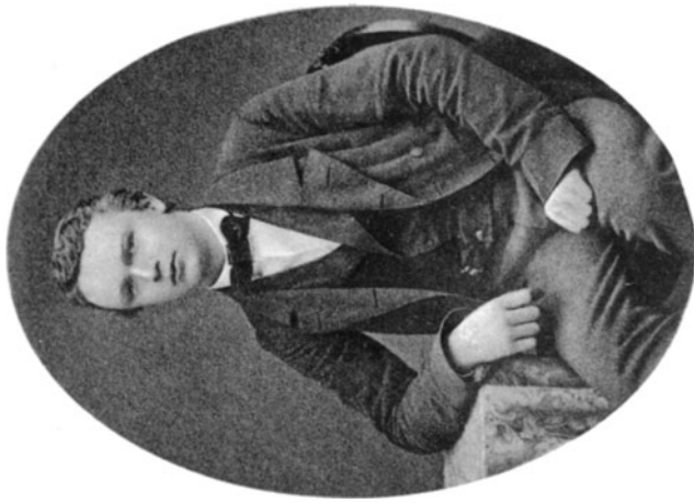
als Student in Heidelberg.