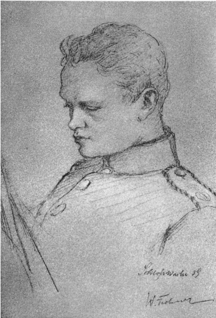
Georg Siemens 1859.