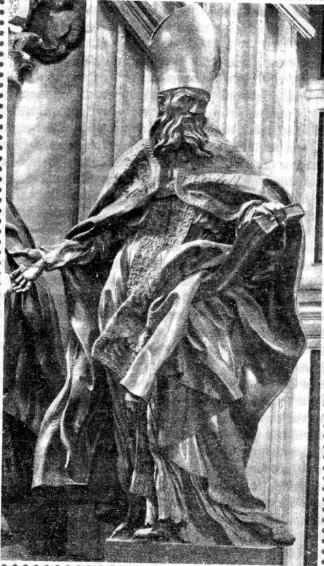
Джанлоренцо Бернини. Святой Августин Аврелий

Величайшим мыслителем ранней Церкви справедливо считают Августина Аврелия (не путать с Августином Кантерберийским, избравшим себе имя в честь знаменитого богослова). Родился он в 354 г. в нумидийском городе Тагаст, его мать Моника была глубоко верующей христианкой, а отец оставался язычником. В 370 г. родители послали сына учиться в Карфаген благодаря щедрости богатого покровителя. В совершенстве овладев латынью, Августин стал учителем грамматики в Тагасте, затем в Карфагене, а в 383 г., в возрасте двадцати девяти лет, решил попытать счастья в Риме. Сложные отношения со студентами (вероятно, отражавшие внутренние противоречия самого педагога) заставили его искать другую работу. Друзья помогли ему устроиться профессором риторики в Милане — тогда почти столице западных земель. Там в 386 г. он пережил духовное возрождение и принял христианство. Несколько месяцев после этого события он никуда не выходил и писал философский трактат, а на Пасху принял крещение. После этого Августин вернулся в Африку, где намеревался продолжить уединенную жизнь, но Валерий, престарелый епископ портового города Гиппона, уговорил его остаться при церкви и рукоположил в пресвитеры. С 391 г. Августин начал учить и проповедовать в качестве помощника Валерия, а в 395 г. стал его преемником. На посту епископа Гиппонского Августин преданно служил африканской церкви, ведя ее через бури разно-