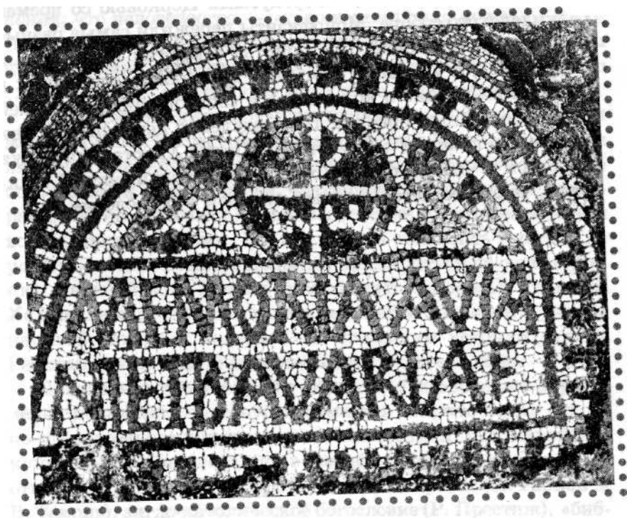
«Мозаика Константина» (V в.). Римская базилика св. Петра, «Биб-»