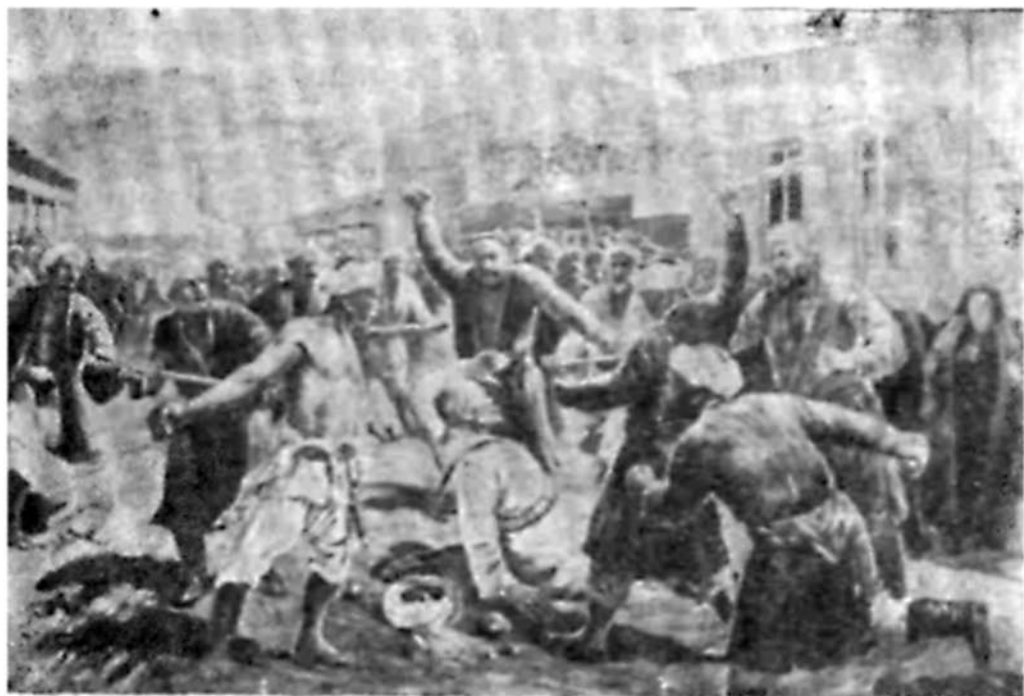
Восстание 1916 г. События в Маргелане. С картины худ. Гаврилова.

енное положение и образовать полевые суды для наказания „преступников“.