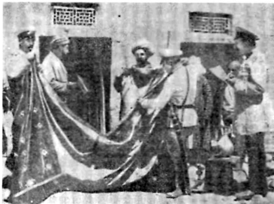
Разорение дехканства. Описание имущества недоимщика царской администрацией.

возрастающих затрат труда и денежных расходов со стороны дехканских хозяйств. С 1900 по 1904 г. расходы каждого хозяйства на выполнение дорожной повинности возросли по отдельным уездам на 5% (Андижанский уезд) — 110% (Маргеланский уезд). Основная тяжесть отбывания дорожной повинности опять-таки ложилась на плечи мелких дехканских хозяйств.