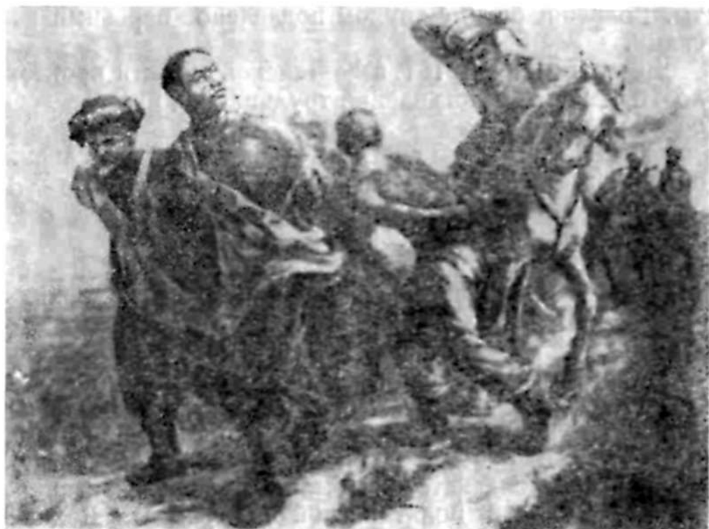
Восстание 1916 г. В тюрьму. С картины худ. Бортникова .

Уроки восстания 1916 г. не пропали даром. В период Великой Октябрьской социалистической революции трудящиеся массы Ферганской области, используя опыт восстания 1916 г., свергли власть своих эксплуататоров и под руководством Коммунистической партии с помощью великого русского народа стали строить новую свободную, счастливую жизнь.