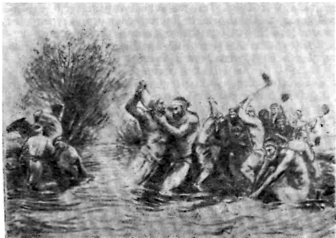
Так было при царизме. Столкновение из-за воды. Рис. худ. В. Рождественского

На виновных налагались денежные взыскания. Если ответчик не мог возместить тотчас нанесенный им ущерб, то совет старшин или вся община тут же вскладчину выплачивала штраф за виновного, но потом с него взимали в несколько раз больше, либо лишали права на водо- и землепользование 1 .