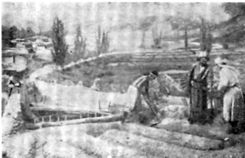
Бай и издольщики.

зовались сравнительно мало. Обычно сроковый наем рабочих производился с марта на два-три и более месяцев или же на весь период от вспашки до уборки урожая. Мардикер работал по 11—12 час. в сутки.