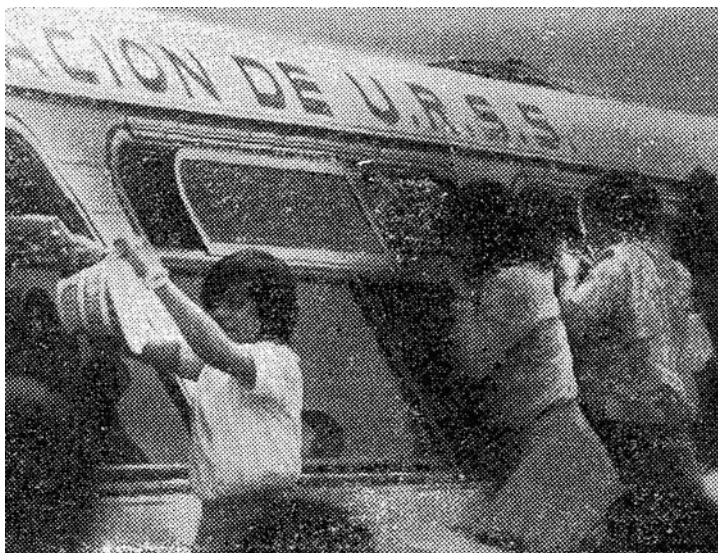
Мексика, год 1970-й. Темпераментные болельщицы «осаждают» автобус советской команды

В результате сборные СССР и Мексики поделили два первых места. Пришлось опять (как в «итальянском» чемпионате Европы) прибегнуть к жребию. На сей раз он, в 1968 г. от нас отвернувшийся, казалось, смилостивился: «дал» советской сборной первое место, право остаться в Мехико и встретиться в четвертьфинале с футболистами Уругвая, занявшими второе место во второй подгруппе. Мексиканцы поехали в Толуку играть с итальянцами. Впрочем, кому повезло, кому нет — сказать трудно.