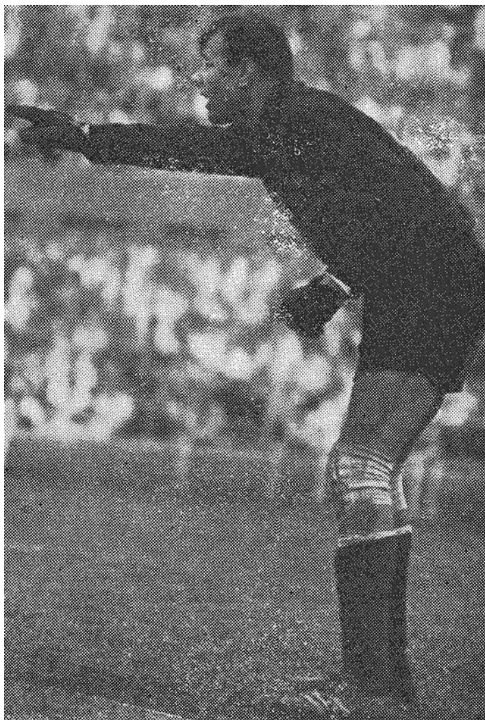
Вратаря сборных СССР, Европы и мира Льва Ивановича Яшина знают в любом уголке земли

команды было не лучшим. Хотя сборная СССР и лидировала вместе с бразильцами (у обеих команд стало по 3 очка), сохраняла шансы на выход в четвертьфинал и сборная Англии, ибо окончательные неудачники — австрийцы—уже ни на какой успех рассчитывать не могли