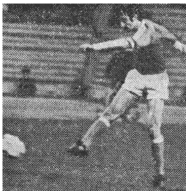
Капитан сборной СССР 80-х годов Александр Чивадзе

страны объединят наилучшие педагогические качества и направят их на достижение главной цели. На первых порах так оно и было: всех объединило чувство ответственности, желание увидеть наш футбол достойно представленным на испанском чемпионате.