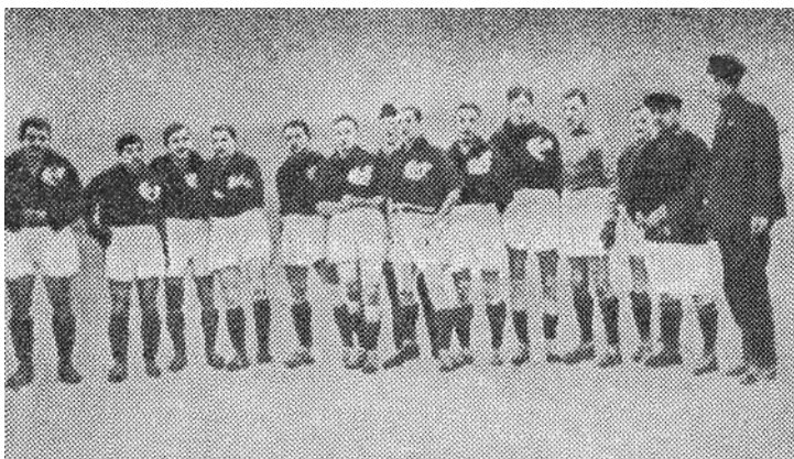
16 ноября 1924 г. Сборная СССР — перед первым выступлением. Форма — по погоде (на поле — снег)

дународном уровне стала Спортивная площадка имени В. В. Воровского. Ранее принадлежавшая Замоскворецкому клубу спорта, эта площадка впоследствии стала стадионом всемирно известного станкостроительного предприятия — завода «Красный пролетарий». Ныне территория бывшего стадиона вблизи Октябрьской площади застроена зданиями, примыкающими к Ленинскому проспекту.