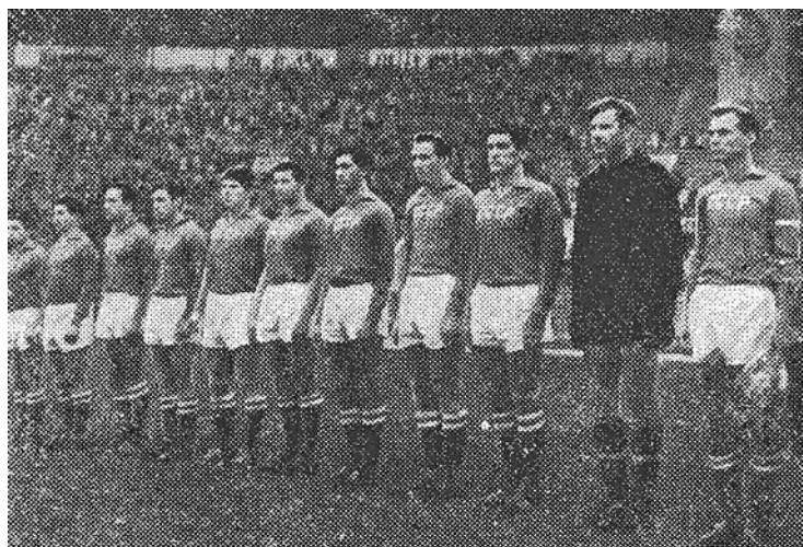
Сборная СССР, год—1963-й. Капитан — Валентин Иванов

1:0. Затем Лобановский забил «фамильный» гол непосредственно с углового. Правда, шведам в конце концов удалось отыграться. Итог — 2:2.