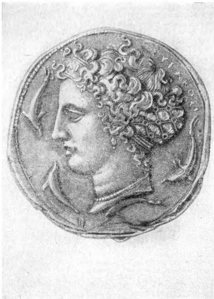
Голова Артемиды (Арктусы). Снимок с декадрахмы. Конец V в. до н. э.