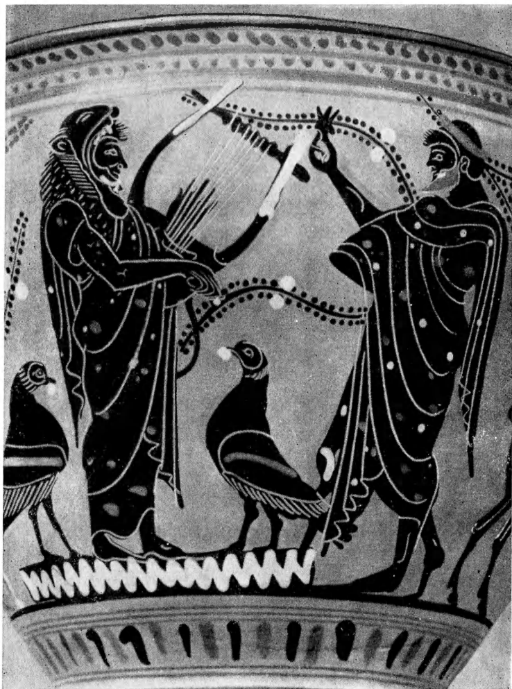
Геракл, играющий на лире.

Рисунок на аттической чернофигурной вазе около 530 г до н.э.