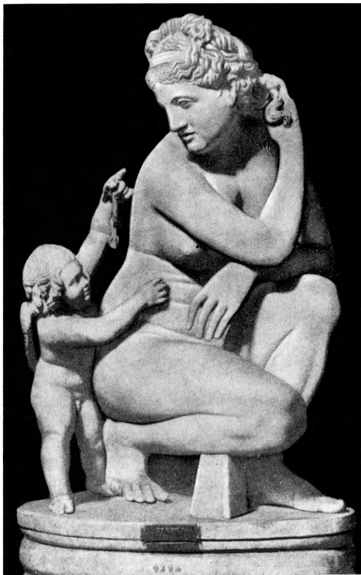
Афродита с Эротом.

Произведение скульптора Дойдалса — III в. до н. э.