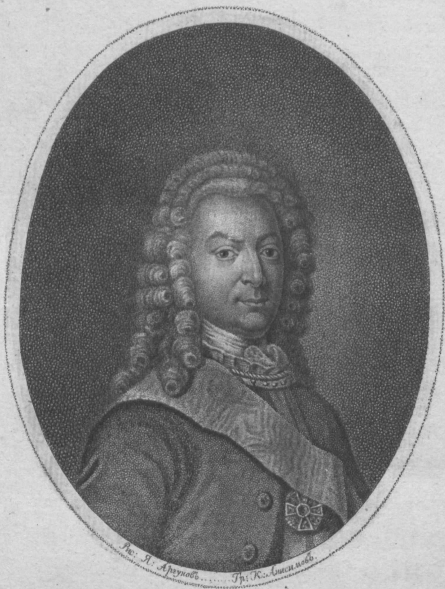
Графъ Григорій Петровичъ Сернышевъ, Генералъ Аншефъ и Сенаторъ.