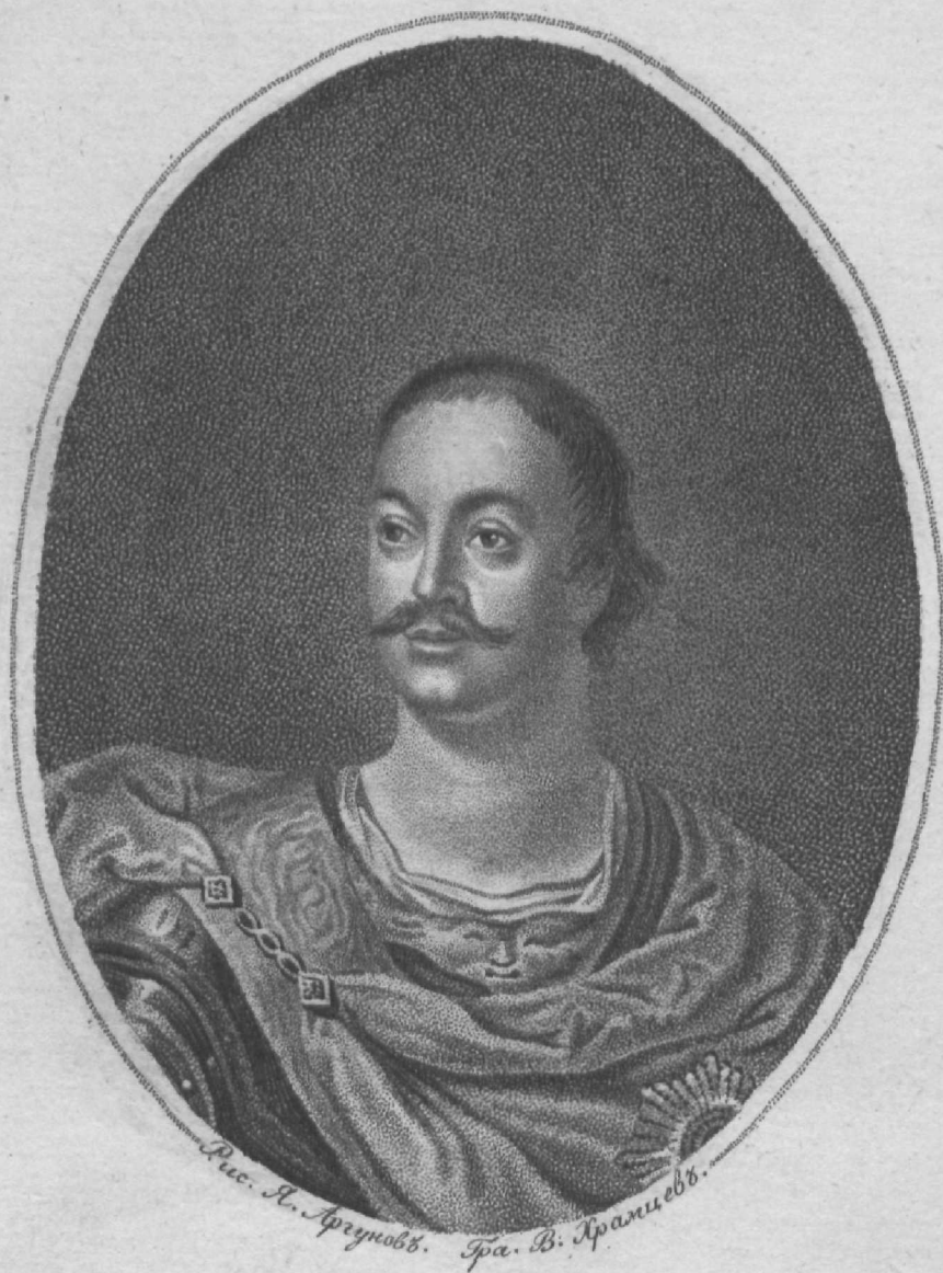
Иванъ Ивановичъ Бутурлинъ, Генералъ Артилеріи и Гвардіи Преображенскаго полку Подполковникъ.