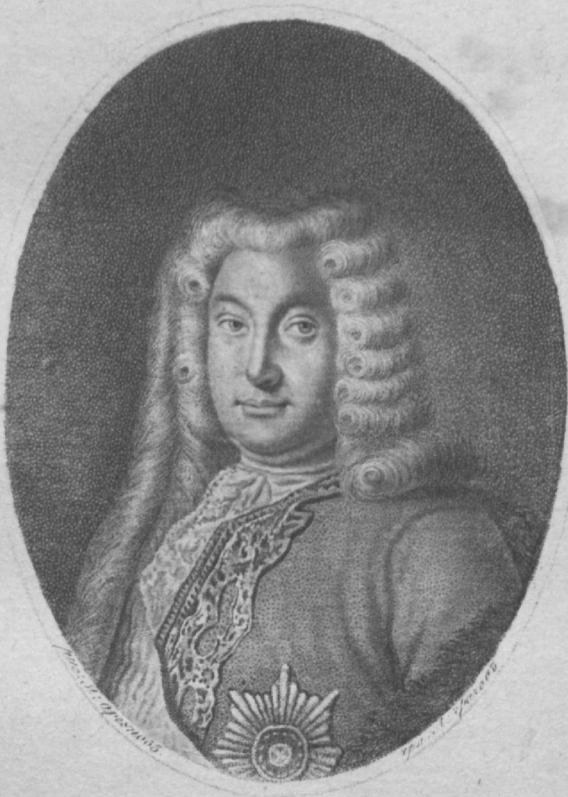
Григорій Андрій Ивановичъ Остерманъ, Ваше - Канцлеръ, а потомъ Генералъ Адмиралъ.