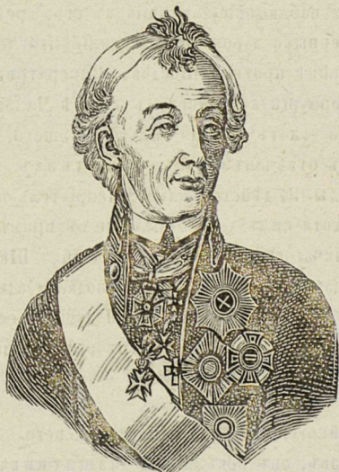
Александръ Васильевичъ Суворовъ.

то проводилъ, по цѣлымъ мѣсяцамъ, вечера въ гостяхъ, забывая по-видимому всѣ дѣла. Въ одно время затмѣвалъ онъ придворныхъ блестящею одеждою, очаровательностью праздниковъ, въ другое—оставался дома, лежа на диванѣ въ халатѣ, басикомъ, и молча игралъ въ шахматы или въ карты; онъ любилъ обѣщать, но не всегда держалъ данное слово. Императрица Екатерина Алексѣевна удостоивала его неограниченною довѣренностью; кромѣ значительныхъ суммъ и подарковъ она пожаловала ему множество деревень.