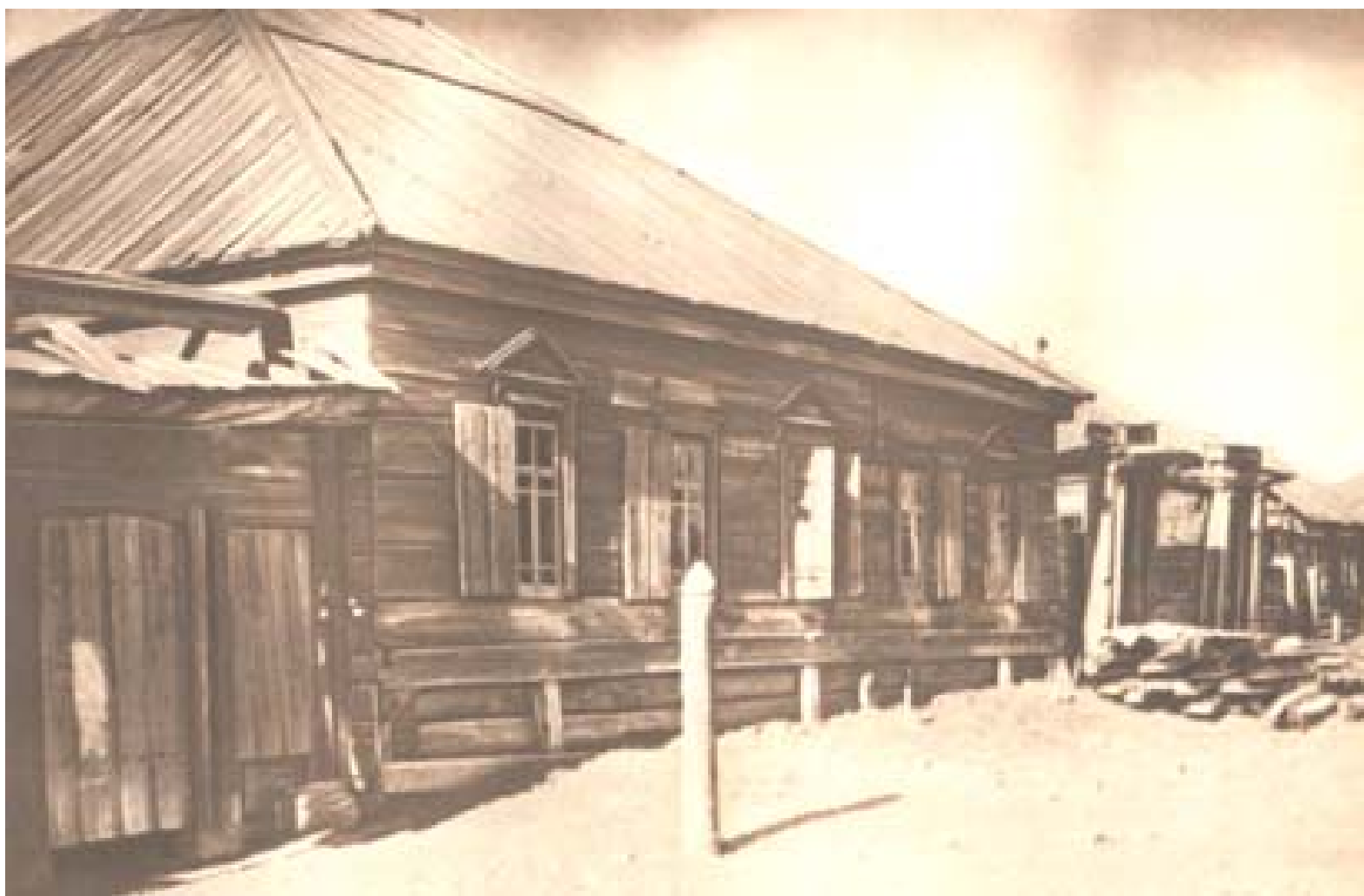
Дом в селе Шушенском, в котором жил во время ссылки В. И. Ленин. Два крайних окна слева — окна комнаты Ленина.