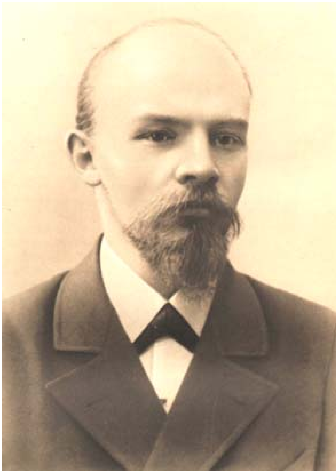
В. И. ЛЕНИН 1897