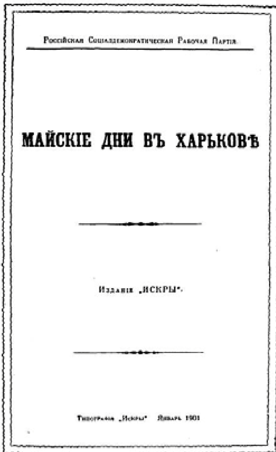
Обложка брошюры «Майские дни в Харькове». — 1901 г.