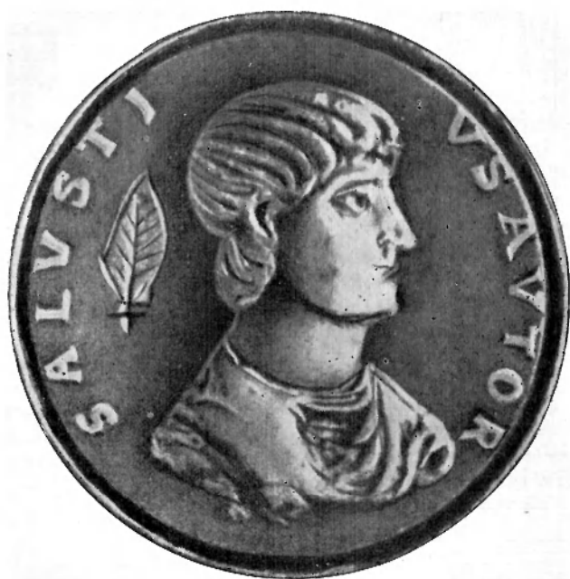
Гай Саллюстий Крисп