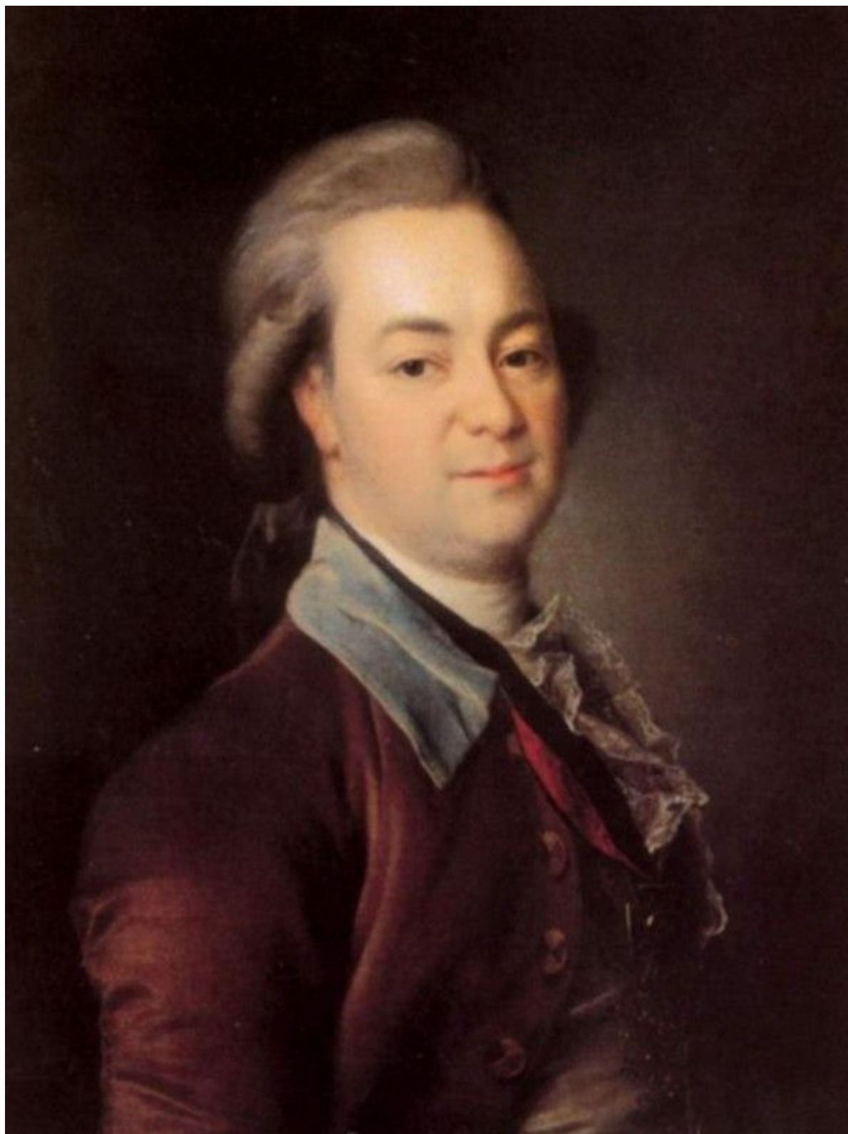
22. Портрет А. В. Храповицкого. 1781. Гос. Русский музей.