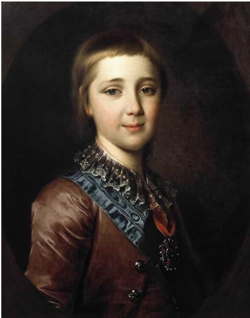
32. Портрет Александра I в детстве. 1787. Гос. Третьяковская галерея.