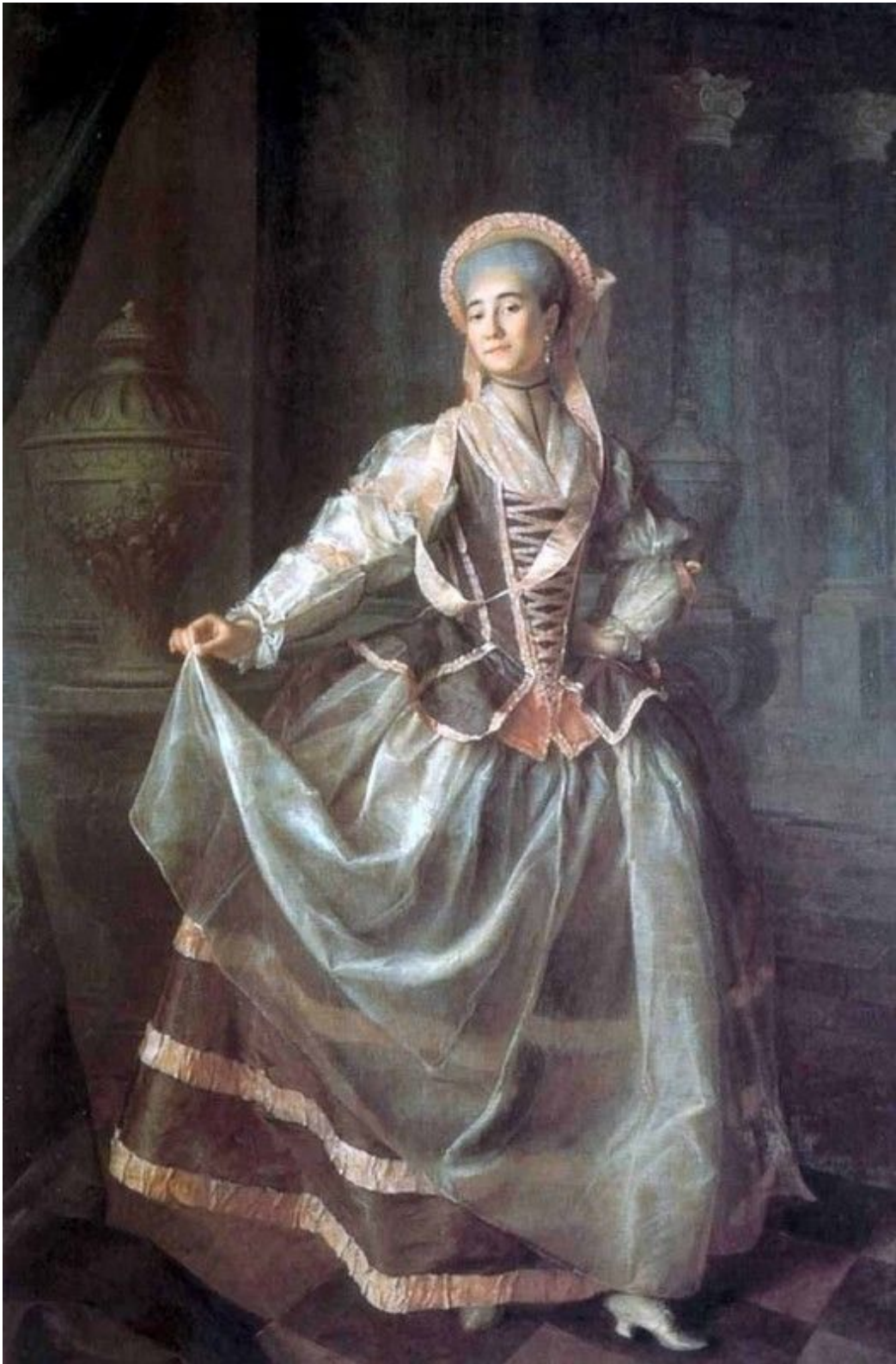
8. Портрет А. П. Левшиной. 1775. Гос. Русский музей.