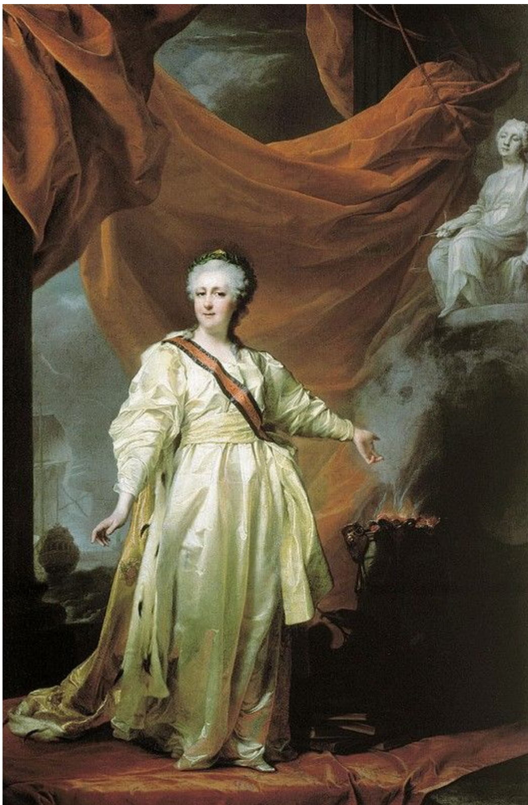
19. Екатерина-Законодательница в храме богини Правосудия. Гос. Третьяковская галерея.