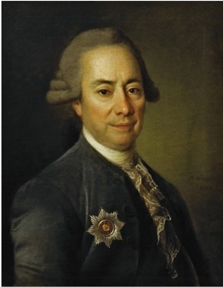
26. Портрет П. В. Бакунина Старшого. 1782. Гос. Третьяковская галерея.