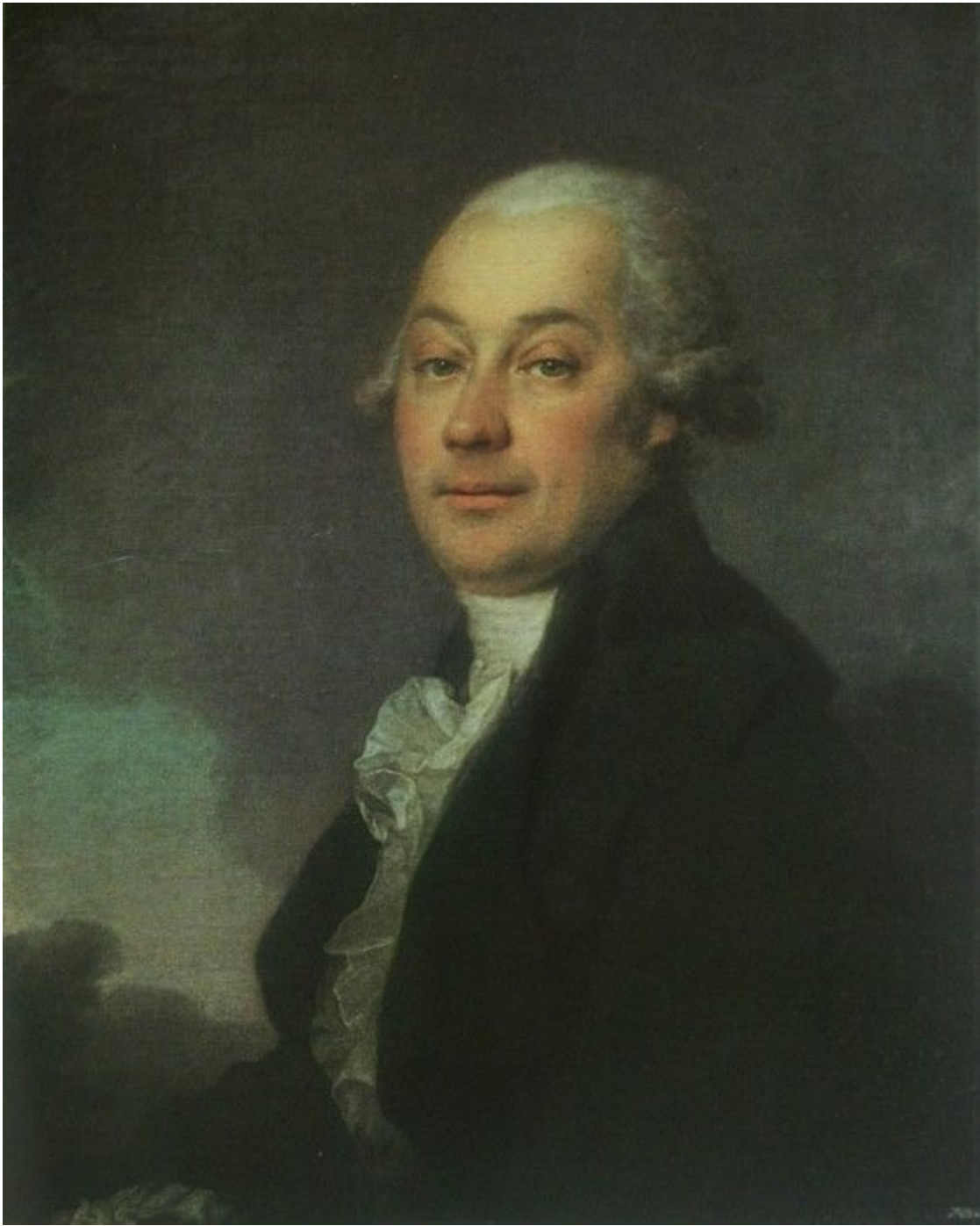
41. Портрет И. Гауфа. 1790-е гг. Гос. Русский музей.