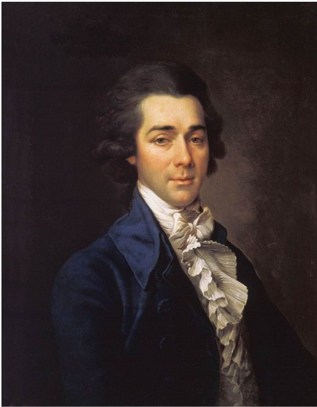
31. Портрет Н. А. Львова. 1789. Гос. Русский музей.