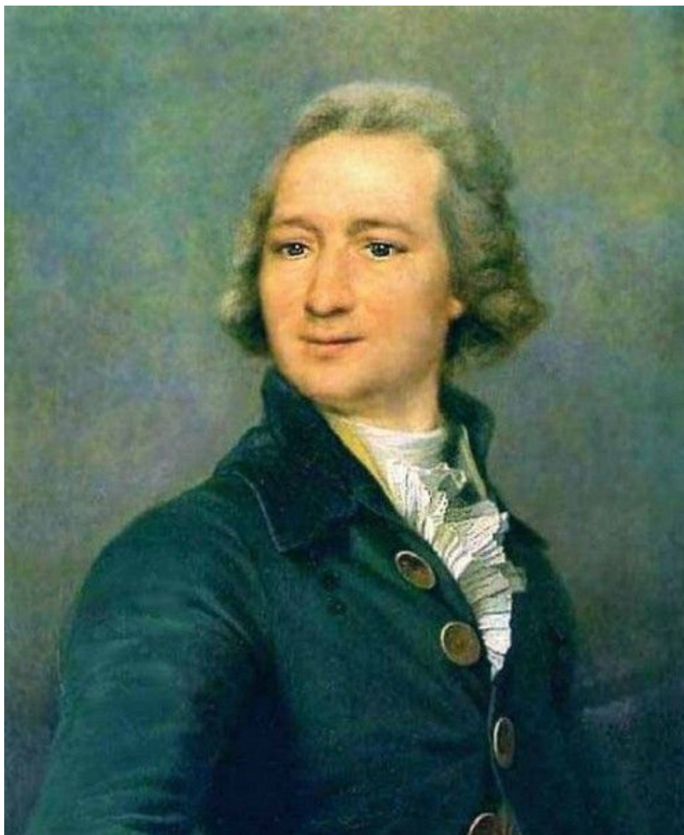
46. Портрет И. И. Дмитриева. Гос. Третьяковская галерея.