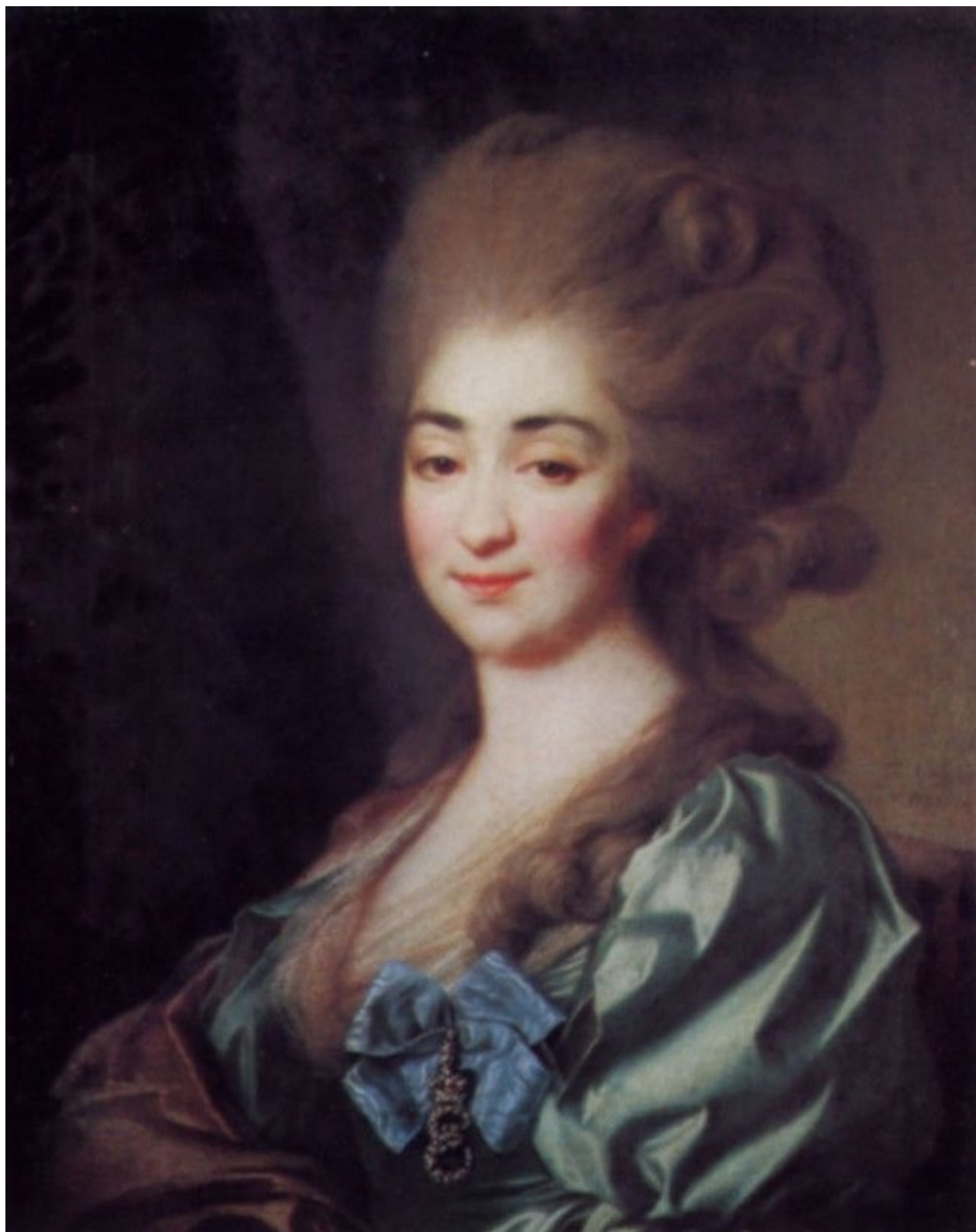
23. Портрет П. Н. Голицыной. 1781. Гос. Русский музей.