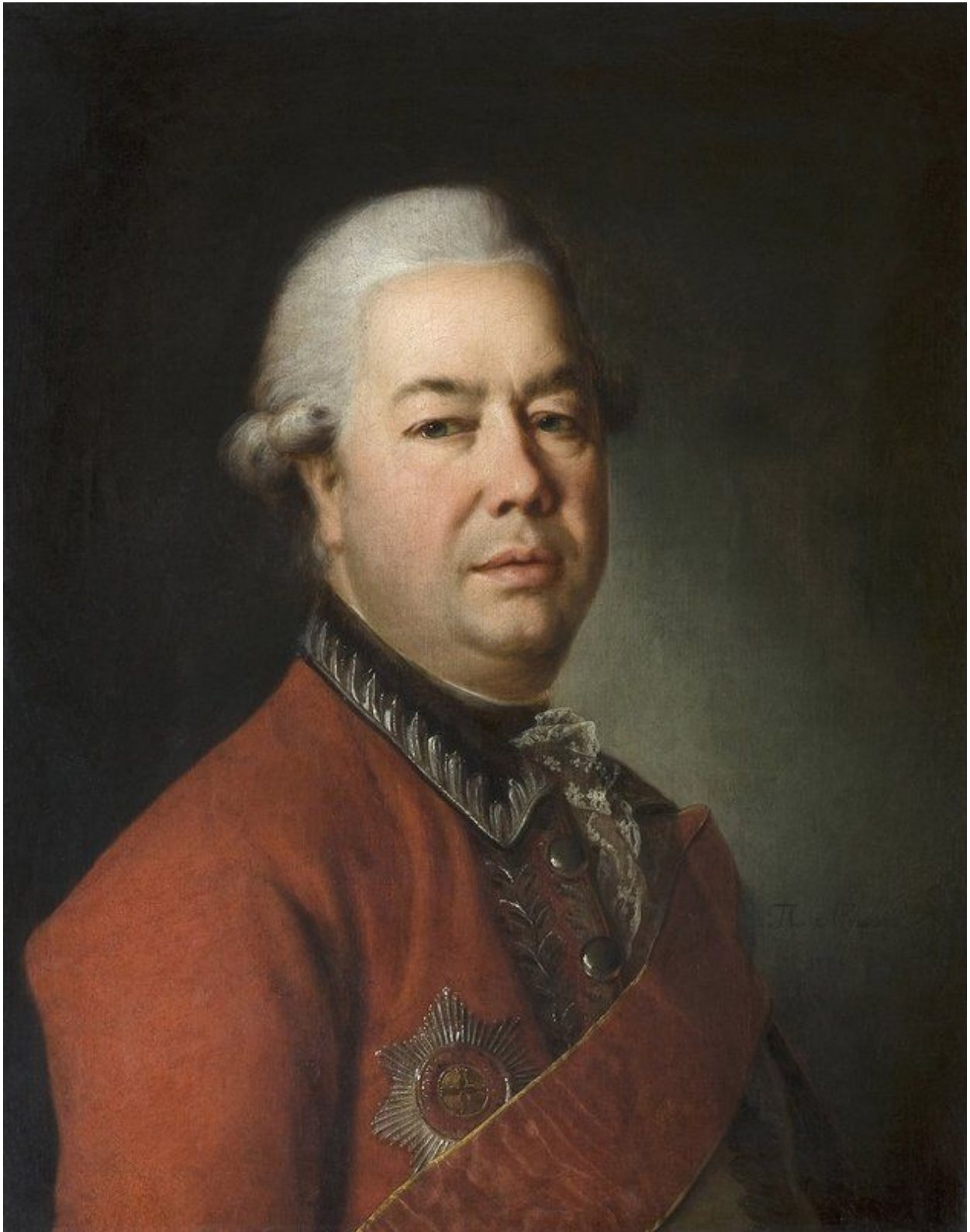
17. Портрет М. И. Мордвинова. 1778. Гос. Третьяковская галерея.