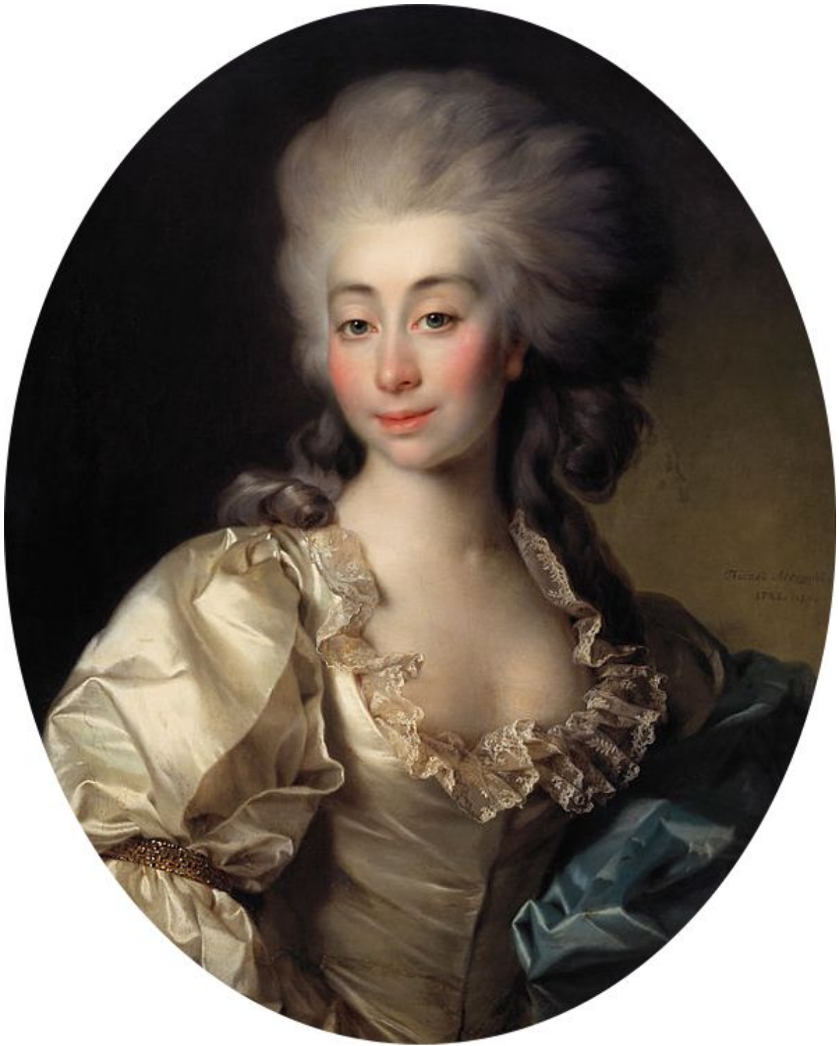
29. Портрет Урсулы Мнишек. 1782. Гос. Третьяковская галерея.