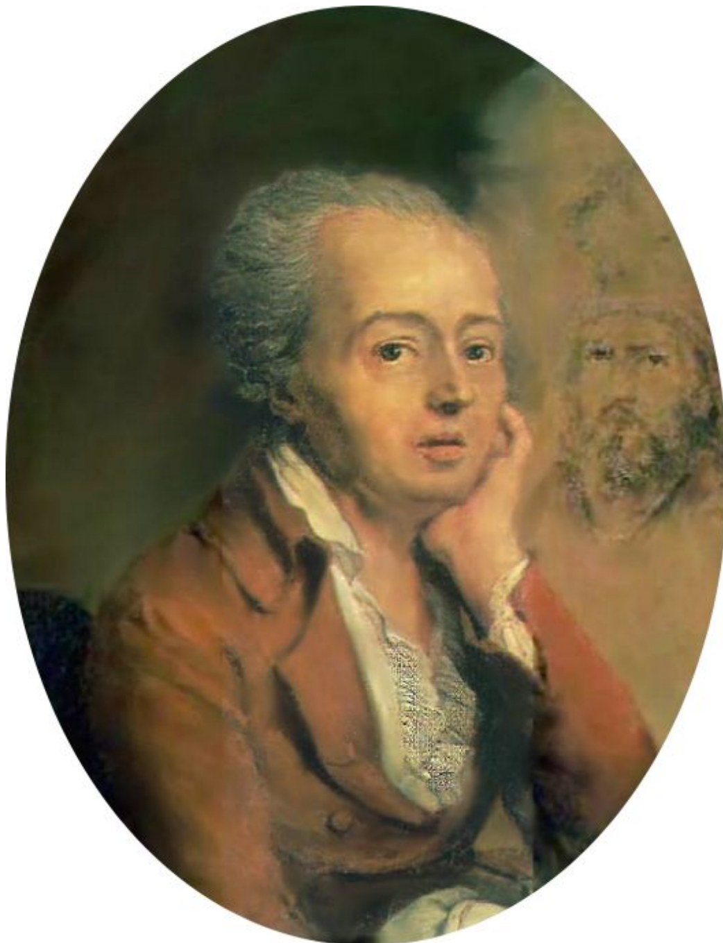
В. Л. Боровиковский. Портрет Д. Г. Левицкого 1

Каждый художник может иметь свою легенду. Каждый большой художник не может не иметь своей легенды. Легенда сплетается из пестрой смеси разрозненных фактов, иногда важных, чаще случайных, из оставшихся невыясненными обстоятельств, бегло просмотренных или несопоставленных друг с другом документов, скороговоркой переданных свидетельств современников, потомков, наследников потомков, из недоделок и недосмотров исследователей и, само собой разумеется, из логических домыслов, возводящих и цементирующих единое целое.