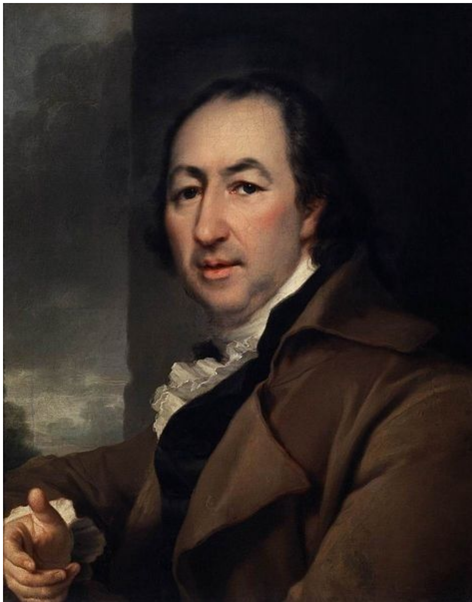
45. Портрет Н. И. Новикова. Гос. Третьяковская галерея.