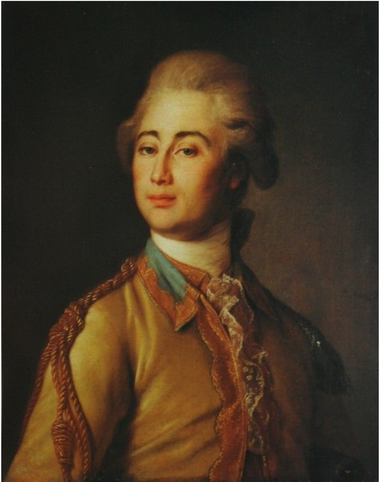
24. Портрет А. Д. Ланского. 1782. Гос. Русский музей.