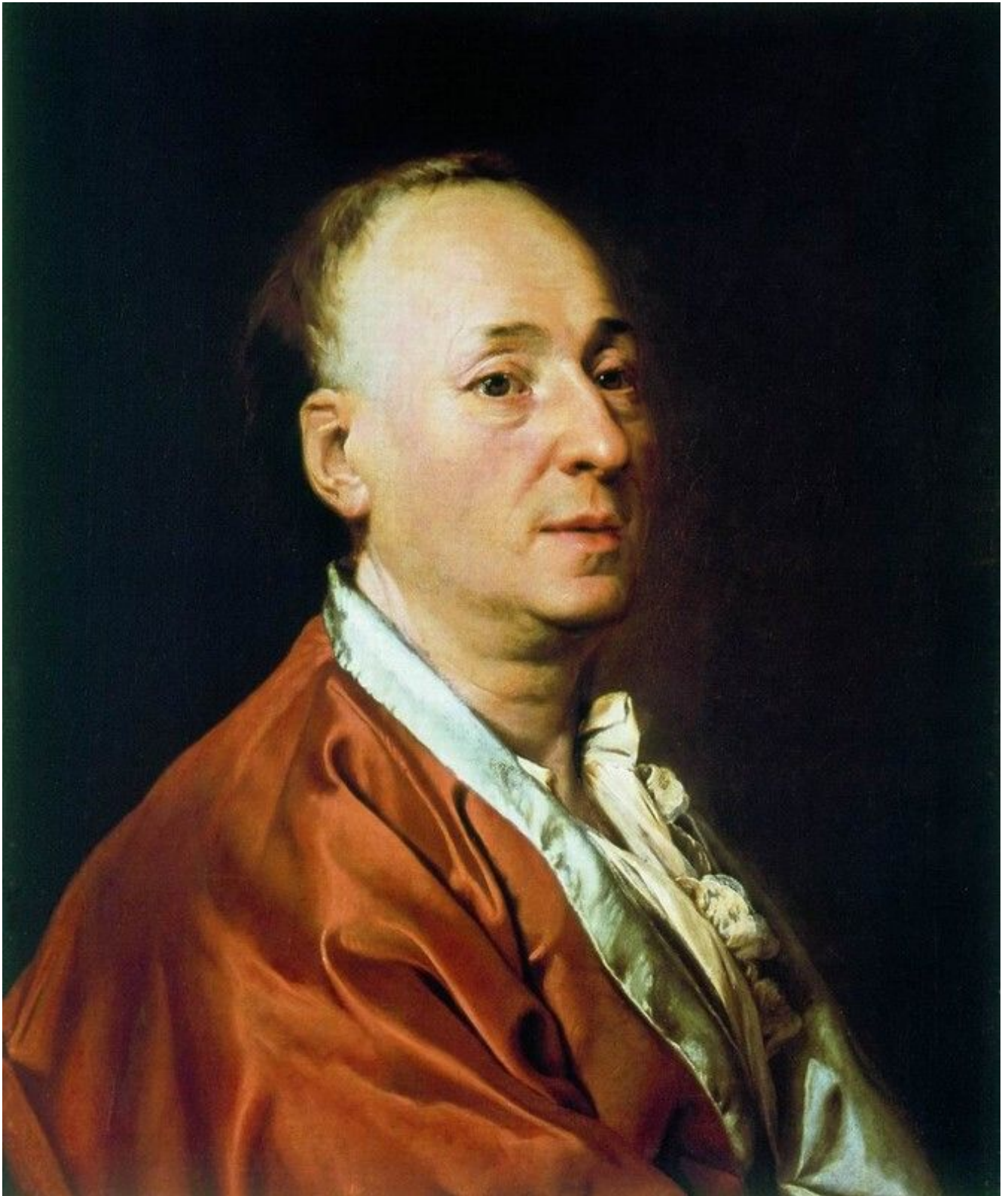
12. Портрет Дени Дидро. Музей в Женеве.