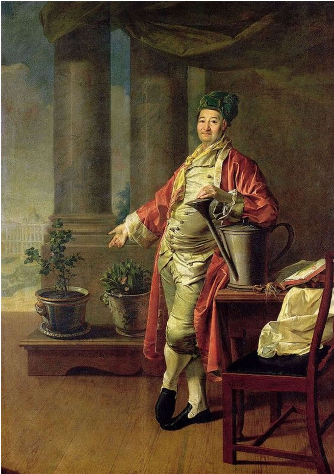
6. Портрет П. А. Демидова. 1773. Гос. Третьяковская галерея.