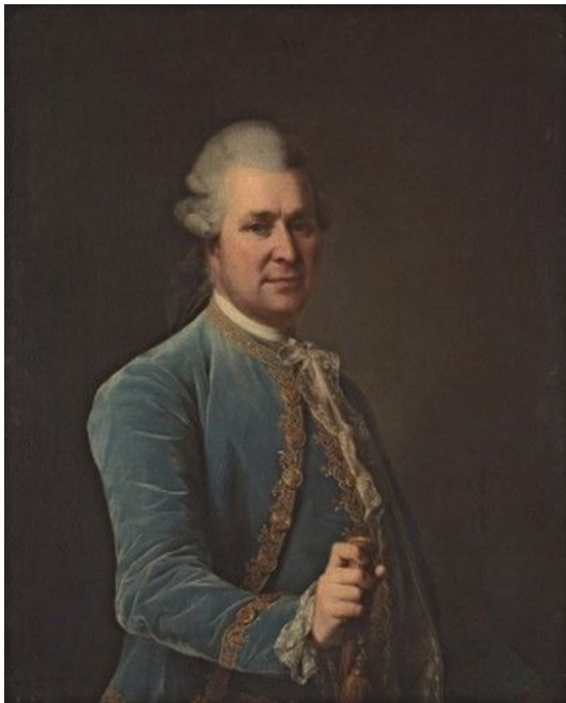
16. Портрет Я. Е. Сиверса. 1779. Гос. Третьяковская галерея.