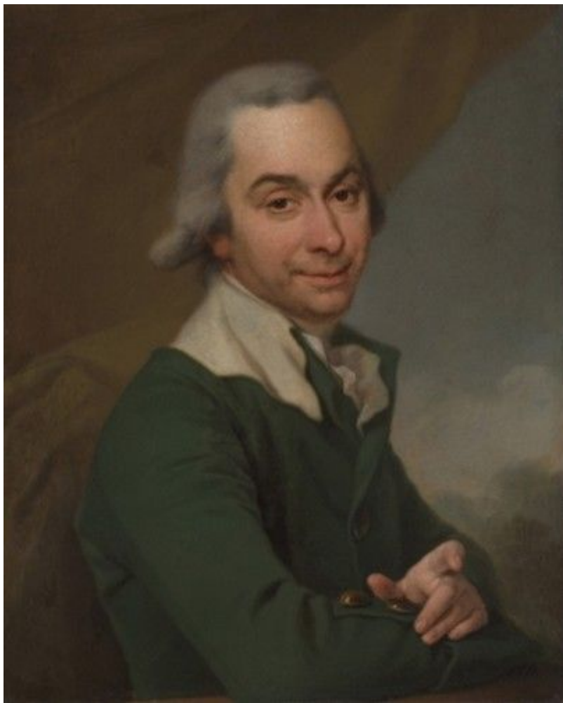
27. Портрет Г. А. Долгорукого. Гос. Третьяковская галерея.