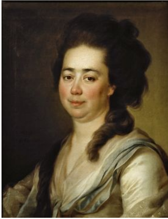
21. Портрет Бакуниной. 1782. Гос. Третьяковская галерея.