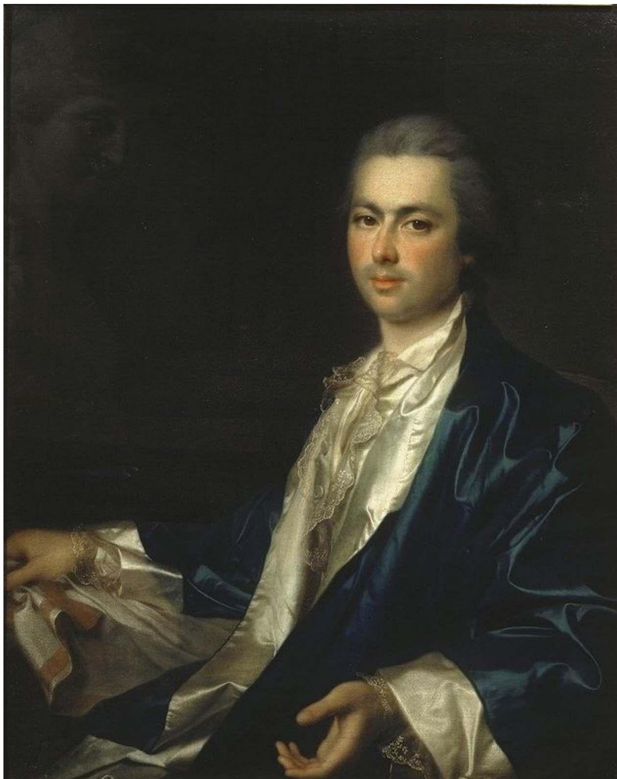
34. Портрет неизвестного из семьи Салтыковых. Гос. Третьяковская галерея.