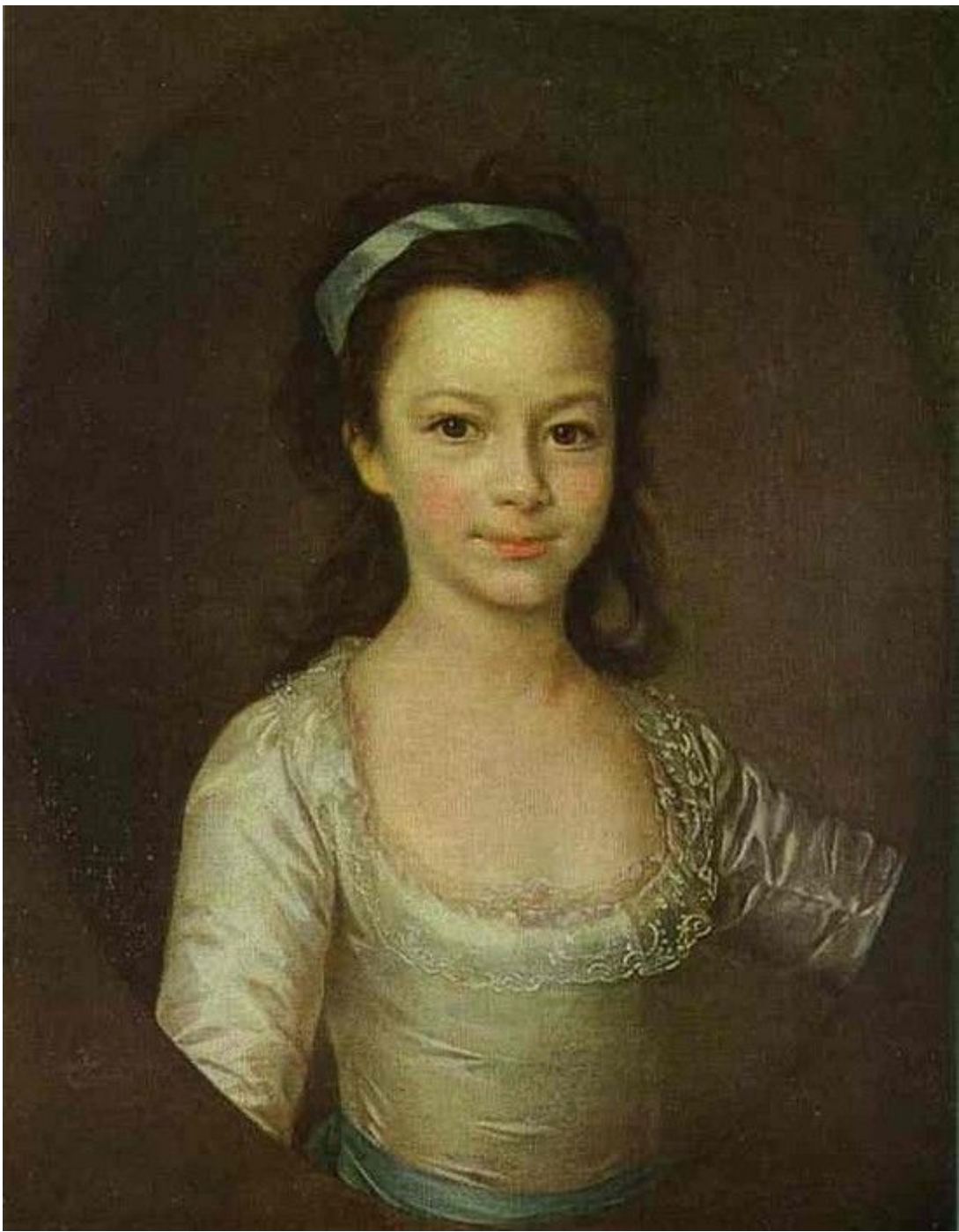
39. Портрет Е. А. Воронцовой. Начало 1790-х гг. Гос. Русский музей.