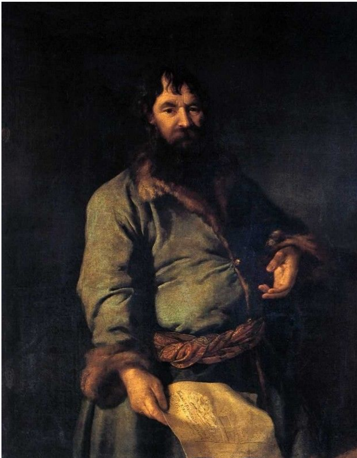
1. Портрет Н. А. Сеземова. 1770. Гос. Третьяковская галерея.