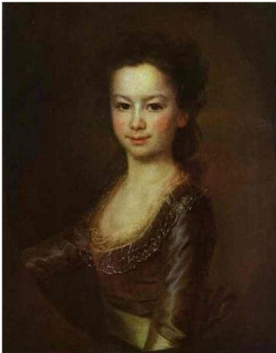
36. Портрет М. А. Воронцовой. Ок. 1790. Гос. Русский музей.