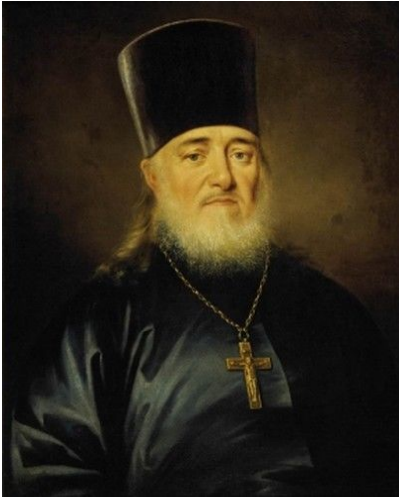
35. Портрет священника. 1812. Гос. Третьяковская галерея.