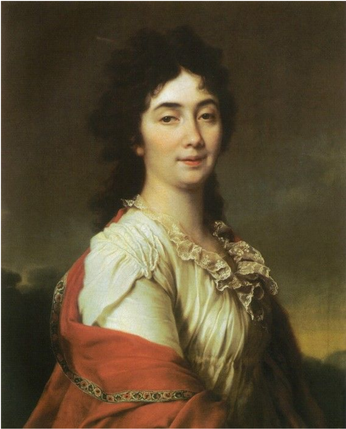
40. Портрет А. С. Протасовой. Начало 1800-х гг. Гос. Русский музей.