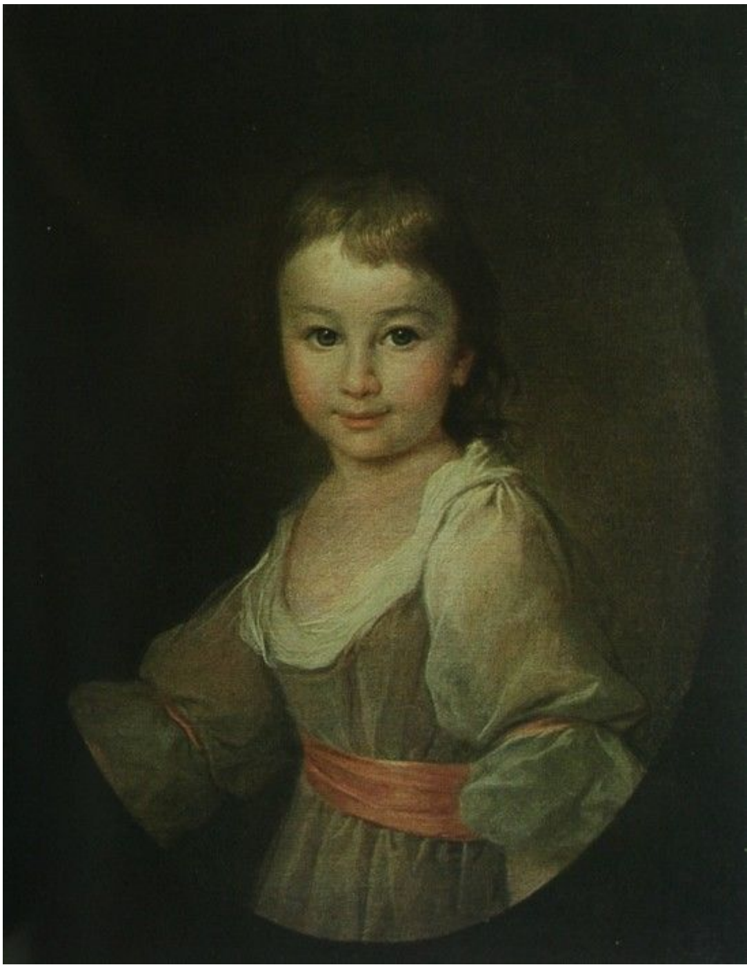
38. Портрет П. А. Воронцовой. Ок. 1790. Гос. Русский музей.