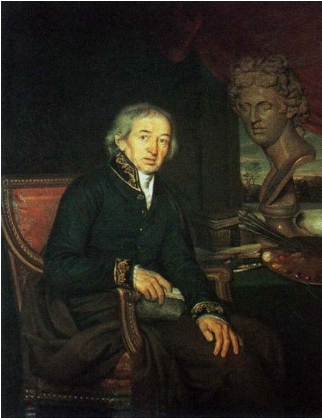
47. И. Е. Яковлев. Портрет Д. Г. Левицкого. Гос. Русский музей.