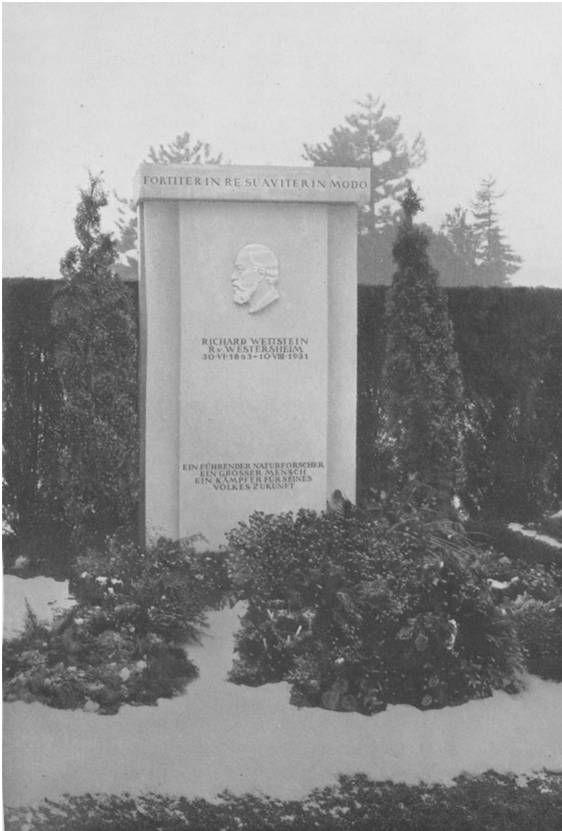
Abb. 2. RICHARD WETTSTEINS Grabstätte auf dem Wiener Zentralfriedhof. Aufgenommen im Januar 1933