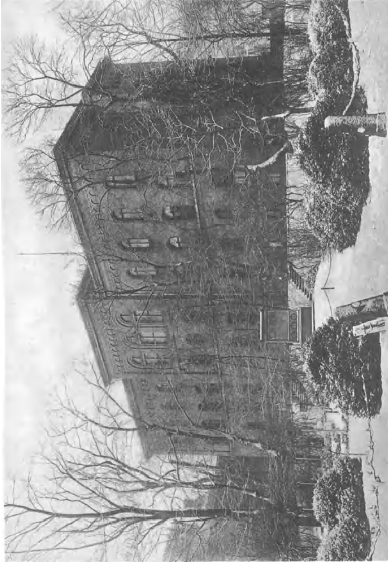
Lichtdruck von A. Frieß, Berlin W 35