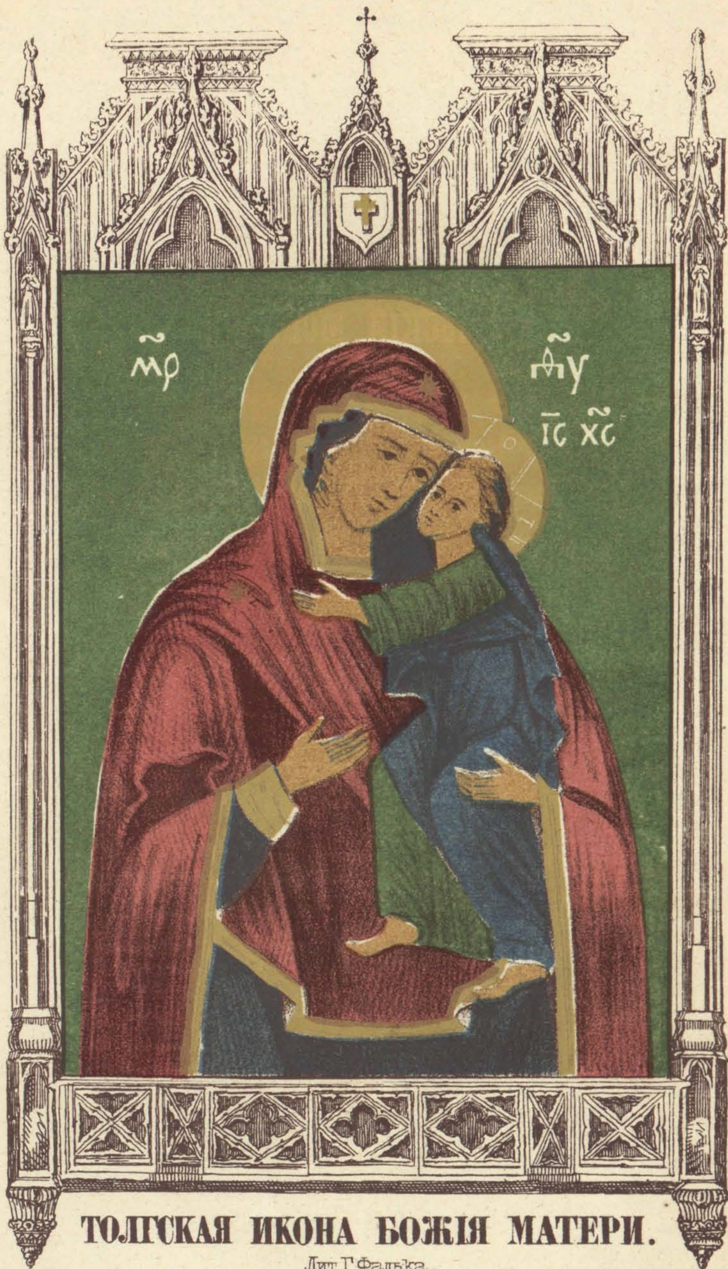
ТОЛДСКАЯ ИКОНА БОЖІЯ МАТЕРИ.