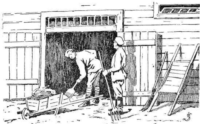
Нужно как можно чаще выметать конюшни и вывозить навоз.

Если войсковой части приходится размещать своих лошадей в обывательской конюшне или сарае, сделанных из плетня, то в зимнее время для большей теплоты хорошо оплести эти помещения другим плетнем и между этими плетнями набить солому или землю. Но никогда нельзя обкладывать такую