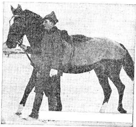
Когда лошадь обсохнет, нужно ее покрыть попоной.

После всякой работы лошадь нужно прежде всего расседлать или отпрячь, и если лошадь