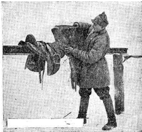
Нужно ежедневно чистить конское снаряжение.

К содержанию лошади относится также содержание конского снаряжения. Все конское снаряжение — седла, хомуты, сбруя, уздечки