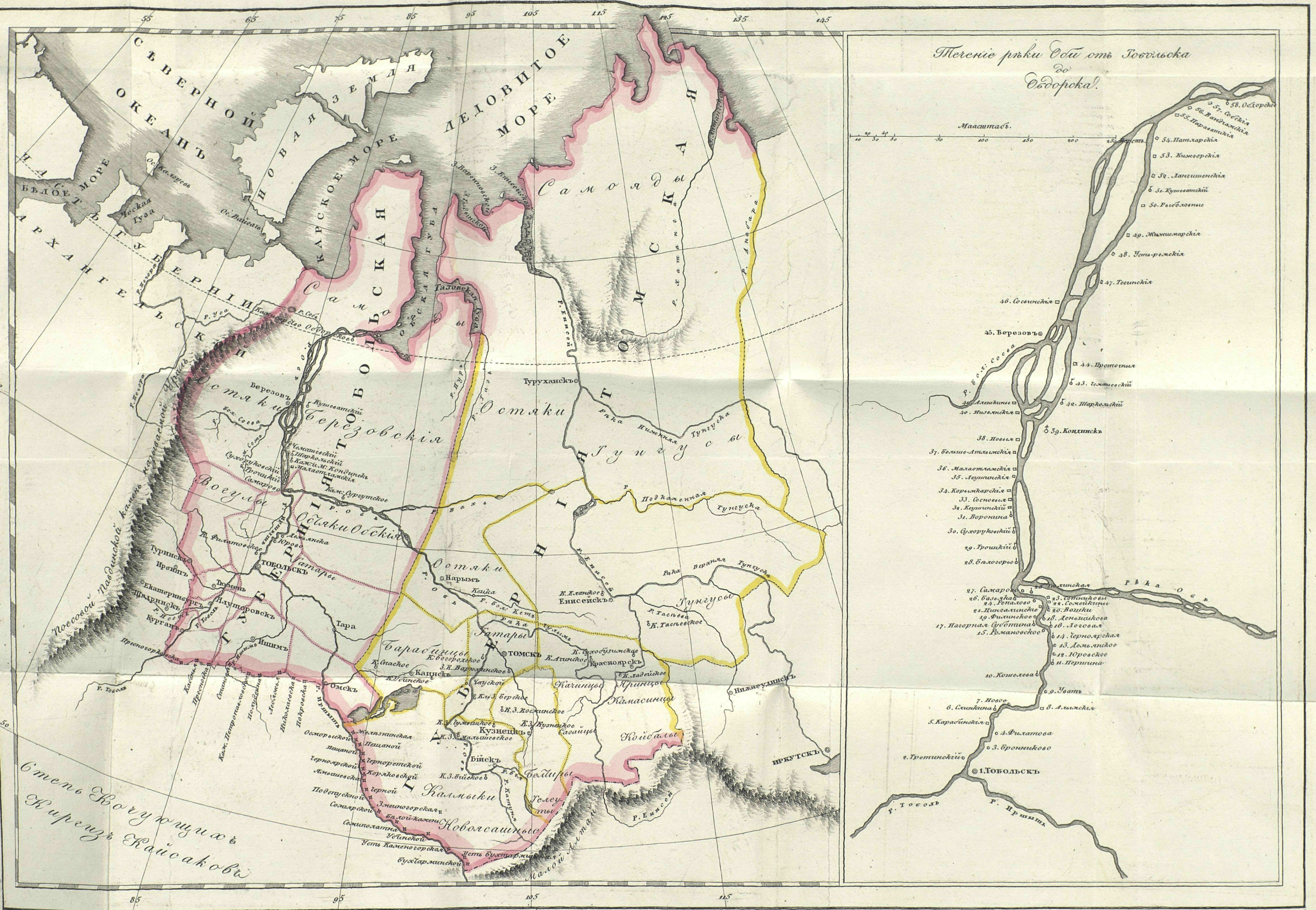
Течение рѣки Оби отъ Тобольска до Обдорска.