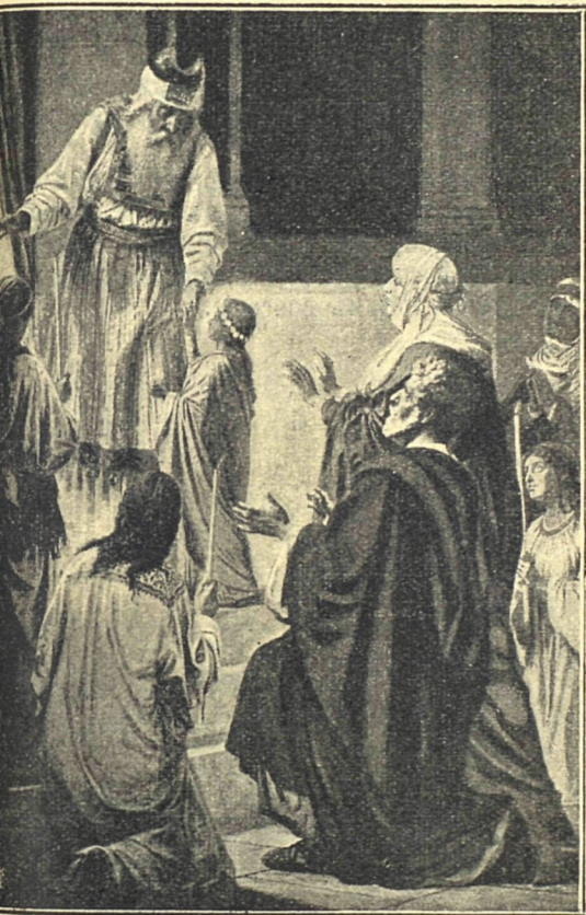
Введение во храм Пресвятой Богородицы.