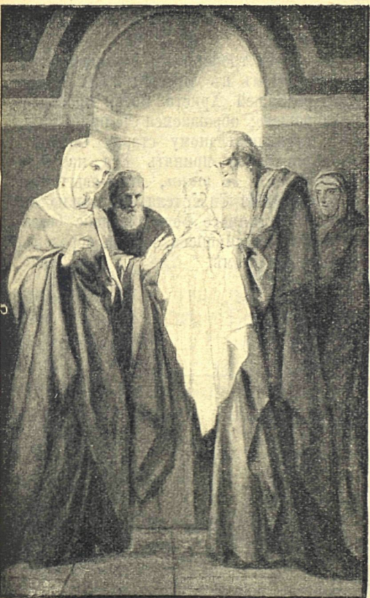
Стрѣтеніе Господа Іисуса Христа.