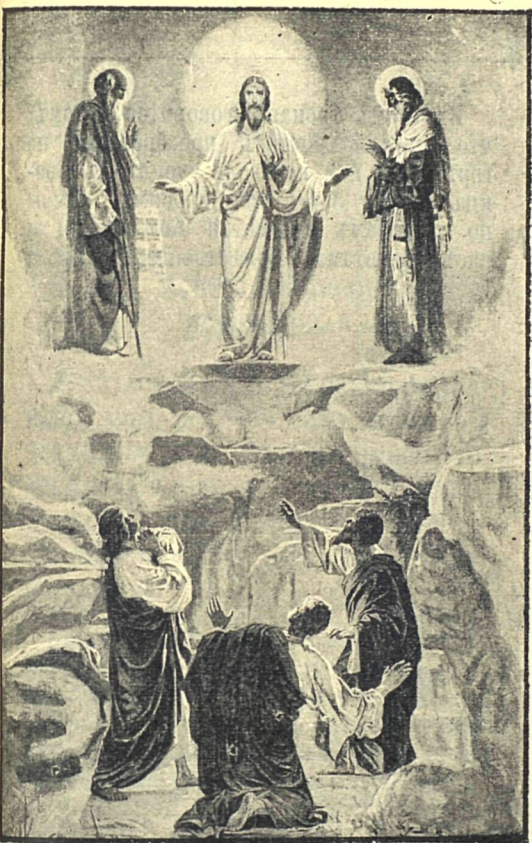
Преображеніе Господа Ісуса Христа.