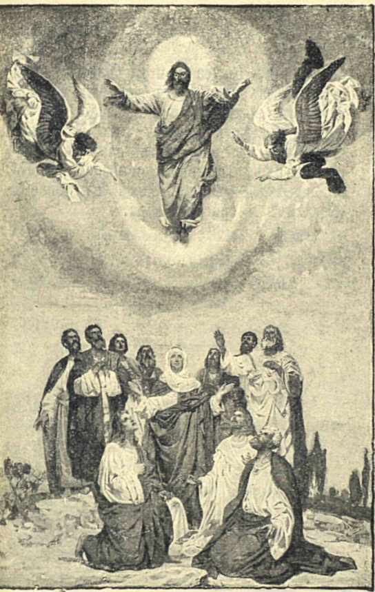
Вознесение Господа Иисуса Христа.