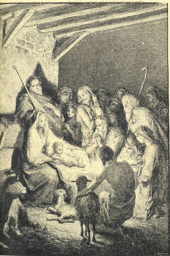
Рождество Господа Иисуса Христа.