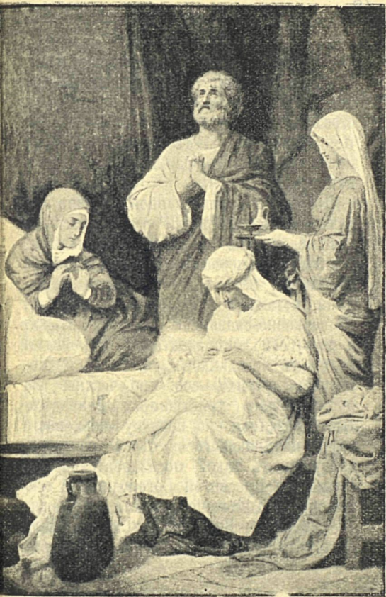
Рождество Пресвятой Богородицы.