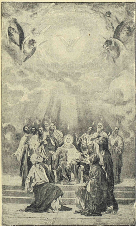
Сошествіе Святаго Духа на апостловъ.