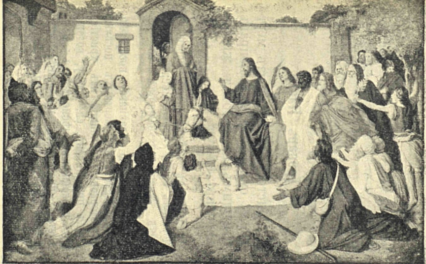
Входъ Господа Иисуса Христа во Иерусалимъ.